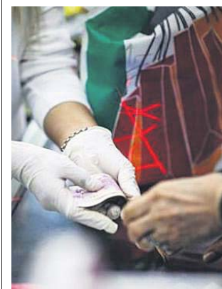
Cajera de un supermercado recibiendo dinero.

Este cambio de tendencia de los consumidores españoles responde a los efectos que la pandemia dejó en el consumidor y en sus hábitos durante el estado de alarma, siendo uno de los más importantes la caída en visitas al establecimiento (-13%) y el aumento del ticket de compra (+20%) en el periodo analizado, según Nielsen. A un ritmo de visitas a la tienda propio de agosto con compras más propias de la Navidad, el consumidor optó por pagar más con tarjeta. ●