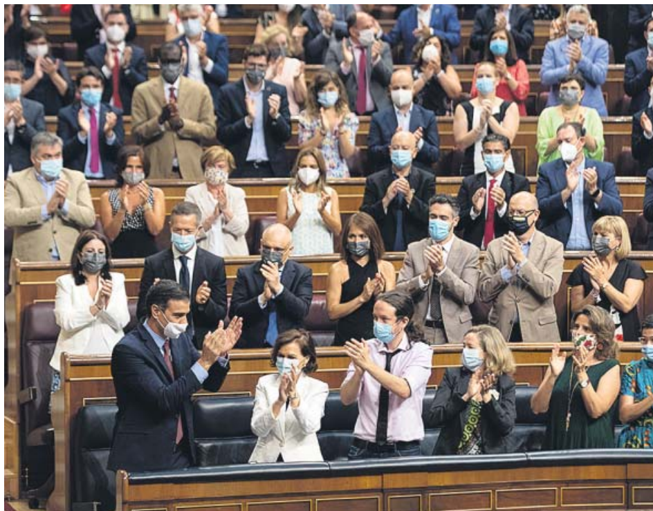
La bancada socialista, sin distancia de seguridad, aplaude de pie a Pedro Sánchez.

ABASCAL la registrará en septiembre y dice que «no queda más remedio», pese a que la suma es inviable EL PRESIDENTE ironiza con que no la presente antes del verano y le reconoce «legitimidad» para dar ese paso GÉNOVA lo considera una «maniobra de distracción» y Cs dice que es «inútil» porque «no va a salir adelante» FONDO Con las ayudas europeas, el siguiente paso del Ejecutivo es la negociación de los Presupuestos