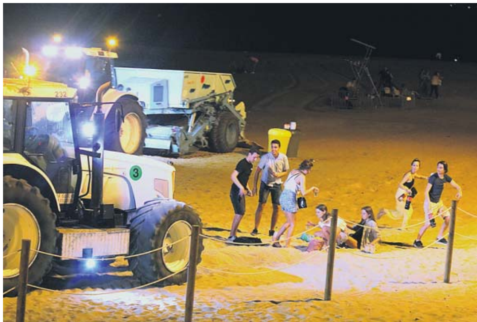
Jóvenes de botellón en la playa de la Barceloneta se levantan al entrar los tractores de limpieza.

en la vía pública (15 euros si se paga por anticipado) y de 600 euros cuando el consumo es en grupo y provoca molestias.