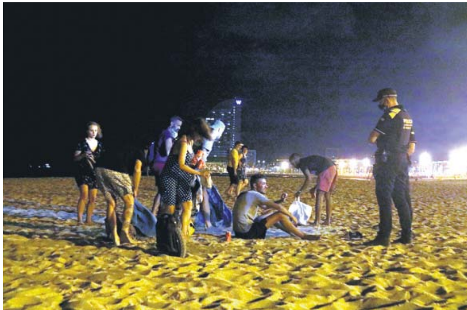
Un grupo de jóvenes de botellón en la playa siendo desalojados el pasado martes.

Barcelona aplicará las multas que marca la ordenanza municipal para estos supuestos, que son de 100 euros por consumo aislado individual