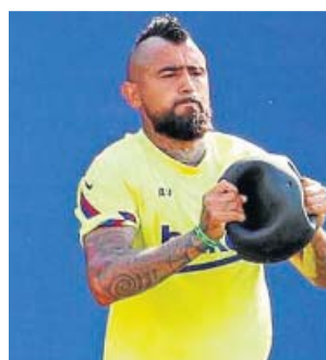
Arturo Vidal durante el entrenamiento de ayer.

«Con Setién hemos trabajado muy poco, fue un cambio muy brusco e intentamos adaptarnos y, cuando se acaba la temporada, escoger bien el futuro del Barça. Se tiene que pensar muy bien en el futuro, porque el Barcelona siempre tiene que estar luchando por todos los títulos, ya que por algo es el mejor equipo del mundo», afirmó el jugador en el canal colombiano WinSportsTV.