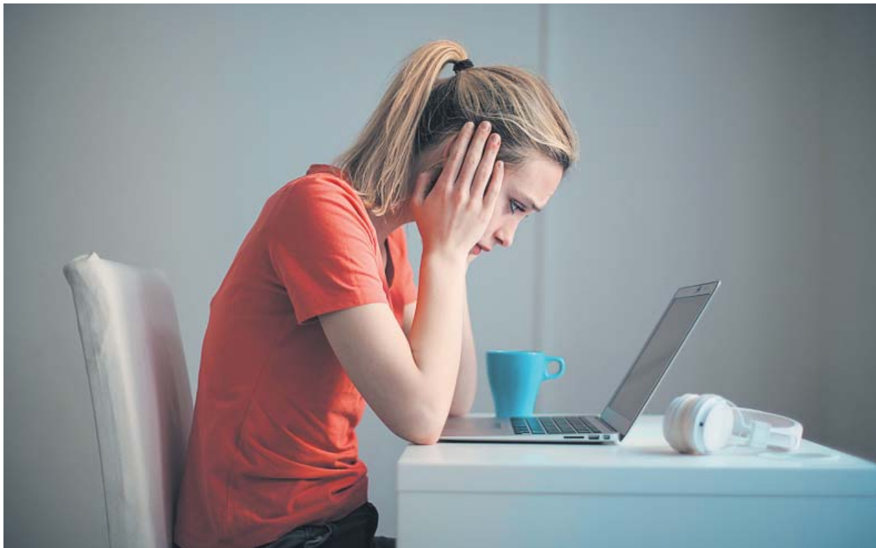
Una mujer, triste y preocupada tras recibir una comunicación a través de su ordenador portátil.