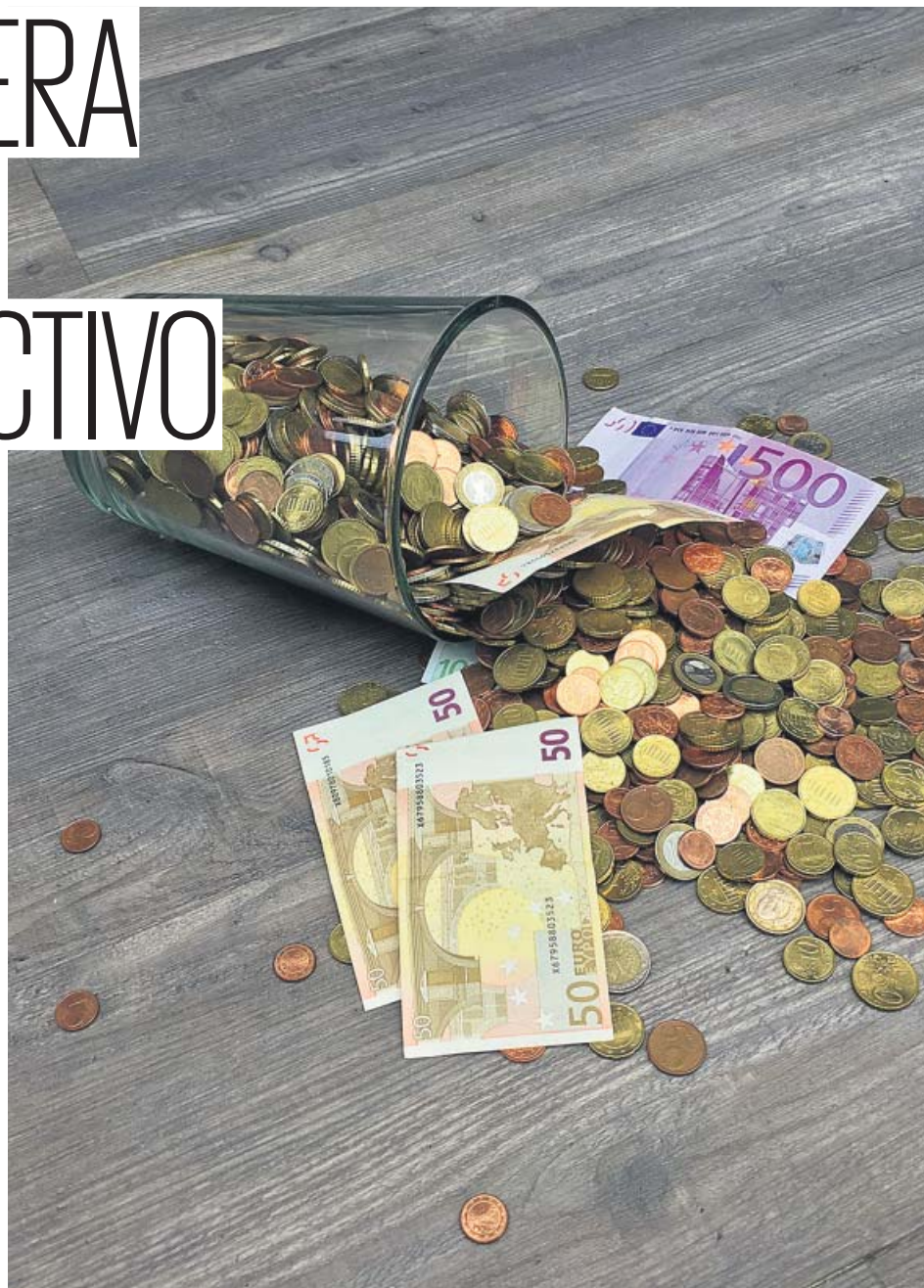
Imagen de euros en monedas y billetes.

Cantalapedra recuerda que «el PSOE recientemente hizo una propuesta en el Congreso de eliminar gradualmente los pagos en efectivo hasta su desaparición total, la cual fue rechazada por el conjunto de los partidos políticos». Al respecto, agrega: «El Banco Central Europeo se ha mostrado en contra de esta