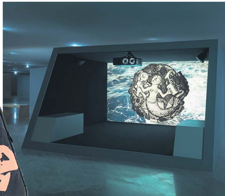
Moving Off the Land II , Museo Nacional Thyssen-Bornemisza.

ferencia a una época pre antropocéntrica, cuando la vida todavía no estaba dividida entre la tierra y el agua.