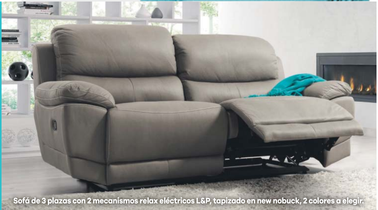
Sofá de 3 plazas con 2 mecanismos relax eléctricos L&P, tapizado en new nobuck, 2 colores a elegir.

Compre ahora y no pague hasta octubre en cómodas cuotas.