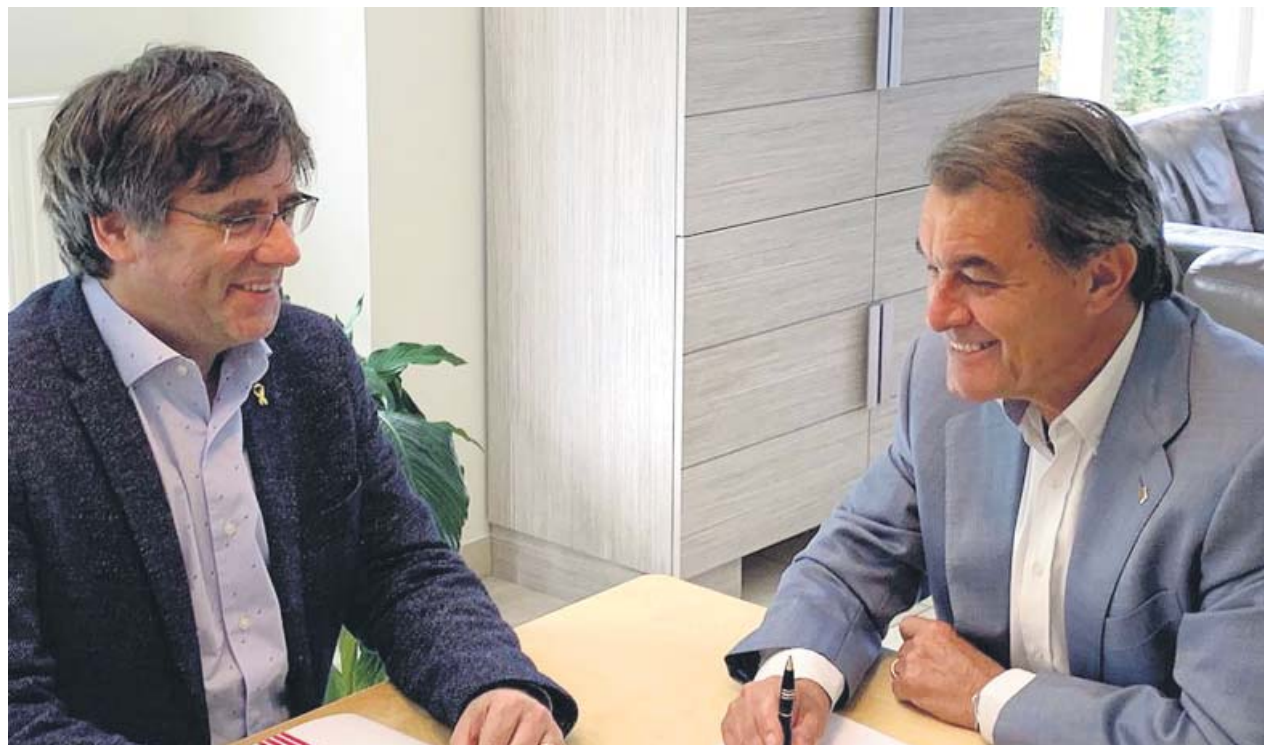
Los expresidentes de la Generalitat Carles Puigdemont y Artur Mas reunidos en Waterloo el 19 de junio de 2019.

EL VICEPRESIDENT Aragonès apuesta por escoger presidente en las urnas si Torra es inhabilitado