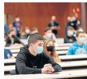
Estudiantes guardando la distancia en un aula.

que es en estos momentos», insistió el ministro. «Hay que estar, sin embargo, preparados para un agravamiento de la epidemia, no podemos volver a estar desprevenidos», avisó. Y eso implica que «hay que es-