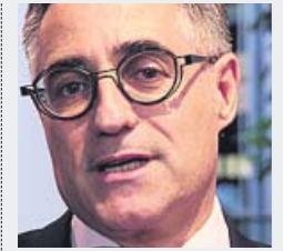
RAMON TREMOSA Conseller de Empresa i Coneixement