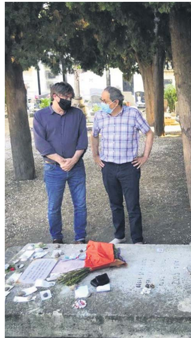
Puigdemont y Torra ante la tumba de Machado el 22 de agosto. AEN

Aseguró asimismo que el presidente Torra no comunicó a Bonvehí la destitución de Àngels Chacón, que se perfila como candidata del Partit Demòcrata para las próximas elecciones catalanas. Sin embargo, Solsona no ha querido especular sobre esta posibilidad alegando que las elecciones aún no están convocadas. ●