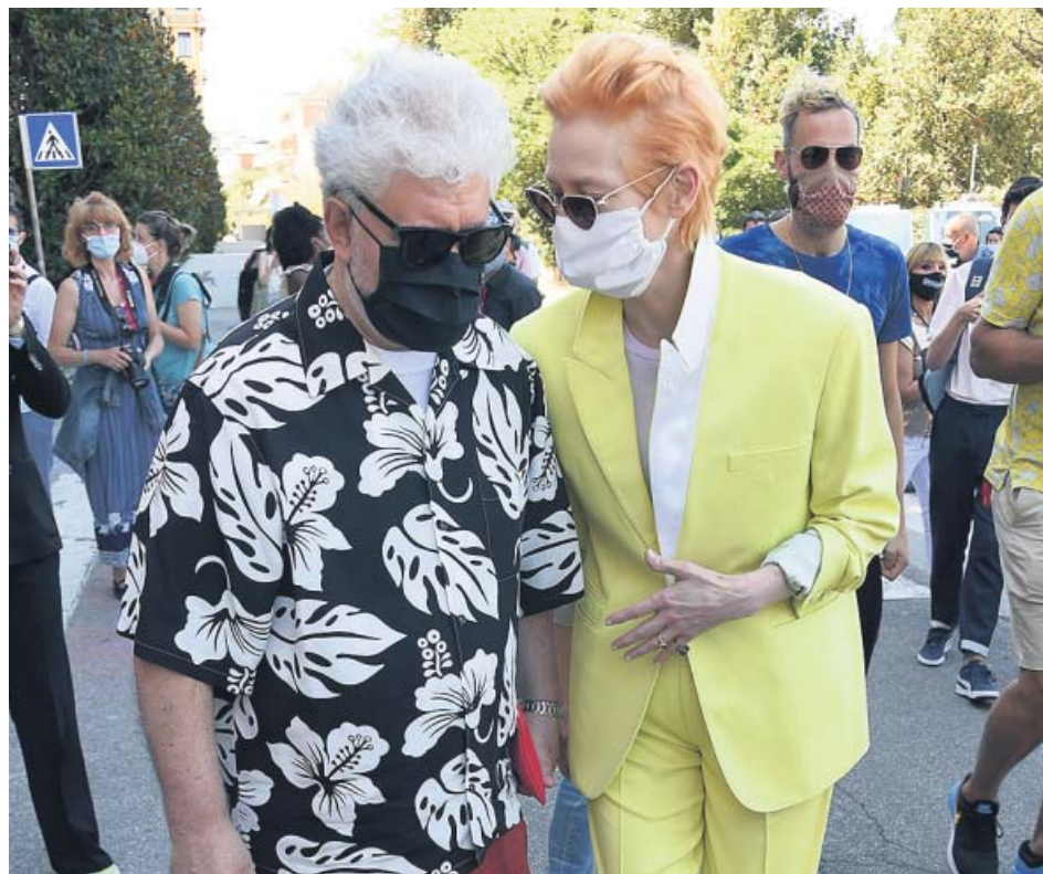
Pedro Almodóvar y Tilda Swinton, juntos en el Festival de Venecia.

La Scala de Milán vuelve a la actividad hoy con la representación de la Misa de Réquiem de Verdi, que será interpretada en la Catedral de Milán en honor a los fallecidos por el coronavirus. La representación se repetirá en Bérgamo y Brescia, otras dos ciudades lombardas muy golpeadas por el virus.