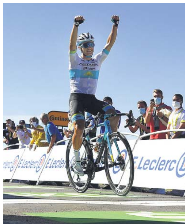
Lutsenko cruza la meta victorioso.

El vencedor cruzó la meta con un tiempo de 4h.32.34, en jornada rápida que se cerró a 42 por hora. Por detrás, exhausto, entró Herrada a 55 segundos, «apenado por haber visto opciones de ganar». El belga Van Avermaet y el americano Powles (EF) a 2.15 minutos y los favoritos con Alaphilippe 1 segundo por delante a 2.52. Apenas hubo movimiento entre los gallos, que siguen de brazos caídos y reservando fuerzas, quizás, para la tercera semana de la carrera: «Hay miedo a precipitarse», dijo Landa. Mucho miedo. ●