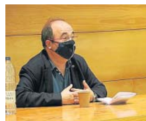
El primer secretario del PSC, Miquel Iceta.

El primer secretario del PSC, Miquel Iceta, afirmó que los cambios no tienen como objetivo mejorar la gestión del ejecutivo catalán, sino que responden a una operación «de estricto in-