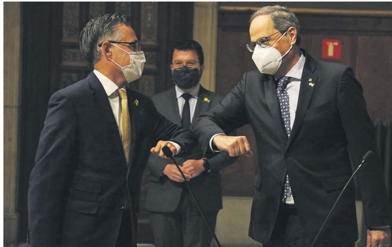
El president Torra choca el codo con el nuevo conseller de Empresa, Ramon Tremosa, ante el vicepresidente Aragonès.

Así, el president fulminó a la consejera de Empresa i Coneixement, Àngels Chacón, al consejero de Interior, Miquel Buch, a la de Cultura, Mariàngela Vilallonga; y anunció la