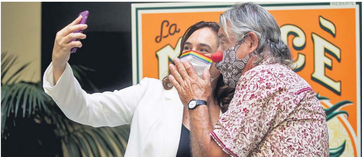
La alcaldesa Colau se hizo ayer un selfie con el payaso Tortell Poltrona durante la presentación del cartel y el pregonero de La Mercè.