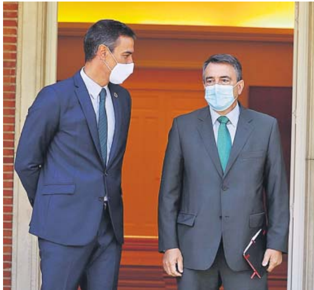
Llegada de Aitor Esteban al Palacio de la Moncloa.

Rufián dio a elegir a Sánchez entre ERC y Cs y el presidente le dijo que no piensa hacerlo en una reunión «cordial» y «constructiva» en la que, lejos de ponerse líneas rojas, el Gobierno tendió puentes con ERC.