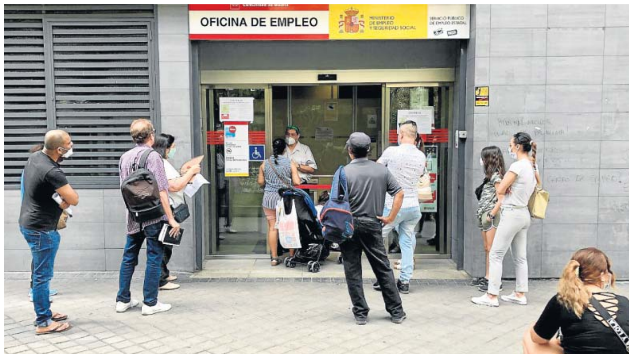
Un grupo de personas esperan su turno en una oficina del SEPE, en Madrid. JORGE PARIS

El Ejecutivo siempre se ha mostrado proclive a extender el alcance temporal de esta medida mientras siga haciendo falta para evitar despidos masivos, aunque revisando el estado del mercado laboral cada pocos meses. Pese a que sindicatos y patronal han