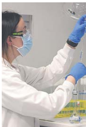
Una investigadora de AstraZeneca.

La Comisión Europea negocia, no obstante, en nombre de