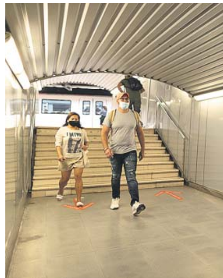
Imágenes del tramo de escaleras que conecta la L1 y la L3 en Plaza Catalunya. MIQUEL TAVERNA

El Departamento de Territorio y Sostenibilidad ha explicado a 20minutos que actualmente «se está redactan-