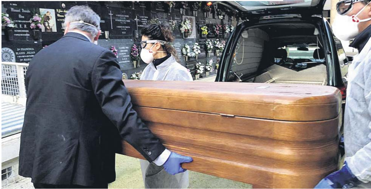
Trabajadores de una funeraria de Zaragoza trasladan el ataúd de un fallecido por coronavirus hasta el nicho. GERVASIO SÁNCHEZ

El gasto medio de un entierro sencillo en España ronda los 3.500 euros, pero si es por Covid-19 supone unos 500 euros más