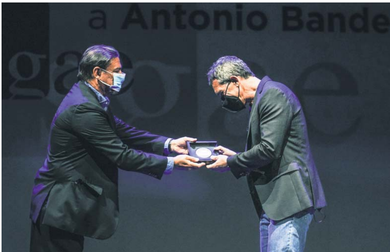
Antonio Banderas recibe la Medalla de Honor de la SGAE en los Premios Max.

El cantante, que ha alcanzado un acuerdo necesario con la madre de sus hijos, está con la lupa repasando las informaciones de unos y otros. No quiere dejar títere con cabeza. ●