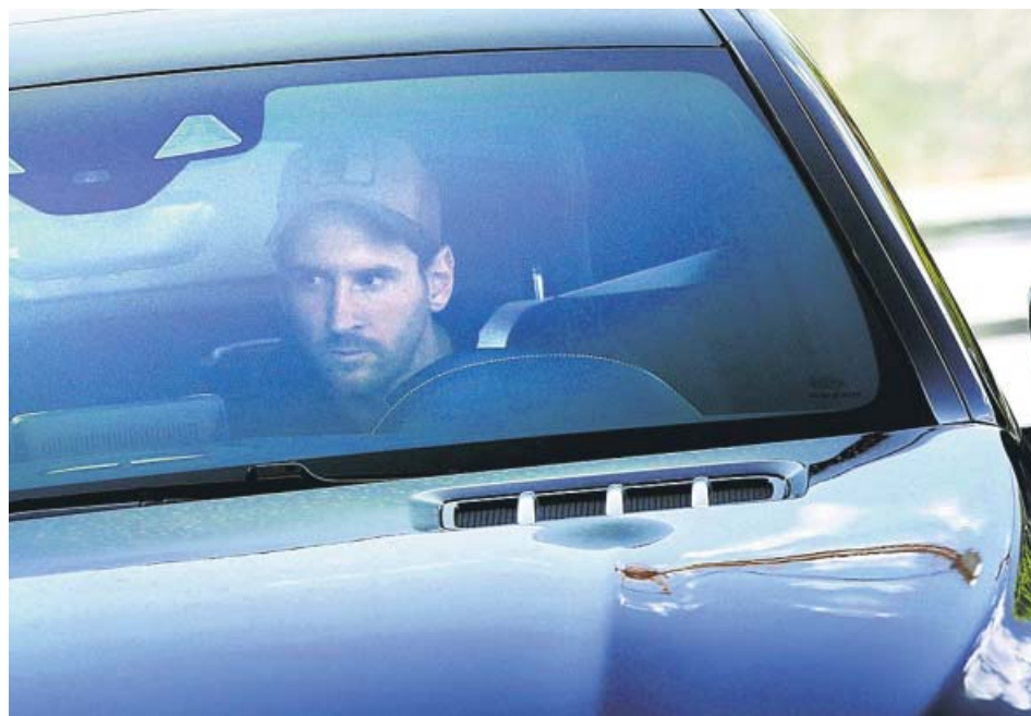
Leo Messi llegando ayer al entrenamiento del Barcelona en su vehículo.

En una entrevista el pasado viernes a Goal.com , Messi comunicó su decisión de continuar en el conjunto azulgrana ante la negativa del club de negociar su salida y, en ella, aseguró que su compromiso iba a ser absoluto. A tenor de lo visto ayer en la ciudad deportiva culé, parece que así será. Tras llegar con gesto serio en su vehículo particular, el argentino se ejercitó en solitario tras haber pasado ayer la prueba PCR. Tendrá que entrenarse al margen varios días