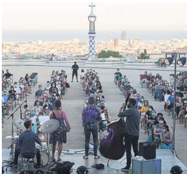
Concierto en el Parc Güell este verano.

Las reservas para los conciertos, totalmente gratuitas, podrán realizarse a partir de hoy a través de la página web de La Mercè, de su aplica-