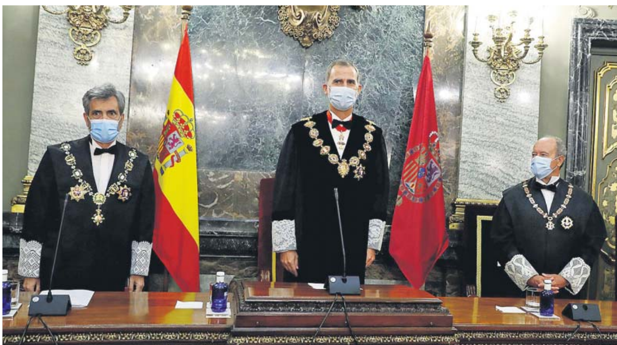
Felipe VI, en el Supremo, entre el presidente del CGPJ, Carlos Lesmes (izquierda), y el ministro de Justicia, Juan Carlos Campo.