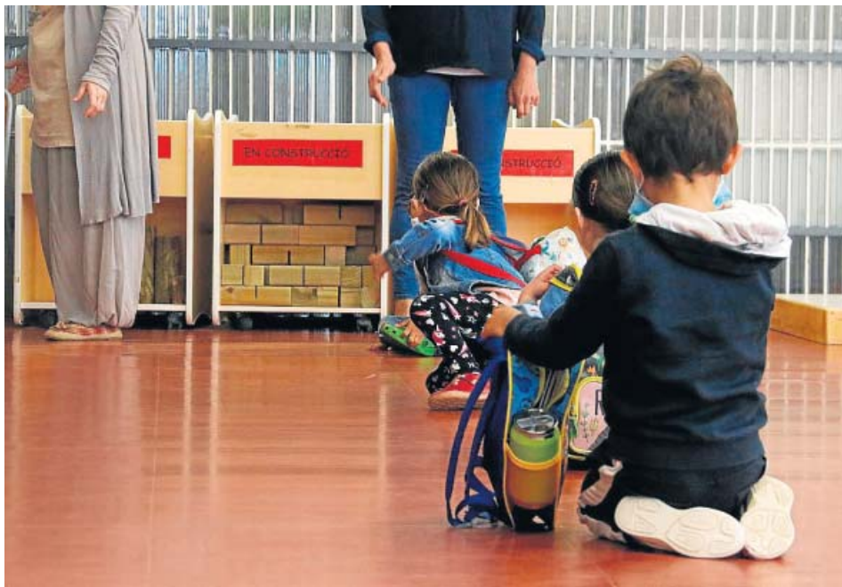
Alumnos de Infantil del Institut Escola Costa i Llobera de Barcelona.