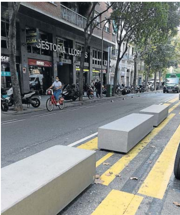
Bloques de hormigón en las calles de Barcelona. MIGUEL TAVERNA