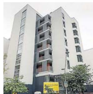
El decálogo se presentó en estos pisos sociales de Borrell. M. T.

El documento recoge reclamaciones del mundo local que requieren de un «pacto de Estado» para que ayuntamientos, comunidades autónomas y Gobierno den respuesta a la «situación de crisis habitacional». Este acuerdo, reza el texto, tiene