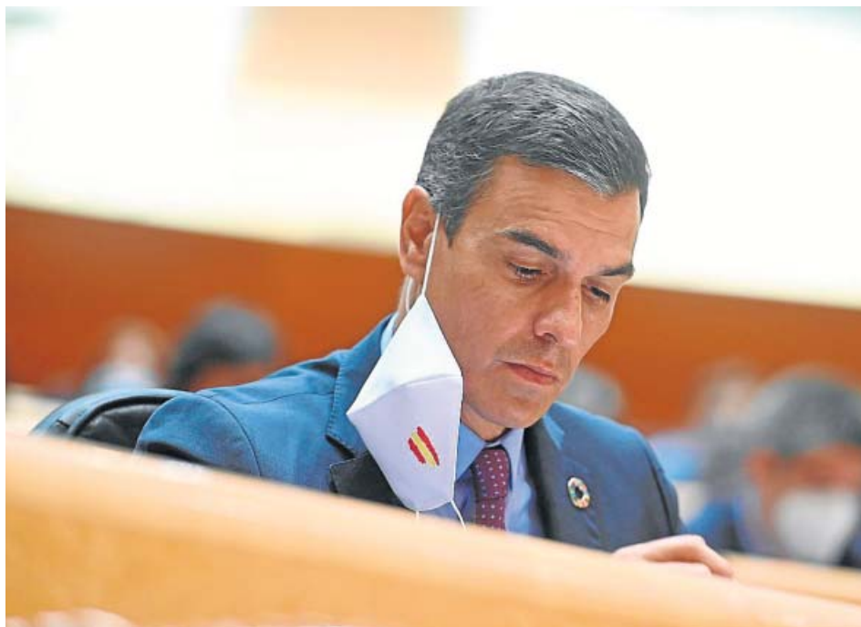
El presidente del Gobierno, Pedro Sánchez, ayer en el Senado.

Tras la ronda de contactos de la semana pasada, el presidente tiene el compromiso de Cs, del PNV o de Más País de que negociará las cuentas. ERC ex-