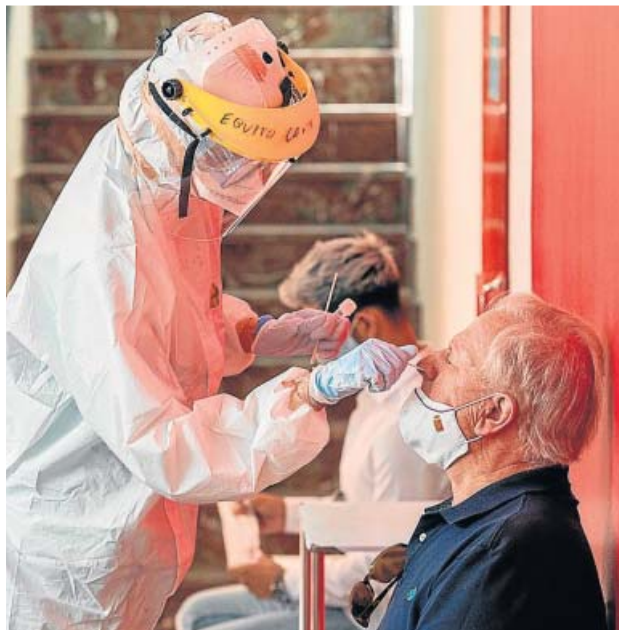
Un hombre se somete a una PCR en Lorca (Murcia).

El virólogo alemán Christian Dorsen propone acortar la cuarentena a cinco días, porque asegura que «el período de infección empieza dos días antes de que se presenten los síntomas y termina cuatro o cinco días después». Y varios gobiernos se están planteando esa opción ante la cada vez más evidente segunda ola de contagios. En España, el di-