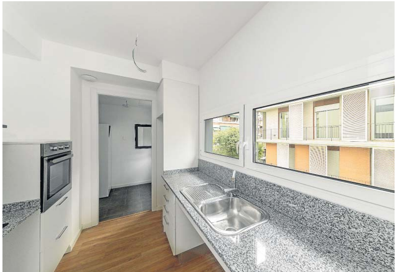
Uno de los pisos de una nueva promoción de alquiler social en la calle Comte Borrell de Barcelona.