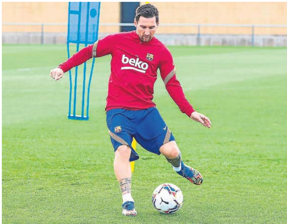
Leo Messi, en el entrenamiento de ayer, de nuevo en solitario, en Sant Joan Despí.

Bartomeu se ha salvado del primer match ball y Messi cumplirá el año que le queda de contrato, algo que parecía impensable cuando el astro argentino solicitó al Barcelona, por burofax, la carta de libertad para fichar por otro equipo. El '10', aunque a regañadientes, está dispuesto a hacer un último servicio al Barça liderando la escuadra azulgrana una temporada más. Probablemente sin su