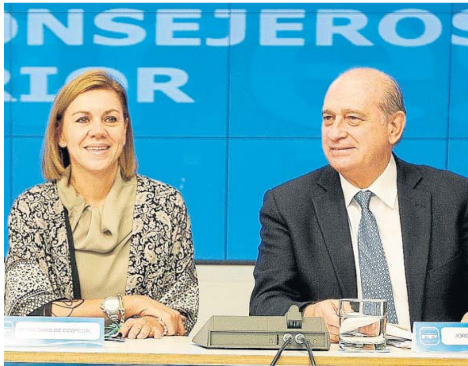
La ex número 2 del PP M. a Dolores de Cospedal y el exministro del Interior Jorge Fernández Díaz.

Minutos después, la portavoz del PSOE en el Congreso, Adriana Lastra, se abrió a apoyar esta comisión de investigación, aunque no confirmó qué posición tendrán los socialistas. «Vamos a estudiar bien el informe de la Fiscalía, el sumario, y hablaremos con el resto de los