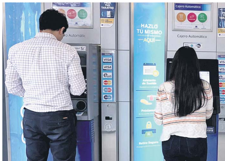
Clientes davant caixers automàtics de BBVA. BBVA

La Red de Rescate de Fauna Marina de la Generalitat abrió ayer los dos nidos de tortuga boba de la playa de la Pineda de Vila-seca (Tarragona), después de que la noche del domingo nacieran las primeras tortugas. El objetivo es trasladar los huevos viables para su incubación artificial, y evitar riesgos derivados de la bajada de la temperatura ambiente, que podría acabar afectando a la puesta. En total, se han trasladado 55 huevos y 21 crías.