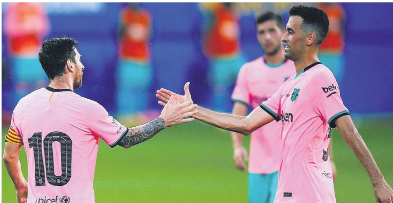
Leo Messi celebra junto a Sergio Busquets uno de sus goles ante el Girona.

El astro argentino brilló en el segundo amistoso de pretemporada del Barça, que se impuso al Girona. Coutinho y Pedri también cuajaron un buen partido