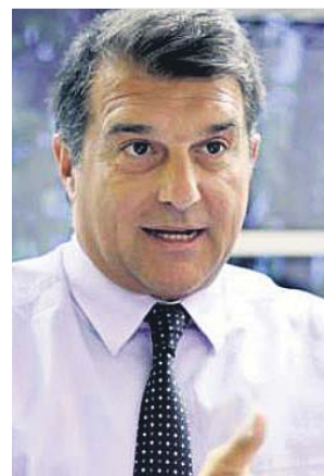
Laporta se ha mostrado a favor de la moción.

Pese a no ser oficial su precandidatura, ni dar apoyo