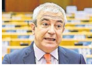
Luis Garicano (Cs).

Luis Garicano sostuvo que «debemos estar orgullosos de la respuesta» de la UE ante esta crisis. «Transmitimos un mensaje a los ciudadanos para salir de esto juntos», pero no todo está resuelto, pues el dinero «hay que gastarlo bien». Insistió que el Parlamento Europeo asegurará que los fondos «se usen para favorecer a las familias» porque Europa «no es un cajero automático». Para el portavoz de Ciudadanos en la Eurocámara y vicepresidente de Renew Europe lo importante es el cómo a partir de ahora. Y repitió una idea: «El reto ahora es gastar bien el dinero del plan de recuperación: para mejorar en empleo, sanidad, educación, no para convertir a los amigos de algunos en élite empresarial», en una crítica a Pablo Iglesias. ●