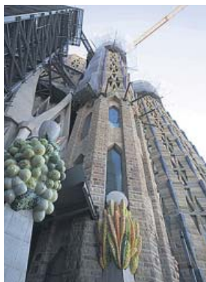
Torre de la Mare de Déu, fotografiada ayer.