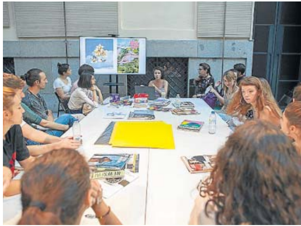
Taller Cómico Virtual de Puwerty 2019.