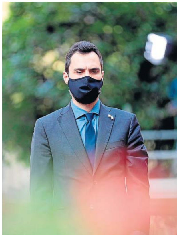
El presidente del Parlament, Roger Torrent, en la Diada.

Entrando en detalle en la legislación, la Ley de la Presidencia de la Generalitat estima que un president cesa de su cargo si hay «condena penal firme que conlleve la inha-