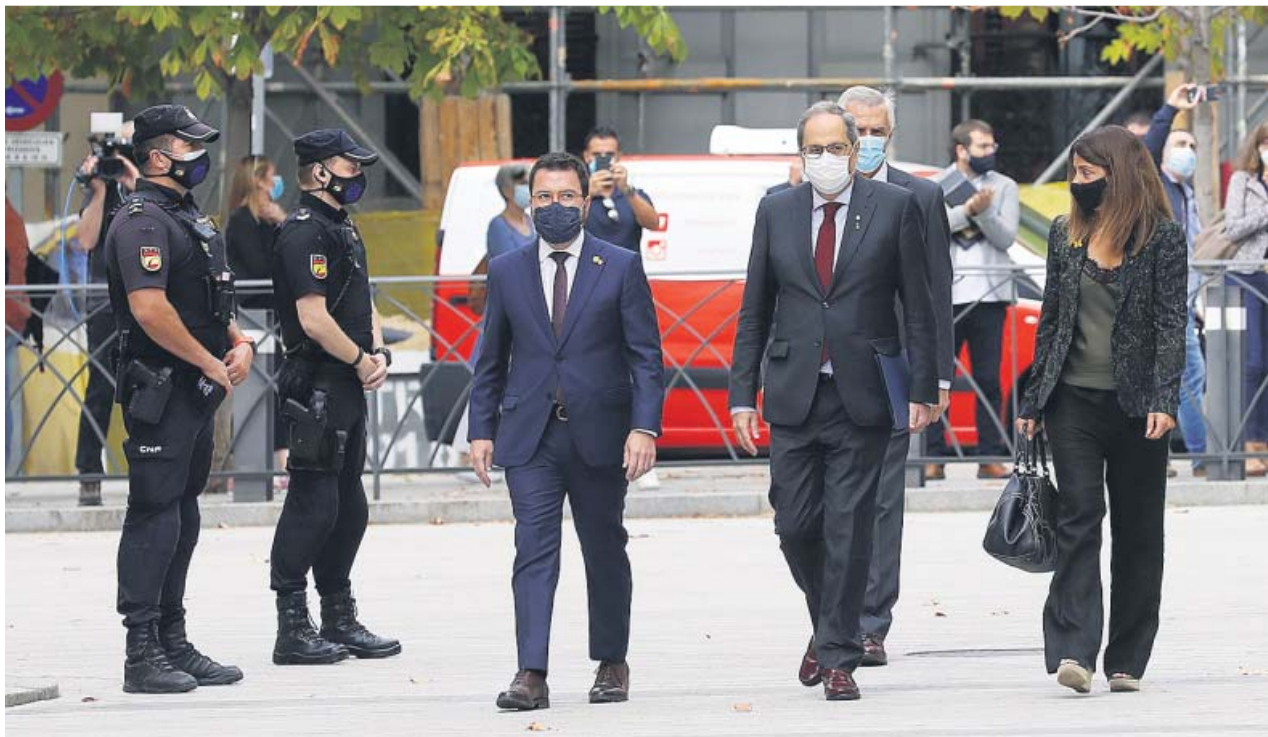
El vicepresidente y la portavoz del Govern, Pere Aragonès y Meritxell Budó, acompañan a Quim Torra al Supremo.