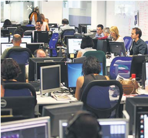
Imagen de la redacción en Madrid, a principios de año. J.P.

La edición digital de este periódico se consolida entre las más leídas del país, según el medidor oficial Comscore