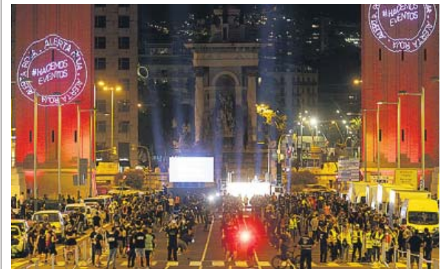
Montaje protesta del mundo del espectáculo en Barcelona.

En el manifiesto que se leyó en las concentraciones se hizo referencia a las condiciones de los autónomos, a los ERTE y a los créditos ICO, para los que se pidió una moratoria. Aunque aún no manejan cifras de desempleo, Espada avanzó que el volumen de trabajo ejecutado en estas fechas es de un 10% en relación a años anteriores. Asimismo, las pérdidas de la música en directo ascienden a 660 millones de euros. ● R.C.