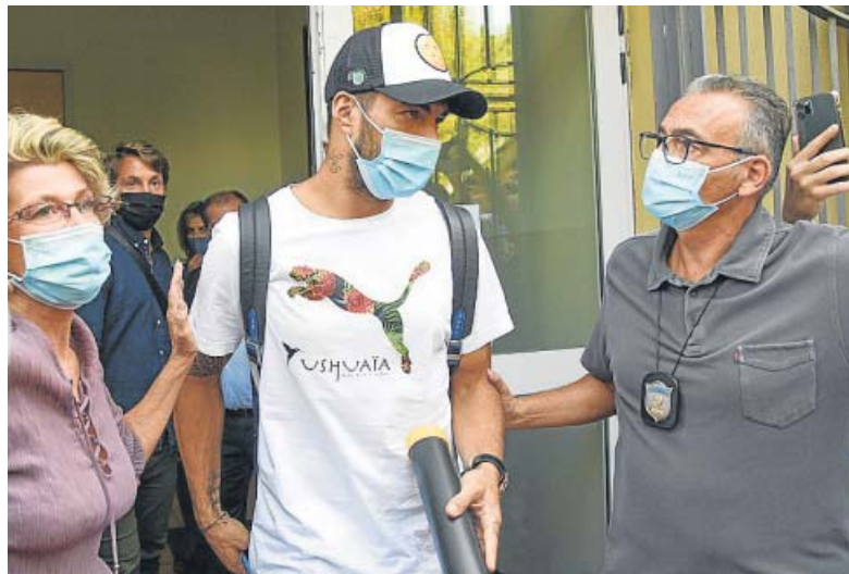
Luis Suárez ayer en Perugia tras pasar el examen de italiano.