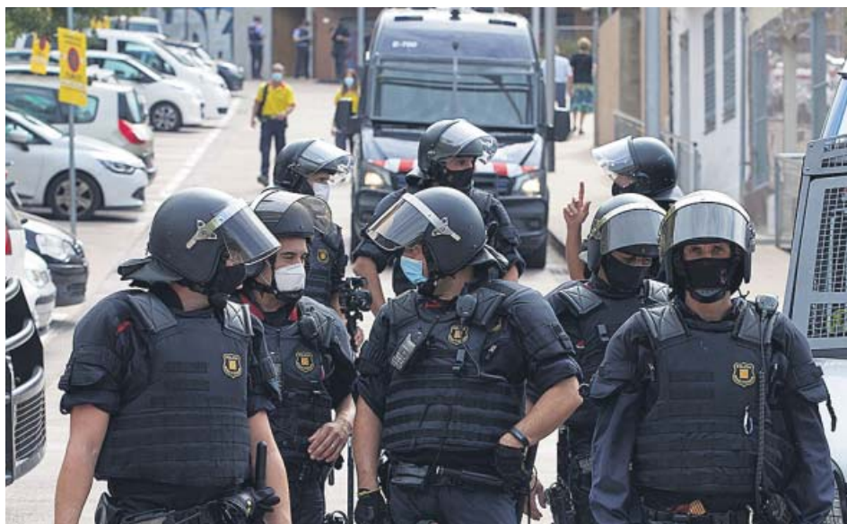
Los agentes de los Mossos d'Esquadra usaron sus porras para echar a las personas que se concentraron frente al edificio para impedir el desahucio.

gente de delante de la puerta de la finca.