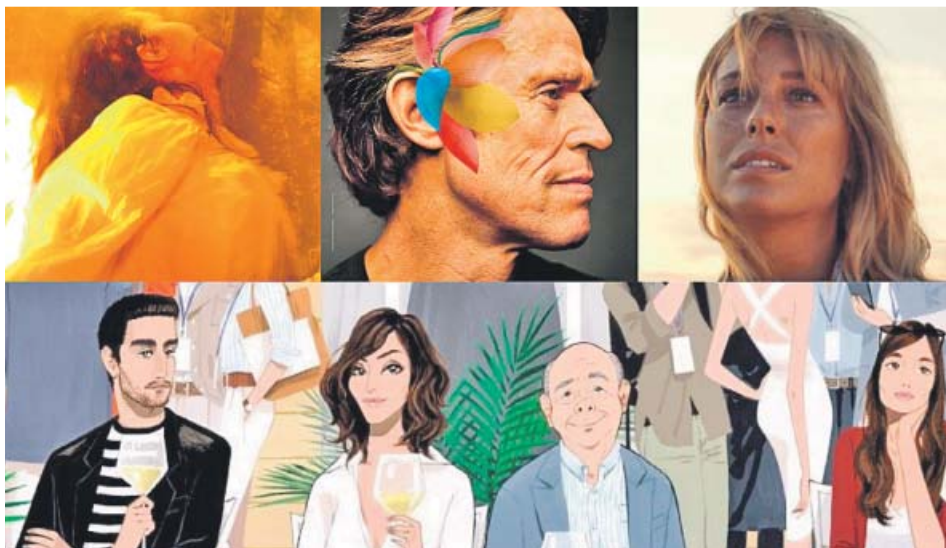
De izda a dcha, 'Akelarre', cartel del certamen, 'El verano que vivimos' y 'Rifkin's Festival'. ZINEMALDIA