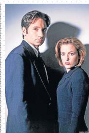
David Duchovny y Gillian Anderson.

Gracias al carisma de sus héroes y un look muy cool, la popularidad de Expediente X superó en su día incluso al bombazo de Twin Peaks . Fue una de las primeras series en disponer de una web oficial, generó titulares a granel y cautivó por igual a estrellas del rock y a quienes nos la