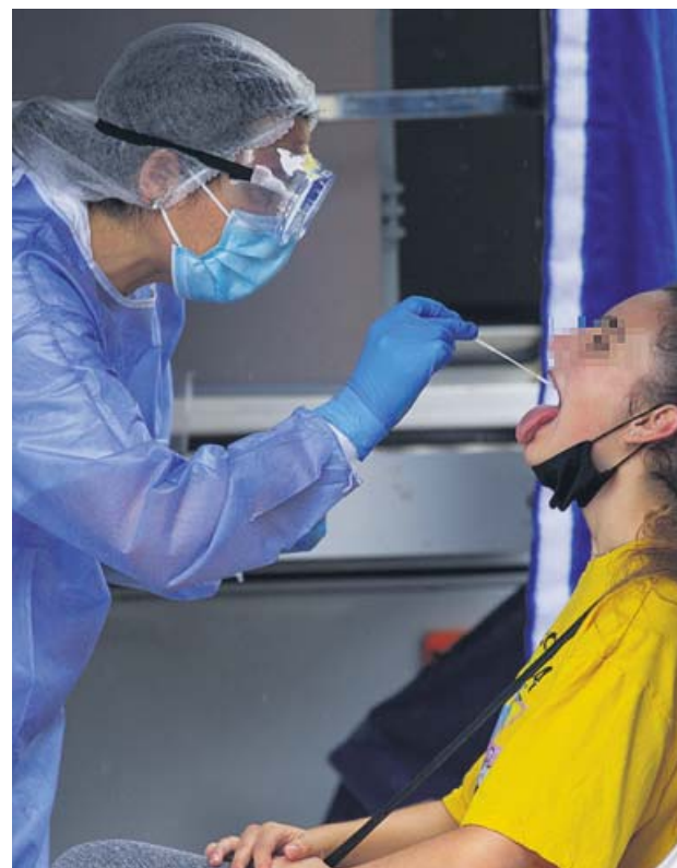
Una joven se somete a una PCR en Asturias.

La Comunidad Valenciana, en cambio, no dio datos el