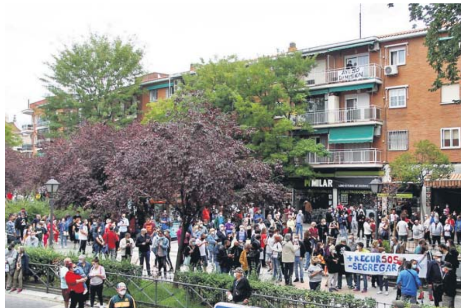
Vecinos de Villa de Vallecas salieron ayer para protestar contra las restricciones.

Un dispositivo policial con más de 200 agentes comienza hoy a realizar controles aleatorios en las 37 zonas básicas de salud de la Comunidad de Madrid. Todas ellas tienen una incidencia de más de 1.000 contagios por cada 100.000 habitantes en 14 días, según indican fuentes regionales. Las áreas afectadas —que se rigen por los centros de salud a los que acuden los vecinos— se localizan en seis distritos de la capital y en los municipios de Fuenlabrada, Humanes, Moraleja de Enmedio, Parla, Getafe, San Sebastián de los Reyes y Alcobendas. Ahí viven unos 855.000 vecinos que no podrán salir de sus barrios salvo para acudir al trabajo, para ir al médico, a centros educativos y también para realizar trámites en los juzgados y ante la administración. Igualmente, están autorizados los desplazamientos para volver al lugar de residencia, para hacer gestiones en entidades bancarias o de seguros, para realizar exámenes y para cuidar a personas mayores, menores o dependientes. La norma también contempla