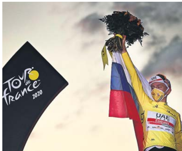
El ganador del Tour de Francia, el esloveno Tadej Pogacar.