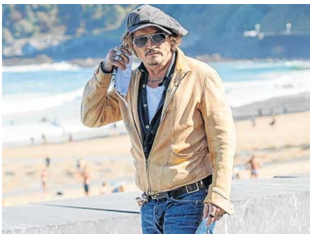
Johnny Depp, ayer en San Sebastián.