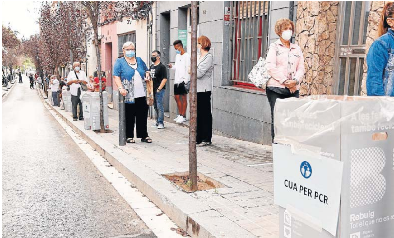
La cola que había el sábado en el cribado masivo de Trinitat Vella.

SE SALDÓ CON 1.735 pruebas PCR, mientras que el objetivo del Departament de Salut eran 1.200 DURANTE el sábado y el domingo hubo colas de vecinos en los puntos donde se realizaron los tests PARA fomentar la participación, se hizo un llamamiento puerta a puerta a 7.100 ciudadanos EL BARRIO es una de las zonas de Barcelona más afectadas por el coronavirus