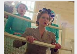
La camaleónica actriz pudo ser gobernadora de NY

1 ¿Recuerdas cuándo vio Alguien voló sobre el nido del cuco por primera vez? Solo recuerdo que me gustó y que me pareció muy oscura. Yo era una gran fan de Milos Forman, veía todo su cine. De hecho, salí en Amadeus . Es muy interesante que Ryan Murphy se haya fijado en Mildred Fletcher dentro de ese universo lleno de tíos haciendo muy de tíos.