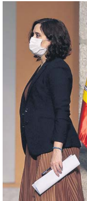
Ayuso, en la Puerta del Sol.