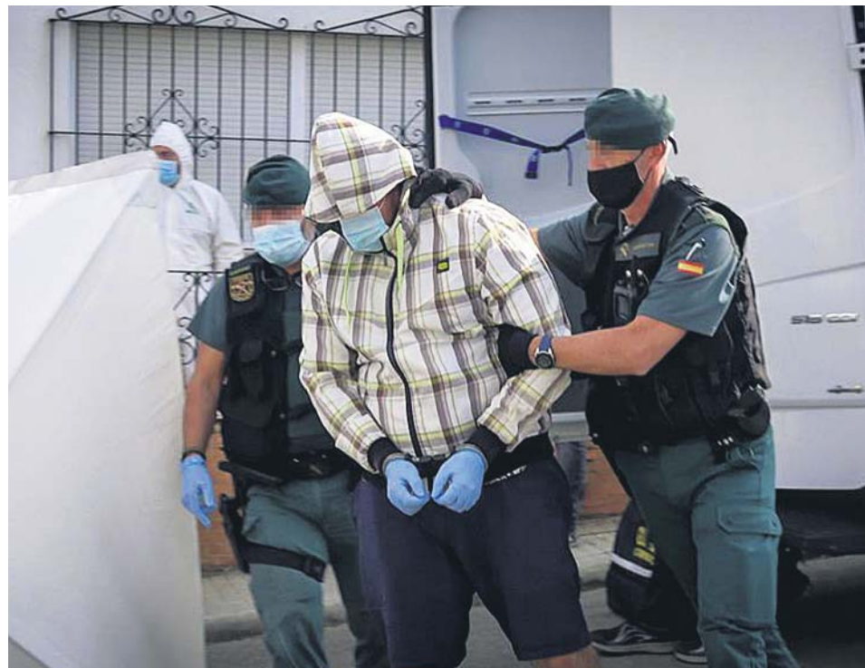
Dos agentes escoltaban al presunto autor tras la reconstrucción de los hechos.

Los colegios electorales de Italia abrieron ayer para que más de 46,6 millones de italianos votasen en un referéndum constitucional sobre la reducción del número de escaños en la Cámara de Diputados y el Senado. La medida plantea reducir de 630 a 400 los miembros del primero y de 315 a 200 los del segundo.