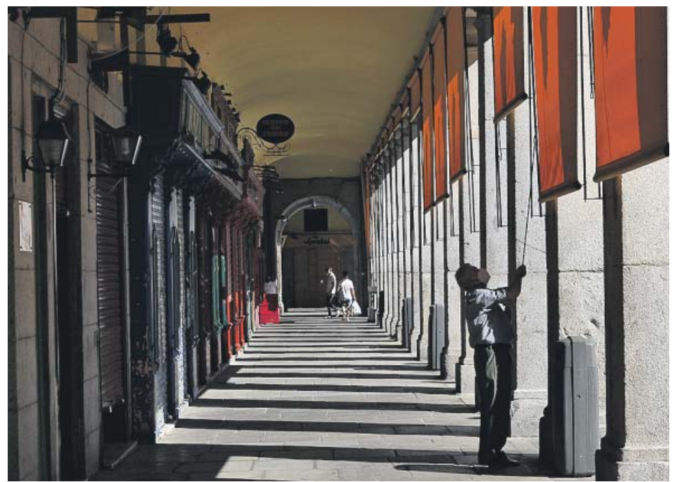
Un comerciante en los soportales de la Plaza Mayor de Madrid, semivaciados por la crisis.

Por el contrario, patronal y sindicatos coinciden en reclamar que los ERTE sigan siendo generalizados o, en su defecto, que las limitaciones entre sectores sean laxas y no se deje sin ERTE a negocios muy dependientes de empresas muy afectadas por