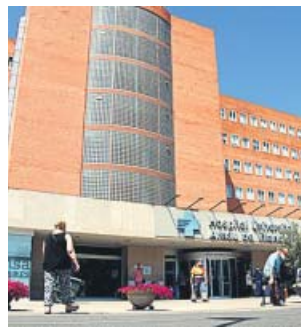
L'hospital Arnau de Vilanova de Lleida.

El comitè de vaga, que preveu un seguiment massiu, ha