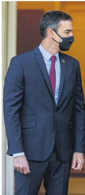
Sánchez, en la Moncloa.

Ya sin fondos disponibles para repartir entre las comunidades, la oferta del Gobierno cen-