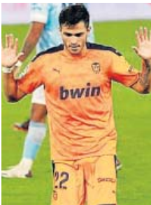
Maxi, dos jornadas, dos goles.