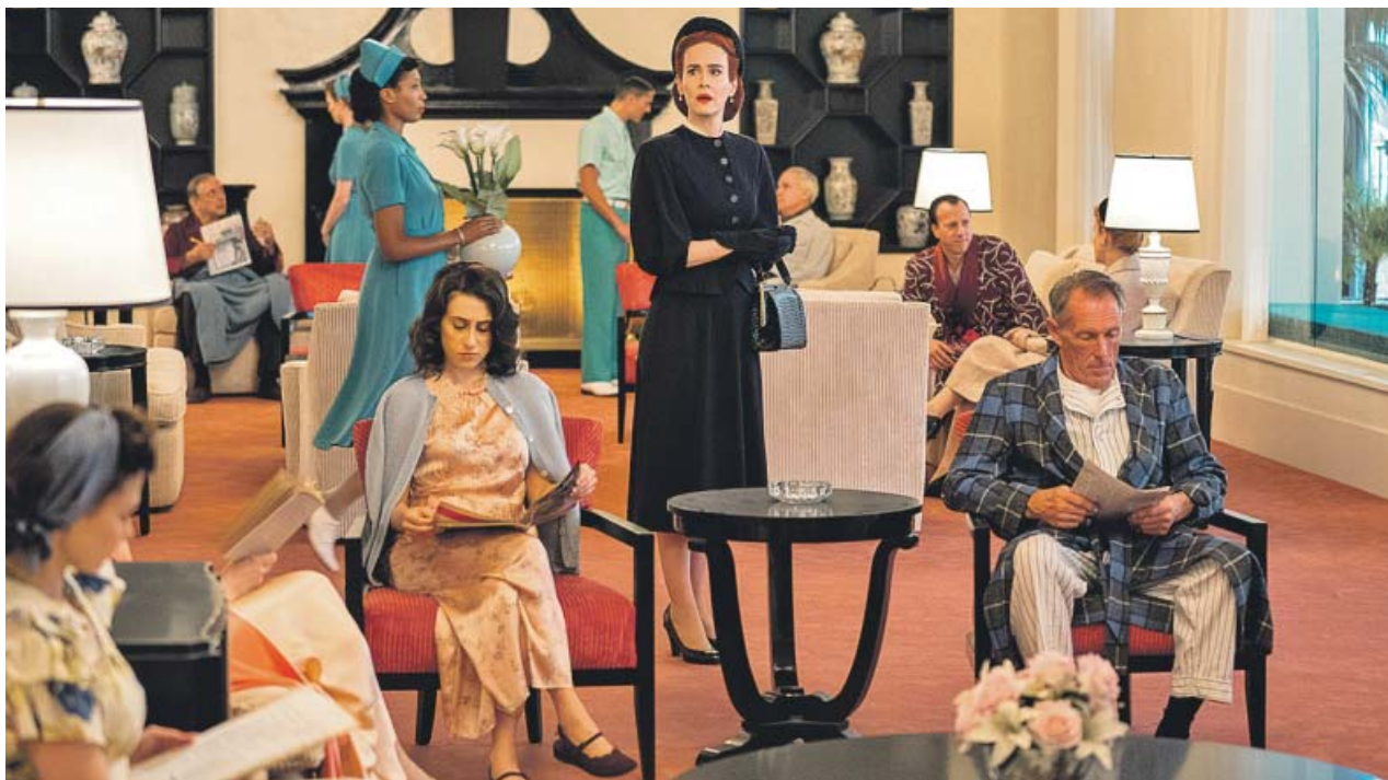
Sarah Paulson interpreta a la inquietante enfermera Mildred Ratched.

tán implantando polémicos tratamientos para curar el lesbianismo o la melancolía.