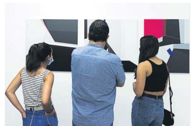
Tres personas observan unos cuadros del pintor.