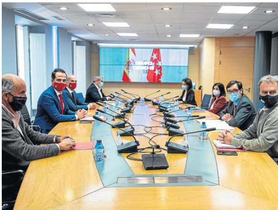
El Grupo Covid, entre ellos el vicepresidente madrileño y el ministro de Sanidad, reunidos ayer.

ficados por todas las comunidades autónomas al final de la jornada. De momento, el Gobierno central y Madrid acordaron que se fijen criterios comunes de actuación para todas las ciu-