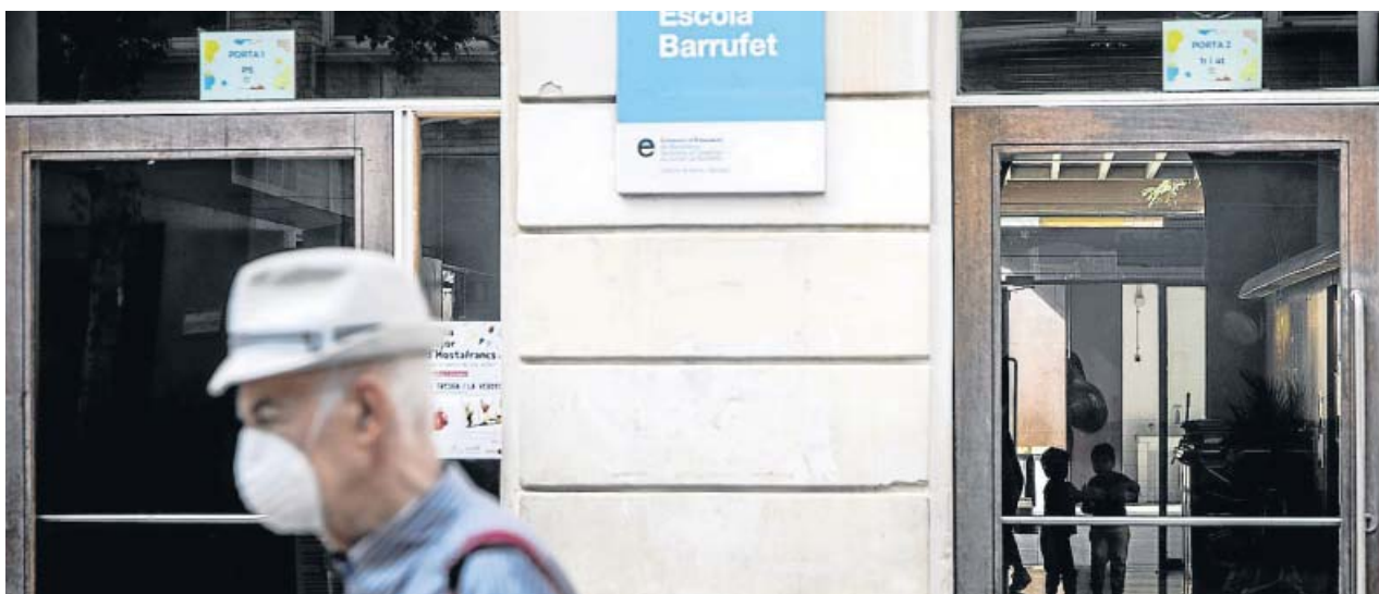
La Escola Barrufet del barrio de Sants, donde ayer comenzaron los cribados masivos de Covid en colegios de Barcelona. HUGO FERNÁNDEZ

CATALUNYA registra 1.910 casos positivos confirmados de Covid con 9 fallecidos y 800 ingresados