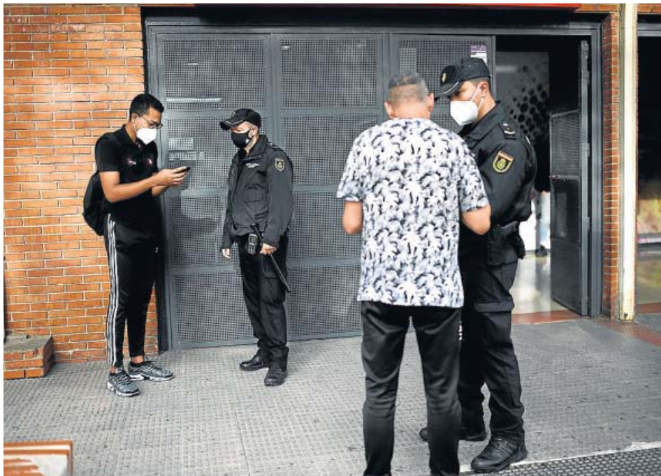
Agentes de la Policía Nacional controlan la movilidad en un barrio confinado de Madrid.