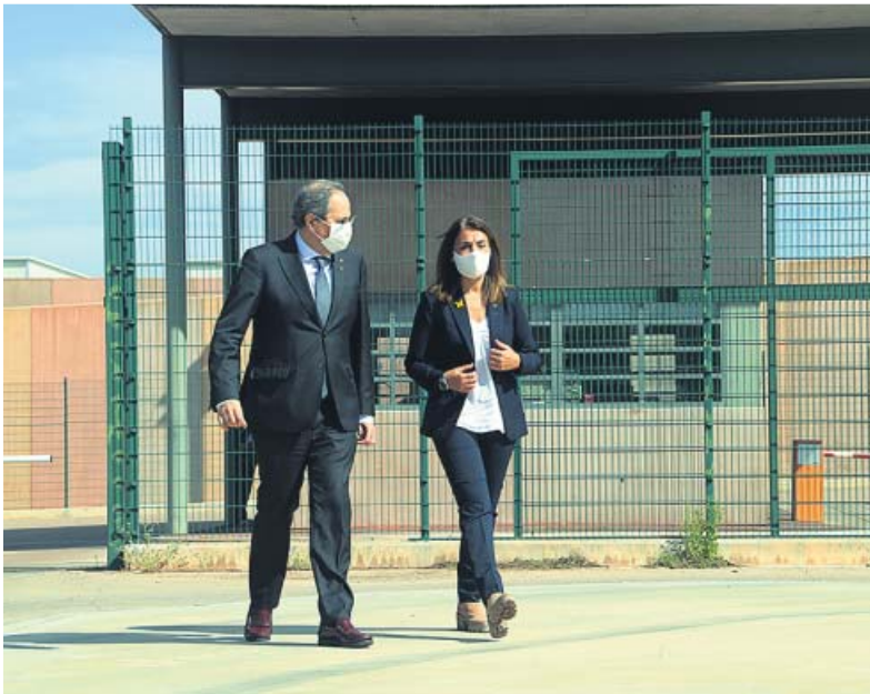
Torra y Budó visitaron ayer a los políticos presos en Lledoners.