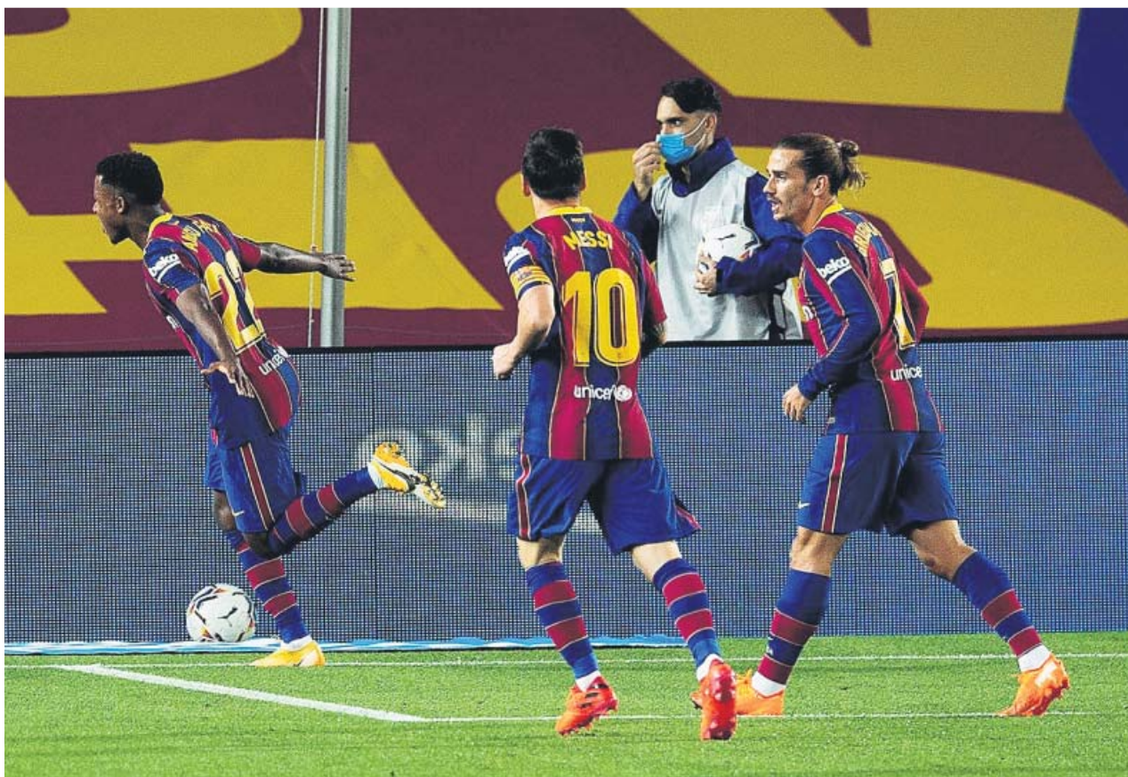
Ansu Fati celebra uno de sus goles al Villarreal ante la mirada de Leo Messi y Antoine Griezmann.