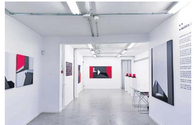
Vista de la exposición Horizonte de indiferencia . LAURA PÉREZ TABARES