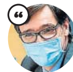
SALVADOR ILLA Ministro de Sanidad

«Esto es una buena noticia para todos: para los madrileños y para el conjunto de los españoles»