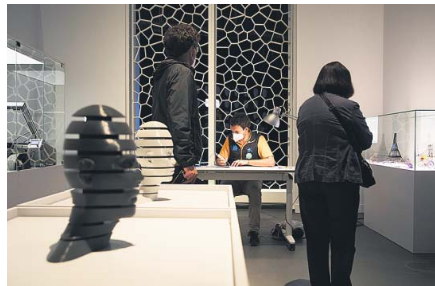
La muestra está compuesta por más de 40 piezas impresas en 3D.

Se crea una prestación para los trabajadores con contrato fijo discontinuo o que realizan trabajos fijos y periódicos en determinadas fechas afectados por un ERTE. ●