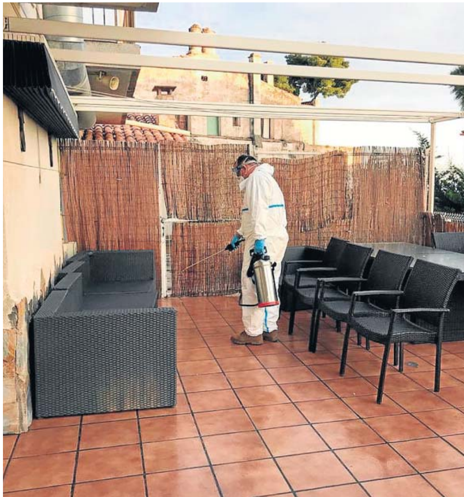
Un soldado del Ejército desinfectando una residencia de Rubí.

Además, sin las visitas de familiares, hay un menor control hacia el trato dispensado a sus mayores. Piden «residencias para vivir y no para morir» así como un cambio