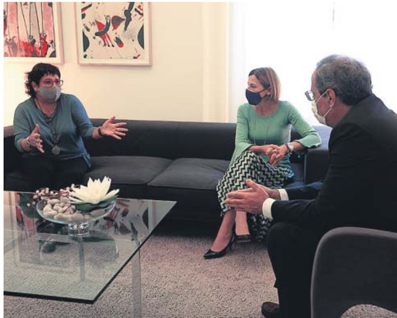
El expresidente del Govern se reunió ayer con Forcadell y Bassa.