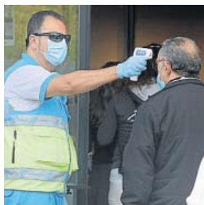
Control de temperatura en un centro cultural de Madrid.

En lo que respecta a la situación en los hospitales, el número de pacientes con coronavirus actualmente ingre-