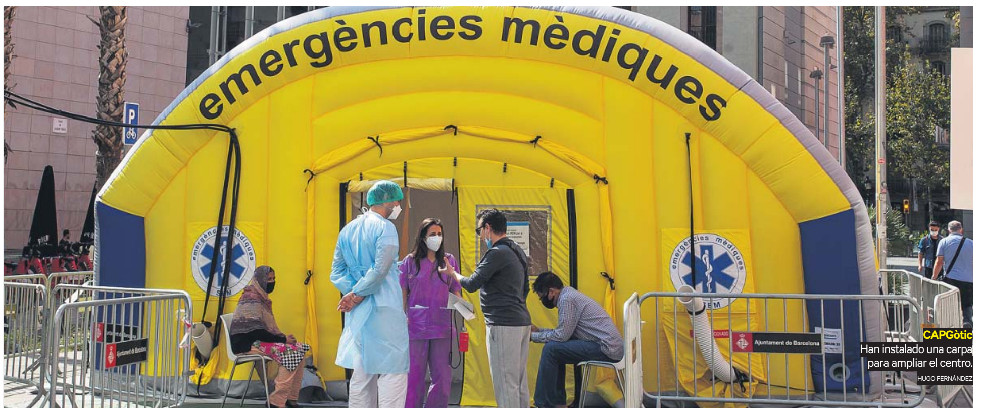
CAPGòtic Han instalado una carpeta para ampliar el centro.