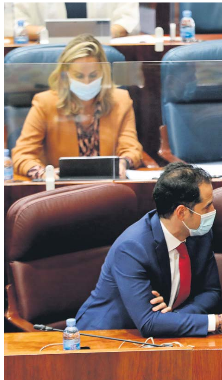
El vicepresidente Ignacio Aguado y la presidenta Isabel Díaz Ayuso

Así las cosas, el escenario que parece más probable es que el confinamiento de las citadas ciudades madrileñas no se producirá este próximo fin de semana, pero sí a lo largo de la semana que viene y estará vigente durante el próximo