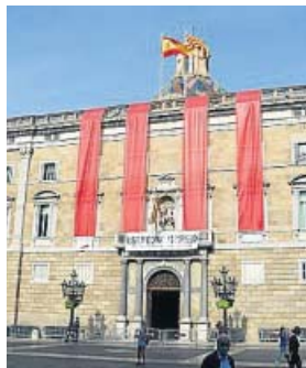
Cuatro barras en el Palau El Govern colgó cuatro barras de tela roja en la fachada del Palau de la Generalitat por encargo de Torra.