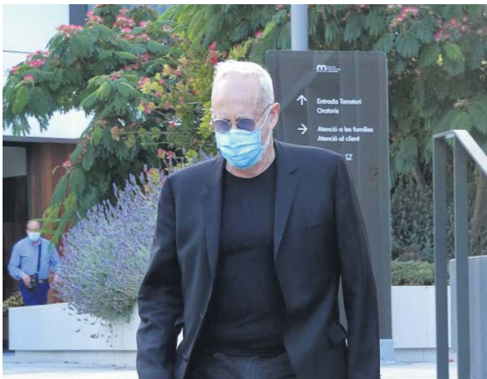
Josep Maria Mainat saliendo de la capilla ardiente de Rosa María Sardà, el 11 de junio.

SU MUJER le administró una dosis de insulina que le dejó en coma, al ser diabético