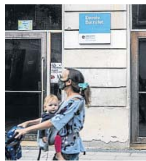
L'escola de Sants on van fer els primers cribatges. H FERNÁNDEZ

En total el nombre de grups escolars confinats per un posi-