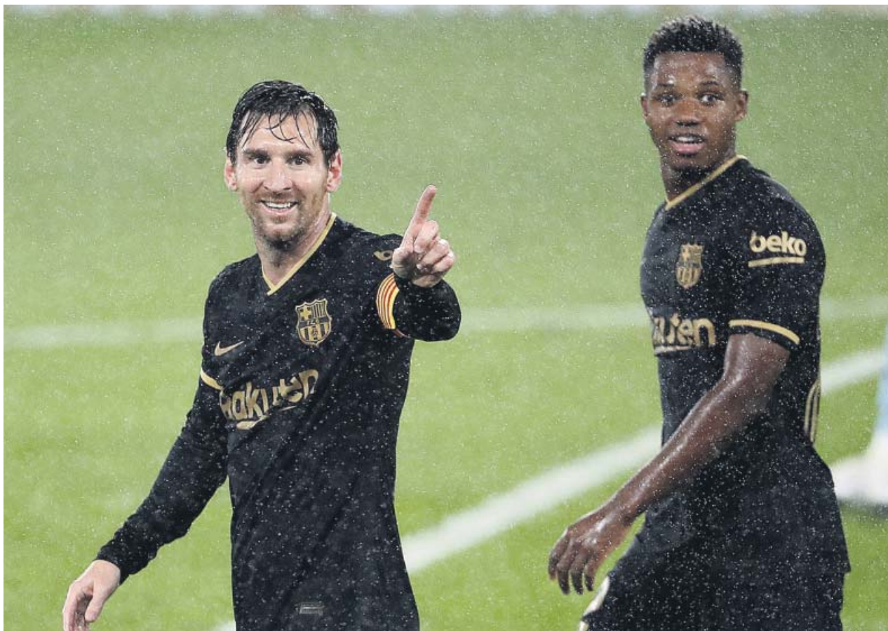
Leo Messi y Ansu Fati celebran el segundo gol del Barça en Balaidos.