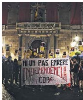
CDR en plaza Sant Jaume Unas 300 personas se concentraron a las 20h para conmemorar el tercer aniversario del referéndum del 1-0.