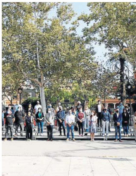
Partidos y entidades independentistas, juntos Celebraron un acto en el paseo Lluís Companys de Barcelona, junto al Arc de Triomf, en el que la ANC reclamó unidad entre las fuerzas soberanistas para llegar a una Catalunya independiente.

Unos 300 miembros de los CDR se concentraron ayer en el centro de Barcelona y en Girona. En la capital catalana quemaron contenedores, montaron barricadas y lanzaron objetos contra los Mossos, que realizaron varias cargas. Al cierre de esta edición (23.00 h) había más de una decena de detenidos.