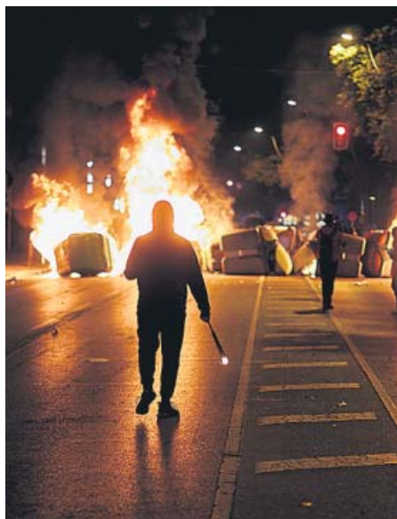
Barricada en las calles

Plaza Catalunya, Urquinaona y Via Laietana fueron anoche escenario de barricadas improvisadas y contenedores ardiendo, destrozados provocados por manifestantes radicales.