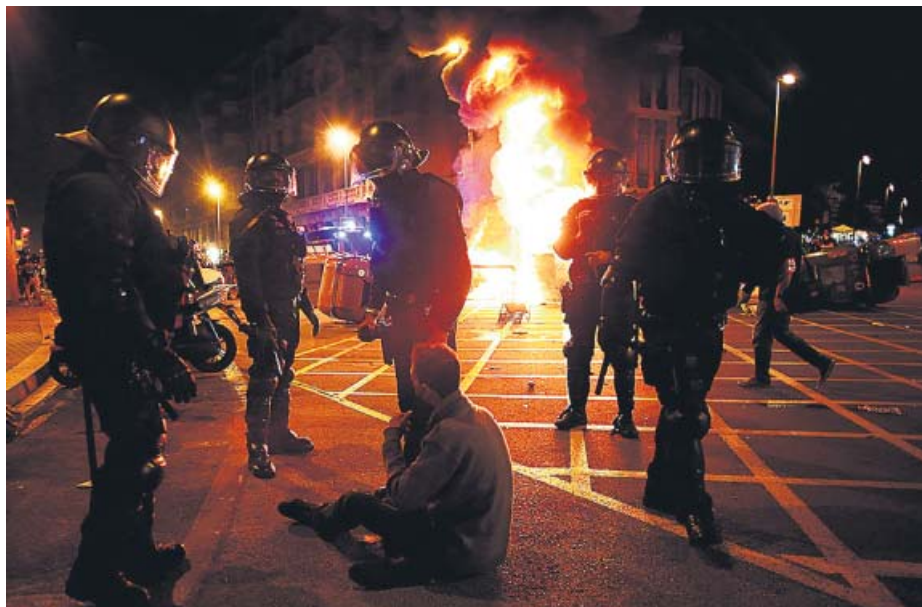
Protestas de los CDR y más de una decena de detenidos

Unos 300 miembros de los CDR se concentraron ayer en el centro de Barcelona y en Girona. En la capital catalana quemaron contenedores, montaron barricadas y lanzaron objetos contra los Mossos, que realizaron varias cargas. Al cierre de esta edición (23.00 h) había más de una decena de detenidos.