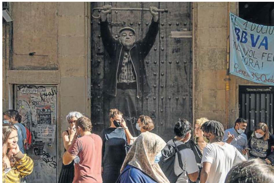
Vecinos del Raval concentrados en el número 3 de la calle Riereta. MIQUEL TAVERNA

En cuanto a los movimientos vecinales, asegura que los actuales ocupantes de Riereta 3 se han involucrado y «han tenido un papel fundamental» en las redes de soporte mutuo del barrio durante los momentos más duros de la pandemia de la Covid-19. Cuenta que han repartido comida, han hecho mascarillas,