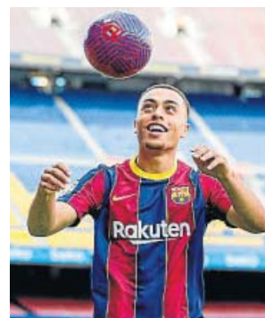
Dest, ayer durante su presentación.

Fue el 27 de julio de 2019 cuando firmó su primera apa-