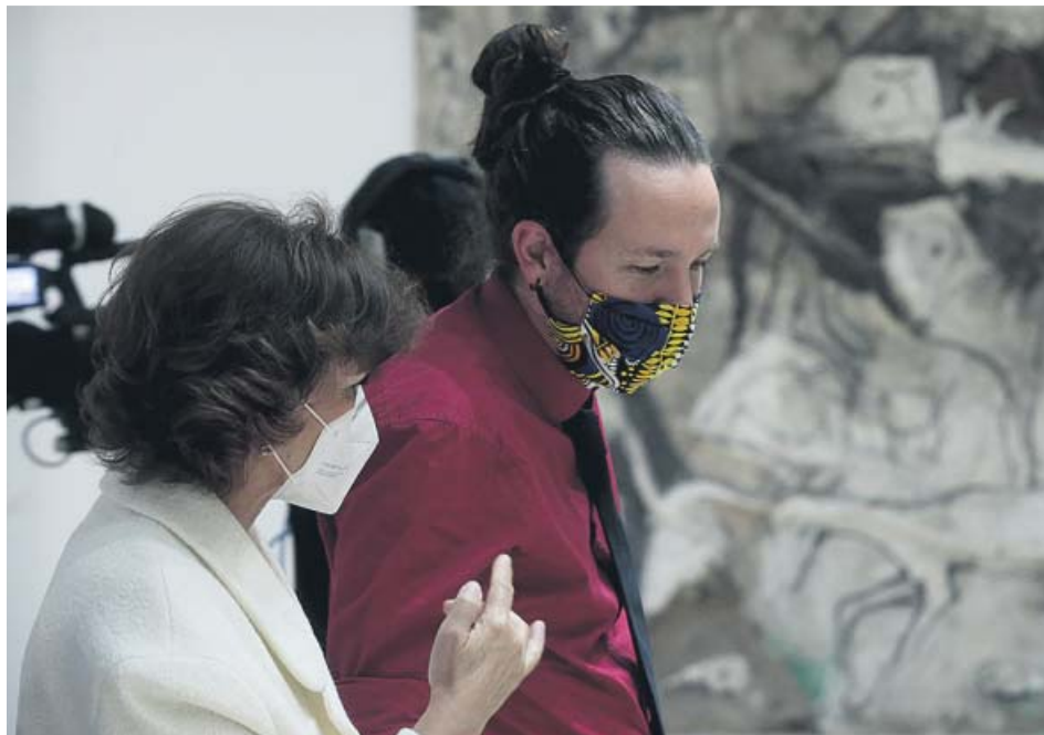
Pablo Iglesias, ayer, junto a la vicepresidenta Calvo, tras presentar el Plan de Recuperación.