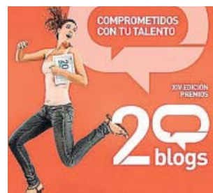
Cartel de convocatoria de los XIV Premios 20Blogs.

En el año del 20 aniversario del diario, marcado por el co-