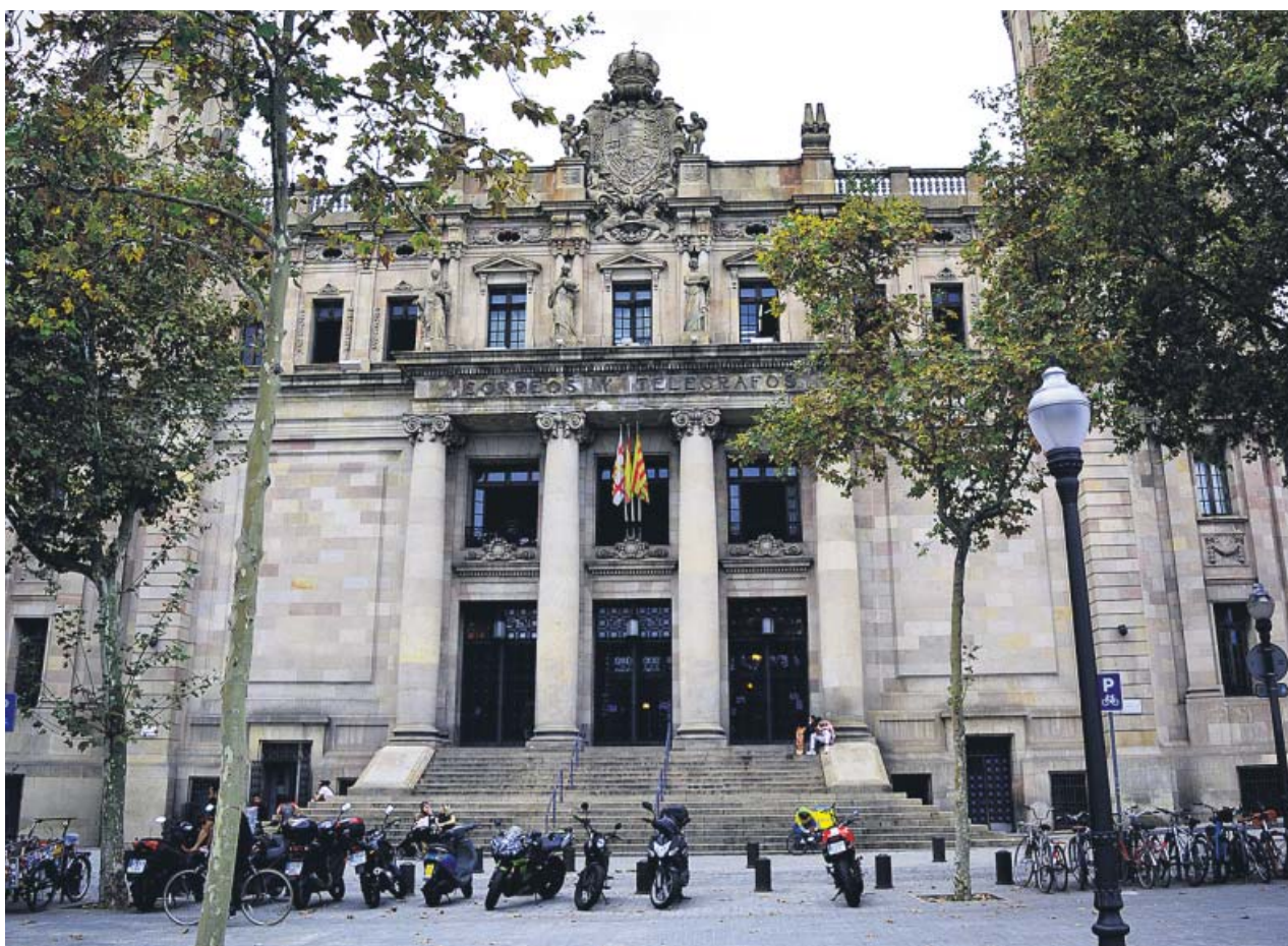
El edifici de Correos y Telégrafos de Via Laietana, ahora cedido a la ciudad de Barcelona. ANTONIO HERREROS