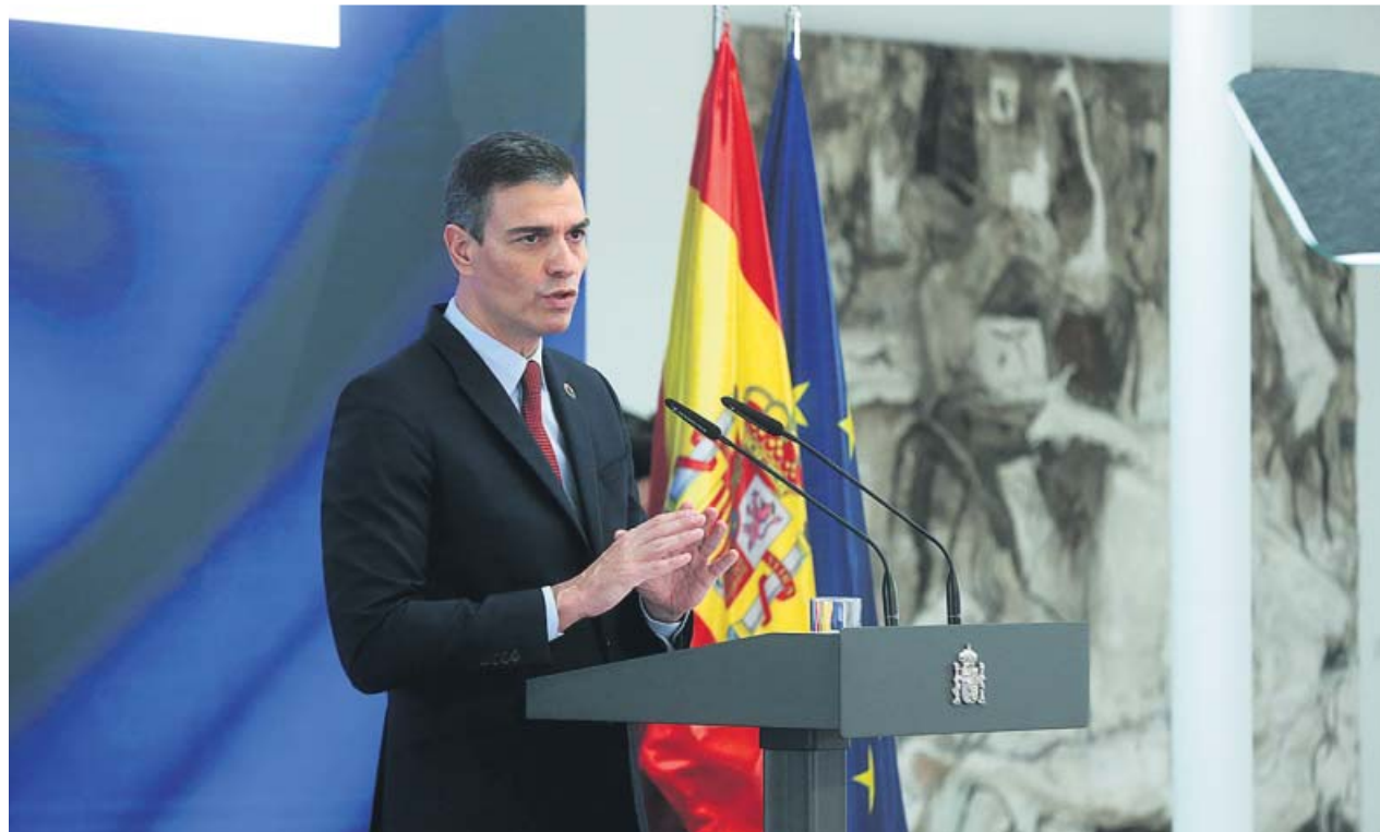
El presidente Pedro Sánchez, ayer, durante la presentación del Plan de Recuperación.

Bruselas todavía tiene que aprobar los proyectos que incluirá el Gobierno en su Plan de Recuperación, pero de momento Sánchez ha optado por pedir transferencias por valor de 72.000 millones entre 2021 y 2023. Esto dejará prácticamente a cero las subvenciones directas disponibles para 2024-2026. Si es necesario, el Gobierno, a partir de 2024, debería complementar las necesidades de financiación con créditos que habría que devolver y de los que España podría pedir hasta 67.300 millones.