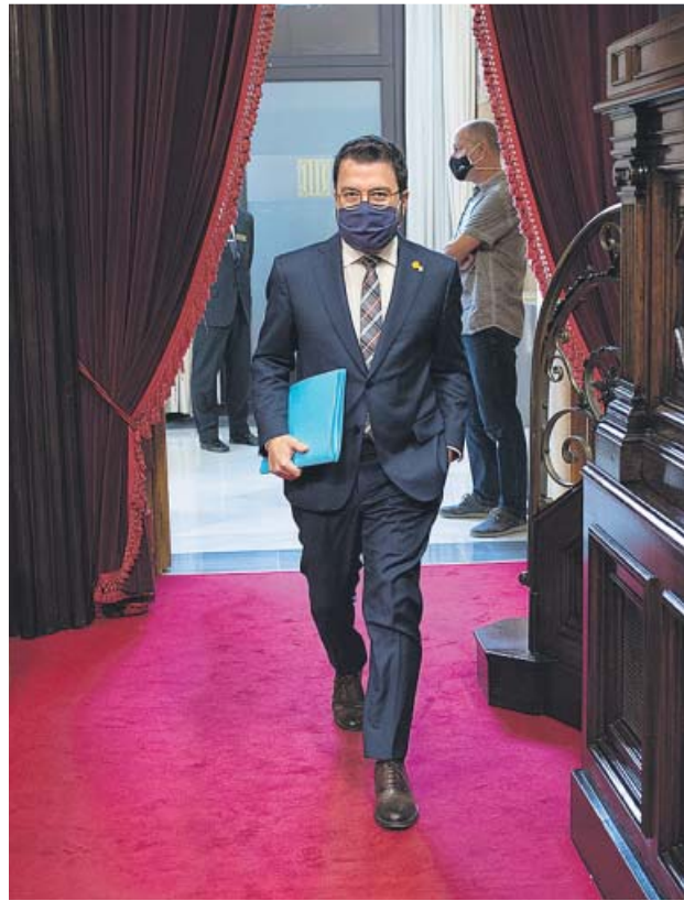
El president en funciones entrando ayer a la sesión de control.

Aragonès quiso dejar claro a la bancada que la prioridad del ejecutivo en funciones es, ahora mismo, la lucha contra esta pandemia. E hizo un anuncio: la ampliación presupuestaria de 200 millones de euros para reforzar la sanidad catalana ante el reto que plantea el coronavirus. En julio, las cuentas de la Generalitat también se ampliaron con una partida de 1.230 millones de euros. En esta segun-