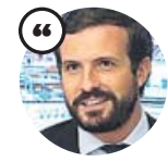
PABLO CASADO Presidente del PP

«Sánchez debe cumplir la misma vara de medir que exigía en su moción de censura [contra Mariano Rajoy]»