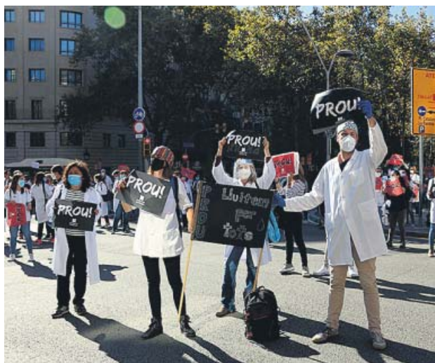
Protesta de facultativos de la Atención Primaria. AEN

Un centenar de médicos se concentraron ayer a las puertas de la sede del ICS y cortaron el tráfico de la Gran Via. Los congregados llevaron pancartas en las que se podía leer consignas como «Basta» o «Queremos una Atención Primaria de calidad».