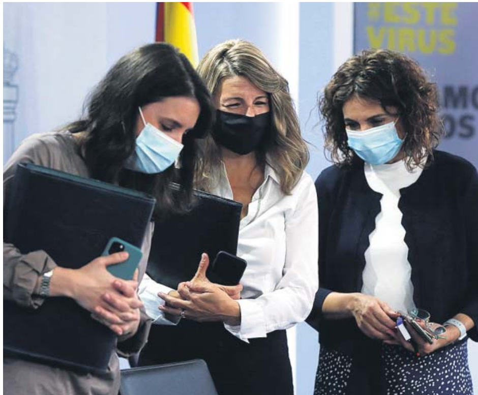
Las ministras Irene Montero, Yolanda Díaz y María Jesús Montero.

«A partir de hoy, se acabó que hombres y mujeres puedan percibir retribuciones diferentes», aseveró la ministra de Trabajo, Yolanda Díaz, al término de la reunión del Gobierno en la que se dio luz verde a los dos reales decretos. Estos se han negociado con los agentes so-