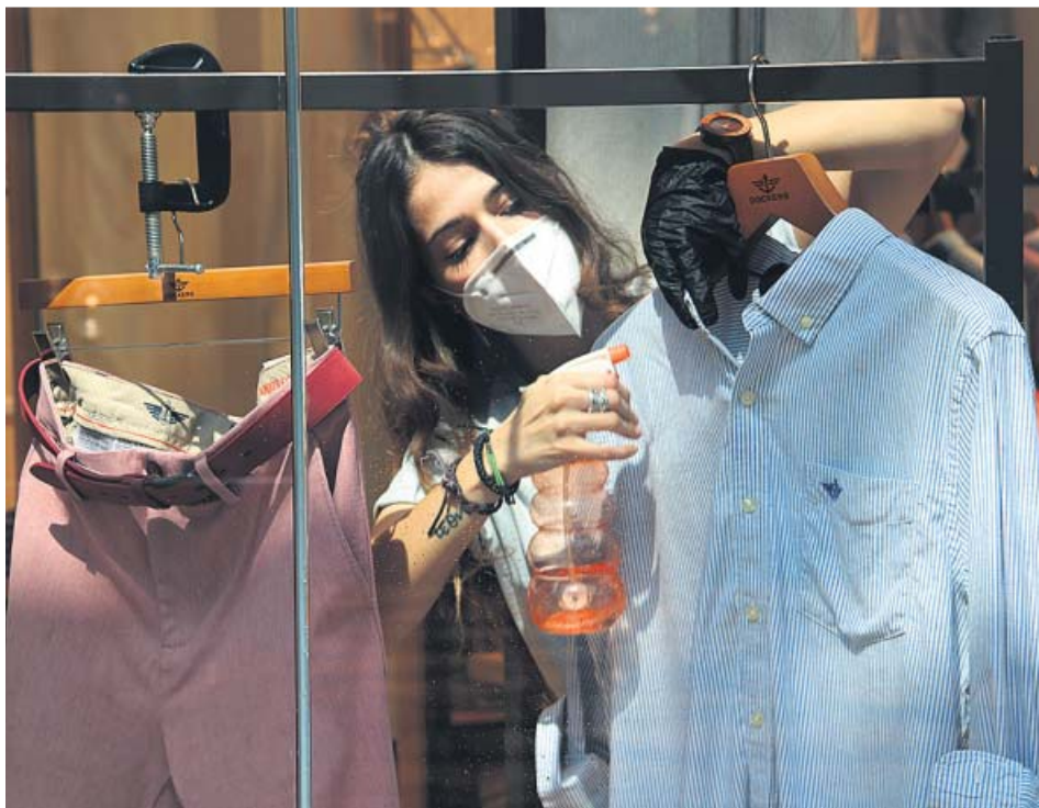
Una dependienta desinfecta prenda de ropa.

El Ajuntament destinarà 1,5 milions de euros a 300 subvencions. Los contratos deberán ser de un mínimo de seis meses