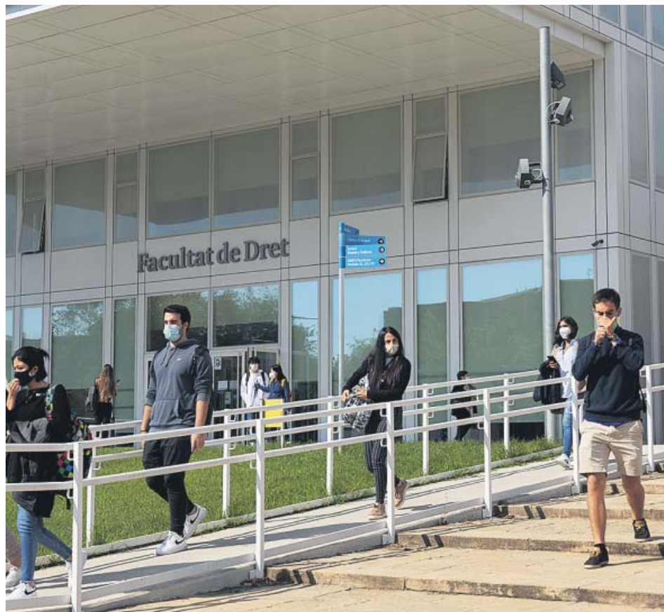
Acceso a la Facultad de Derecho de la Universitat de Barcelona, ayer.

harán clases virtuales entre mañana y el 2 de noviembre