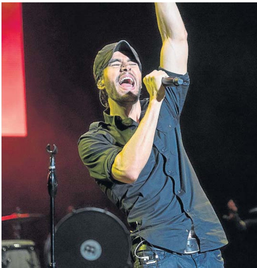
Enrique Iglesias, durante una actuación en 2018 en Nueva York (EE UU).