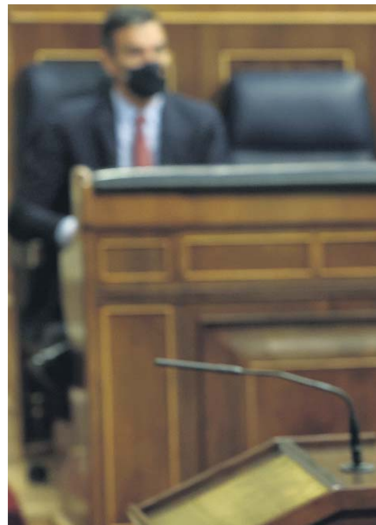
El candidato a la presidencia del Gobierno y presidente de Vox, Santiago

en 80 años». Es decir, peor que los de la dictadura de Francisco Franco, donde se encarcelaba y torturaba a opositores, los partidos políticos estaban prohibidos o los medios de comunicación y las manifestaciones artísticas estaban vigiladas por la censura. «Y quizá me quede cortó», reiteró.