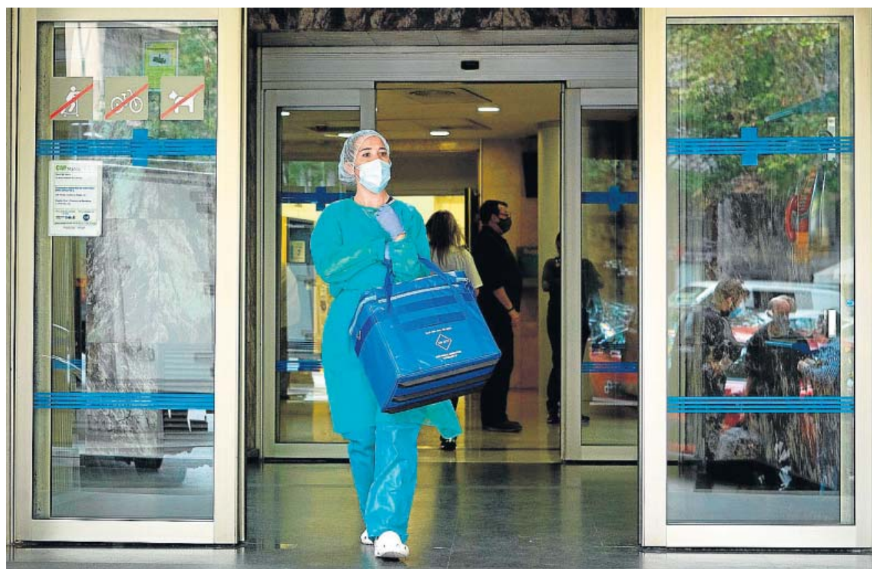
Una profesional sanitaria sale del Centro Atención Primaria (CAP) de Manso de Barcelona.

Sigue en nuestra web toda la información diaria sobre la pandemia de Covid-19.