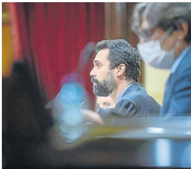
El president del Parlament, Roger Torrent, ahir al ple.

La comunicació es va publicar al Butlletí Oficial del Parlament i va activar el termini de dos mesos en què, si el pròxim 22 de desembre no hi ha hagut investidura, es convocarà la cita amb les urnes en 54 dies, el diumenge 14 de febrer. Tot seguit es van anar encadenant les intervencions