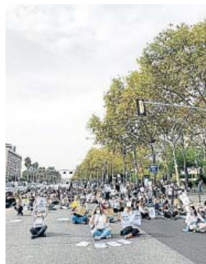
El sector de la estética cortó ayer la Diagonal.

La sección tercera de la sala contenciosa del TSJC desestimó ayer las peticiones de medidas cautelares so-