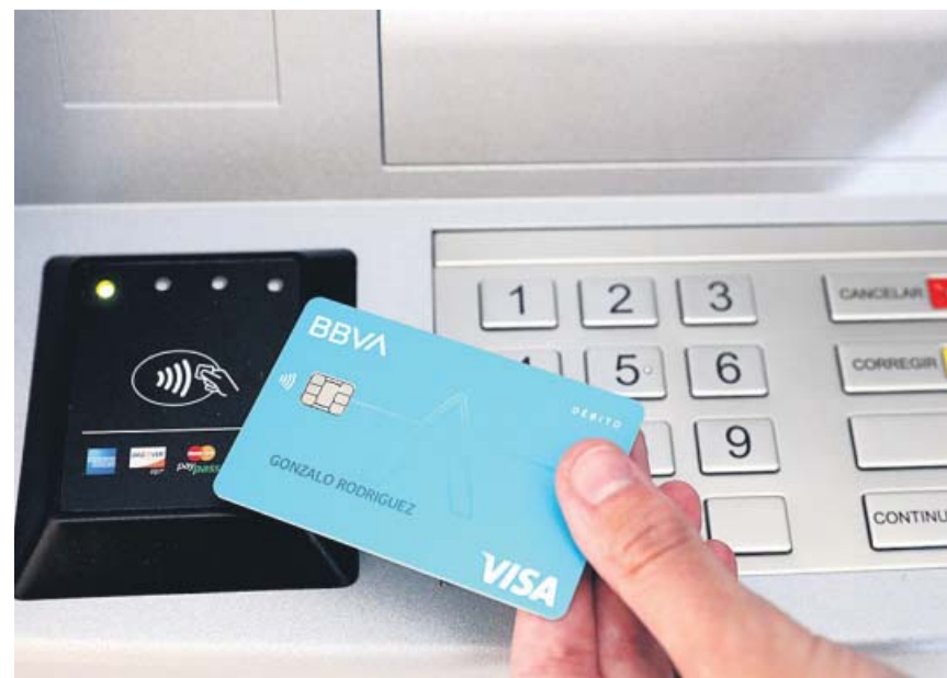
La nova targeta Aqua permetrà la retirada d'efectiu sense contacte als caixers. BBVA

Así, el conseller expuso que reservar espacios en el transporte público podría ser una de las soluciones para mantener este tipo de actividades, aunque todavía no se ha hecho ninguna petición oficial para estudiar la medida. ●