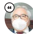
MANUEL CASTELLS Ministro de Universidades

«Algunas universidades han tenido que cerrar facultades y en cambio no se han cerrado los bares que había al lado»