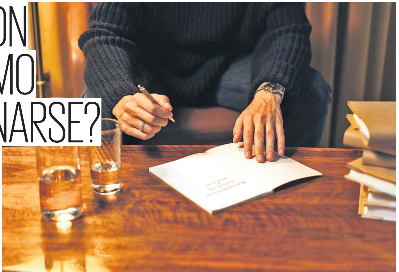
Una herencia 'envenenada' puede suponer pasar a asumir enormes deudas.

Aceptar una herencia supone adquirir los bienes de un ser querido. Pero, ojo, sus deudas también, lo que tiene riesgos