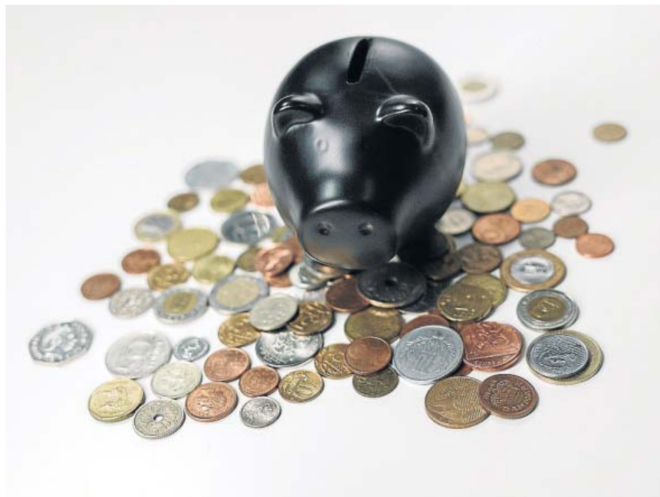
Los españoles están ahorrando como nunca por el temor al impacto del coronavirus.

IGNORAR EL IMPORTE MÁXIMO A REMUNERAR Los depósitos, además de exigir un importe mínimo, también remuneran hasta cierta cantidad, informan desde Helpmycash. Es importante tener en cuenta esta franja límite, pues toda cantidad que supere la establecida como máxima no generará beneficio alguno. En la mayoría de los casos, esta cifra se sitúa en los 100.000 euros, cifra que, además, se corresponde con la cobertura facilitada por FGD.