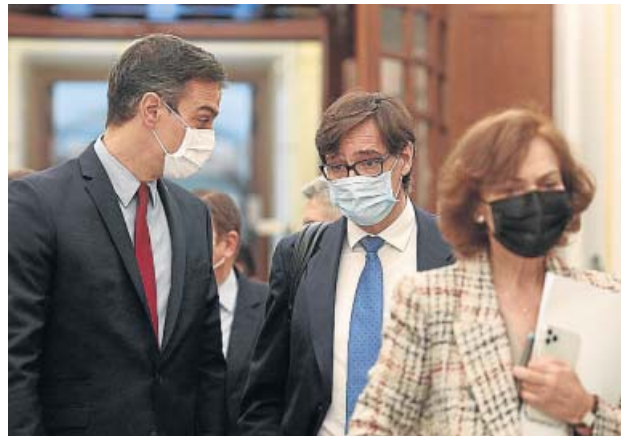
Sánchez junto a Illa, que pedirá hoy la prórroga al Congreso.

Será así porque el PSOE terminó aceptando una propuesta de ERC para que haya una comparecencia bimensual del presidente. Bildu presentó otra en el mismo sentido, por lo que ambos partidos salieron al res-