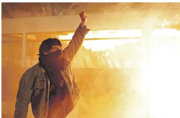
Una escena de la serie Patria . HBO