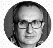
Por Alfred López

Mucho se está hablando de la conveniencia (o no) de restringir la libre circulación a determinadas horas de la noche. Esta medida se está denominando 'toque de queda' y originalmente tenía una estrecha relación con prohibiciones o restricciones en tiempos de guerra o bajo algún tipo de dictadura, además de los motivos de seguridad nacional.