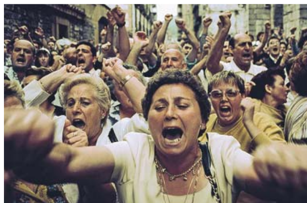
Imágenes de El instante decisivo . ATRESPLAYER PREMIUM