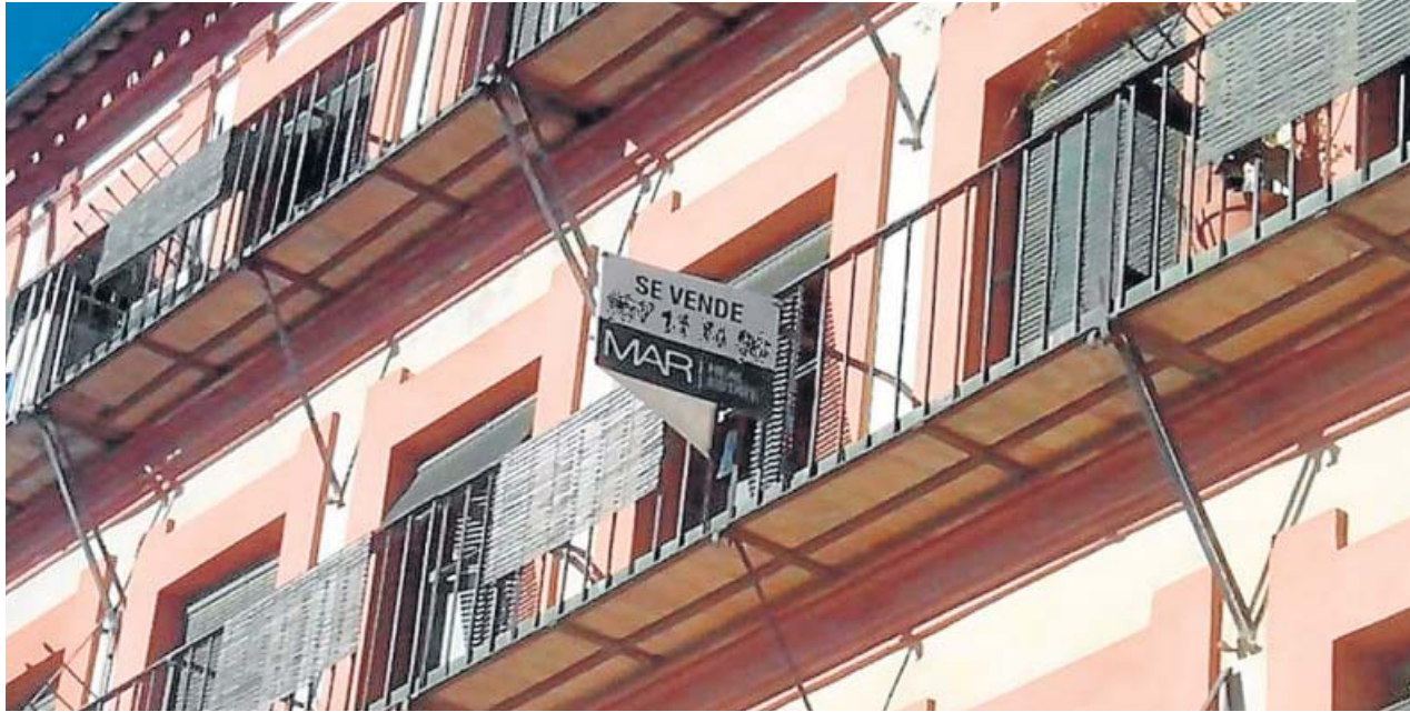
Un cartel de venta en el balcón de una vivienda de Madrid.