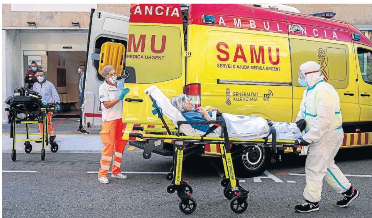
Personal sanitario trasladando a pacientes en el hospital Clínico de Valencia.

En cuanto a los datos proporcionados por Sanidad, las autonomías que más positivos registraron fueron, de nuevo, Cataluña (5.070), Madrid (2.670) y Andalucía (2.089). A ellas se añade esta vez la Comunidad Valenciana (1.605). No obstante, estos datos varían de los aportados por los gobiernos regionales. La Generalitat catalana redujo sus casos hasta los 4.672, además de comunicar 38 nuevos fallecidos. El gobierno de Isabel Díaz Ayuso notificó 2.728 contagiados -58 más que Sanidad- y 38 decesos. De entre los positivos, 1.340 se diagnosticaron en solo 24 horas, las del martes. En cuanto a los datos de la Junta de Andalucía, estos fueron un poco menores que los del ministerio, ya que informó de 2.042 casos (781 menos que el martes) y 33 fallecimientos. Y el Consell valenciano se acercó más a la cifra de Sanidad y notificó solo un positivo más, 1.606. Esta es la segunda cifra más elevada de toda la pandemia en la Comunitat, que lamentó siete fallecidos más. ●