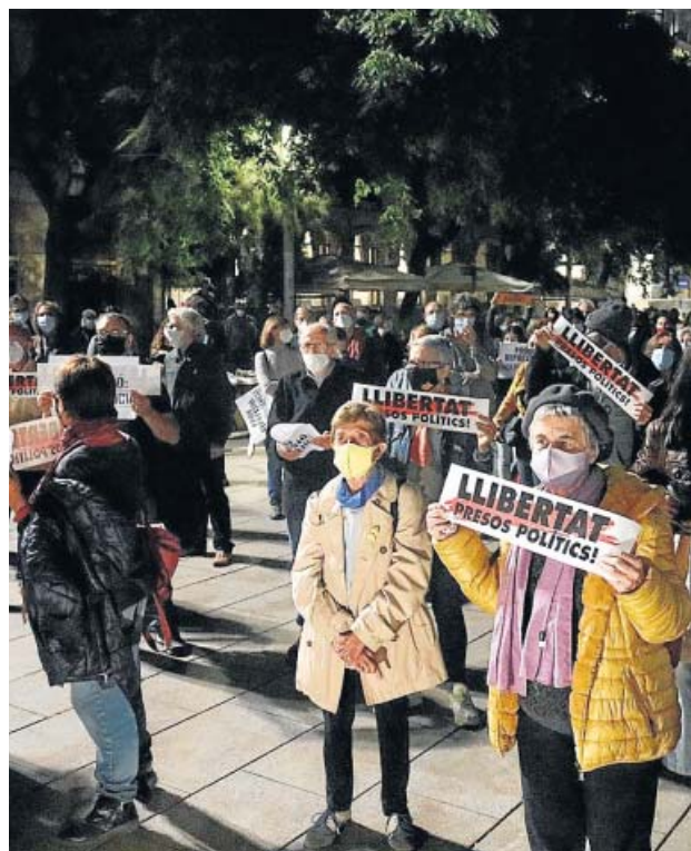
Una concentración ayer en Barcelona contra los arrestos.