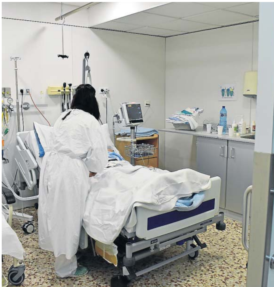
Un paciente es atendido en la UCI del Hospital Santa Caterina de Salt (Girona) el pasado martes.

Pero la incidencia acumulada de las últimas dos semanas es de 634,4 casos por cada 100.000 habitantes, más del doble que a primeros del mes de octubre. El riesgo de rebrote baja a 840 y la tasa de reproducción lo hace tímidamente hasta el 1,38. Sin embargo, todavía es pronto para analizar resultados del toque de queda pero no para denunciar que muchos ciudadanos hayan llenado parques y