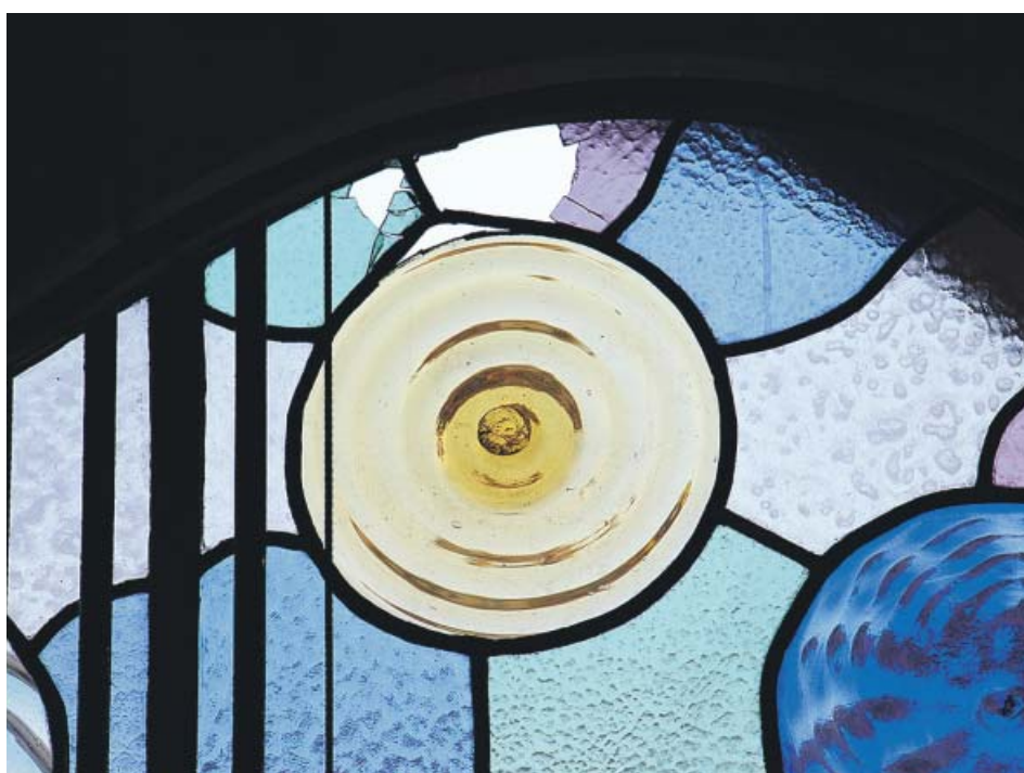
Vitrall de la Casa Batlló, recentment restaurat i trencat durant les protestes.

Les desavinences internes amb alguns dels treballadors de Staffpremium, que es troben de vaga indefinida, han derivat en destrosses intencionades i visibles en alguns elements patrimonials de l'edifici protegit,