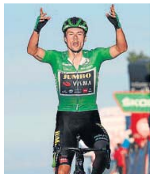
Roglic entra victorioso en la línea de meta.

Volvió Roglic, aunque no se había ido a pesar del despiste de Formigal con su chubas-