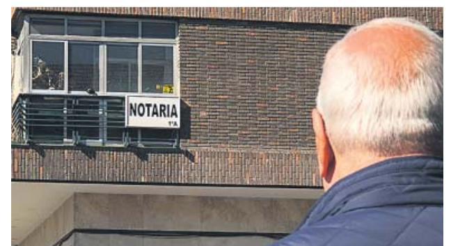
Un hombre observa una notaría de Madrid. JORGE PARÍS

Al respecto, agregan, que aunque no es necesaria la presencia del abogado en esta par-