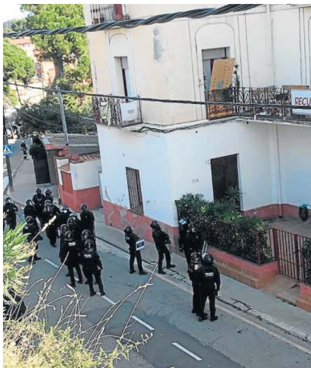
Agentes de Mossos en el exterior del inmueble.

Los Mossos ya intentaron desalojar anteriormente la Casa Buenos Aires, aunque sin éxito. Fue el pasado 15 de octubre cuando los agentes se