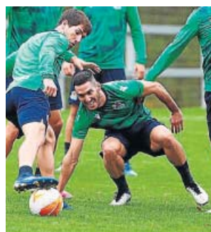
El entrenamiento de la Real, ayer.

Ganar al segundo clasificado de la Serie A italiana allanaría también mucho el camino a la