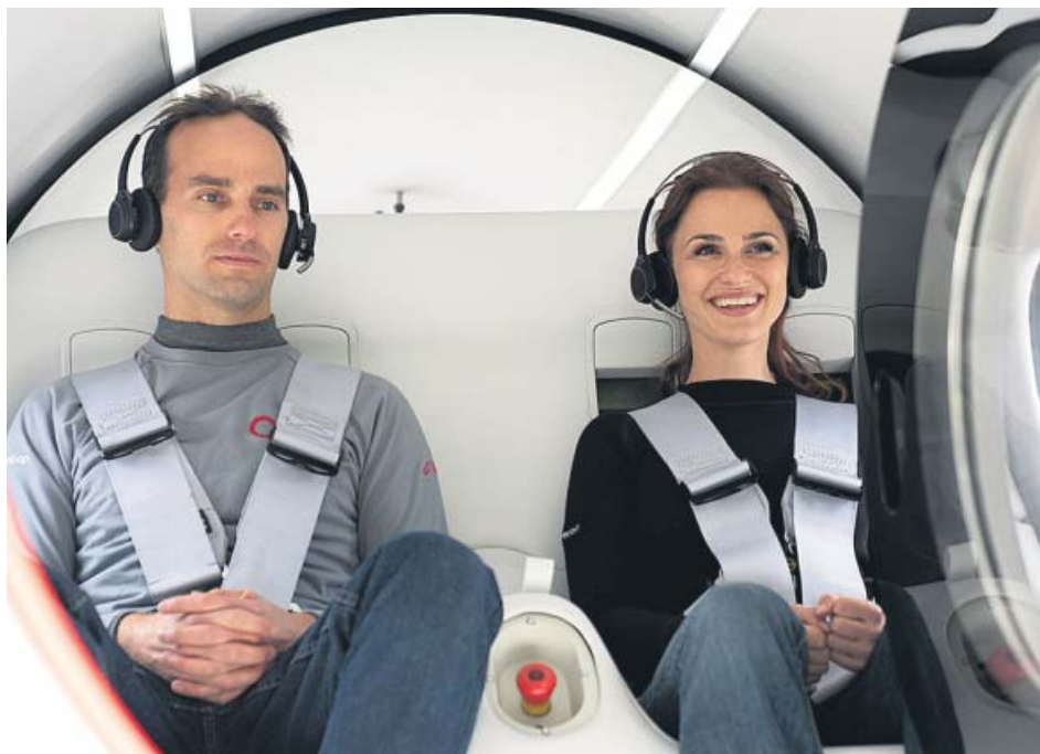
Virgin hace la primera prueba de Hyperloop con pasajeros.

El presidente canario, Ángel Víctor Torres, urgó ayer al Gobierno a «reaccionar» ante la incesante llegada de inmigrantes africanos a las islas, un fenómeno que desborda los mecanismos de respuesta.