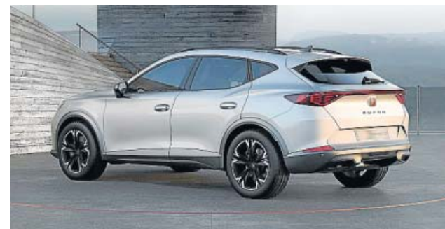
El motor es un 1.5 TSI de gasolina con 150 CV de potencia.

No es, ni mucho menos comparable al Formentor de 310 caballos, pero las prestaciones son interesantes: pasa