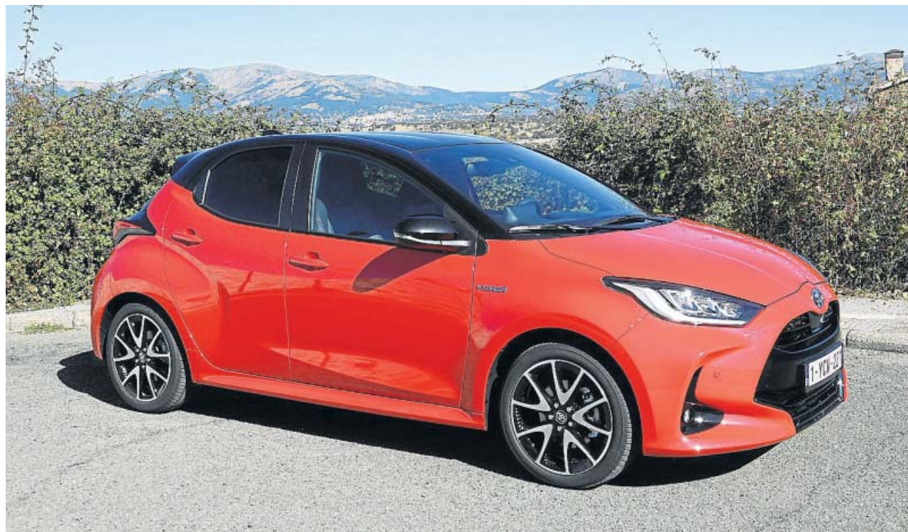
El color rojo y negro es exclusivo del acabado Style Premier Edition que hemos tenido oportunidad de probar.

A bajas velocidades –y hasta 130 km/h– manda el motor eléctrico, ideal para moverse por ciudad, a lo que también contribuye el pequeño tamaño del Yaris y su extraordinaria capacidad para maniobrar.