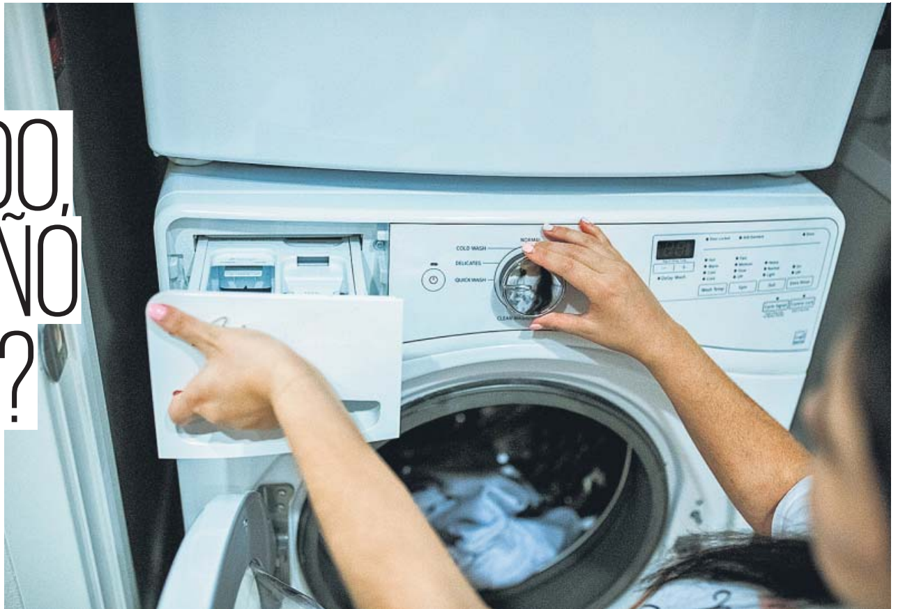
La avería de electrodomésticos puede generar tensión entre caseros e inquilinos por quién asume el coste de la reparación.

Las reparaciones de electrodomésticos suelen generar conflictos entre caseros e inquilinos. ¿Qué dice la ley?