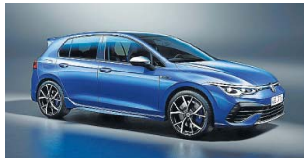
La aerodinámica y la suspensión han sido mejoradas.

Volkswagen ha presentado la que de momento será la versión más deportiva y capaz del Golf de octava generación, la R. Esta variante, que se podrá reservar en nuestro país en pocas semanas pero que no estará en los concesionarios hasta principios de 2021, cuenta con un motor turboalimentado de gasolina de dos litros de cubaje y 320 caballos de potencia, que se asocia a un cambio automático DSG de 7 velocidades