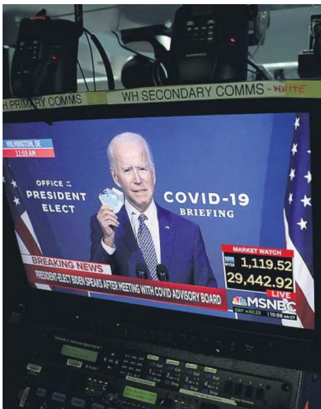
Biden compareció ayer para explicar su plan antiCovid.

Biden centra sus primeras horas como presidente electo en diseñar una clara estrategia contra el coronavirus