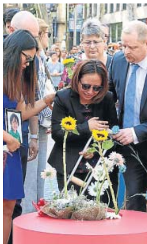
Ofrenda floral de familiares de las víctimas del 17-A.

Los seis supuestos autores tanto del atropello masivo en la Rambla de Barcelona como en el paseo marítimo de la localidad tarraconense de Cambrils murieron abatidos por