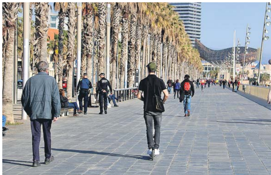
Las palmeras del Passeig Marítim de Barcelona.

Tras la muerte de un hombre en agosto en el parque de la Ciutadella de Barcelona a causa de la caída de una palmera datilera, el Ajuntament modificará la forma de revisarlas. Si hasta el momento los equipos técnicos hacían una evaluación visual bianual –en el marco del Plan de gestión del riesgo del arbolado–, ahora también realizarán un «análisis instrumental» que servirá para auscultar el tronco. Además, las someterán a una prueba de oscilación, es decir, las moverán para comprobar si se balancean de una forma normal. Si el resultado de alguno de estos dos exámenes no es positivo, se realizará «una re-