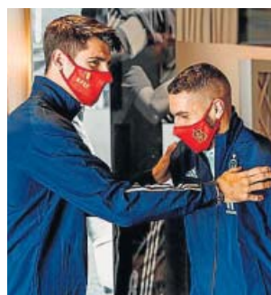
Morata y Koke, antiguos compañeros, se saludan.

Países Bajos y los duelos correspondientes a la Liga de Naciones frente a Suiza y Alemania. España parte en la primera posición del grupo 4 de la Liga A con siete puntos, uno más que Alemania y Ucrania y cinco más que Suiza. En sus siguientes compromisos, los hombres