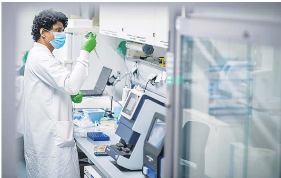
Un técnico del laboratorio alemán BionTech, que desarrolla la vacuna junto a Pfizer. BIONTECH SE 2020

LA DISTRIBUCIÓN será el gran reto, ya que la vacuna requiere ser almacenada a una temperatura de -70 °C