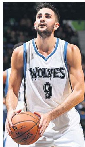
Ricky Rubio en un partido con los Wolves en 2015.

Los Timberwolves eligieron a Rubio en el año 2009, en el número 5 del draft , aunque el español no llegó hasta 2011. Jugó seis temporadas en Minneapolis con sabor agri dulce, pues se consagró como un gran base pero a su vez nunca llegó a jugar los playoffs .