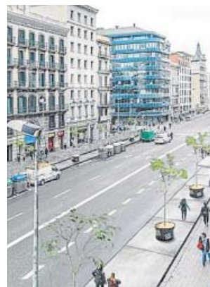
Así quedará la calle tras su remodelación.

Como primer paso, este jueves el consistorio detalló las obras que le competen íntegramente a él: la ampliación de las aceras, que pasarán de