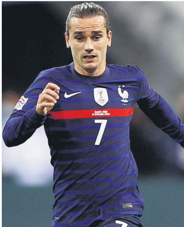
Leo Messi antes de un partido con Argentina (izq.) y Antoine Griezmann jugando con la selección francesa.