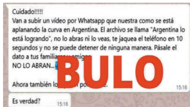
Mensaje alertando de un falso virus en WhatsApp. MALDITA.ES

Circulan cadenas que advierten de virus falsos que pueden piratear el móvil en segundos y generan alarma en el usuario