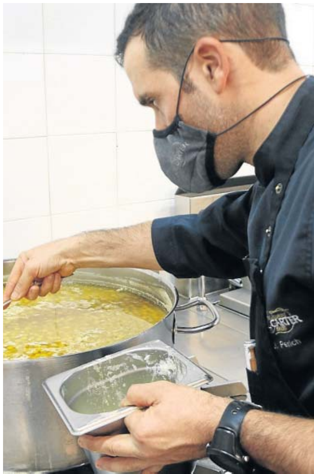
Un restaurante de Mura (Bages) prepara comida para llevar. A.G.N.

Seguirán cerrados los espacios infantiles lúdicos interiores, bingos, casinos y salas de juego y fiestas mayores. Los actos religiosos seguirán restringidos a un 30% del aforo así como la actividad social, acotada a un máximo de seis personas. Lo mismo que el toque de queda noc-