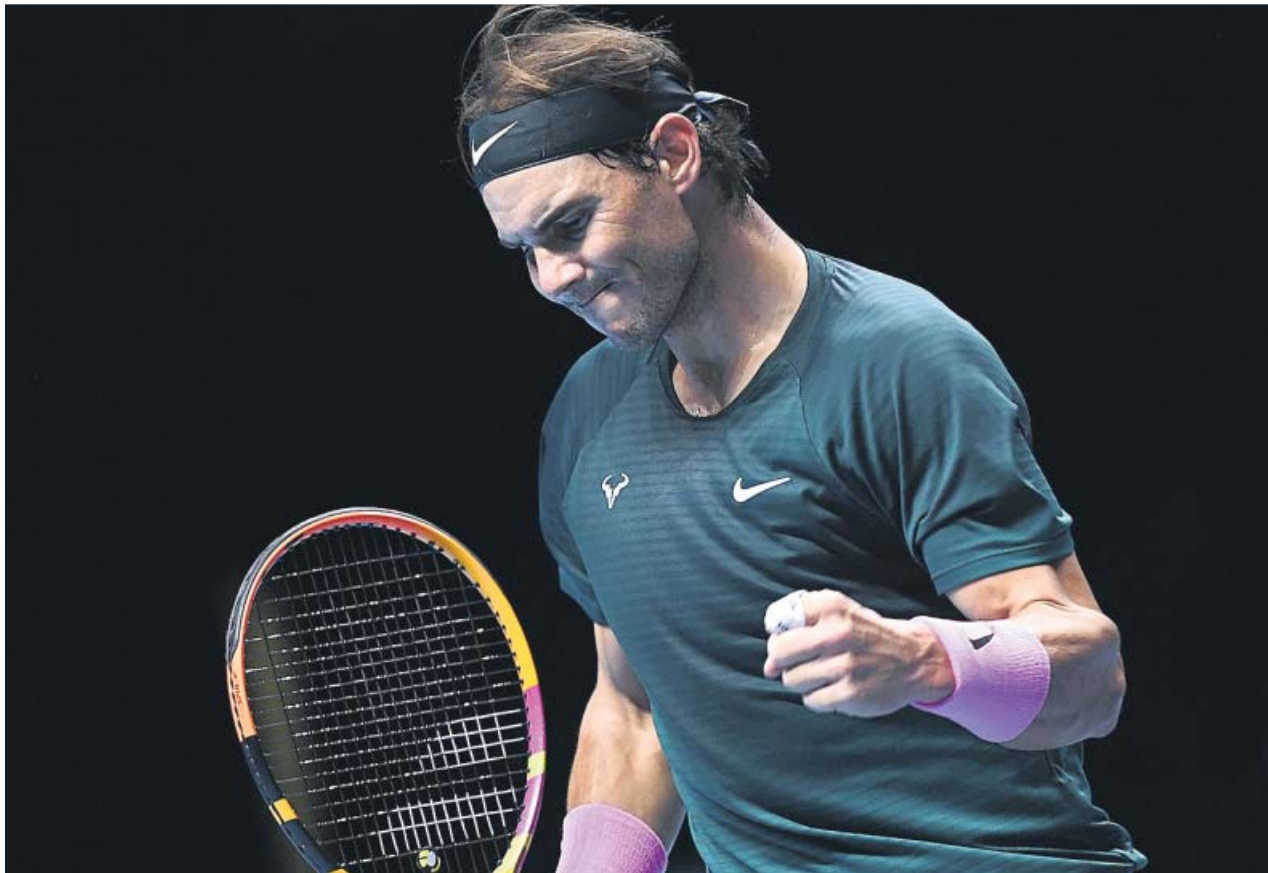
Nadal celebra uno de los puntos durante el partido de ayer. ANDY RAIN