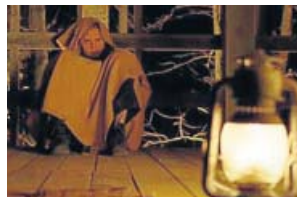
'El bosque' LA 1. 01.15 H

Los miembros de una pequeña comunidad rural de Covington, Pensilvania, viven aterrorizados debido a unas desconocidas criaturas que habitan en los bosques de su alrededor. Drama que explora una sociedad autárquica y encorsetada.