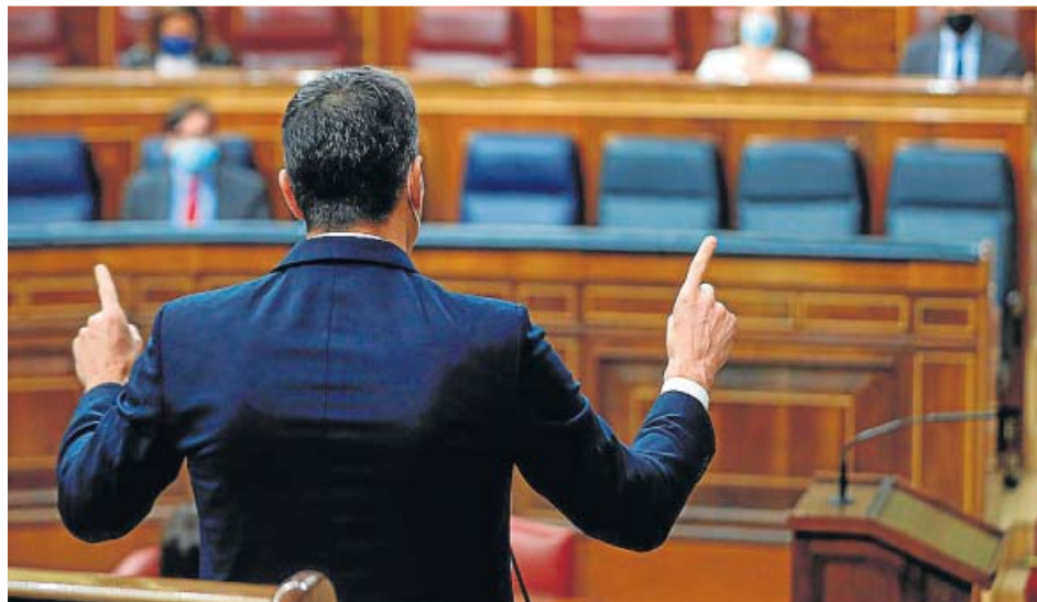
El presidente del Gobierno, Pedro Sánchez, en el Congreso.

En este contexto es en el que Sánchez envió ayer una carta a la militancia del PSOE, en la que acusó a los «adversarios del Gobierno progresista» de «desviar la atención hacia polémicas artificiales y noticias inventadas». Sánchez comparó las críticas contra su pacto con Bildu con el «populismo reaccionario» que se ha visto en Estados Unidos. «Crea en primer lugar fake news , noticias falsas que presenta como hechos para desacreditar a sus adversarios», explicó Sánchez a la militancia, a la que advirtió que «no es casual» que en lugar de estar hablando de las cuentas pa-