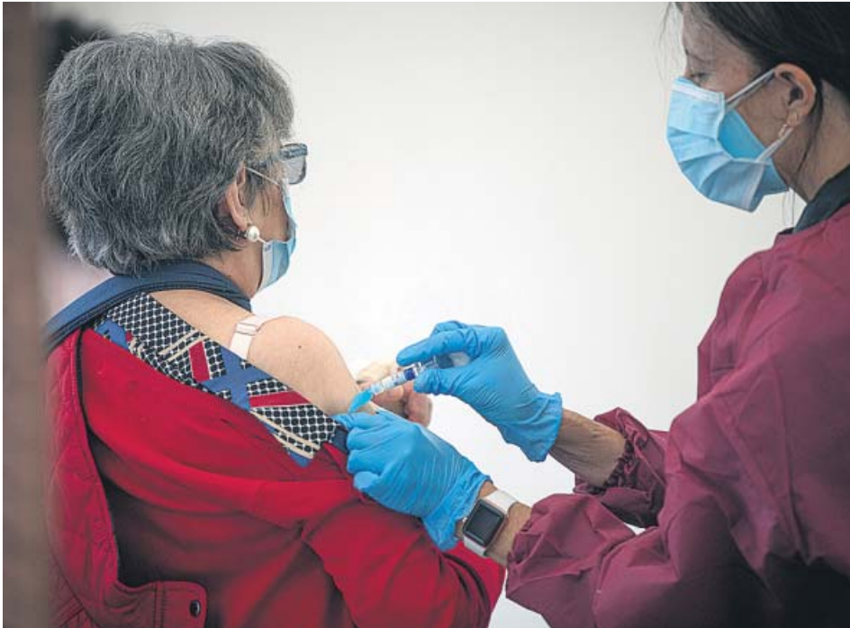
Los mayores serán uno de los grupos que primero se vacunarán por ser más vulnerables.