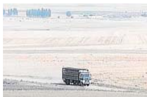
Los camioneros LA 2. 14.00 H

Patchy el Pirata se dispone a presentar un episodio nunca visto de Bob Esponja, pero tiene un problema: no hay cinta. Bob Esponja está pescando medusas cuando se da cuenta de que él quiere volar. Aventuras en el fondo del Pacífico.