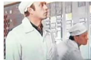
REPORTAJES Chernóbil, 30 años después DMAX. 02.35 H

2016 marca 30 años desde el peor accidente nuclear de la historia, en Chernóbil, Ucrania. Este especial analiza el legado de una catástrofe que afectó a millones de vidas.