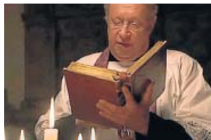
Padre Brown PARAMOUNT. 15.30 H

El padre Brown, famoso personaje de ficción de las historias de G. K. Chesterton, es un cura con un talento innato en la resolución de crímenes. Octava temporada de la nueva versión de la serie de televisión de la década de los 70.