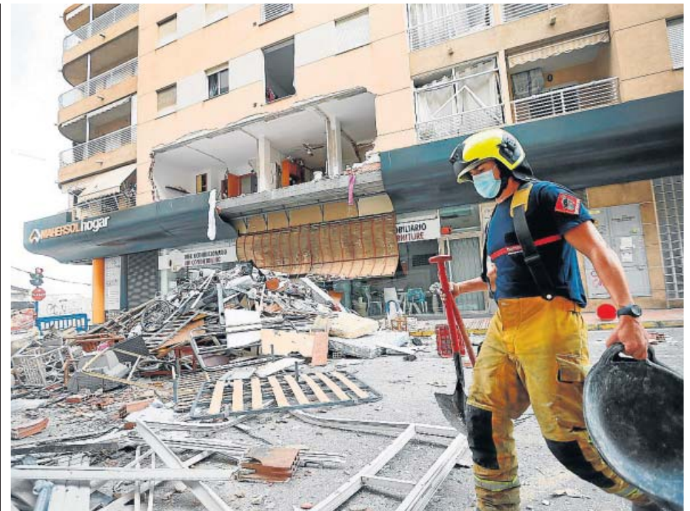
La explosión de Torre Vieja dejó una gran cantidad de escombros.

Como puedes ver, hay decenas de bulos que alertan falsamente de virus que en realidad no existen, pero eso no quiere decir que haya que despreocuparse de esas amenazas. Nunca facilites información personal o te descargues ningún archivo que provenga de un remitente desconocido, y sigue siempre las recomendaciones de seguridad de la Oficina de Seguridad del Internauta (OSI). ●