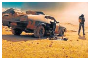
'Mad Max, furia en la carretera' NEOX. 22.00 H

Años treinta. Guy Malone, un profesor irlandés, sale con Gilda Bessé, una fotógrafa de moda (Charlize Theron), y ambos comparten apartamento en París con Mia, una refugiada gitana española. Guy y Mia van a España en la Guerra Civil.