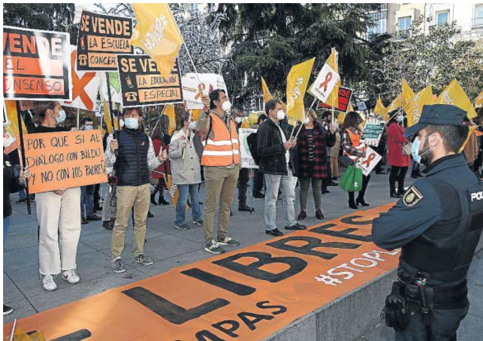
Concentración en el Congreso de colectivos de la educación concertada contra la ley Celaá. EP