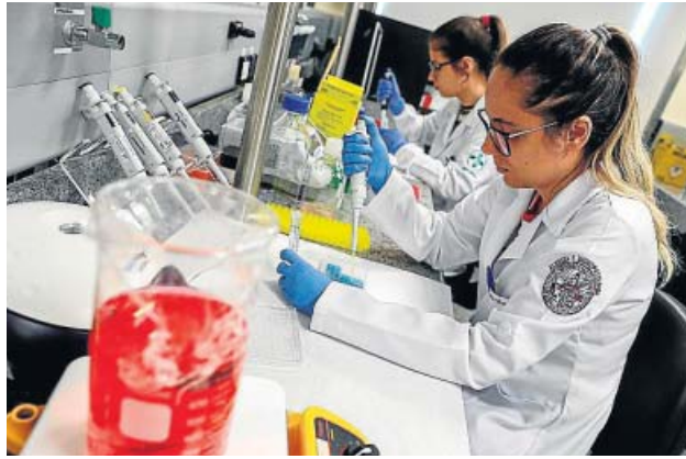
Un equipo de investigadoras desarrollando una vacuna.

Desde que la Covid-19 cambió nuestra forma de vivir, una de las grandes preguntas ha sido: ¿cuánto tiempo dura la inmunidad? Al principio se hablaba de un 'pasaporte' de tres meses; más tarde parecía que menos, según reveló la tercera oleada del estudio de seroprevalencia llevado a cabo en España; hace un mes, otro trabajo volvió a arrojar esperanza y apuntaba a al menos siete meses. Ahora, una nueva investigación, la más ambiciosa hasta la fecha en este campo —según los autores—