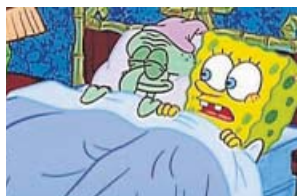
Bob Esponja CLAN. 14.03 H

El padre Brown, famoso personaje de ficción de las historias de G. K. Chesterton, es un cura con un talento innato en la resolución de crímenes. Octava temporada de la nueva versión de la serie de televisión de la década de los 70.