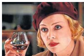
'Juegos de mujer' BOM. 22.01 H

Los miembros de una pequeña comunidad rural de Covington, Pensilvania, viven aterrorizados debido a unas desconocidas criaturas que habitan en los bosques de su alrededor. Drama que explora una sociedad autárquica y encorsetada.