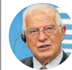
JOSEP BORRELL Alto representante de la UE para Asuntos Exteriores

«Daremos respuesta a la brutalidad de las autoridades, en apoyo de los derechos del pueblo bielorruso»