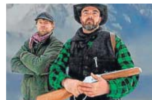
AVENTURAS Mountain men MEGA. 14.20 H

Uno de los formatos más queridos por la audiencia, con 20 años de historia en la televisión española. Se trata de uno de los concursos más potentes a nivel internacional, presentado por Roberto Leal.