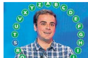
CONCURSO Pasapalabra ANTENA 3. 20.00 H

2016 marca 30 años desde el peor accidente nuclear de la historia, en Chernóbil, Ucrania. Este especial analiza el legado de una catástrofe que afectó a millones de vidas.