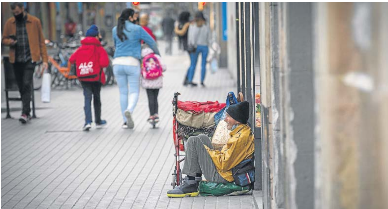
Una persona sin hogar permanece en el suelo de una calle cercana a la parroquia de Santa Anna, en Barcelona.