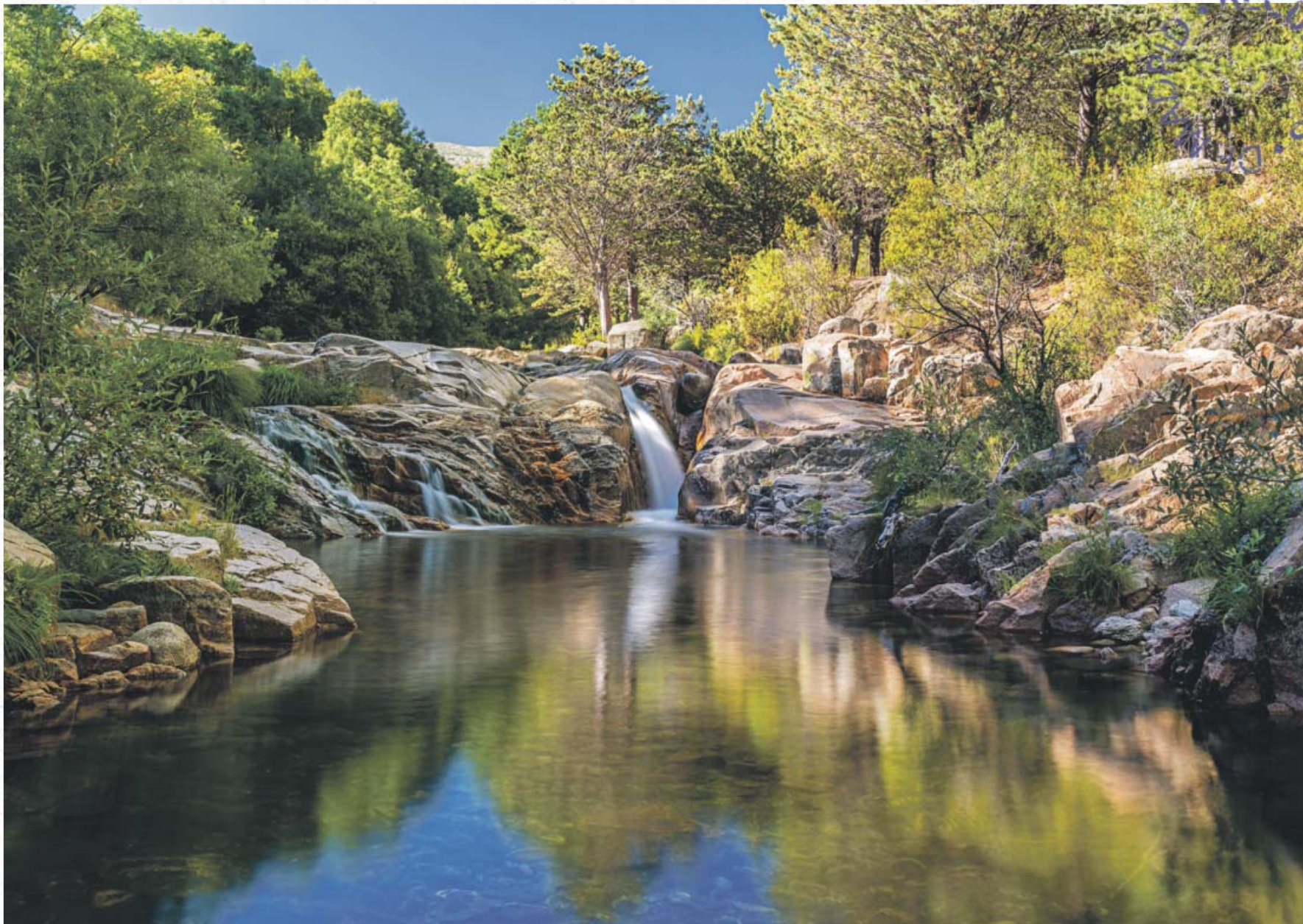
*LA PEDRIZA, PARQUE NACIONAL DE LA SIERRA DE GUADARRAMA.