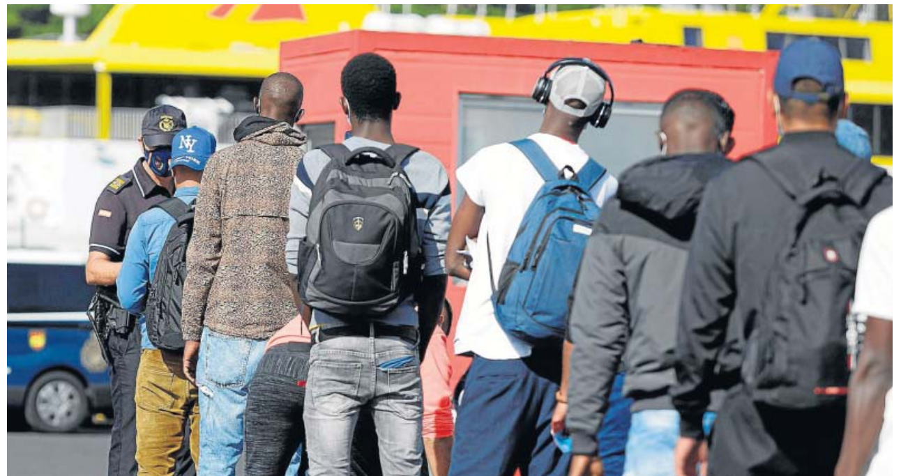
La Policía Nacional pide la documentación a algunos de los migrantes llegados estos días en pateras y cayucos.

«Me ha llamado a las seis de la mañana el alcalde de Santa Cruz, José Manuel Bermúdez, para manifestarme que ayer por la noche 200 inmigrantes fueron trasladados a Tenerife y que iban a embarcar en un barco a Huelva y por instrucciones el ministro del Interior, Fernando Grande-Marlaska, y la delegación del Gobierno se lo han impedi-