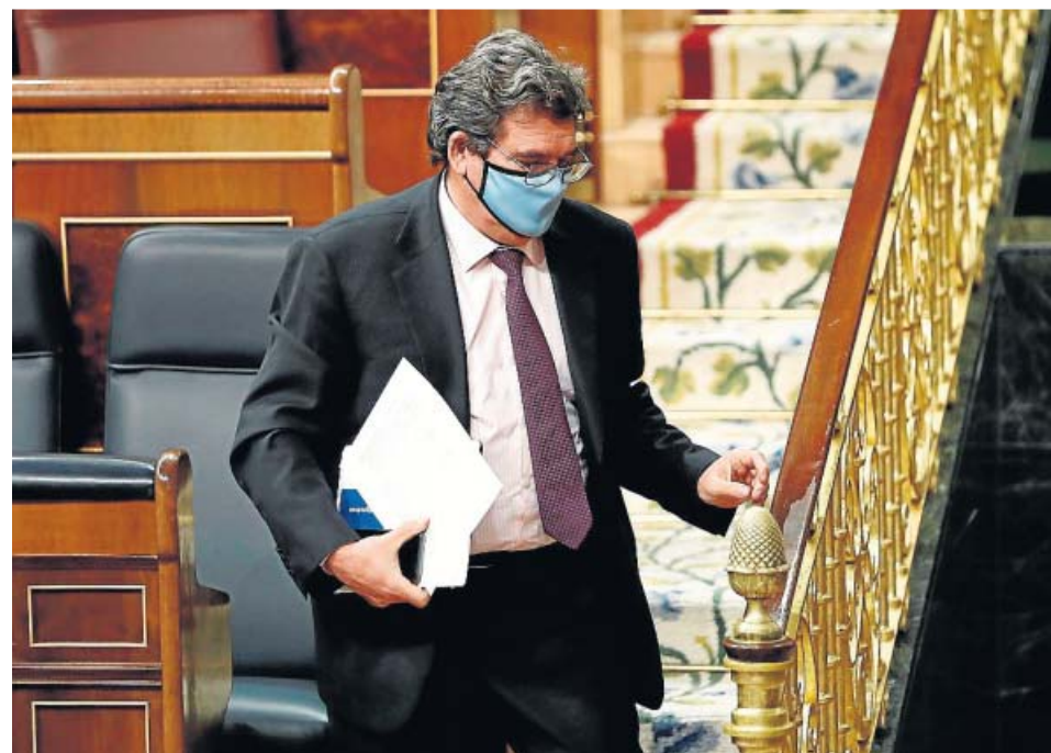
El ministro de Seguridad Social, José Luis Escrivá, ayer en el Congreso.

Estos partidos presentaron votos particulares para tratar de enmendar las recomendaciones, al igual que hicieron PP, Cs, Junts, Más País y Compromís, que no obstante sí votaron a favor del texto. El PP buscaba suprimir la crítica recogida a la gestión de los planes privados de pensiones, que pide más transparencia, y rechazaba que se plantee «eliminar» o «reducir» sus deducciones fiscales. Por su parte, Cs quería que se impulsara la posibilidad de trabajar y cobrar pensión a la vez. No obstante, ninguno de los votos particulares fue aceptado. ●