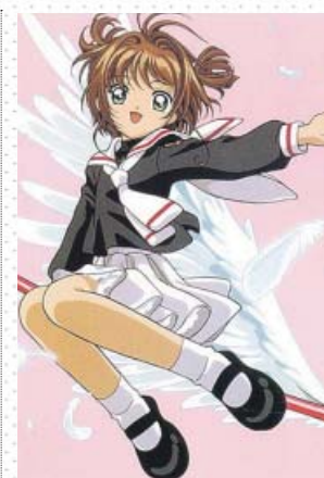
Sakura Kinomoto es la protagonista del anime.

franquicia, es parte de su encanto), sino por la guerra que enfrenta a los fans ya veinteañeros de show contra los viejales que aún juramos por Sailor Moon . Pese a ello, y aunque servidor quiere a Usagi Tsukino como a una hermana, tiene que admitirlo: con su mezcla de drama, fantasía y jovialidad, esta serie es una introducción perfecta para que hijos, sobrinos o hermanos pequeños (o uno mismo, qué diantre) descubran los placeres de la animación japonesa.