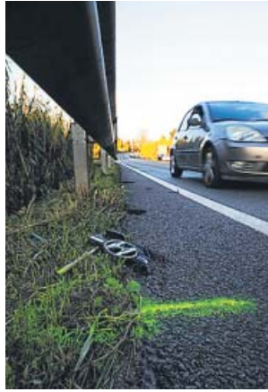
Vista del lugar donde los ciclistas fallecieron.

Los Mossos d'Esquadra recibieron el aviso del acciden-