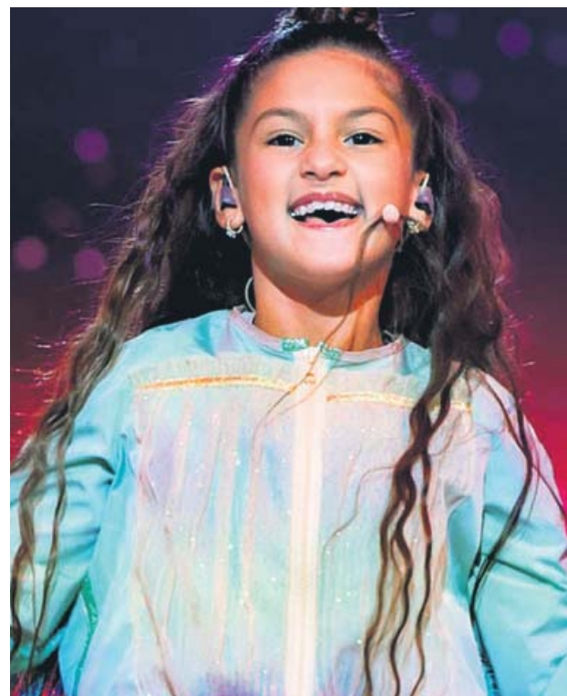
La sevillana interpreta Palante en 'Eurojunior'.