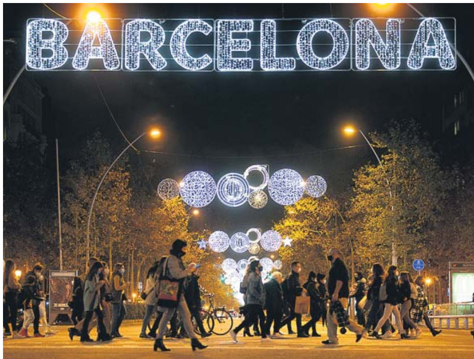
La campaña de Navidad arrancó el jueves en Barcelona con el alumbrado navideño.

LA NAVIDAD preocupa por una posible relajación social como la vivida este pasado fin de semana LAS MEDIDAS deben seguir para evitar un repunte, según los expertos, que prevén que llegue una 3.ª ola LA VACUNACIÓN de la mayor parte de la población se hará en verano, cuando se relajarían restricciones