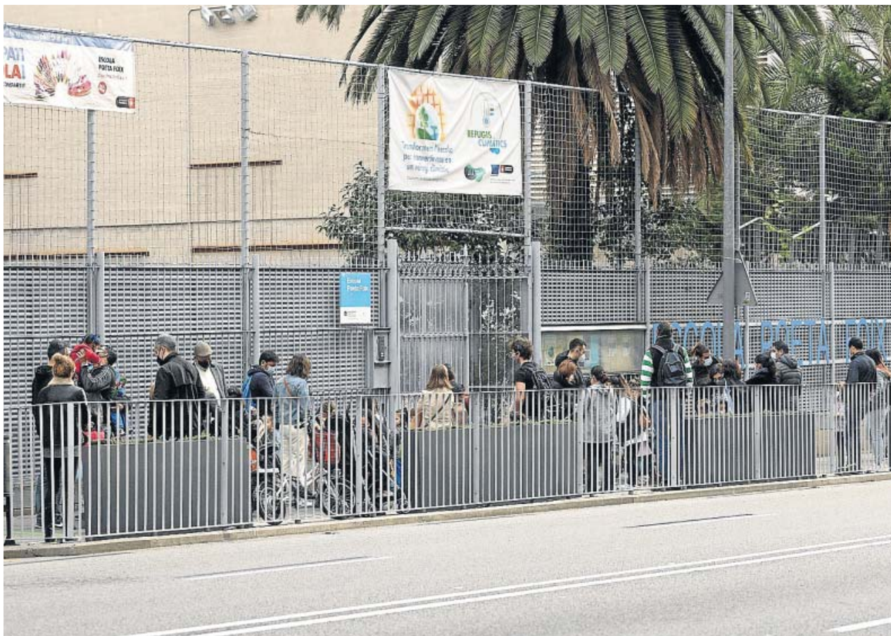
Padres esperan a que sus hijos salgan de la escuela Poeta Foix de Barcelona. MIQUEL TAVERNA