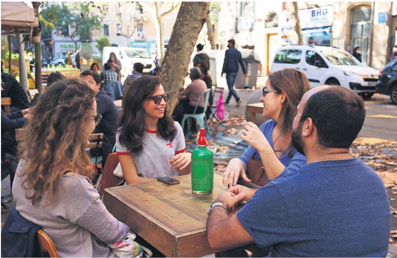
Un grupo de amigos, ayer, en una terraza de la calle Parlament de Barcelona.