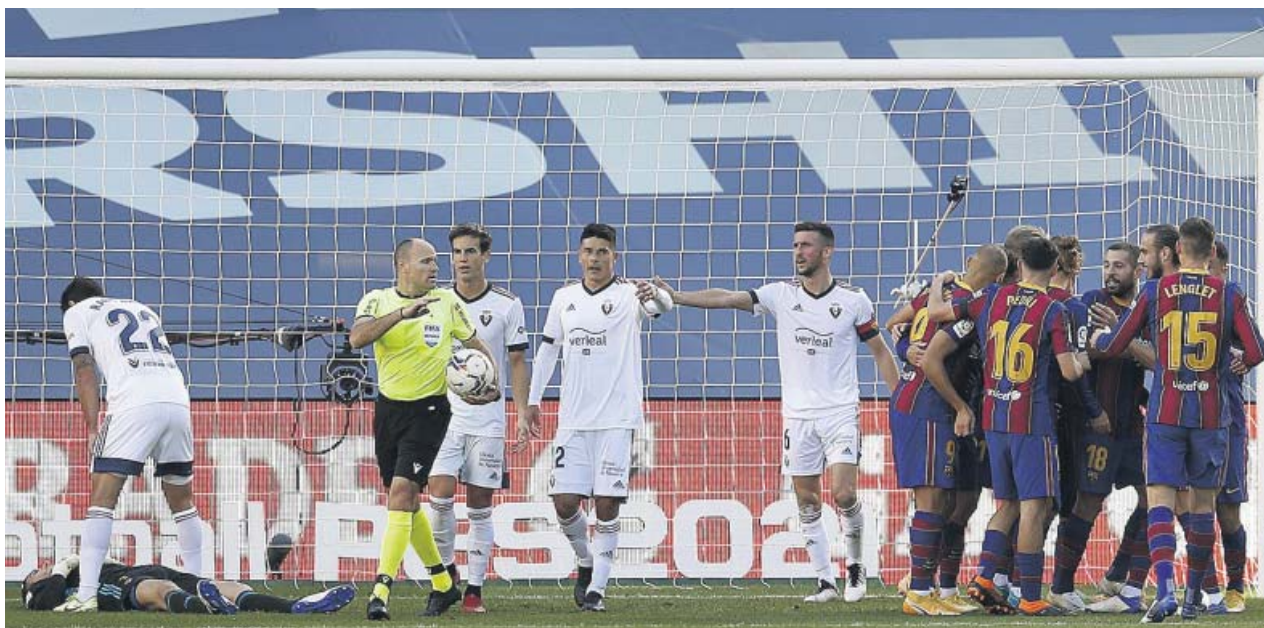
Los jugadores del FC Barcelona celebran el primer gol durante el partido de la undécima jornada frente a Osasuna.

★ Champions League ▲ Europa League ▼ Desciende a segunda