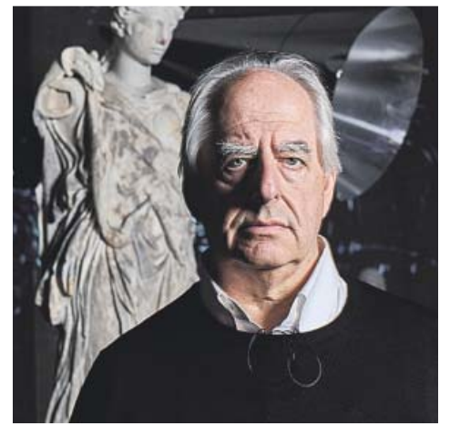
Retrato de William Kentridge.