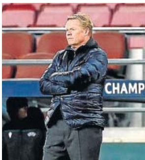
Koeman, técnico del Barça, en un partido de Champions.

Los condicionantes del sorteo evitarán enfrentamientos entre clubes de la misma federación y entre los que hayan coincidido ya en la fase de grupos. Así, Barça, Atlético de Madrid y Sevilla se enfrenta-