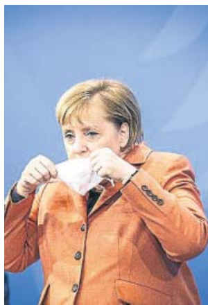
Angela Merkel, ayer.

Los comercios serán los mayores perjudicados en las nuevas medidas: solo los esenciales permanecerán abiertos.