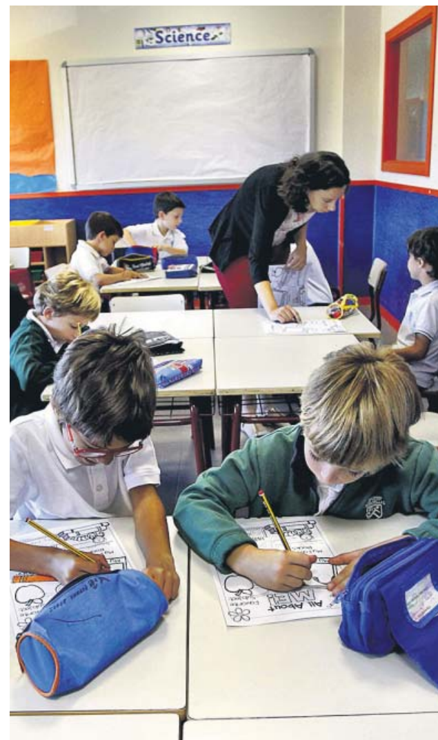
Imagen de archivo de una clase de Primaria.

Otra de las comunidades gobernadas por los populares es Andalucía. Allí, solo se pronunció ayer al respecto la secretaria general de PSOE-A, Susana Díaz, que confía en que su presidente, Juanma Moreno, no cometa la «aberración de vender» la educación pública de la comunidad a Pablo Casado con el fin de «confrontar». Lo hizo a través de Twitter, donde además dijo que para ella el presidente de la Junta de Andalucía «ya ha dado sobradas muestras de no creer en la escuela pública, pero aún puede superarse» si hace lo mismo que Ayuso. ●