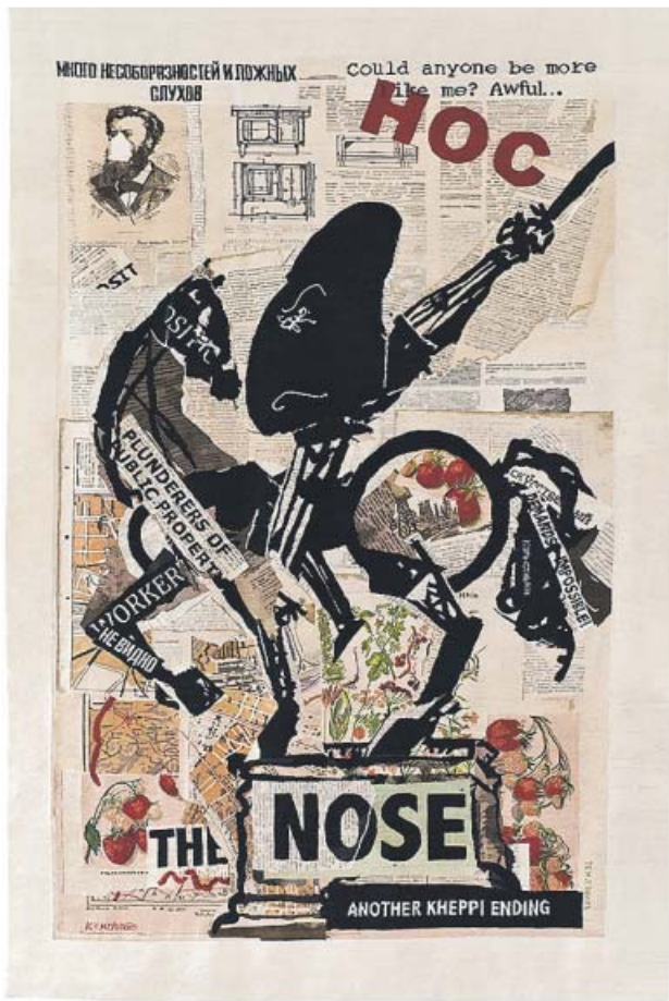
'Nose (with Strawberries)', 2012.