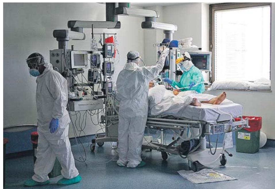
Un paciente de Covid es atendido en la UCI del hospital Ramón y Cajal de Madrid.

Los tiempos de la epidemia —que provocan que bajen antes los contagios y las hospitalizaciones leves que las graves y los fallecimientos— sugieren que las UCI se seguirán vaciando al menos mientras la incidencia siga bajando. Lo que no