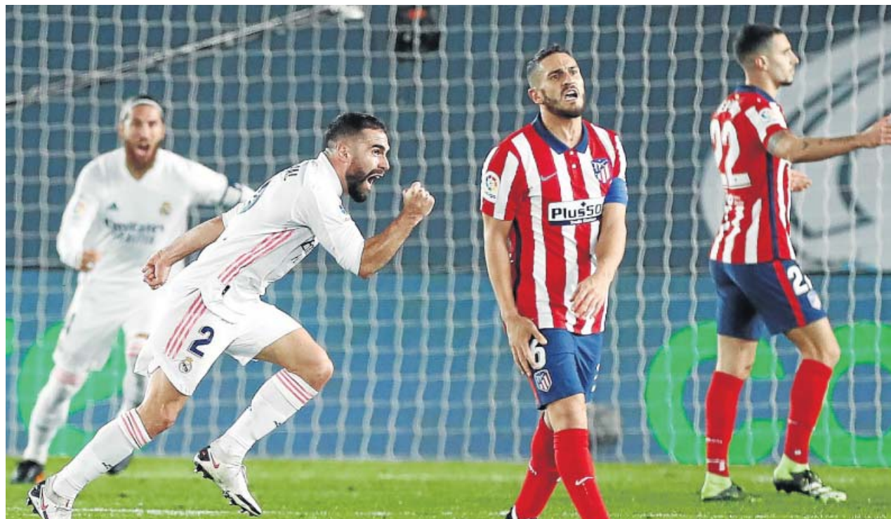
Dani Carvajal celebra el segundo gol del Real Madrid al Atlético ante la frustración de Koke.

Tras el descanso, Simeone movió el banquillo y cambió la disposición táctica, pero la superioridad madridista, sin ser tan manifiesta, continuó. Derrotado después de 26 jornadas invicto en la Liga y siete triunfos seguidos, los datos re-