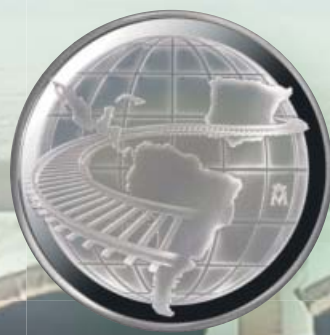
MEDALLA CONMEMORATIVA DE PLATA