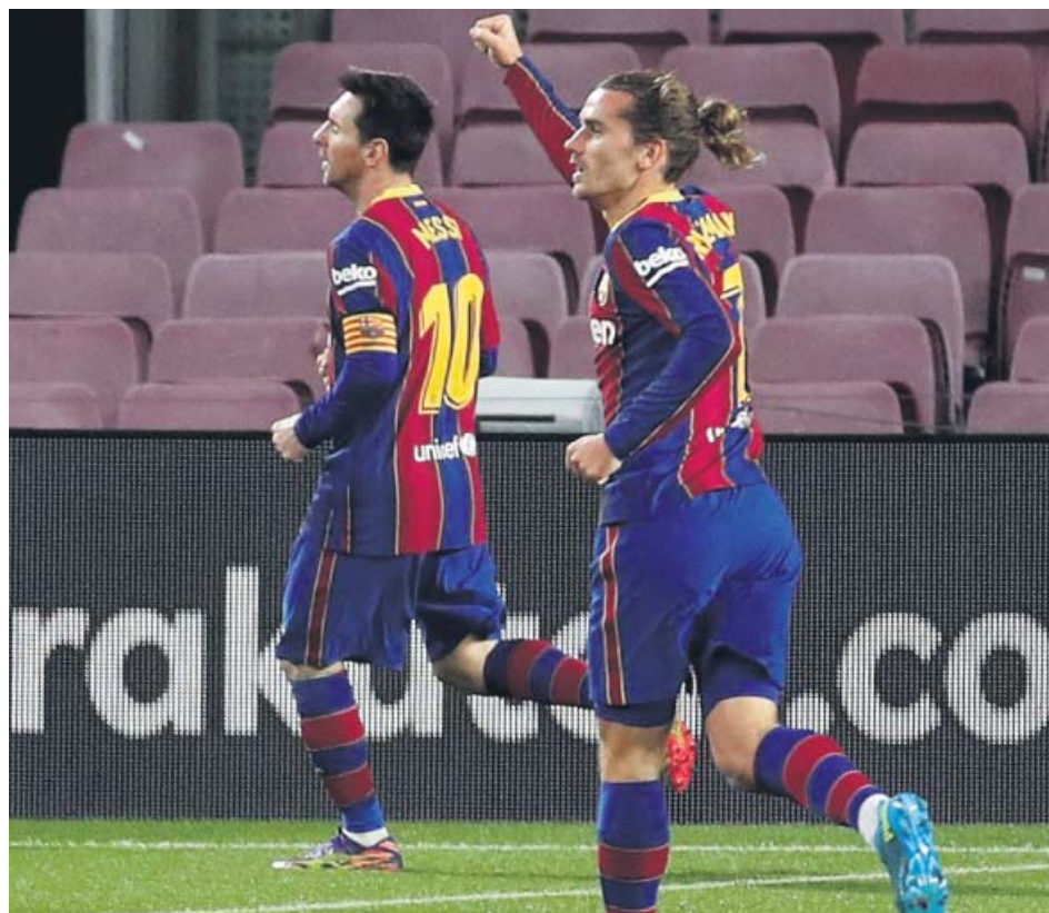
Griezmann y Messi celebran el gol del argentino al Levante.

UN GOL del argentino en el tramo final del partido salvó a los culés, que siguen sin convencer con su juego EL LEVANTE plantó cara y estuvo a punto de llevarse algo positivo del Camp Nou KOEMAN salva, de momento, su semana más complicada. Pero el miércoles tiene un duro examen ante la Real Sociedad