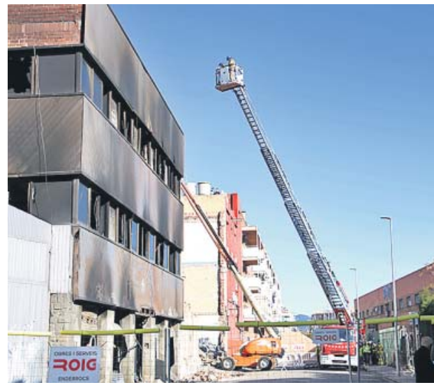
Bomberos inspeccionado ayer el derribo de la nave.

El ayuntamiento dará cobertura a las personas afectadas por el siniestro pero, aclarando, que una vez se dé por acabada la situación de emergencia, los okupantes «no tendrán ningún de-