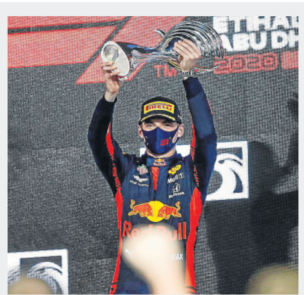
Max Verstappen, en el podio de Abu Dabi.

Y precisamente Ferrari es, seguramente, el equipo más feliz por haber terminado un Mundial nefasto para sus intereses, pues solo ha podido ser el sexto constructor de la parrilla: su peor resultado en los últimos 40 años. El GP de Abu Dabi fue el reflejo de su temporada, con Sebastian Vettel y Charles Leclerc fuera de los puntos, y doblados. Mucho trabajo tienen en Maranello para revertir la situación este invierno. ●