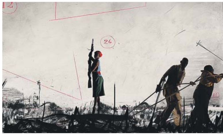
'More Sweetly Play the Dance', 2015. CORTESÍA DEL ARTISTA

La obra de Kentridge se ha expuesto desde los 90 en museos de todo el mundo, entre ellos el MoMa de Nueva York, el Louvre de París y el Reina Sofía de Madrid. Su estética está influida por el cine y su evolución desde el stop-motion a los efectos especiales. ●