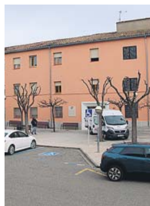
La residencia de Tremp en la que han fallecido 49 internos.

Asimismo, en las últimas 24 horas se han declarado 1.213 nuevos casos positivos confirmados de coronavirus me-