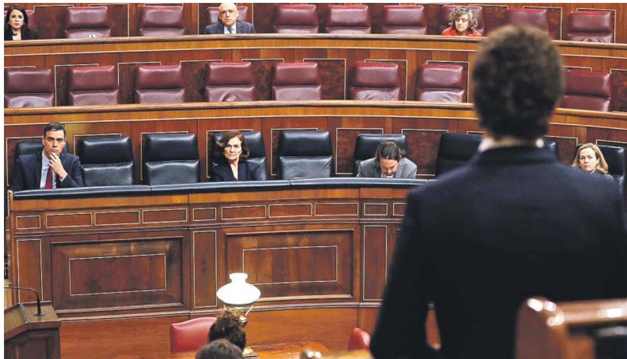
El líder del PP, Pablo Casado, interviene en el Congreso ante la mirada del Gobierno y el grupo socialista.

Pese a que el Ejecutivo paralizó en octubre su polémica propuesta de reforma del método de elección de los miembros del CGPJ —que buscaba que bastara para ello la mayoría absoluta de las Cortes y no la de tres quintos que es necesaria ahora—, el PP ha seguido negándose a pactar el reparto del órgano con el PSOE si Unidas Podemos no quedaba excluido de la negociación. Habida cuenta de esta actitud, la formación morada ha exigido que esa reforma se ponga en marcha de nuevo. Pero solo ha conseguido que los socia-