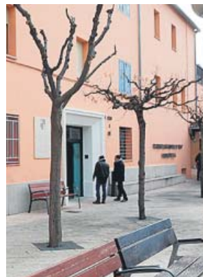
Residencia Fiella.

«Actuamos desde el primer día con una labor de acompañamiento a la dirección de la residencia, que era la responsable de aplicar los protocolos», señaló, y añadió que el cambio de gestora ocurrió el día 28 al ver que la residencia no podía asumir la gestión de este brote por el alto número de positivos entre la dirección y los trabajadores. Desde