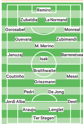
Camp Nou Hoy, 21 horas

(sin los técnicos) se convirtió este año en comida por los protocolos Covid, pero para el neerlandés lo importante es resaltar que hay muy buen ambiente en la plantilla culé.