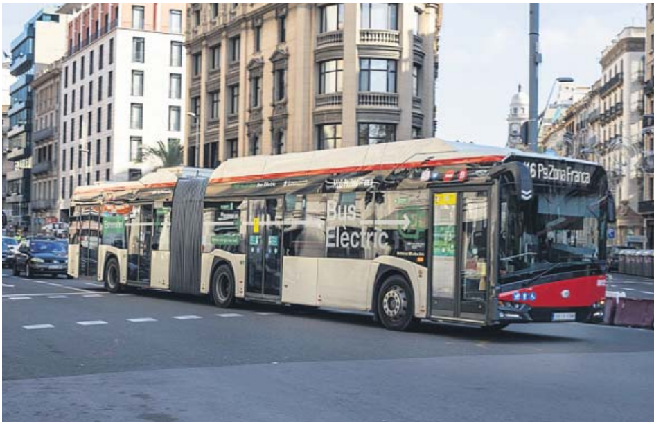
Un autobús eléctrico de Transportes Metropolitanos de Barcelona (TMB). HUGO FERNÁNDEZ