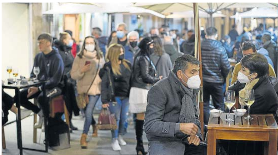
Ciudadanos en la terraza de un bar de Lugo. EP

Fuente: Ministerio de Sanidad Gráfico: Carlos G. Kindelán