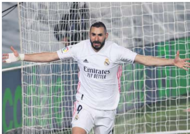
Benzema celebra su primer gol ante el Athletic.

El partido se encaminaba empapado al descanso cuando un trallazo de Kroos lo desatascó. El