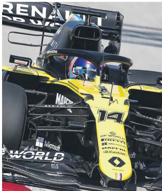
Fernando Alonso, durante las pruebas de ayer.

TEST El piloto asturiano marcó el mejor tiempo en su primer día de pruebas en Abu Dabi 100 VUELTAS Alonso exprimió su bólido e incluso superó a los pilotos en pruebas de Mercedes