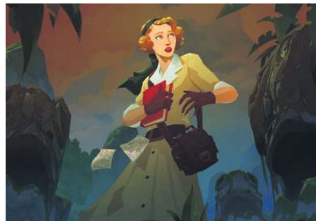
Norah, protagonista de Call of the Sea . OUT OF THE BLUE

Call of the Sea es una aventura narrativa de puzzles al estilo de los clásicos de hace décadas. Para superar los retos que plantea, el jugador ha de pensar desde diferentes perspectivas e investigar los escenarios para averiguar cómo avanzar. Este juego de exploración y fantasía le da una vuelta a los relatos de ciencia ficción del autor Lovecraft, aunque se aleja del terror y los monstruos y se enfoca más en las historias oníricas