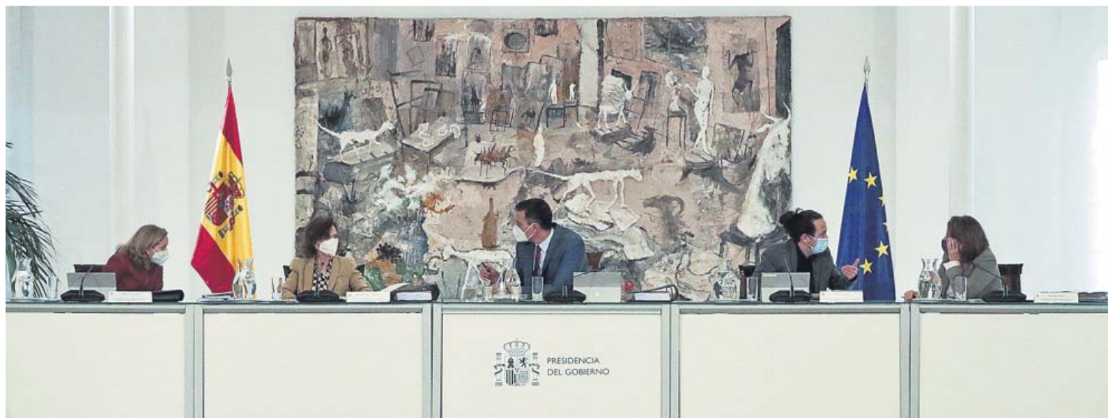
El presidente Pedro Sánchez rodeado de los cuatro vicepresidentes: de izquierda a derecha, Nadia Calviño, Carmen Calvo, Pablo Iglesias y Teresa Ribera.