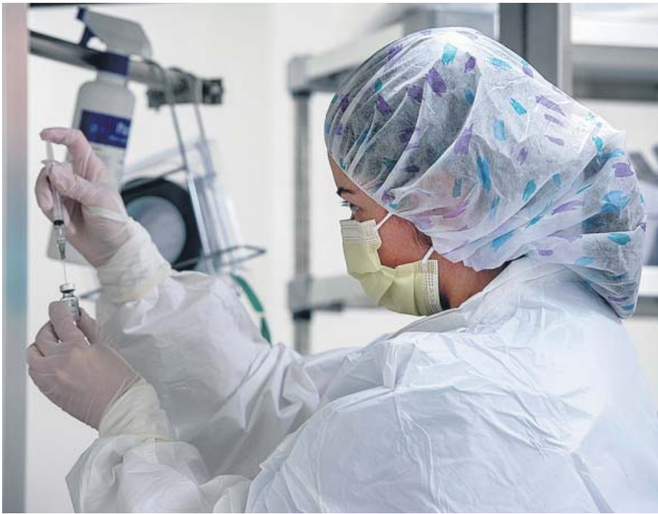
Una sanitaria prepara una vacuna de Pfizer en Estados Unidos.

La Agencia Europea del Medicamento se reunirá el 21 de diciembre y la Comisión dará luz verde en los «siguientes días»