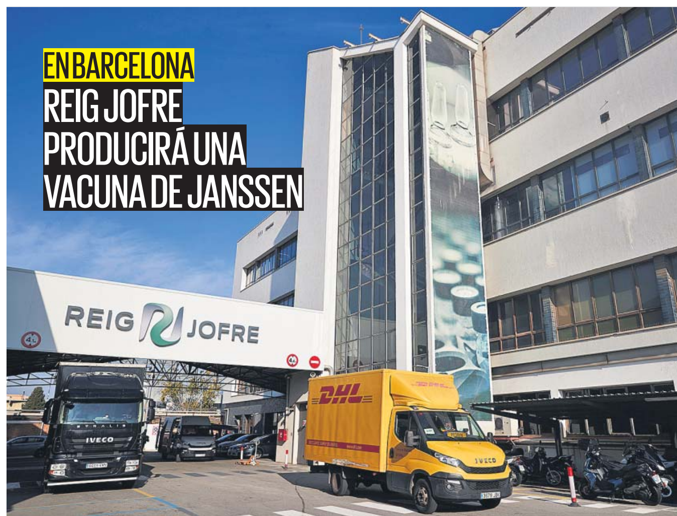
La planta farmacéutica de Sant Joan Despí. PÁGINA 4