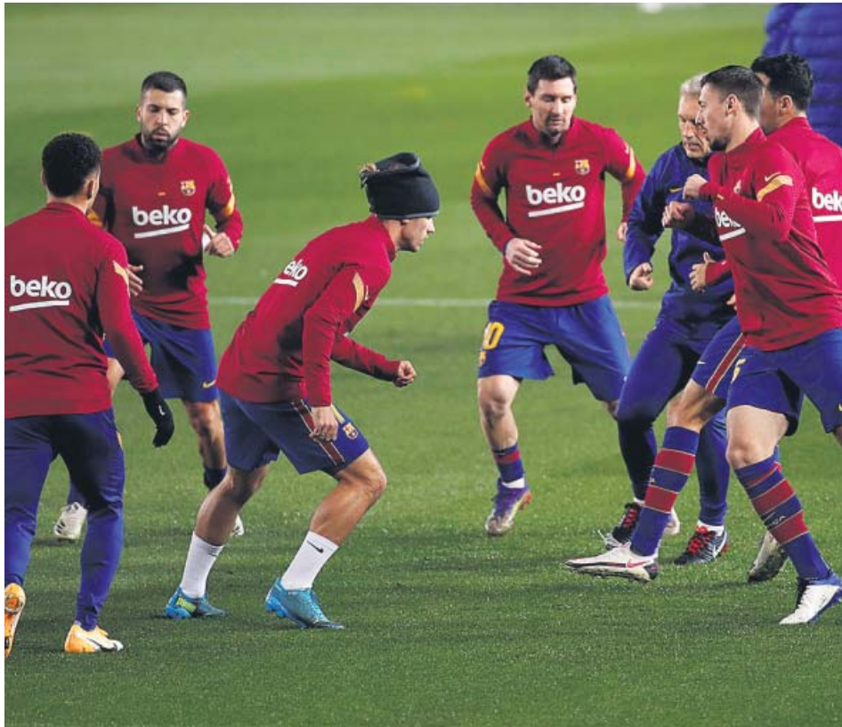
Entrenamiento del FC Barcelona en Sant Joan Despi.