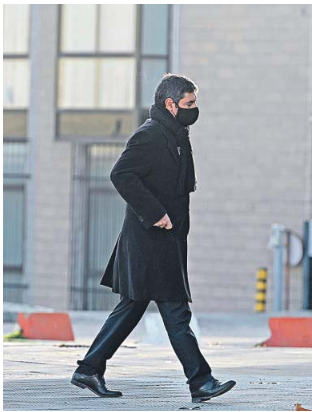
El mayor Trapero entrando ayer en la Audiencia Nacional.

«Ya estaba satisfecho por lo que se hizo y, hoy, especialmente porque han aportado pruebas que ayudarán al tribunal para dictar la sentencia» de este «gran juicio», comentó Trapero al término de la sesión judicial.