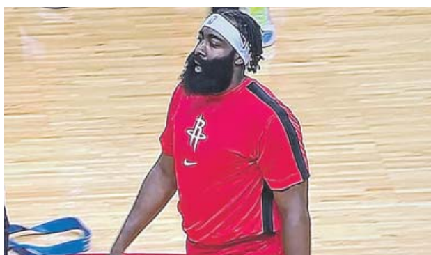
James Harden Quiere un traspaso. Ayer apareció pasado de peso