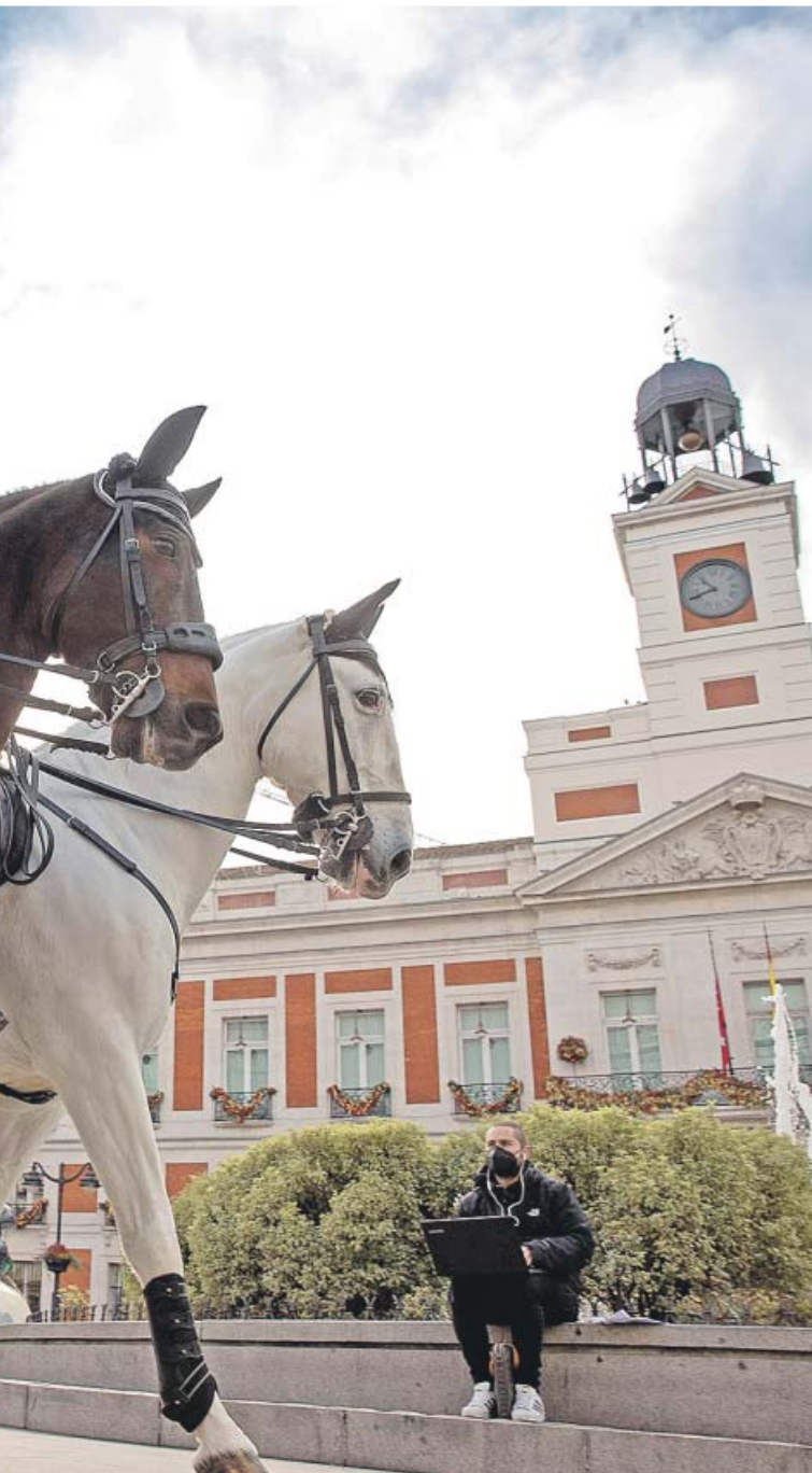
leña Puerta del Sol para evitar aglomeraciones.

gunas que, como Canarias y Baleares, «habían tenido una evolución muy positiva».