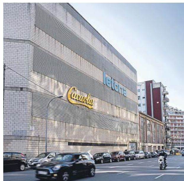
La fachada de la fábrica de Cacaolat en la calle Pallars. HUGO FERNÁNDEZ

El edificio actual data del año 1955 y fue construido por