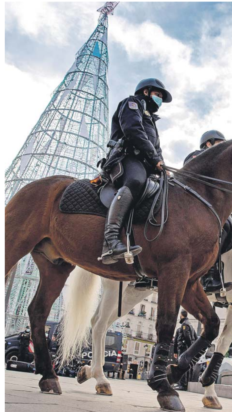
La Policía Nacional se desplegará durante las fiestas navideñas en la madr...

Ante esta situación, Illa y los consejeros analizarán la situación «día a día», de manera que en cualquier momento se po-