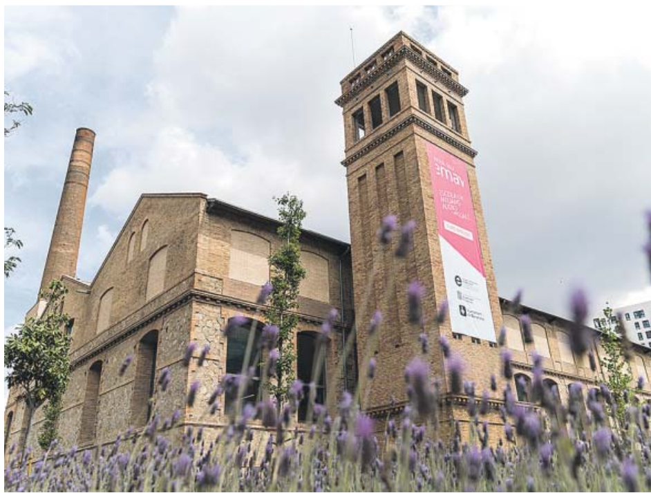
La naturaleza se extenderá en Can Batlló, que dotará a Sants-Montjuïc de más verde.

Esta primera parte de los trabajos servirá para construir 26.000 metros cuadrados de parque y costará 12,3 millones de euros, de los que 5,2 los aportarán los propietarios de las parcelas privadas del ámbito en concepto de las cargas urba-