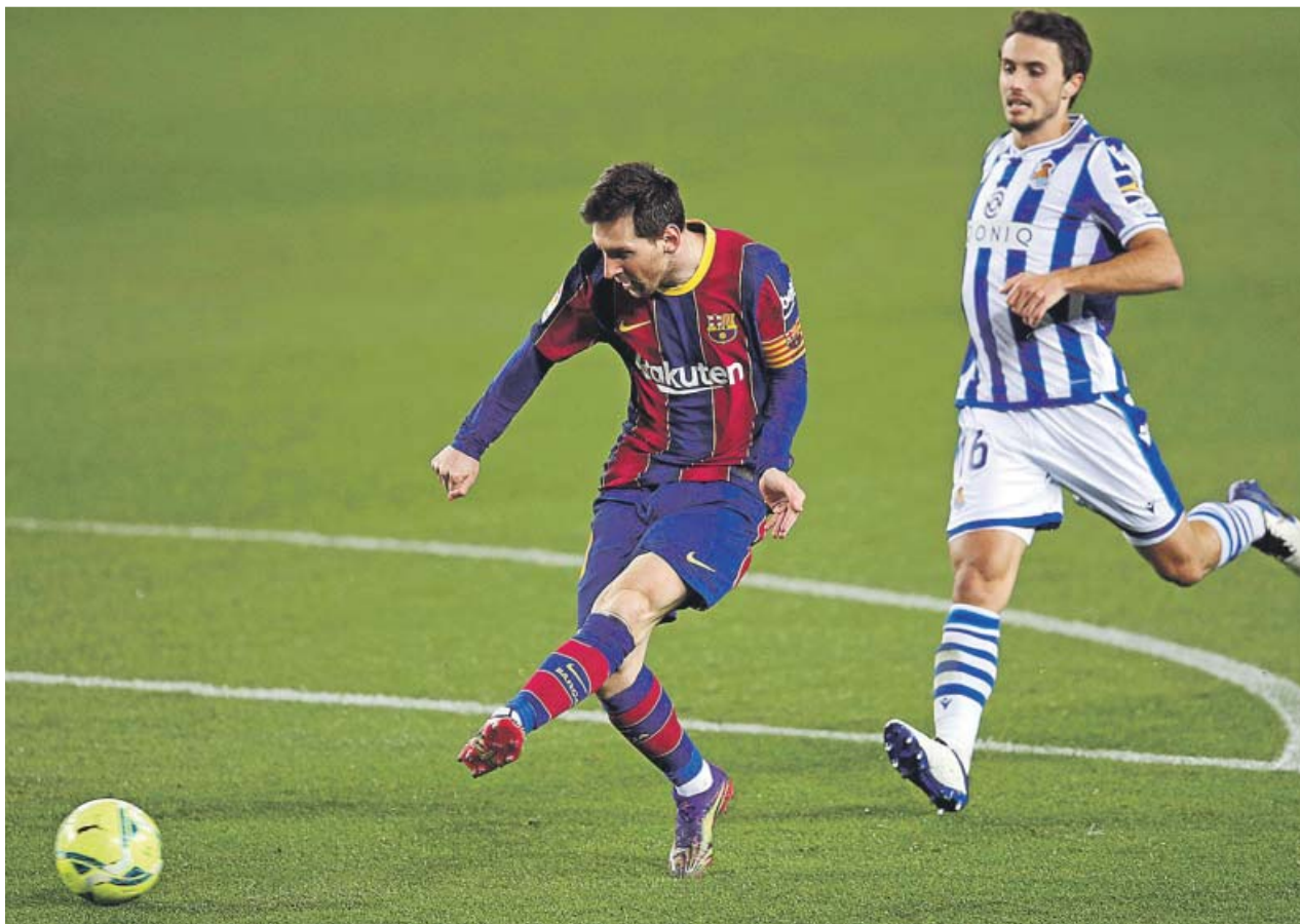
Leo Messi dispara a portería en el partido del Camp Nou ante la Real Sociedad.