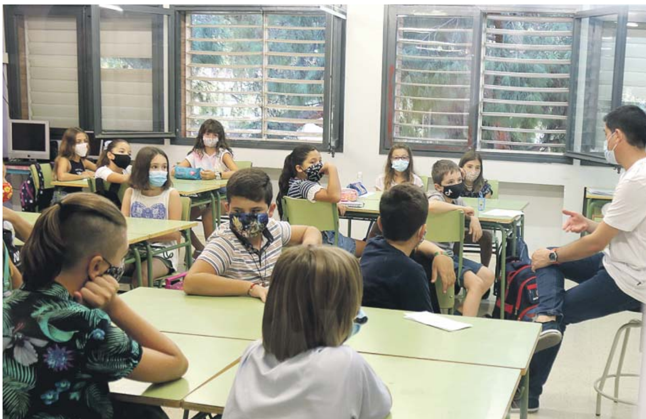
Imagen de una clase de la Escola Catalònia de Barcelona.