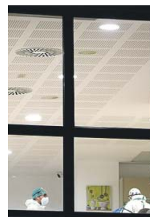
Residencia de ancianos L'Onada de Santpedor.

El protocolo que ha redactado Salut para proteger de la Covid a los residentes en geriátricos durante las fiestas navideñas incorpora la obligatoriedad de que los mayores que pasen los días señalados fuera del centro con su familia se hagan un test de detección del coronavirus (de antígenos) antes de abandonarlos, entre el próximo lunes 21 de diciembre y el jueves 24 de diciembre. Y a la vuelta a la residencia, deberán someterse a un