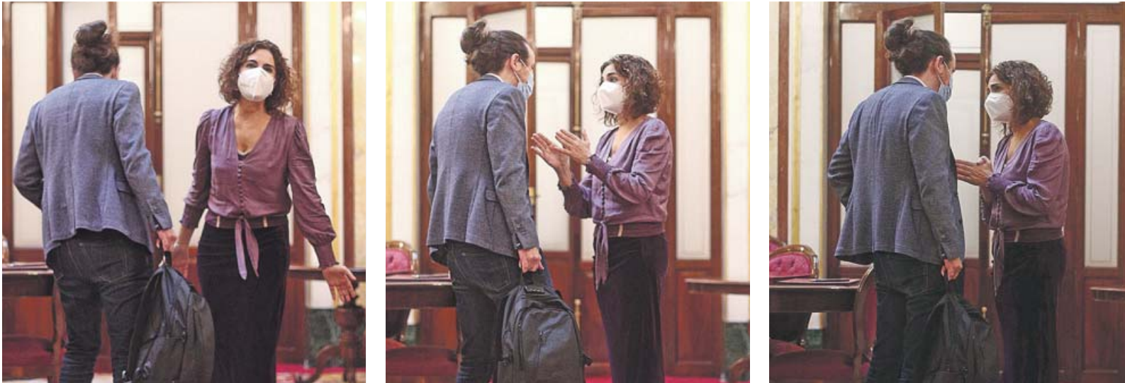
El vicepresidente segundo, Pablo Iglesias, y la ministra de Hacienda, María Jesús Montero, discuten en el Congreso. «No seas cabezón», le llegó a decir ella.