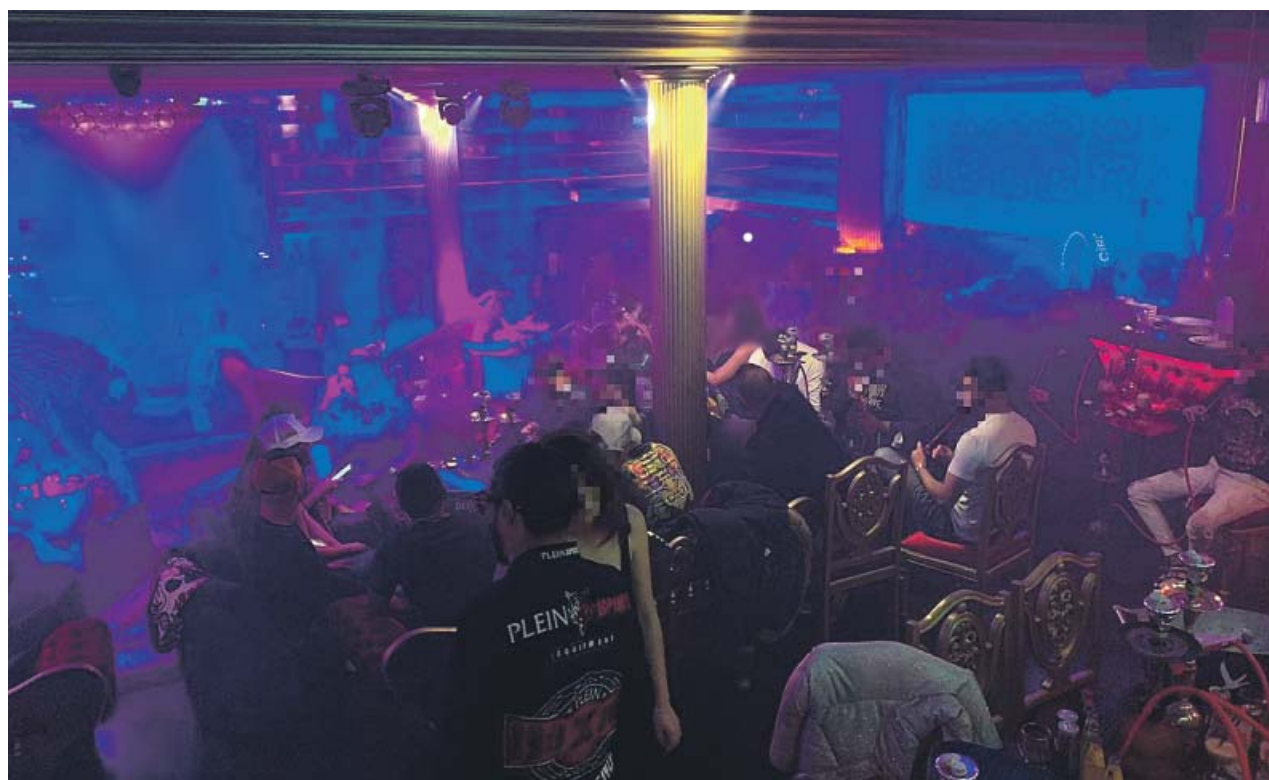
Plano general de la discoteca que fue desalojada por la Urbana.

Además, se restringe la movilidad al ámbito comarcal, con la excepción de aquellas unidades familiares que se desplacen a una segunda residencia, y se mantiene el cierre perimetral de Cataluña, aunque se permitirá regresar al domicilio familiar. El toque de queda comenzará a las 22.00 h, excepto en Nochebuena y Nochevieja (1.30 h), y la no-