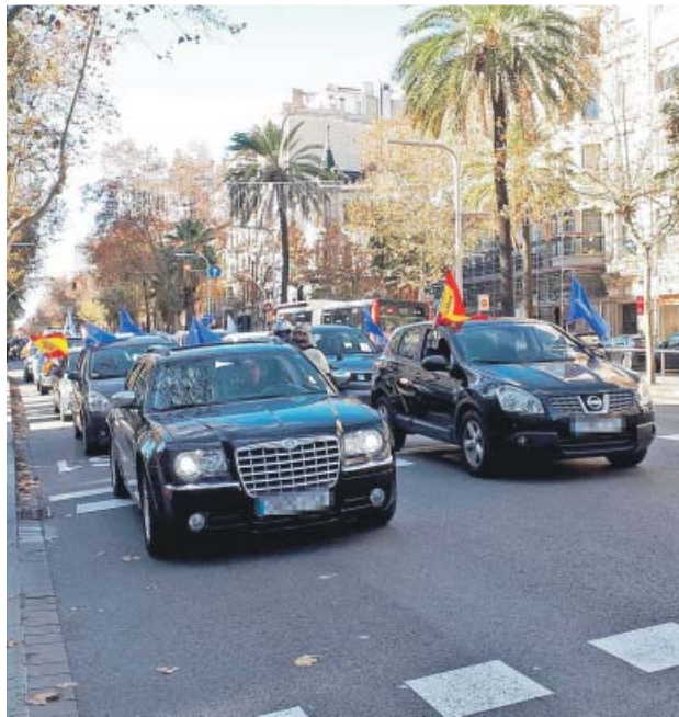
La caravana de coches, ayer, en la avenida Diagonal.

La plataforma convocante volvió a censurar que la reforma educativa, la octava desde que se reinstauró la democracia en España, se haya materializado por «imposición» y