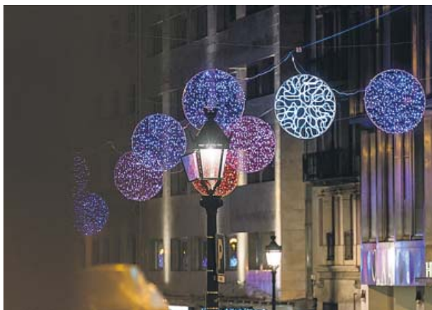
Illuminación de Navidad en Barcelona.

El Procicat prevé nueve escenarios de evolución de la pandemia, dos de los cuales supondrían aplazar la fecha, como un confinamiento domiciliario. ● R. B.