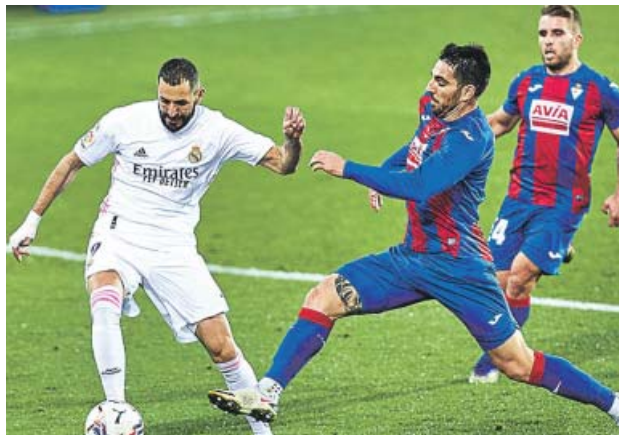
Karim Benzema durante el partido ante el Eibar.

Lo pudo matar Karim en otra combinación excelsa del equipo blanco, pero falló solo de cabeza y le dio aire al Ei-