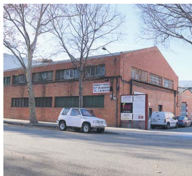
Nave industrial en el barrio de la Verneda.