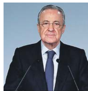
Florentino Pérez, durante la Asamblea del Real Madrid.

La postura del Real Madrid queda bastante clara y ahora fal-