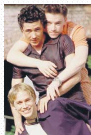
Los tres protagonistas de Queer as Folk .

Tal vez el mayor acierto del showrunner a lo largo de las dos temporadas fue decir 'no' al realismo en favor del puñetazo y tente tieso. Así