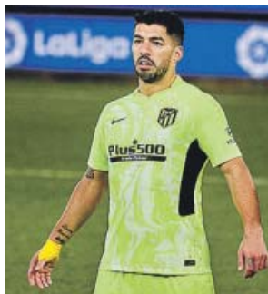
Luis Suárez, en el partido contra el Alavés.

Marcos Llorente adelantó a los colchoneros en el minuto 41 en un jugada aislada que ponía el partido de cara para los de Diego Simeone en la segunda mitad. Pero después de que los vascos se quedaran con un jugador menos, la entrada de Joselu Mato y Lucas