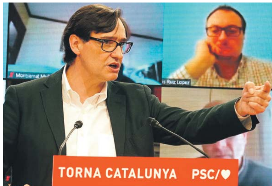
Salvador Illa en su primer acto de precampaña como candidato del PSC, ayer en Barcelona.

Por su parte, Salvador Illa esbozó durante este primer acto virtual de precampaña las líneas básicas de su discurso centrado en «trabajar por el reencuentro de los catalanes y catalanas». En este sentido, Salvador Illa defendió una Cataluña «sin bandos ni bloques» que supere el «fanatismo intolerante», ponga fin a la «crisis de convivencia» y recupere su «fuerza» y «unidad».