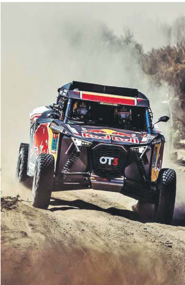
Los españoles Carlos Sainz (i) y Cristina Gutiérrez (d), en la primera etapa del Dakar.