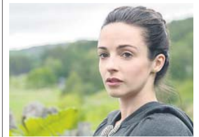
The Nevers HBO