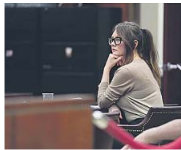
Inventing Anna Netflix

¿Vosotros también habéis caído rendidos antes la química entre Marianne (Daisy Edgar-Jones) y Connell (Paul Mescal), los protagonistas de Normal People ? La ficción de Starzplay se ha convertido en uno de los fenómenos de 2020 gracias a su aproximación honesta y alejada de clichés al amor de juventud. El mismo equipo detrás de la serie se encarga de la adaptación de Conversations With Friends , la primera novela de Sally Rooney, centrada en un complejo ménage à quatre . ●