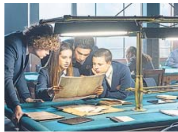
El internado: las Cumbres Amazon Prime Video

Shonda Rhimes ( Anatomía de Grey ) empieza a deleitarnos con los primeros proyectos nacidos tras su multimillonario acuerdo con Netflix. En Navidad llegó Los Bridgerton , la primera apuesta entre el servicio de VOD y su productora, Shondaland, y en 2021 tiene pendiente de estreno Inventing Anna . La ficción recoge el caso real de Anna Delvey (Julia Garner), una joven rusa que engañó y estafó a la élite neoyorquina haciéndose pasar por una rica heredera alemana. ●