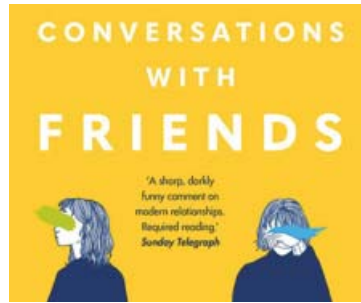
Conversations with Friends Hulu y BBC

nista. Basada en la novela de Nancy Mitford, la ficción sigue a una familia pudiente de Inglaterra (más en concreto, a la joven Linda -James- y sus escarceos amorosos) en el periodo de entreguerras. Andrew Scott, Emily Beecham y Dominic West forman parte del elenco. ●