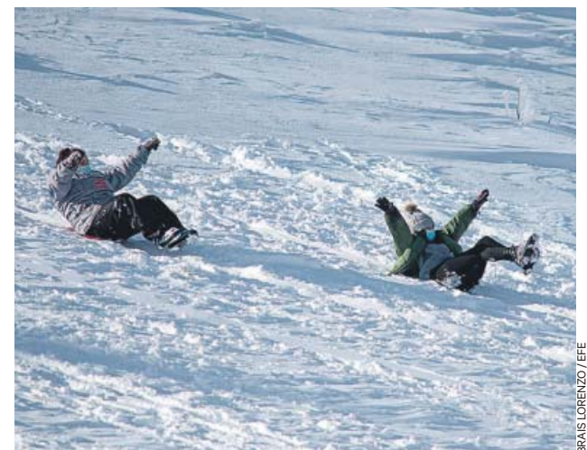
BRAS LORENZO / EFE