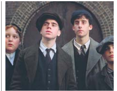
The Irregulars Netflix

Lo nuevo de Álex Pina ( La casa de papel ) es adrenalina y luces de neón, con Verónica Sánchez, Yany Prado y Lali Espósito como tres prostitutas a la fuga tras herir de gravedad a su proxeneta. Asier Etxeandia, que da vida a Romeo («un grandísimo hijo de puta con mucho carisma», afirma) describe la serie como « Los ángeles de Charlie , pero más punky». Dirigida por Eduardo Chaperó-Jackson y Javier Quintas, también cuenta con Miguel Ángel Silvestre y Enric Auquer. ●