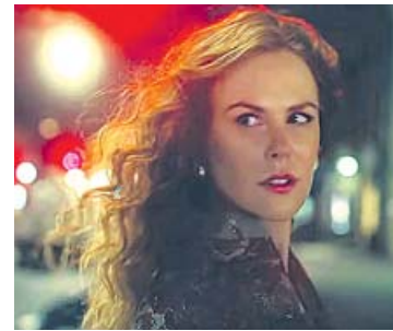
Nine Perfect Strangers Hulu