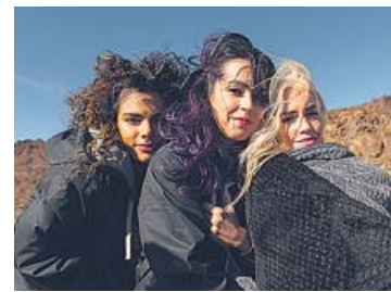
Sky Rojo Netflix

Que Netflix se haya deshecho de Los Defensores de Marvel (nosotros no nos hemos recuperado del adiós a Daredevil ) no significa que tenga la intención de dejar de lado el lucrativo género de las capas y las mallas. Basada en el cómic de Mark Millar y Frank Quitely, los actores Josh Duhamel y Leslie Bibb protagonizan Jupiter's Legacy , ficción sobre unos superhéroes que deben lidiar con sus poderosos hijos, más preocupados por la fama y la vida fácil que por ayudar al prójimo. ●