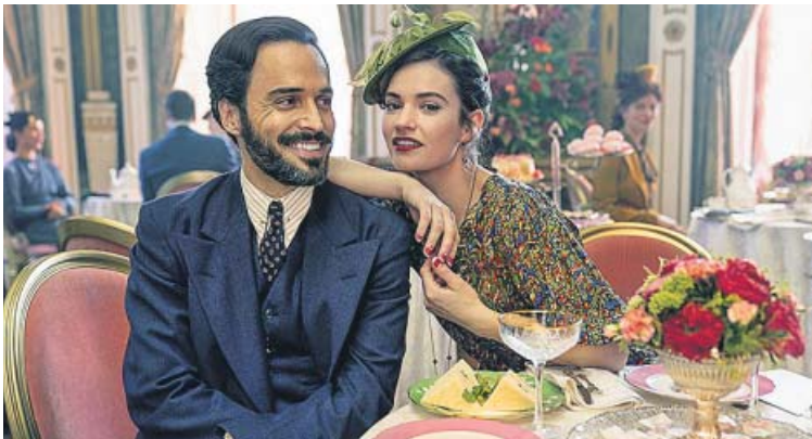
The Pursuit of Love