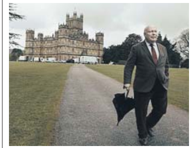
The Gilded Age HBO

El universo de Sherlock Holmes podría dar para un sinfín de apuestas originales, alejadas del astuto detective inglés. Prueba de ello son la película Enola Holmes , con Millie Bobby Brown como la hermana de Sherlock, o la nueva apuesta seriéfila de Netflix, The Irregulars . Creada por Tom Bidwell ( My Mad Fat Diary ), este spin-off trata sobre unos adolescentes delincuentes que ayudan al doctor Watson a vencer amenazas sobrenaturales. Arthur Conan Doyle en estado puro. ●