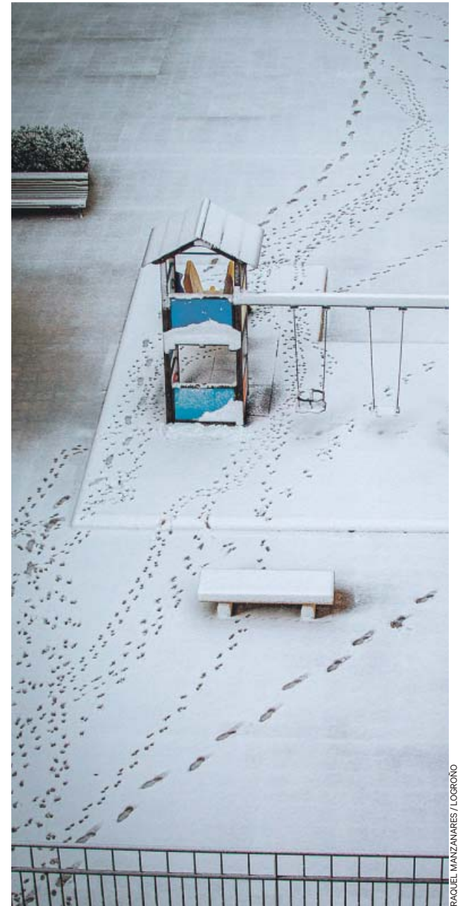
RACQUEL MANZANARES / LOGROÑO

Tampoco en las islas quisieron perderse un paisaje poco común y muchos vecinos y turistas hicieron cola para acceder a la Sierra de la Tramontana.