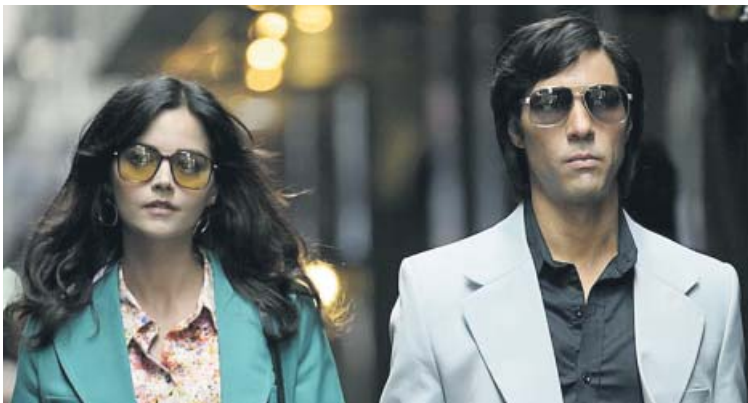
The Serpent BBC y Netflix

carlata y Visión , su sitcom vintage para Disney+. Le seguirán The Falcon and the Winter Soldier en marzo, Loki en mayo y Marvel's What If...? en verano. Entre los shows que vuelven destacan la última temporada de La casa de papel , la segunda de The Witcher , la cuarta de El cuento de la criada y la tercera de The Mandalorian . Pero hemos optado por dejar de lado estos blockbusters y destacar los estrenos de series menos conocidas con potencial para convertirse en tus favoritas. ●