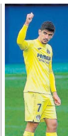
Gerard, pichichi junto a Iago Aspas.