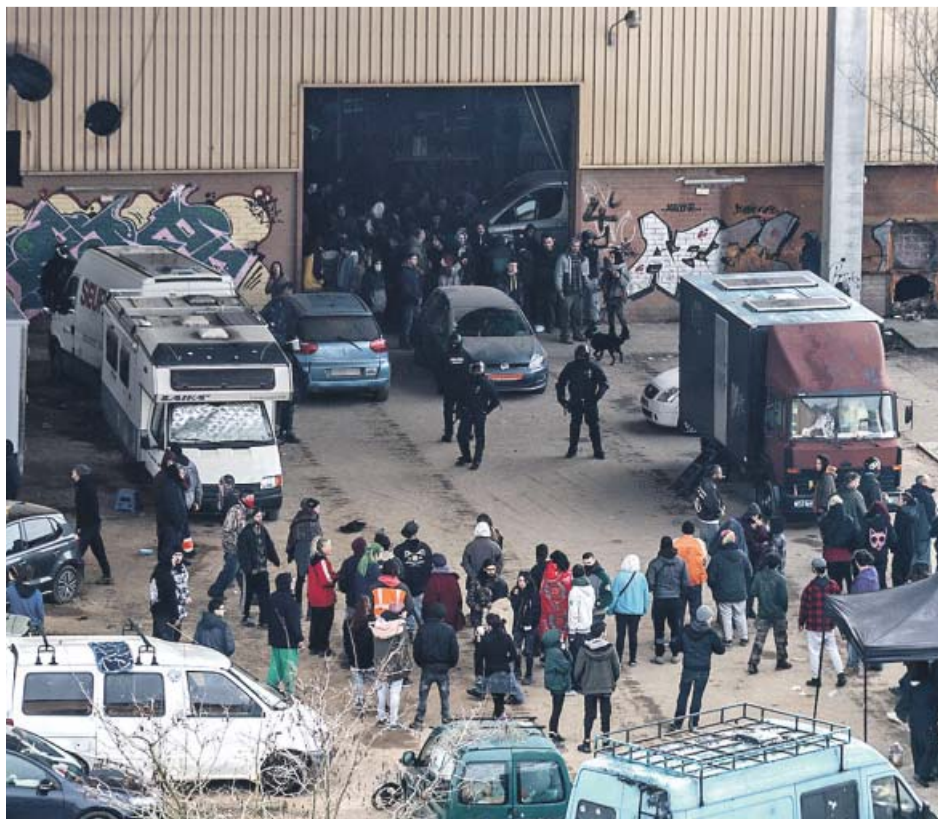
Los Mossos desalojan la nave abandonada donde tenía lugar la rave de Llinars.