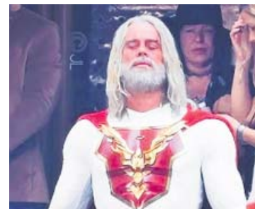
Jupiter's Legacy Netflix

Nicole Kidman se ha convertido en los últimos años en una de las reinas indiscutibles de la pequeña pantalla. Tras producir y protagonizar la aclamada Big Little Lies , la australiana regresaba en 2020 a la TV con The Undoing . Este año volverá como productora y protagonista de un nuevo show basado en la obra de Liane Moriarty ( Big... ) Nine Perfect Strangers . La serie, que cuenta con Melissa McCarthy, Luke Evans o Regina Hall, sigue a unos urbanitas en un retiro de lujo. ●