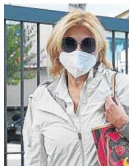
Carmen Cervera en una foto tomada en Marbella.