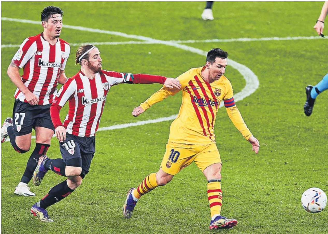
Messi avanza con el balón mientras Muniain trata de frenarlo.