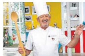
GASTRONOMÍA Cocina abierta ANTENA 3. 13.20 H

Ariel Rot recorre a modo de road movie distintos puntos de la geografía española para encontrarse con sus músicos más representativos. Un viaje musical por todo el país con muchas sorpresas escondidas.