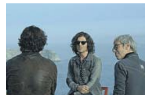
MÚSICA Un país para escucharlo LA 2. 22.55 H

Destinado a ampliar conocimientos entre los ciudadanos sobre materias dispares como cultura, ciencia, tecnología o medio ambiente, combina la emisión de reportajes con entrevistas y tertulias en plató.