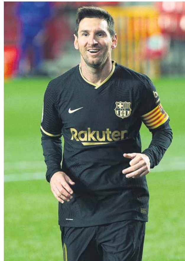
Leo Messi en el partido ante el Granada.

Aunque más allá de los goles, lo importante es las sensaciones que ha dejado Leo. Implicado, participativo, su asociación con Pedri ha devuelto la ilusión a la afición culé y ha hecho que se olvide, de momento al menos, las especulaciones sobre su renovación. ●