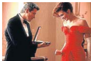
'Pretty Woman' TELECINCO. 23.00 H

Edward, un apuesto y rico hombre de negocios, contrata a una prostituta, Vivian, durante un viaje a Los Ángeles. Tras pasar con ella la primera noche, le ofrece pasar juntos toda la semana y que le acompañe a diversos actos sociales.