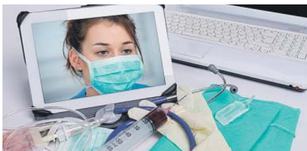
El internet de las cosas crecerá en áreas como la sanitaria. GRES