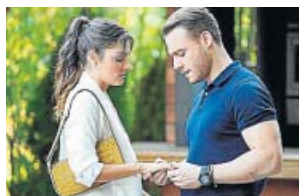
Love is in the air TELECINCO. 22.00 H

Un grupo de científicos forenses que trabaja en un laboratorio de criminalística de Las Vegas (Nevada, Estados Unidos) tiene que resolver los crímenes que van sucediendo en la ciudad, a cada cual más extraño.