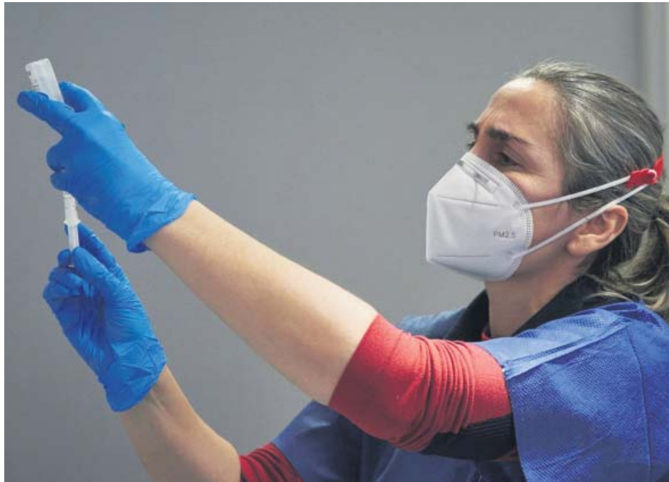
Una profesional sanitaria prepara una vacuna contra la Covid-19.

De este modo, el Gobierno asegurará, pese al temporal, la llegada a España y la posterior distribución a las comunidades de la nueva remesa de más de 300.000 vacunas de la farmacéutica Pfizer. El objetivo es que el temporal de nieve no afecte a las