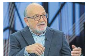
DIVULGATIVO La aventura del saber LA 2. 09.55 H

Destinado a ampliar conocimientos entre los ciudadanos sobre materias dispares como cultura, ciencia, tecnología o medio ambiente, combina la emisión de reportajes con entrevistas y tertulias en plató.