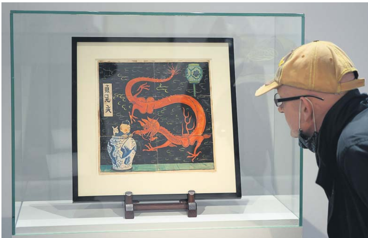
Un visitante contempla la portada del cómic de Tintín en la casa de subastas Artcurial de París.