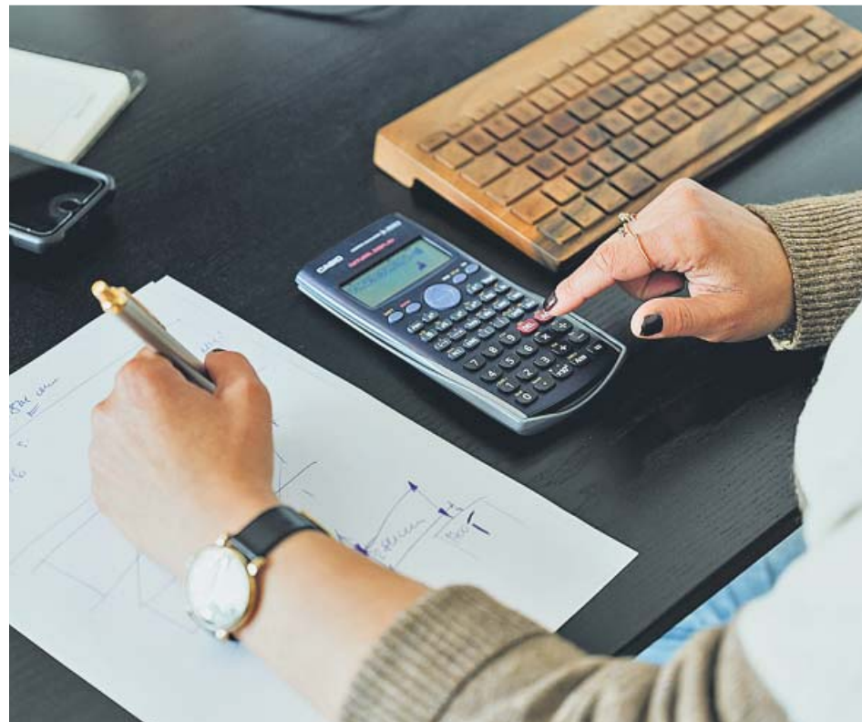
Expertos financieros aconsejan elaborar un presupuesto de nuestras cuentas.