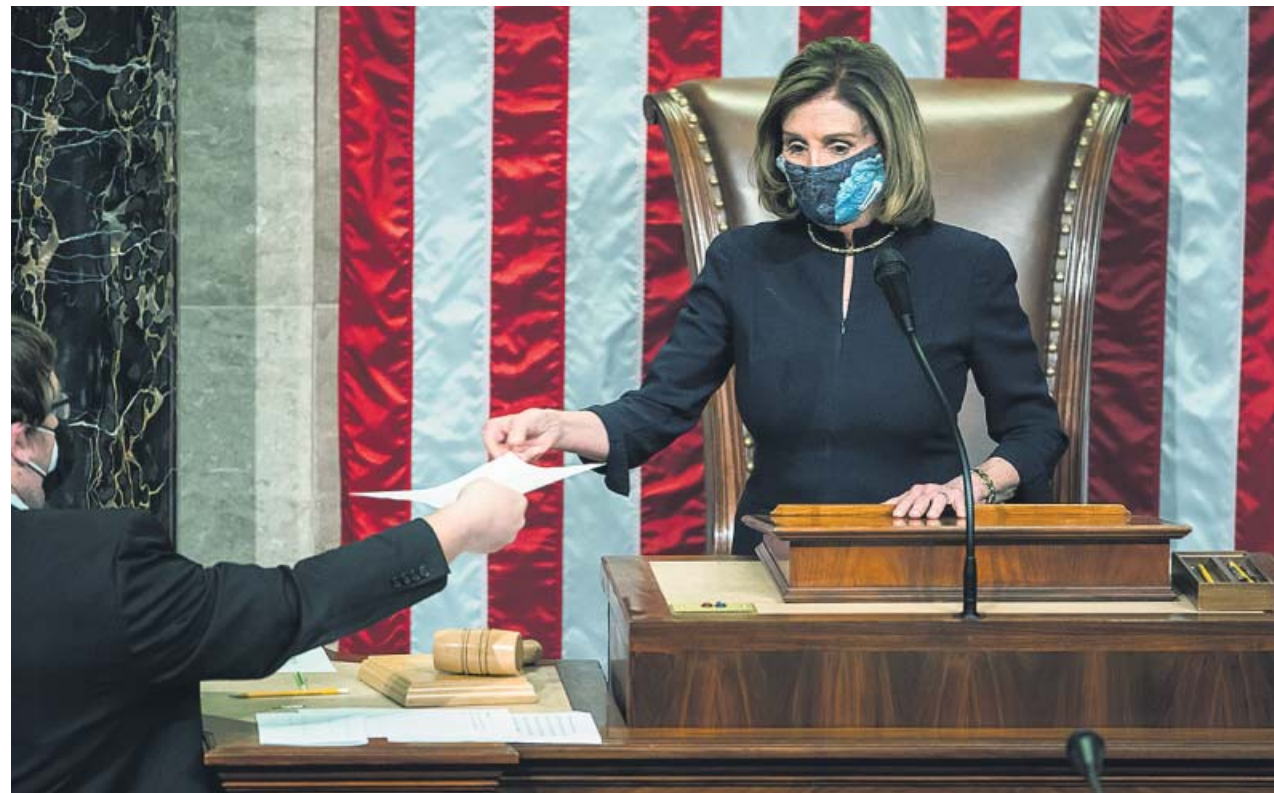
La demócrata Nancy Pelosi preside el debate de ayer en la Cámara de Representantes.

«Sabemos que el presidente de Estados Unidos incitó esta insurrección, esta rebelión armada contra nuestro país común. Debe irse. Es un peligro claro y presente para la nación que todos amamos», sostuvo Nancy Pelosi, la pre-