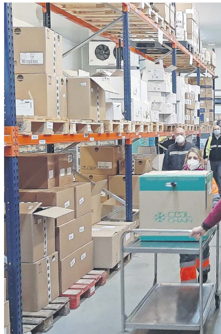
Ayer llegaron a Catalunya las primeras 5.800 dosis de la vacuna de