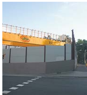
Obres de la L9 a Mandri amb passeig de la Bonanova.

Es cobriran 730 metres quadrats dels 800 que ocupa el