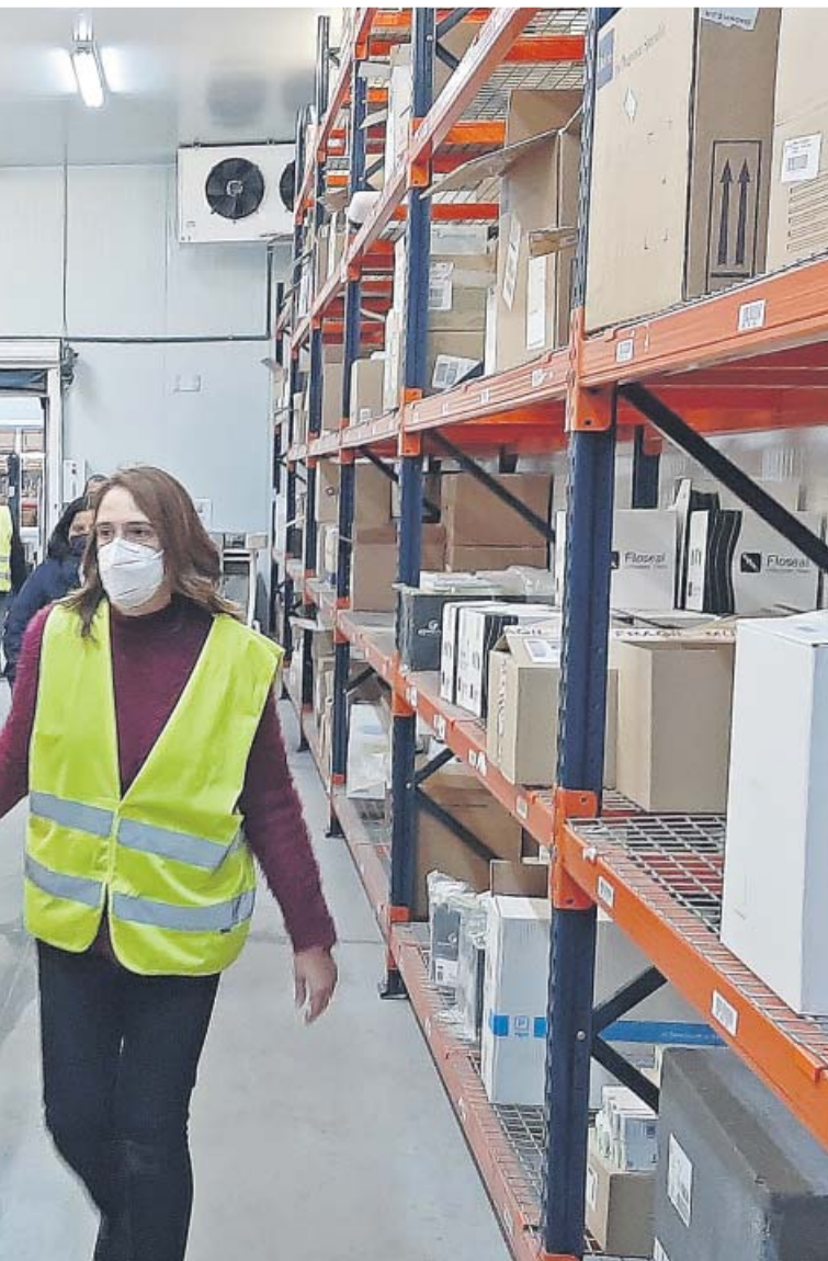
Moderna contra la Covid. SALUT