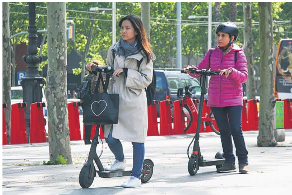
Dos mujeres en patinete eléctrico en la avenida Diagonal de Barcelona.

El Real Decreto, que ha modificado el Reglamento General de Circulación, establece también una velocidad máxima de 25 kilómetros por hora para la conducción de patinetes