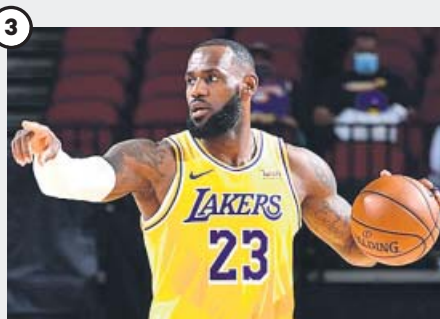
3 Los Lakers de LeBron, imparables

Más de una semana sin jugar, lleva alegando «razones personales». Los Nets están molestos, más aún tras un vídeo en el que se le ve en lo que parece el cumpleaños de su hermana y sin mascarilla.