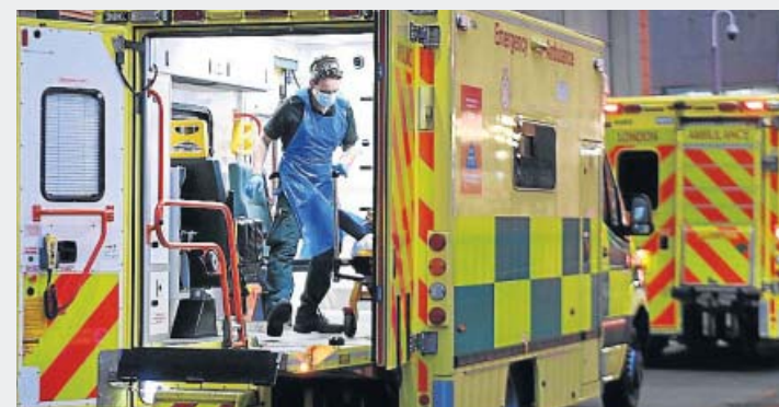
Reino Unido. La situación británica por la pandemia está casi descontrolada, con su sistema sanitario al borde del colapso y las cifras diarias batiendo dramáticos registros: ayer se contabilizaron 1.564 víctimas en las últimas 24 horas.