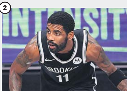
2 El extraño caso de Kyrie Irving

Cuatro partidos sin alcanzar los 20 puntos dejaban claro que ni está en forma ni motivado. Arrasados dos veces por los Lakers, un Harden visiblemente pasado de peso volvió a pedir el traspaso con unas incendiarias declaraciones. Los Rockets, viendo la situación, cedieron y le traspasaron a los Brooklyn Nets, donde formará un Big Three que da miedo con Kevin Durant y Kyrie Irving.