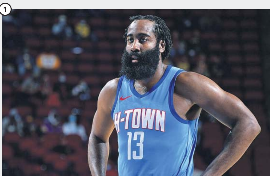
1 James Harden, traspasado a los Nets de Durant

Cuatro partidos sin alcanzar los 20 puntos dejaban claro que ni está en forma ni motivado. Arrasados dos veces por los Lakers, un Harden visiblemente pasado de peso volvió a pedir el traspaso con unas incendiarias declaraciones. Los Rockets, viendo la situación, cedieron y le traspasaron a los Brooklyn Nets, donde formará un Big Three que da miedo con Kevin Durant y Kyrie Irving.