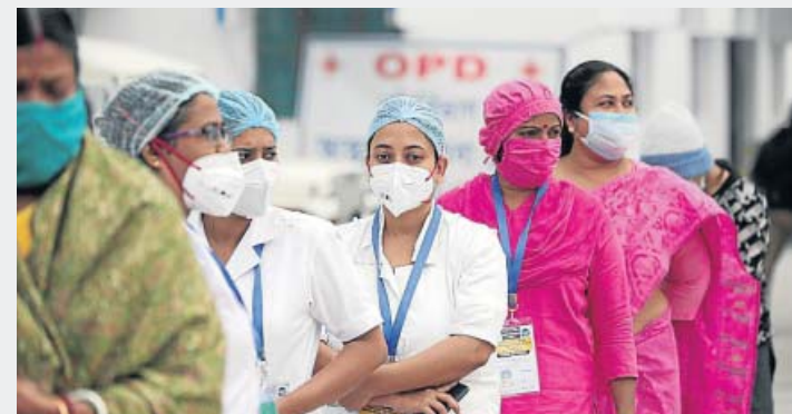
India. Cientos de personas se sometieron ayer en la India a una prueba PCR ante la celebración, hoy, del Kumbh Mela, la mayor festividad del país en la que los hindúes se bañan en aguas de ríos sagrados como el Ganges. Ya ayer miles de peregrinos acudieron en masa al lugar pese a la pandemia.