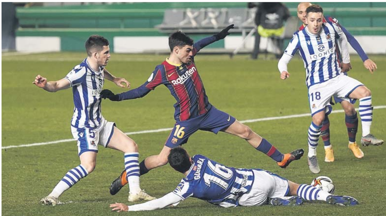
Pedri intenta jugar el balón ante la oposición de varios rivales de la Real.