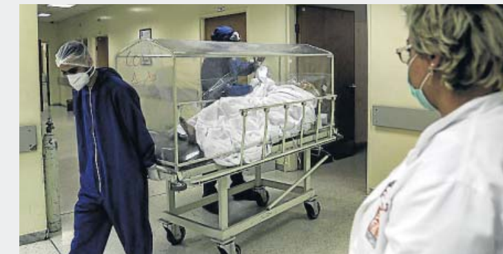
Libano. El Gobierno de Líbano decretó a comienzos de semana el estado de emergencia sanitaria y la cuarentena total en el país ante el aumento de la curva de contagios de la Covid-19 y el incremento de la presión hospitalaria. En la foto, un sanitario traslada a un enfermo dentro de un hospital de Trípoli.

Y todo ello se debe a que en toda la autonomía se registraron casi 5.000 contagios más en tan solo 24 horas, además de 11 fallecidos más por las afecciones que ocasiona el coronavirus. ●