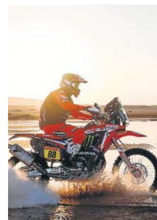
Barreda, surcando arena y agua en este Dakar.

Ya se preveía que iba a ser un día de cambios en motos. En una difícil jornada, muy pedregosa y muy dada a caídas, el que llegaba líder con relativa ventaja, Nacho Cornejo, se fue al suelo sobre el kilómetro 252. El gran beneficiado fue el argentino Kevin Benavides, que se aúpa ahora al frente de la general, pero ni mucho menos con una ventaja sobrada. Entró a 5:11 del vencedor del día, Ricky Brabec, y ahora el estadounidense está a solo 51 segundos de él en la clasificación. Cornejo, que inicialmente se había quedado a 1 minuto