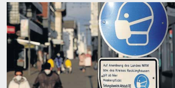
Alemania. El país germano también está casi en máximos y registró en las últimas 24 horas 19.600 nuevos casos de coronavirus y 1.060 muertes con o por el Sars-CoV2, según informó el Instituto Robert Koch (RKI), centro epidemiológico de referencia.