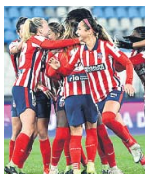
Las jugadoras del Atlético celebran su clasificación.

En el minuto 52 Aitana gozó de una nueva ocasión, encon-