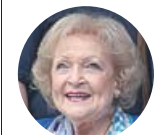
BETTY WHITE Actriz de Las chicas de oro

«Tengo buena salud, así que cumplir 99 no difiere mucho de cumplir 98. El sentido del humor me hace seguir adelante»