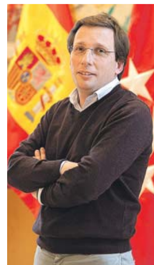
El alcalde de Madrid, José Luis Martínez-Almeida.

Está agrupando a esa gran mayoría de españoles que quiere vivir bajo un modelo constitucional que nos permita convivir a los que pensamos distinto y que está puesto en peligro ahora. El PP somos quienes garantizamos saber gestionar la economía y la situación social. Lo hacemos bajo unos principios y una premisa: somos capaces de gobernar para la inmensa mayoría de los españoles. ●