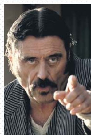
Ian McShane interpreta al villano Al Swearngen.

disfrutar de una serie que revivía un género moribundo en TV con miras más cercanas a Sam Peckinpah que a Bonanza y sus siete caballos, no digamos ya a La casa de la pradera : en el villorrio de Dakota del Norte donde tiene lugar la acción, las hermanas Ingalls se hubieran muerto del susto al escuchar los 47 «fucks!» (los primeros de muchos) que suenan durante la primera hora del piloto. Efectivamente, Deadwood ha quedado como