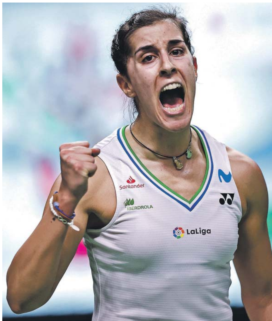
Carolina Marín celebra un punto ante la taiwanesa Tai Tzu-ying.