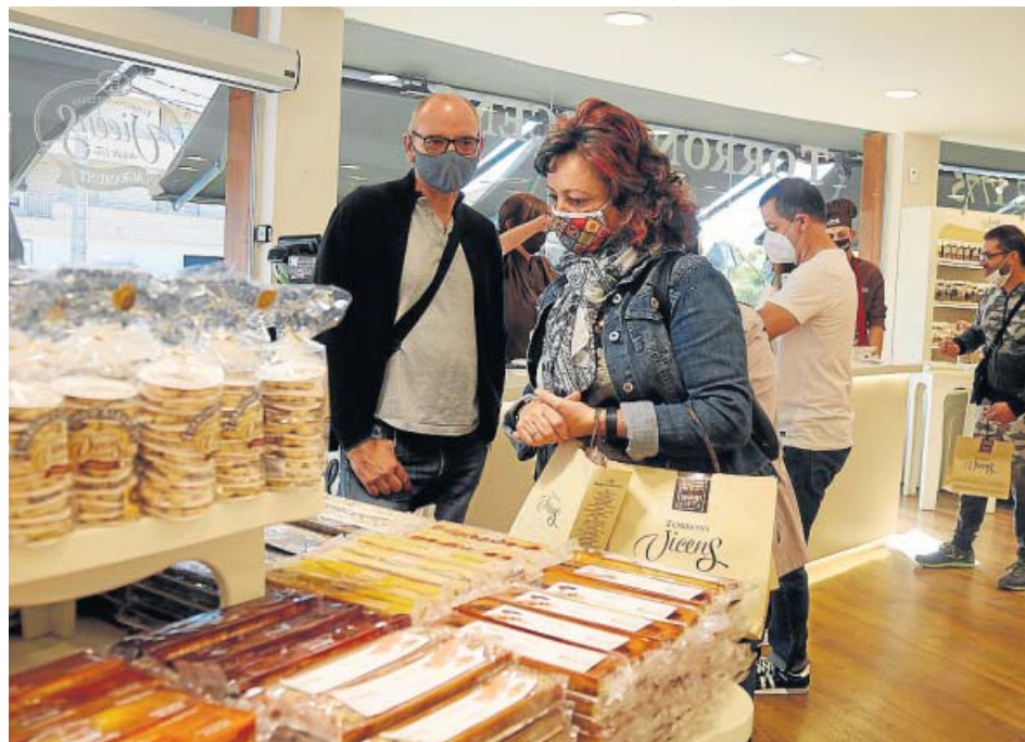
Una clienta en una tienda de turrones. El comercio es un empleo tradicionalmente femenino.

Esto supone que mientras que el 88% de las mujeres con un nuevo empleo trabajan a media jornada o menos de ocho horas al día, el