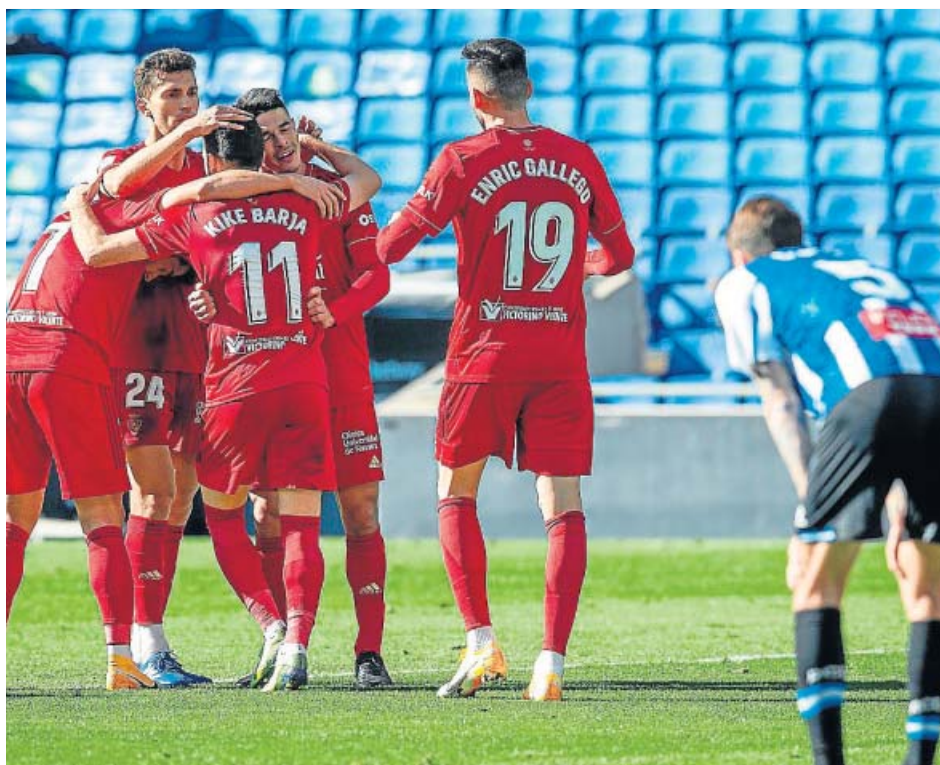
Los jugadores de Osasuna celebran uno de los goles ante el Espanyol.