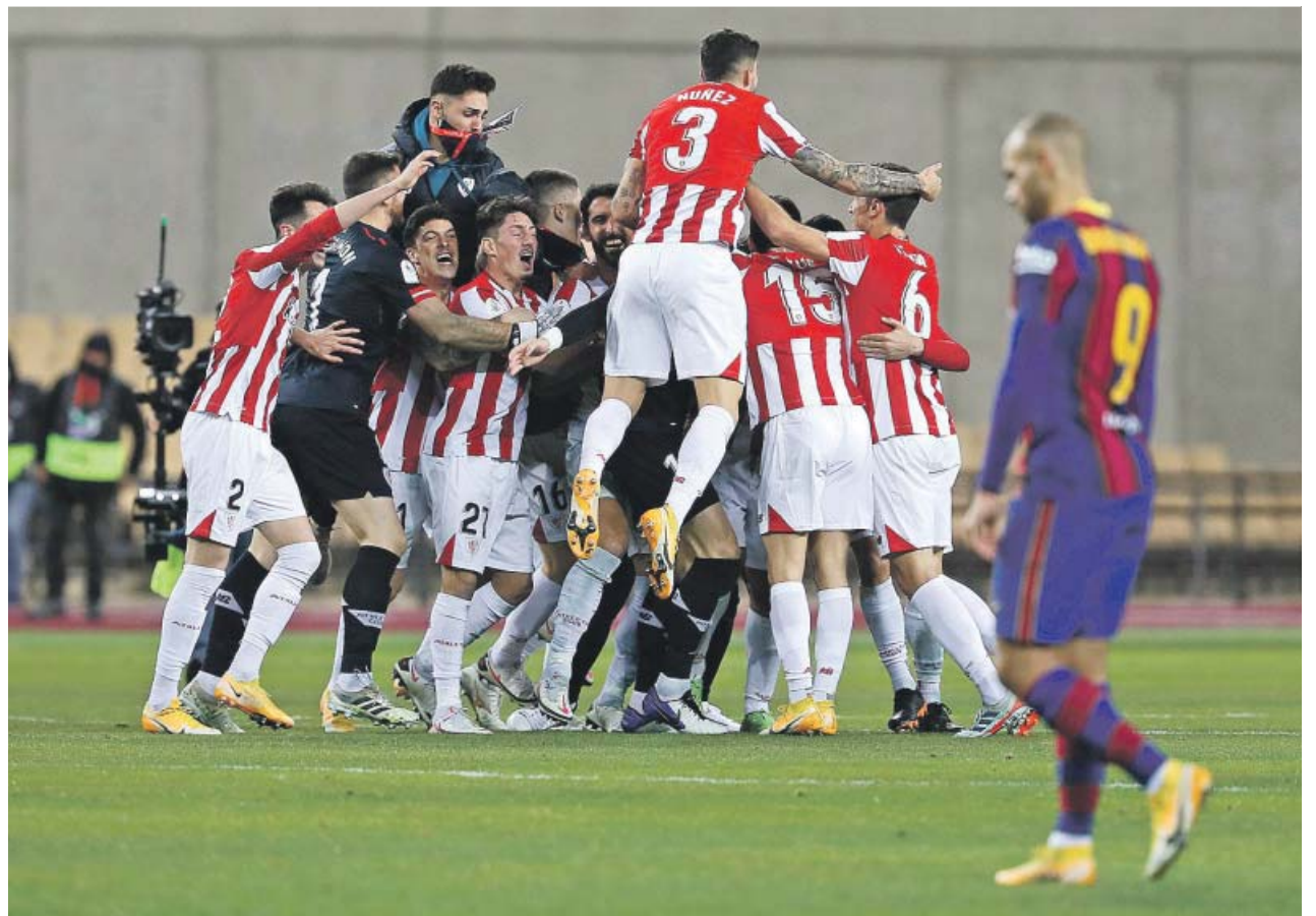
Los jugadores de Athletic celebran su victoria ante la decepción azulgrana.

La respuesta fue contundente, y de nuevo con Jordi Alba de protagonista, una pesadilla ayer con sus internadas por la derecha. Sin Dest, Koeman