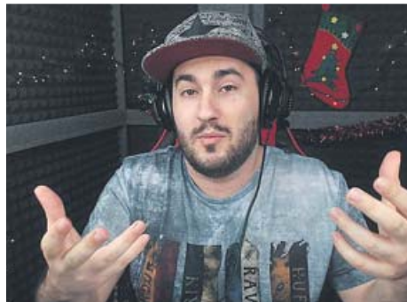
Lolito Fernández, 7,1 millones de suscriptores