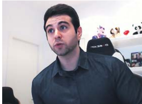
Vegeta777, 32 millones de suscriptores