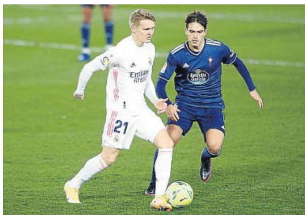
Martin Odegaard en el partido ante el Celta de Vigo.

Sin embargo, una nueva lesión, muscular en esta ocasión,