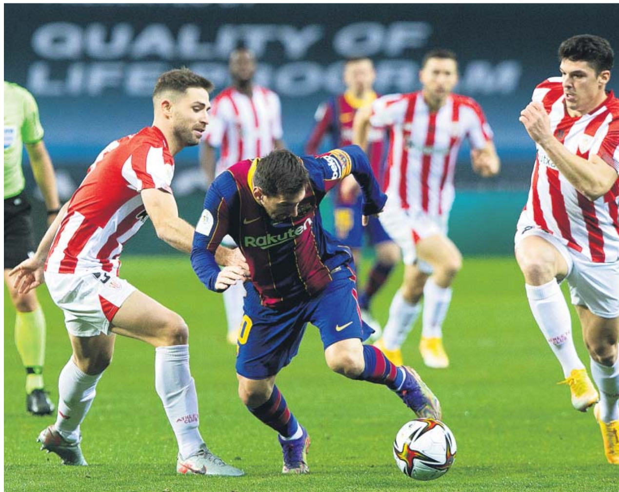
Leo Messi podrá estar en el partido ante el Athletic del 31 de enero que se jugará en el Camp Nou.

El mismo añade que «si la acción descrita en el párrafo anterior se produjera al margen del juego o estando el juego detenido, se sancionará con suspensión de dos a tres partidos, sin perjuicio de lo establecido en el artículo 98 del presente Código».