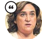
ADA COLAU Alcaldesa de Barcelona

«No se puede tratar igual a Barcelona que a un pequeño municipio del Pirineo»