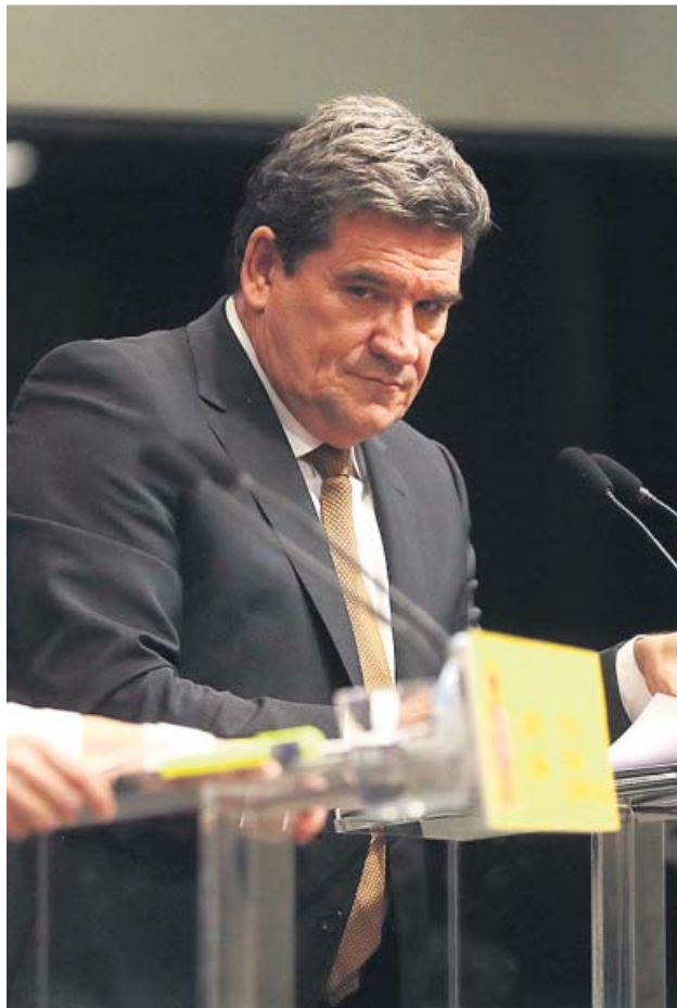
El ministro de Seguridad Social, José Luis Escrivá.

«El último borrador» enviado a las autoridades europeas, explicó Montero, «no incluye ningún tipo de alteración con respecto a lo que actualmente existe». Es decir, el Gobierno mantendría en la ley que la cuantía de la pensión se calcule en base a lo cotizado en los últimos 25 años de vida laboral, si bien la ministra advirtió de