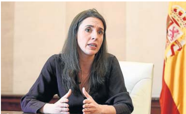
La ministra de Igualdad, durante la entrevista. JORGE PARÍS

«Hay legislatura para rato, las tensiones llevan a que se cumplan los compromisos»