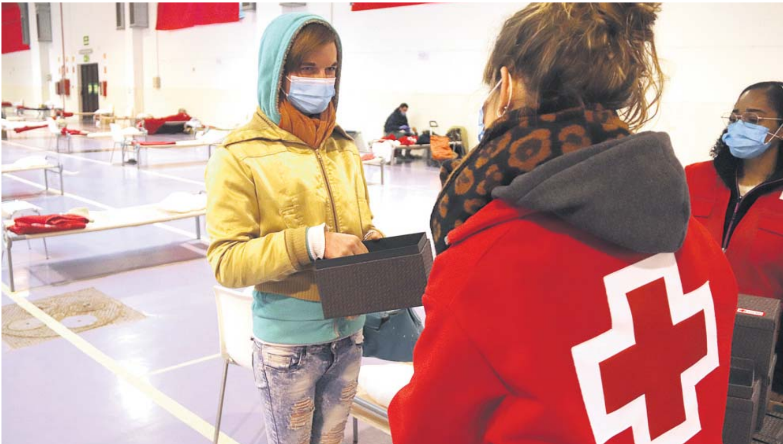
Una mujer que vive en la calle recibe, la pasada Navidad, ropa de abrigo en un albergue temporal de Creu Roja Catalunya.