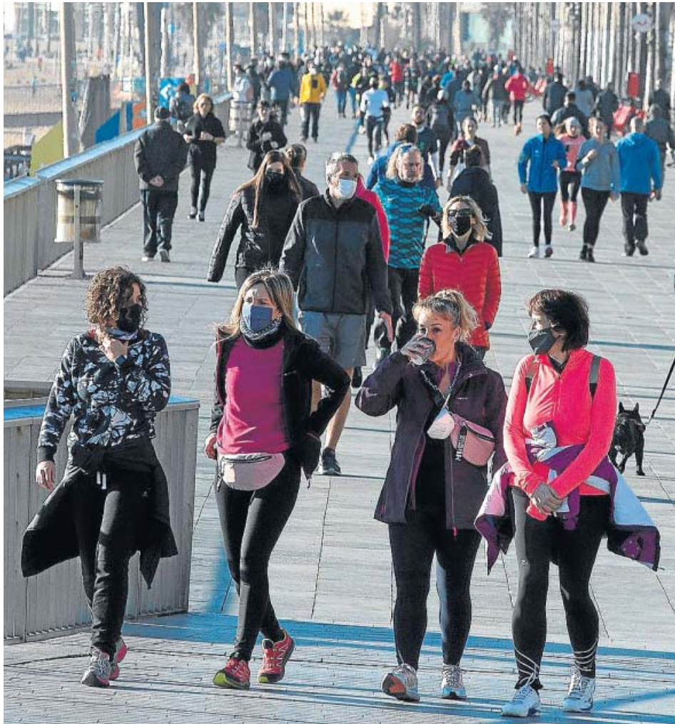
Numerosas personas pasean en la playa de Somorrostro de Barcelona.