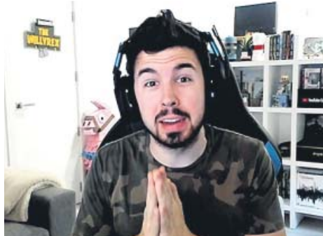
Willyrex, 16,5 millones de suscriptores