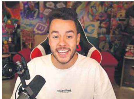
TheGrefg, 16,3 millones de suscriptores

La mayoría de los creadores de contenido normalmente trabajan desde casa o viajan a otros destinos para diferentes eventos, por lo que residir en Andorra, siempre que vivan allí un mínimo de 183 días al año, les permite seguir su labor con total normalidad pero tributando menos, con todo lo que ello conlleva. Por eso, hay multitud de youtubers que llevan años afin-