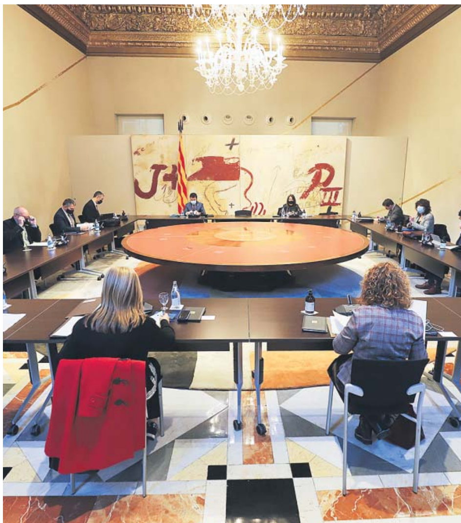
Los miembros del Govern en la reunión del Consejo Ejecutivo de ayer.

EL GOVERN mostró su desacuerdo con el tribunal, pero reactivó el dispositivo electoral