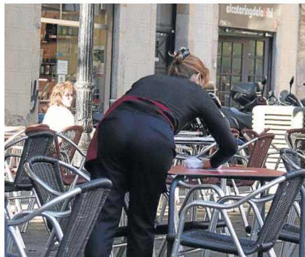
Una camarera limpia la mesa de un bar de Barcelona.

De todas formas, añadió que «las medidas que están en vigor se analizan y, si la situación lo permite, se harán los cambios oportunos».