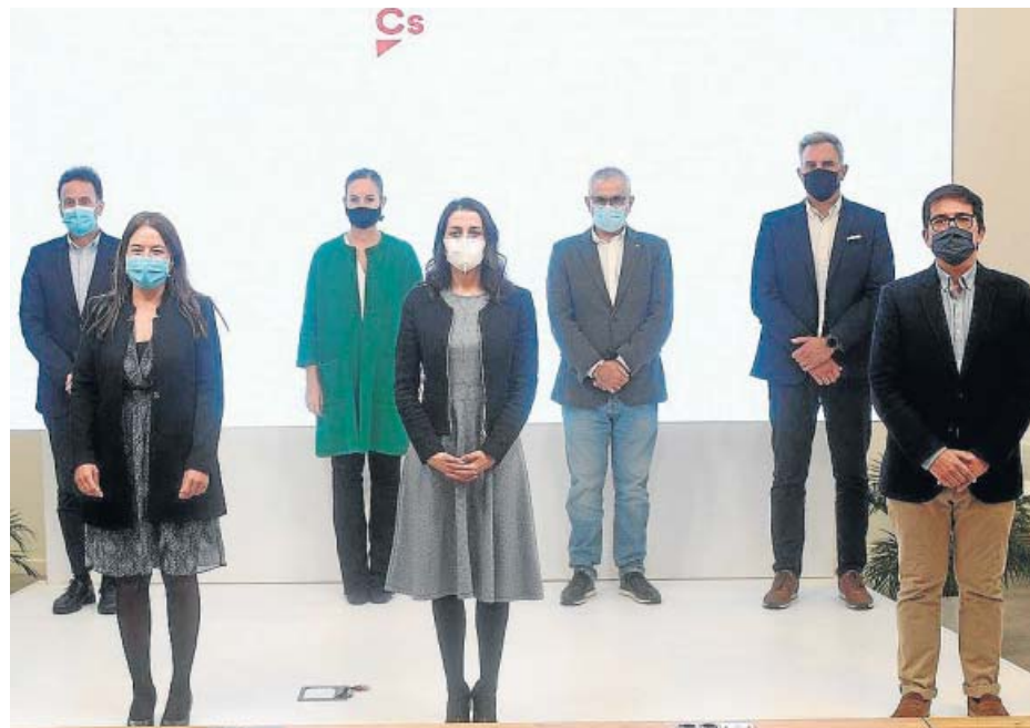
La dirección de Ciudadanos, antes de la reunión urgente del comité permanente.