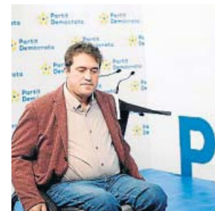
El presidente del PDeCAT, David Bonvehí.

El Consell Nacional del PDeCAT deberá tomar «las decisiones como partido que se tengan que tomar» pero convencido de que el Partit Demòcrata «representa un proyecto que en la sociedad catalana existe». Para Bonvehí, los 77.059 votos recibidos por el PDeCAT demuestran que hay «un espacio electoral» y apuntó —sin mencionar a JxCat— que desde el partido han detectado un cierto «voto útil» hacia otras formaciones que en un primer momento, según sus datos, eran del PDeCAT. Insistió además en que su formación siempre ha creído «en la unidad del independentismo» y que ambicionaban ser «un actor más» del soberanismo desde el Parlament, pero partiendo de posiciones más centradas. ● I. SERRANO