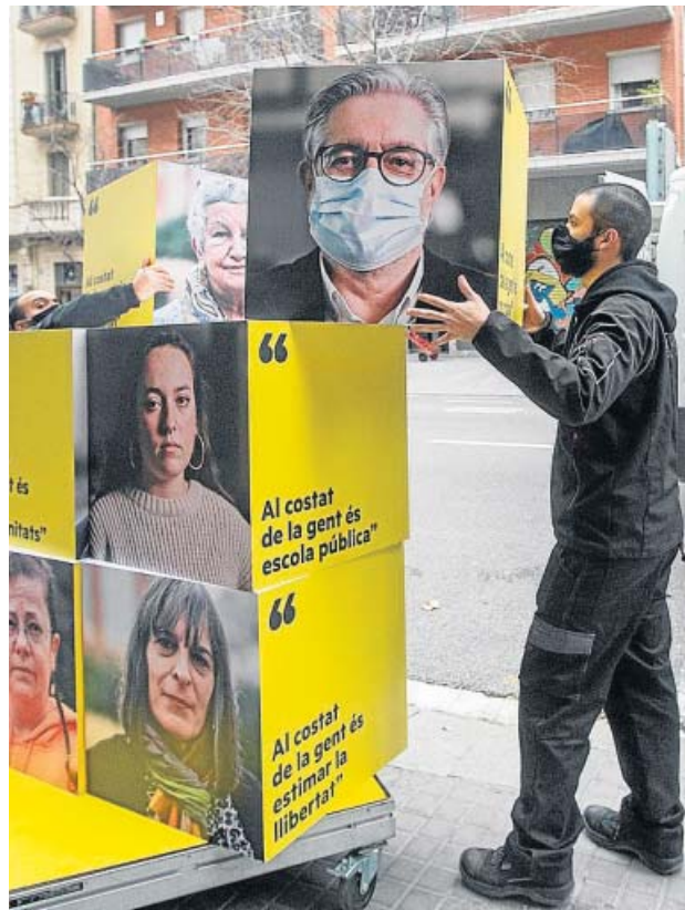
Desmontando los carteles electorales, ayer en Barcelona.

En este mismo distrito es donde la CUP recabó más votos, colocándose como quinta fuerza por detrás de En Comú Podem, con más del 10,5%. Sin embargo, en Les Corts, Nou Barris y Sarrià-Sant Gervasi no lograron los apoyos suficientes para tener representación. ●