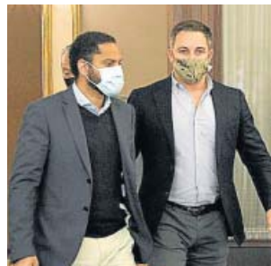
Santiago Abascal e Ignacio Garriga ayer en Barcelona.

Abascal reconoció: «Ni nosotros mismos imaginábamos» este resultado. Y aseguró que este implica una «responsabilidad colosal», papel que recogerán «con altura de miras y tendiendo la mano»