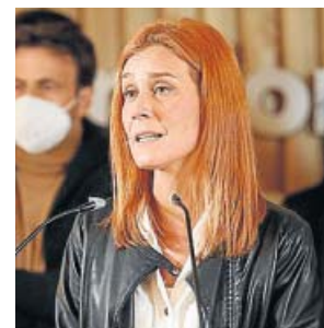
Jéssica Albiach, el domingo, tras el resultado.

En Comú Podem La candidata de los comuns a la Generalitat, Jéssica Albiach, respondió ayer al candidato de ERC, Pere Aragonès, que En Comú Podem no pactará un Govern con los republicanos y con Junts, y se reafirmó en buscar una alianza entre fuerzas progresistas para conseguir un gobierno de izquierdas en Cataluña. «No votaremos a Junts de ninguna de las formas», aseguró durante la rueda de prensa de valoración de los resultados de las elecciones del 14-F, en las que la formación morada ha mantenido los