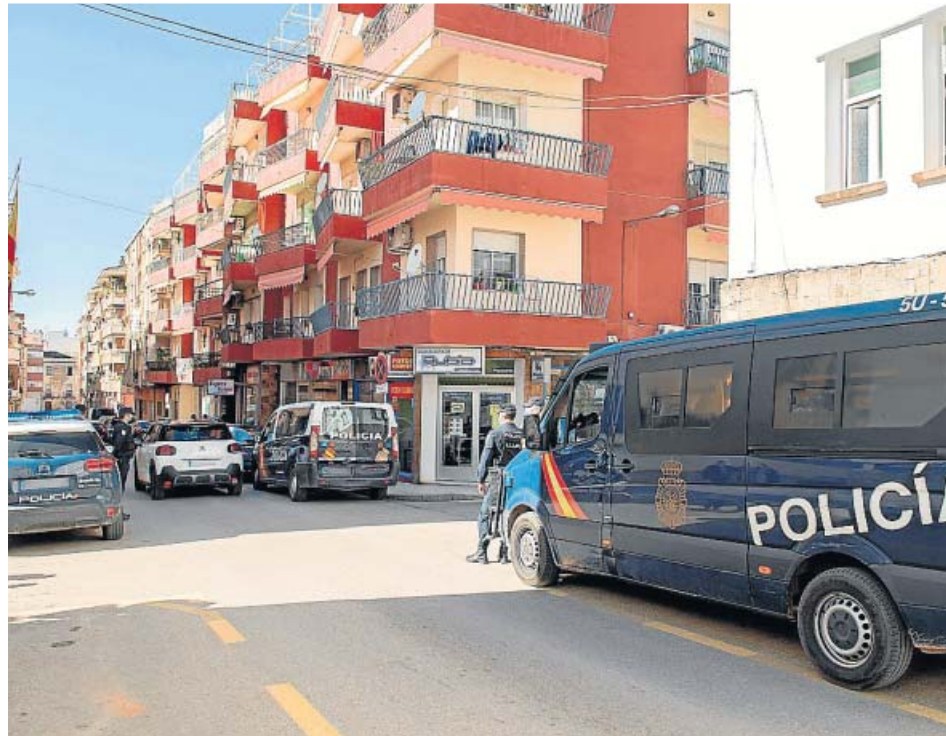
Policías en los alrededores de la comisaría de Linares un día después de los disturbios.

Ayer, hasta tres asociaciones —la Asociación Pro Derechos Humanos de Andalucía, Iridia-Centro de Defensa de Derecho Humanos y la Plataforma Defender a Quien Defiende— registraron una denuncia ante la Fiscalía Provincial de Jaén «contra algunas de las actuaciones policiales» que tuvieron