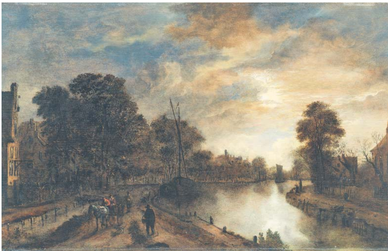
Claro de luna con un camino bordeando un canal, hacia 1645 - 1650. Aert van der Neer.