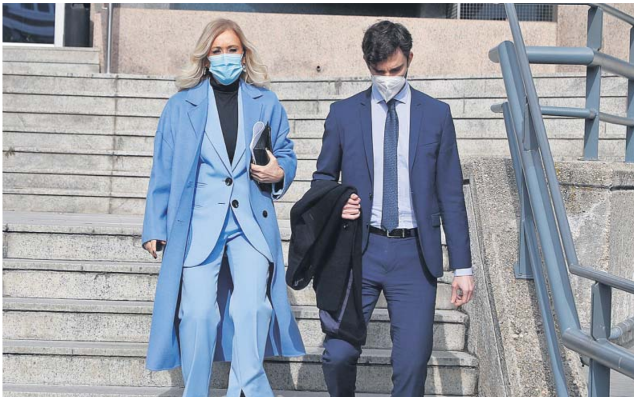
Cristina Cifuentes, absuelta de la falsificación de su máster.

La fiscal señaló que Cifuentes «no se manchó las manos» y que las presiones vinieron de su «entorno». Sin embargo, el tribunal asegura que «las sospechas legítimas que pudieran existir no se han convertido en prueba suficiente». ●