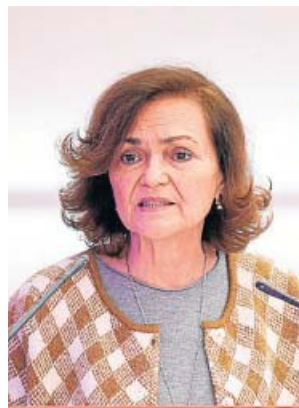
La vicepresidenta primera del Gobierno, Carmen Calvo.

la achaca el colectivo directamente a la intervención de la vicepresidenta primera del Gobierno, Carmen Calvo, que es natural de Cabra, un municipio de la provincia de Córdoba. En principio, el Ministerio de Defensa había garantizado establecer esta base logística en Jaén, una capital muy castigada por el desempleo. La ciudad llevaba más de un año trabajando en un proyecto que iba a reportar una inversión de 340 millones de euros, 1.600 puestos de trabajo