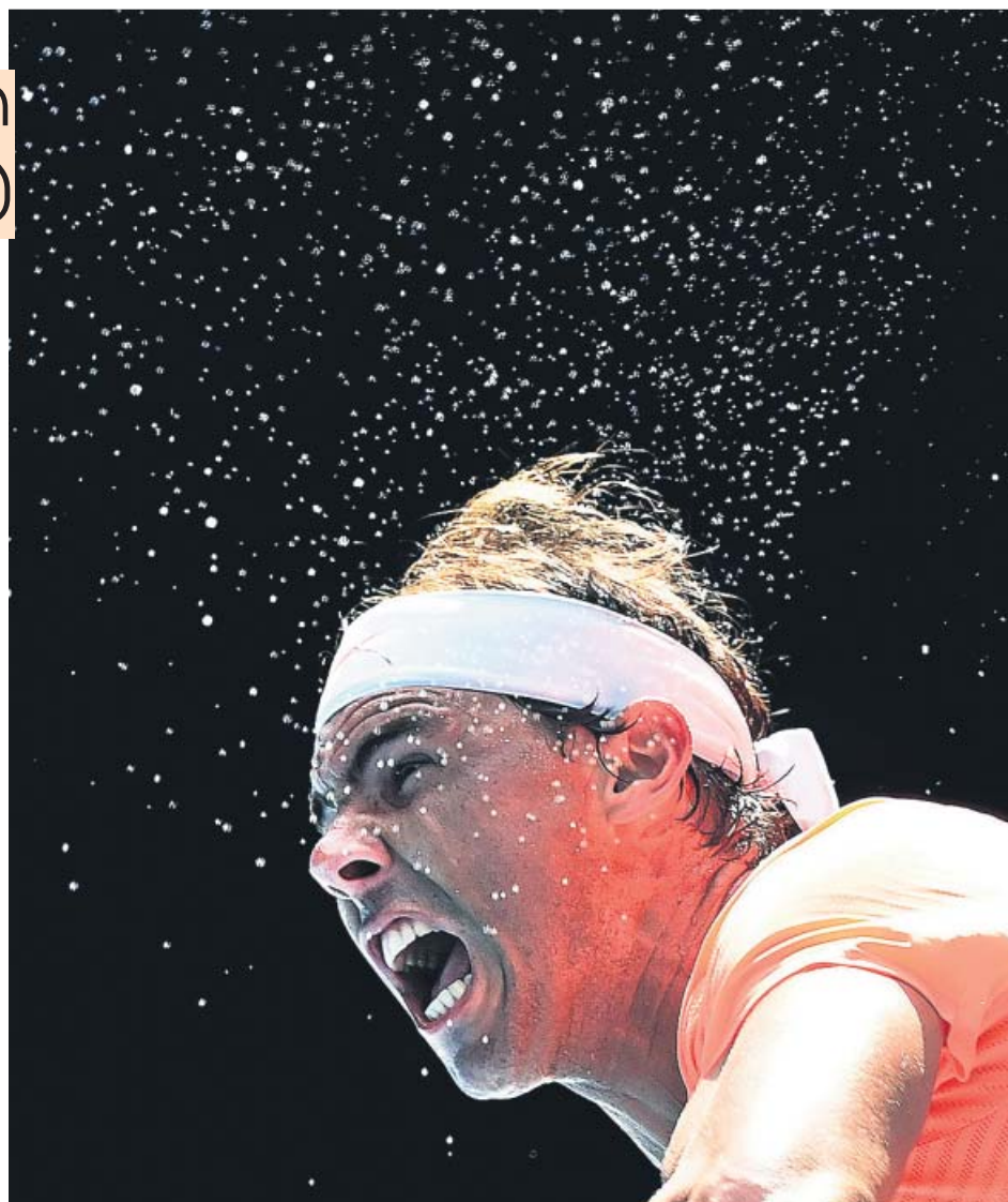
Nadal, en pleno esfuerzo durante el partido de ayer.

El segundo tomó los mismos derroteros. Rafa seguía caminando por línea recta mientras Fognini daba tumbos a base de una inspiración que le sirvió, no obstante, para ponerse con un 4-2 de cara. Pero nada. Cada resquicio que abría el italiano para disputar el partido se iba por el desagüe, y no volvió a sumar más juegos en ese set. Y eso que gozó de otro 0-40 al resto para ser feliz. Pero nada.