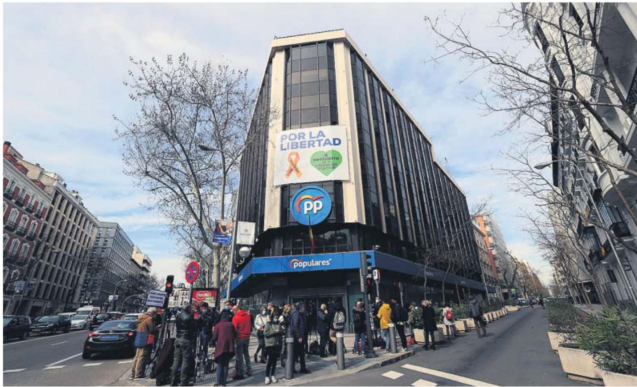
Un grupo de periodistas esperaba, ayer, en la puerta de la sede del Partido Popular en la calle Génova de Madrid.

A la hora de analizar el mal resultado del 14-F, Casado fue muy claro. «No hay nada que celebrar para los que queremos una España y una Cataluña unidas», sostuvo el líder de la oposición, pero culpó a Ferraz y al PSOE de «hundir la participación». No habrá nuevos nombres, dado que Casado respaldó sin dudas a Alejandro Fernández. El enfoque