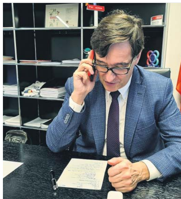
Salvador Illa, candidato del PSC a la Generalitat, ayer. PSC

En una entrevista radiofónica, Junqueras pedía a ambos partidos «que se comporten de manera responsable, que dejen de vetarse los unos a los otros y contribuyan a un Govern presidido por ERC porque el país lo necesita. Que dejen de anteponer los intereses de partido a los intereses de país». Los republica-