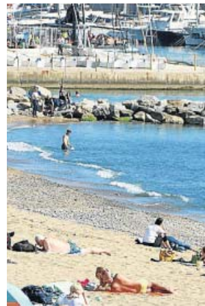
La playa del Somorrostro, en la que habrá prohibición.

Según explicó Badia, el Ajuntament puede instar a hacer cumplir la normativa pero no establecer un régimen sancionador específico, según el marco legal actual, por lo que ha iniciado contactos con otras administraciones para abordar la cuestión. Sin embargo, dijo, si un agente de la Guàrdia Urbana pide a alguien apagar un cigarrillo y se niega, podría ser multado por «desacato a la autoridad».