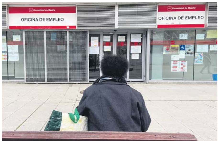
Una persona espera sentada frente a una oficina de empleo.