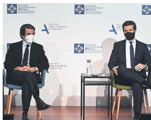
Aznar y Casado, ayer en la Universidad Francisco de Vitoria.