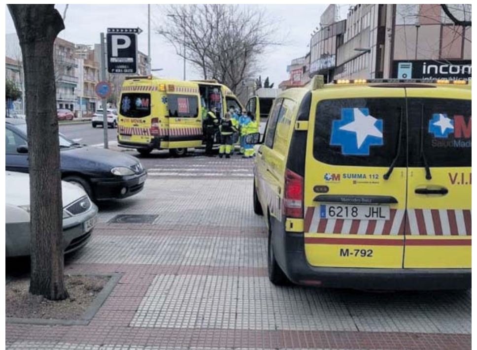
Sanitarios del Summa 112, en la calle de Torrejón donde se produjo el crimen.

14 de febrero. Un hombre de 62 años disparó a su mujer, de 52, con una carabina y después intentó suicidarse con la misma arma. El asesinato tuvo lugar en la vivienda de la pareja, ubicada en la localidad madrileña de Majadahonda, y los servicios de emergencia tuvieron que atender a la hija del matrimonio, de 22 años, por un ataque de ansiedad.