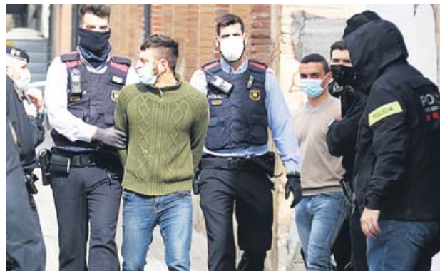
Dos de los detenidos el lunes en la operación policial.