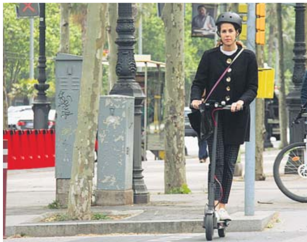
Una usuaria del patinete eléctrico en Diagonal.

Así lo indica el estudio sobre VMP presentado ayer y elaborado por el AMB y el Institut d'Estudis Regionals i Metropolitans de Barcelona (Iermb), en el que se ha analizado el uso, el comportamiento y el perfil de los usuarios de los vehículos de movilidad personal, la mayoría patinetes eléctricos.