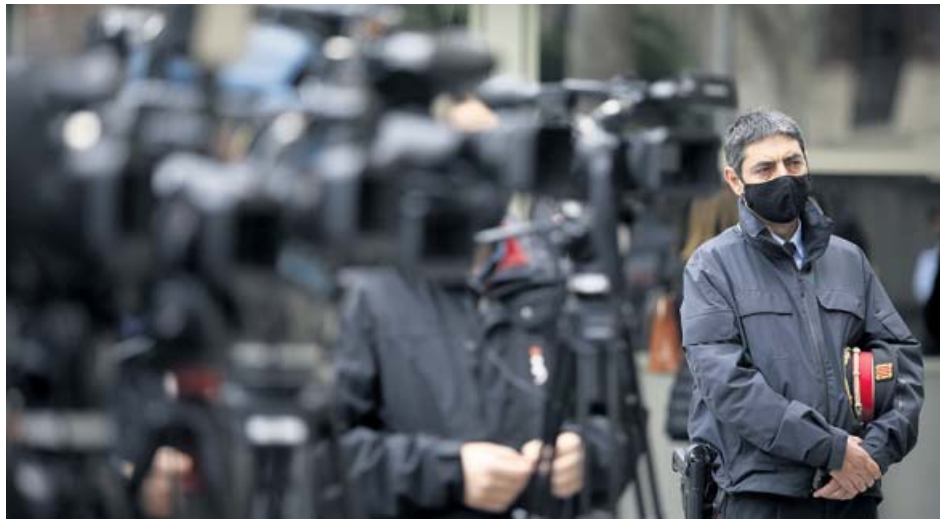
El mayor de los Mossos, Josep Lluís Trapero, tras la reunión urgente del lunes.

reaparece en una reunión con 200 mandos para analizar la actuación del cuerpo LOS 8 DETENIDOS por los ataques del sábado formaban un grupo «organizado» que los Mossos ha desactivado LA ALCALDESA Colau y el comisionado Batlle reafirman la «unidad institucional» contra la violencia