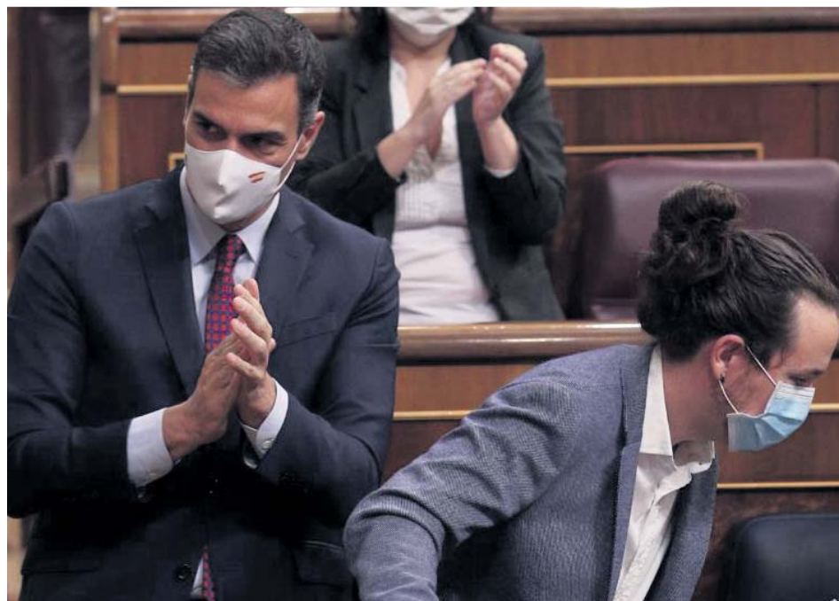
Pedro Sánchez y Pablo Iglesias durante una sesión en el Congreso de los Diputados.

Así, el Gobierno vuelve a poner por escrito el compromiso que está bloqueando la negociación de la nueva ley de vivienda entre PSOE y Unidas Podemos. A pesar de que la parte socialista del Ejecutivo se comprometió en octubre a activar este mecanismo, ahora se muestra reacia a poner tope al precio de los alquileres y se limita a proponer exenciones fiscales a propietarios que no eleven el precio del arrendamiento por encima de un determinado límite.