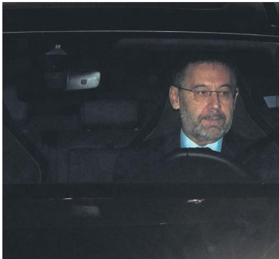
Bartomeu, tras una junta directiva poco antes de presentar su dimisión.

Como no podía ser de otra forma, en el segundo debate electoral entre los tres candidatos a la presidencia, que se produjo ayer por la mañana con Rac1 como organizador, la detención de Bartomeu tuvo su espacio. «Estamos hablando de que es posible que un expresidente haya usado dinero de la entidad para atacar a jugadores y personas del entorno del barcelonismo, entre ellos yo mismo», denunció Víctor Font. «No podemos prejuzgar ni aprovechar esta situación para beneficio propio. No corresponde. Hay que dejar evolucionar el proceso», expuso por su parte Joan Laporta. «Que esto se produzca a pocos días de las elecciones...», deslizó Toni Freixa,