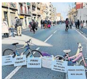
Protesta para reclamar la calle Arago sin coches.

Así, el ruido se erige como el segundo problema de salud pública más importante de Barcelona, después de la contaminación ambiental. De hecho, la