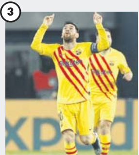
Messi supera a Xavi El argentino superará ante el Huesca a Xavi Hernández como el jugador que más partidos ha disputado con la camiseta del FC Barcelona. Con el de hoy serán 767.

Los atacantes rojiblanco no tuvieron su día ante un inspirado David Soria, lo que le costó dos puntos al Atlético. Suárez se estrelló contra el palo, Llorente no estuvo acertado y Dembélé se topó con el meta getafense. La buena noticia para los rojiblanco es que hubo muchas ocasiones y que Jan Oblak no encajó ningún gol.