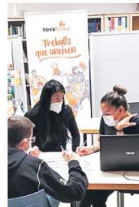
Jóvenes recibiendo formación en Valencia.

Esta iniciativa consolida la colaboración entre ambas instituciones iniciada en 2016 para ayudar a mejorar la empleabilidad de las per-