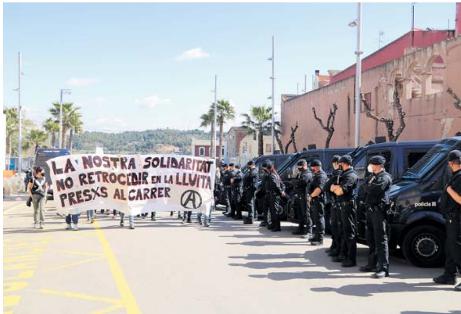
La cabecera de la marcha en Martorell, con un fuerte dispositivo policial.

La protesta, convocada por la CUP y varios colectivos independentistas y vinculados a la izquierda anticapitalista, recorrió seis kilómetros por la carretera B-220, que en algunos momentos cortó al tráfico. Debía empezar a las 11 de la mañana, pero comenzó una hora más tarde porque los Mossos d'Esquadra identificaron a todas las personas que bajaron del tren en Martorell. Además, siguieron en todo momento la manifestación,