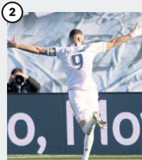
Benzema, salvador Si el Madrid está hoy vivo en la Liga es gracias al galo. Dos goles suyos ante el Elche el sábado, unido al que metió en el derbi ante el Atleti, mantienen con vida a los blancos.