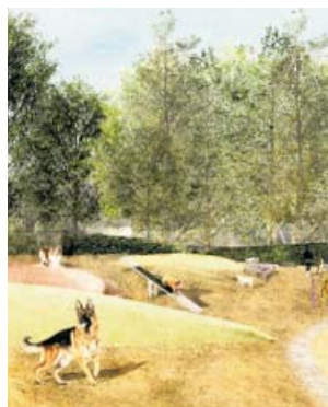
Una imatge virtual.

El projecte neix de l'acord assolit amb veïns i tenidors de gossos per tal de tenir dues zones diferenciades i evitar que els animals estiguin sense lligar per tot el parc i el marmet. A més, també s'aprofita per millorar l'accessibilitat, connectivitat i visibilitat del conjunt del parc.