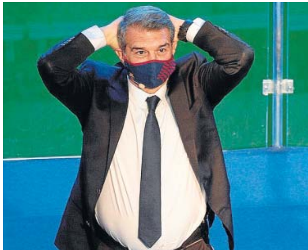
Laporta, eufórico Al nuevo presidente se le vio exultante al tomar posesión

EN FOTOS La segunda investidura de Joan Laporta