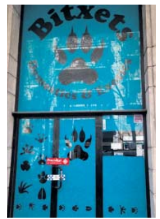
Entrada a la botiga.

També presentaven simptomatologia de tos de les gosseres, coronavirus caní, lesions dèrmiques provocades per fongs i sarna i ma-