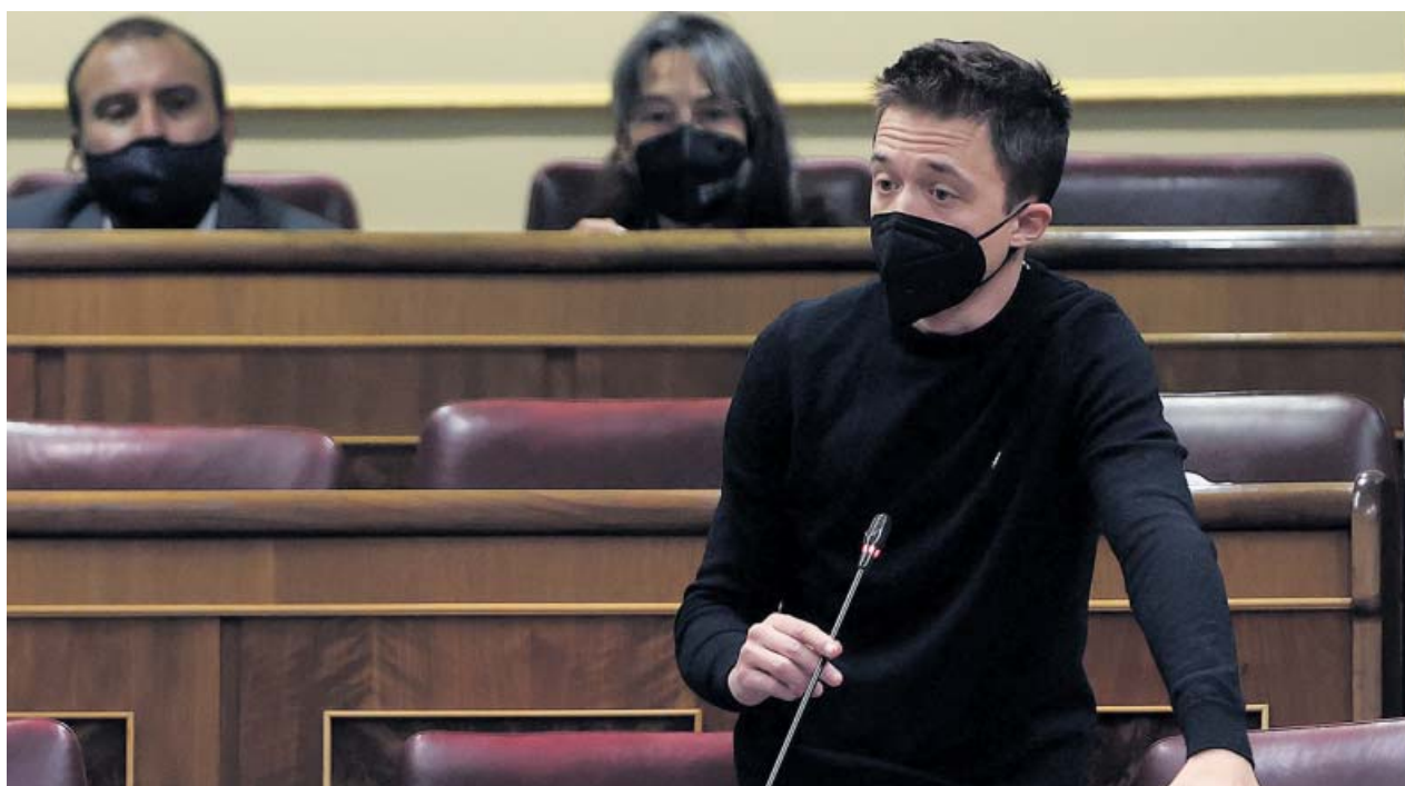
El líder de Más País, Íñigo Errejón, ayer, durante su intervención en el Congreso de los Diputados.

El líder de Más País, Íñigo Errejón, habló ayer en el Congreso sobre salud mental. Mientras formulaba varias preguntas, se pudo escuchar cómo un diputado del PP le decía «vete al médico». Fue el también alcalde de Palos de la Frontera (Cádiz), Carmelo Romero, que tras la sesión pidió disculpas: «Ha sido una frase desafortunada», puso en Twitter. Errejón contestó que su acto «demuestra todo lo que queda por hacer. Nunca más el estigma ni la vergüenza». ●