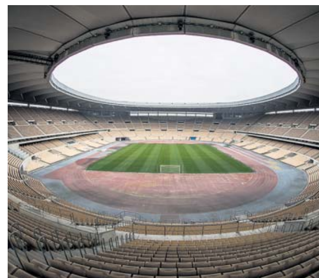
Estadio de La Cartuja, sede de las dos finales coperas.

Sin embargo, ayer por la tarde la ministra de Sanidad, Carolina Darias, se mostró totalmente en contra de que haya público en la final. «No es adecuado, no es oportuno y no es conveniente. Esta mi-