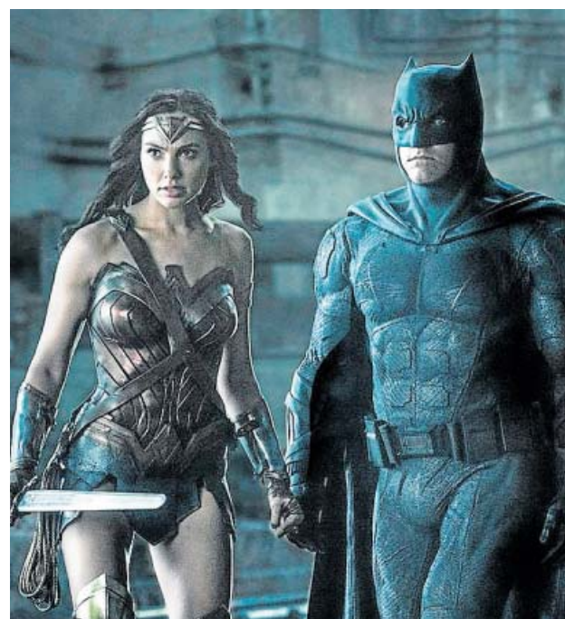
Wonder Woman (Gal Gadot) y Batman (Ben Affleck).

La cantante Zahara publicará el próximo 30 de abril su nuevo disco, que se titulará Putá , apelativo que ella misma recibía con solo 12 años. Merichane , Canción de muerte y salvación y Taylor son algunos de los temas del álbum.