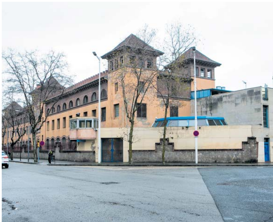
La prisión de Wad-Ras en la Vila Olímpica, que se cerrará en 2027. GENERALITAT DE CATALUNYA

UNA DE LAS NUEVAS cárceles será exclusiva para mujeres y tendrá espacios de crianza