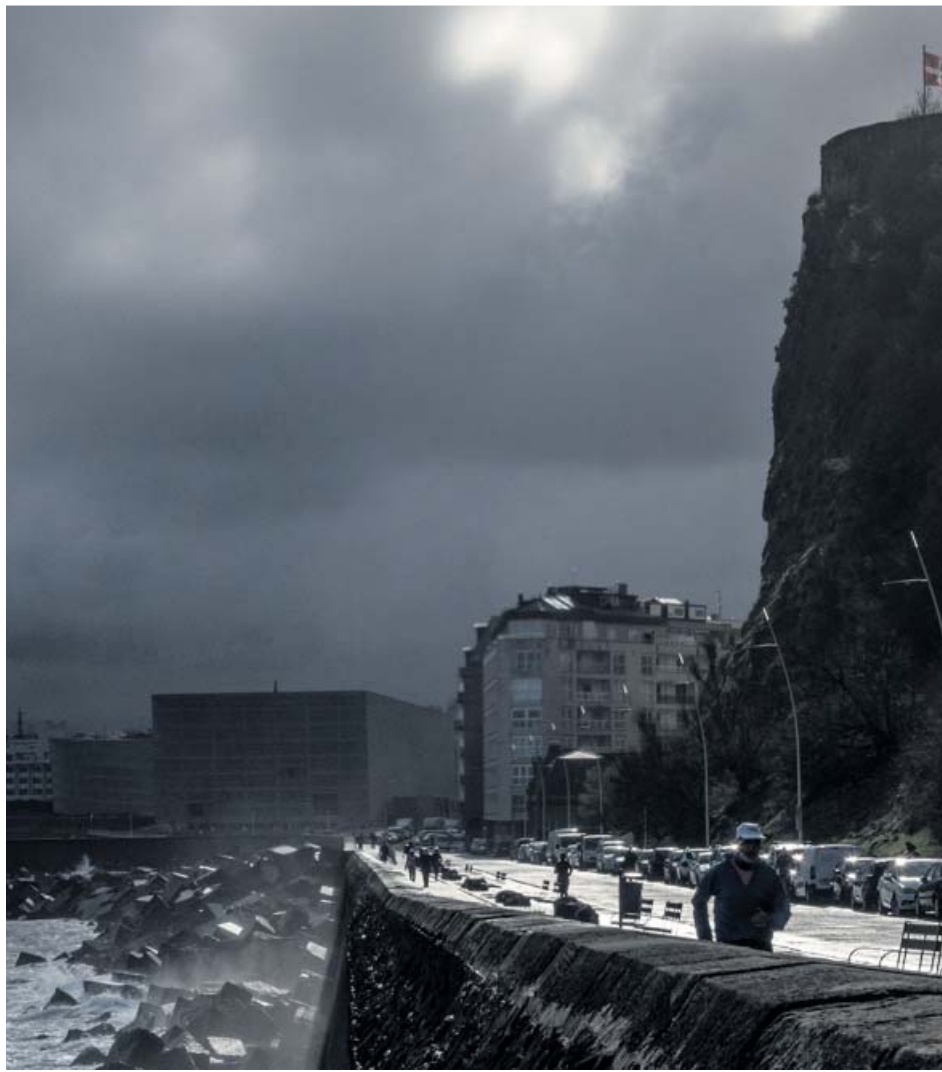
Personas caminando por el Paseo Nuevo de San Sebastián con el cielo encapotado.

Martín quiere subrayar la peligrosidad de las condiciones invernales, por lo que, ante posibles desplazamientos, aconseja «estar pendiente a los avisos de la Agencia Estatal de Meteorología (Aemet)» y tomar las precauciones necesarias.