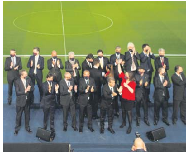
Presentación de la cúpula Acudió toda la nueva directiva... y casi 300 personas