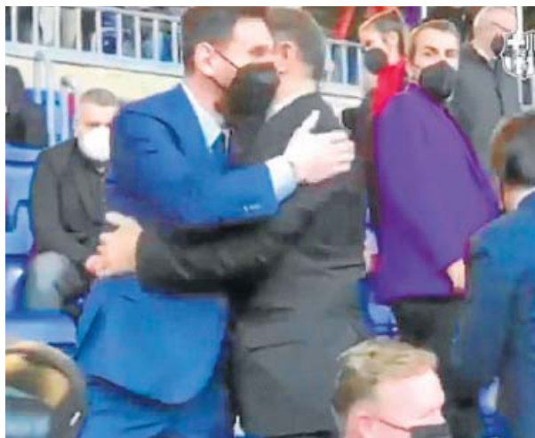
El abrazo con Messi Leo no se lo perdió y destacó su abrazó con Joan Laporta