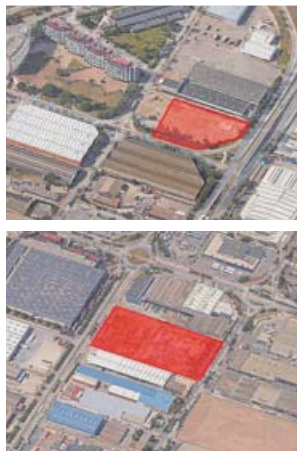
Los solares de la Zona Franca que se usarán.

Esta estaba parada porque se encontraron restos de metales pesantes, como el plomo, en el subsuelo, debido a la actividad industrial que se desarrollaba en el lugar, pero ambas administraciones han llegado a un acuerdo para solucionar el problema. Según apuntó la consellera de Justicia, Ester Capella, el Consistorio asumirá el coste de la descontaminación si es inferior a los ocho millones de euros, y si sube más, el Departament de Justicia de la Generalitat pondrá la diferencia. El acuerdo se firmará en las próximas semanas, una vez ob-