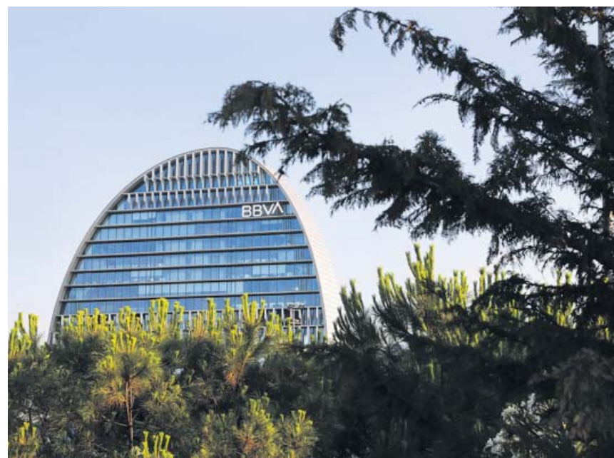
L'emblematik edifici LA VELA, seu de BBVA a Madrid.