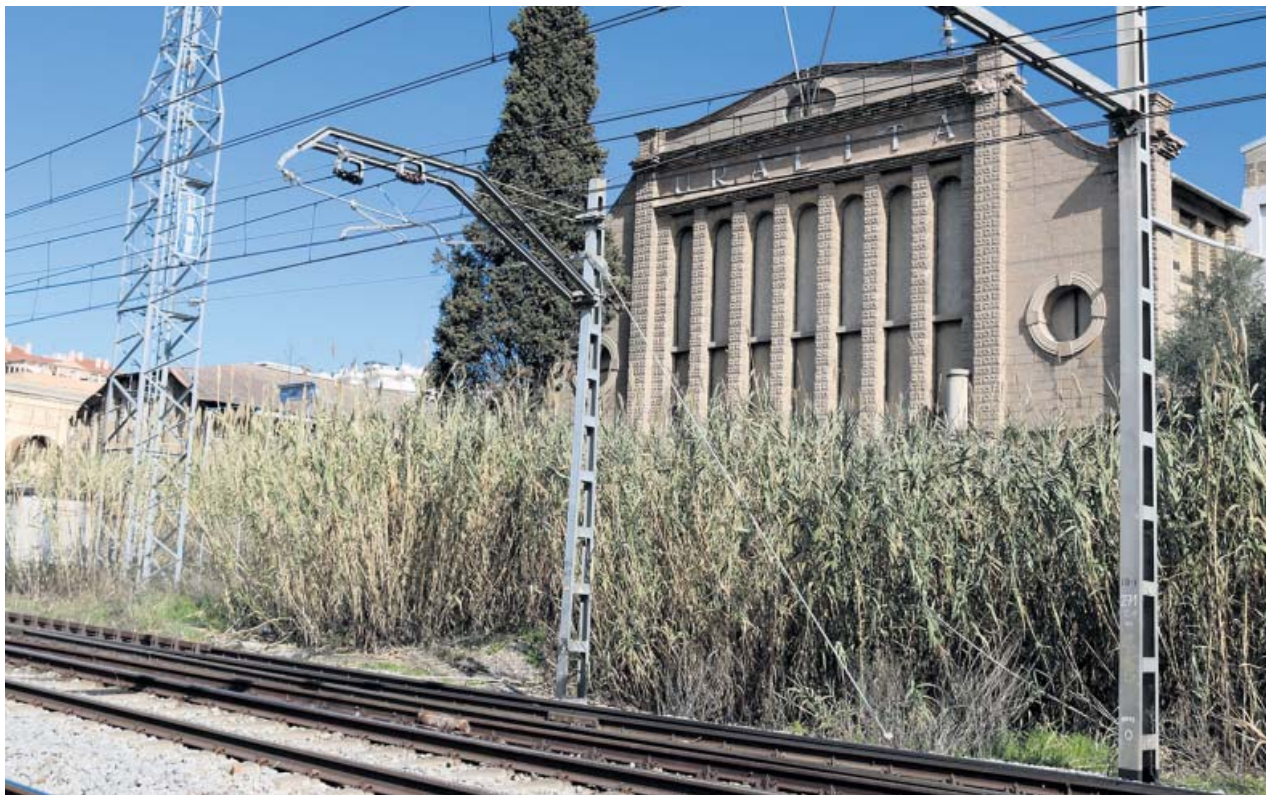
La fàbrica de Uralita de Cerdanyola del Vallès (Barcelona), situada junto a la vía del tren.