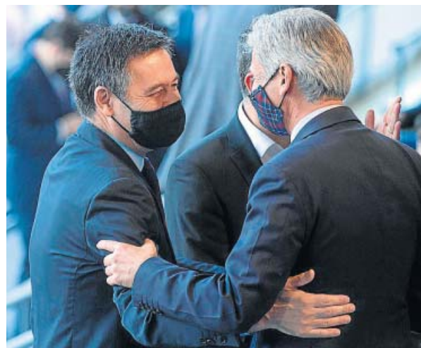
Estuvo Josep Maria Bartomeu Pese a sus problemas con la justicia, el expresidente acudió