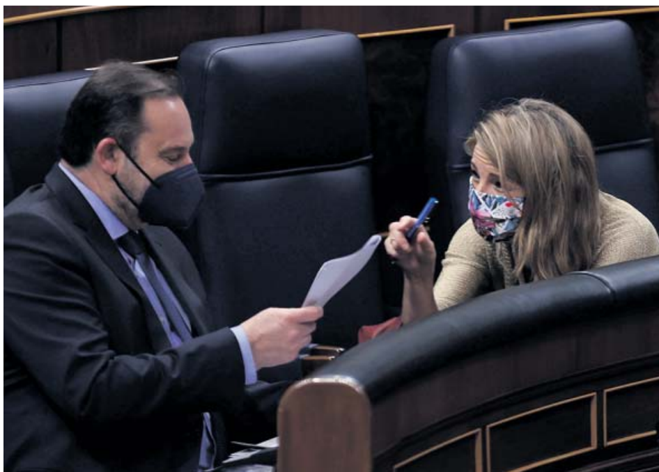
El ministro de Transportes, José Luis Ábalos, con la ministra de Trabajo, Yolanda Díaz.