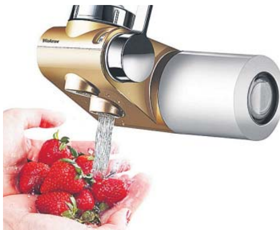
WINARROW / AMAZON