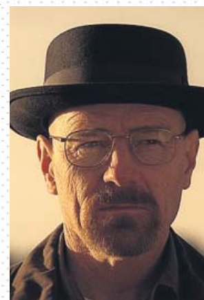
El actor Bryan Cranston, protagonista de la serie.

Está claro que ver a Walter cada vez más empecinado