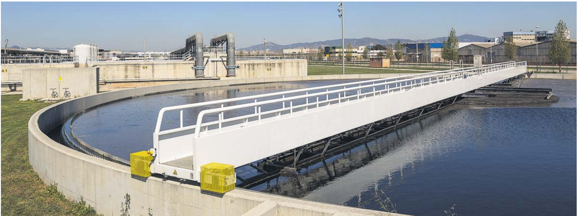
La ecofactoría de Baix Llobregat genera toda la energía que necesita, regenera el agua y valoriza los residuos. AIGÜES DE BARCELONA