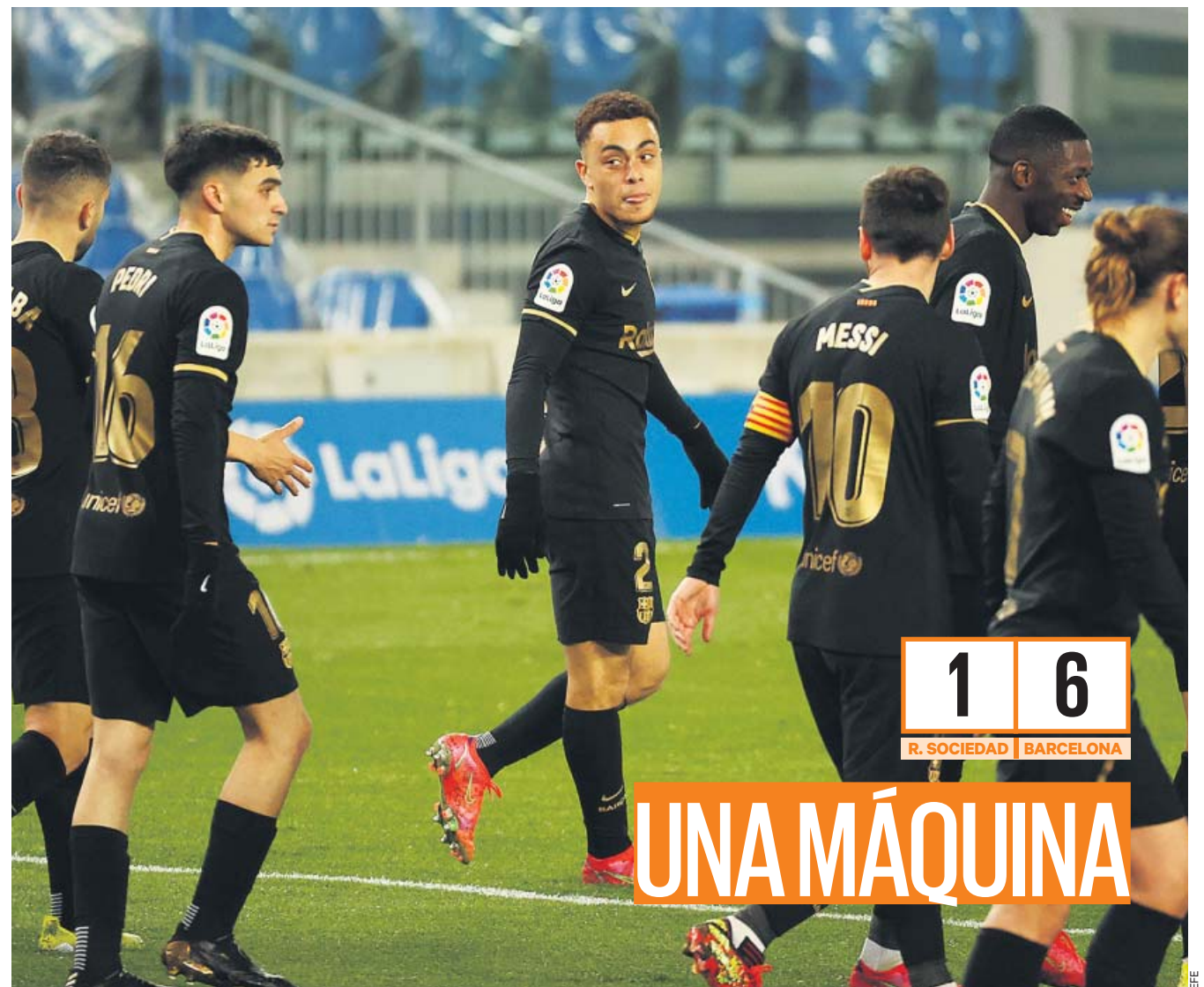
El Barcelona sigue intratable y ayer se exhibió ante la Real Sociedad con un partidazo en el que marcaron Griezmann, Dest (2), Leo Messi (2) y Dembélé. El Atlético sigue a cuatro puntos. PÁGINA 10