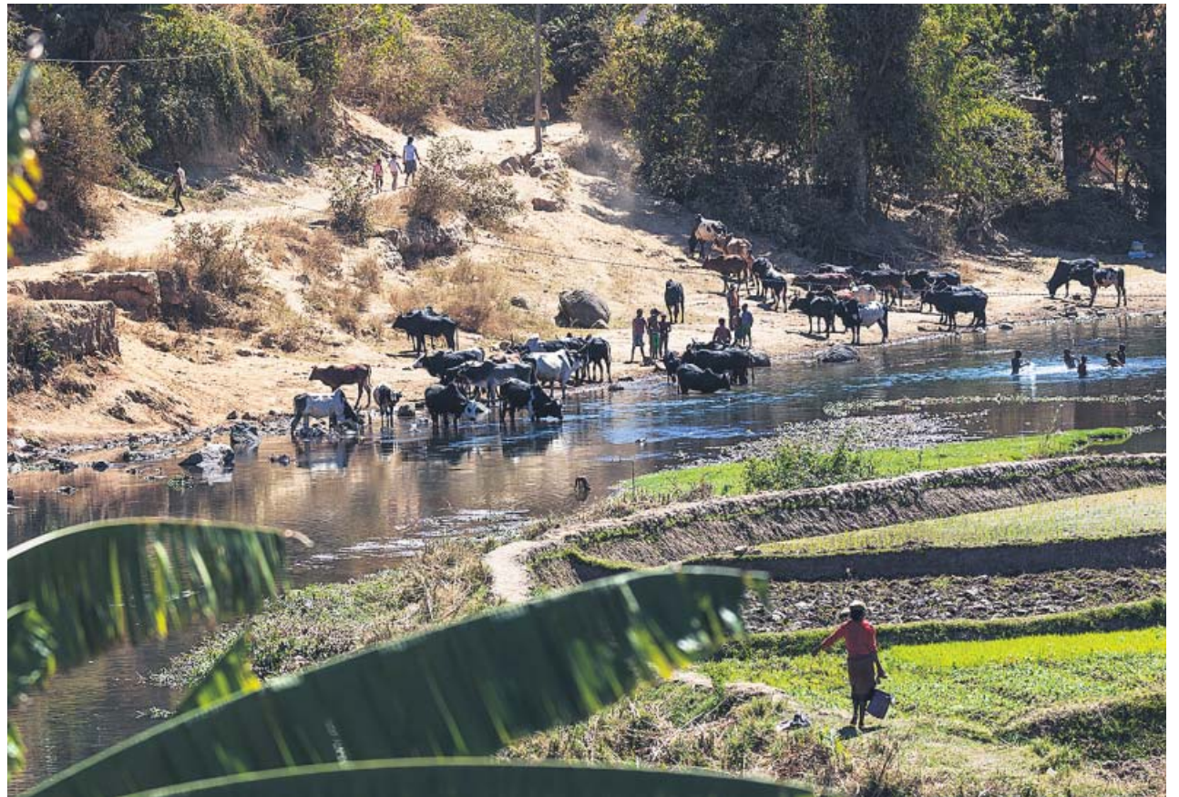
El acceso al agua es complicado en algunas zonas del planeta como Ampefy, en el centro de Madagascar (África).

El agua, el elixir de la vida, es un recurso necesario y, en muchas regiones, un lujo. Tres de cada diez personas carecen de acceso a servicios de agua potable y, cada día, alrededor de mil niños mueren a causa de enfermedades diarreicas asociadas a la falta de higiene