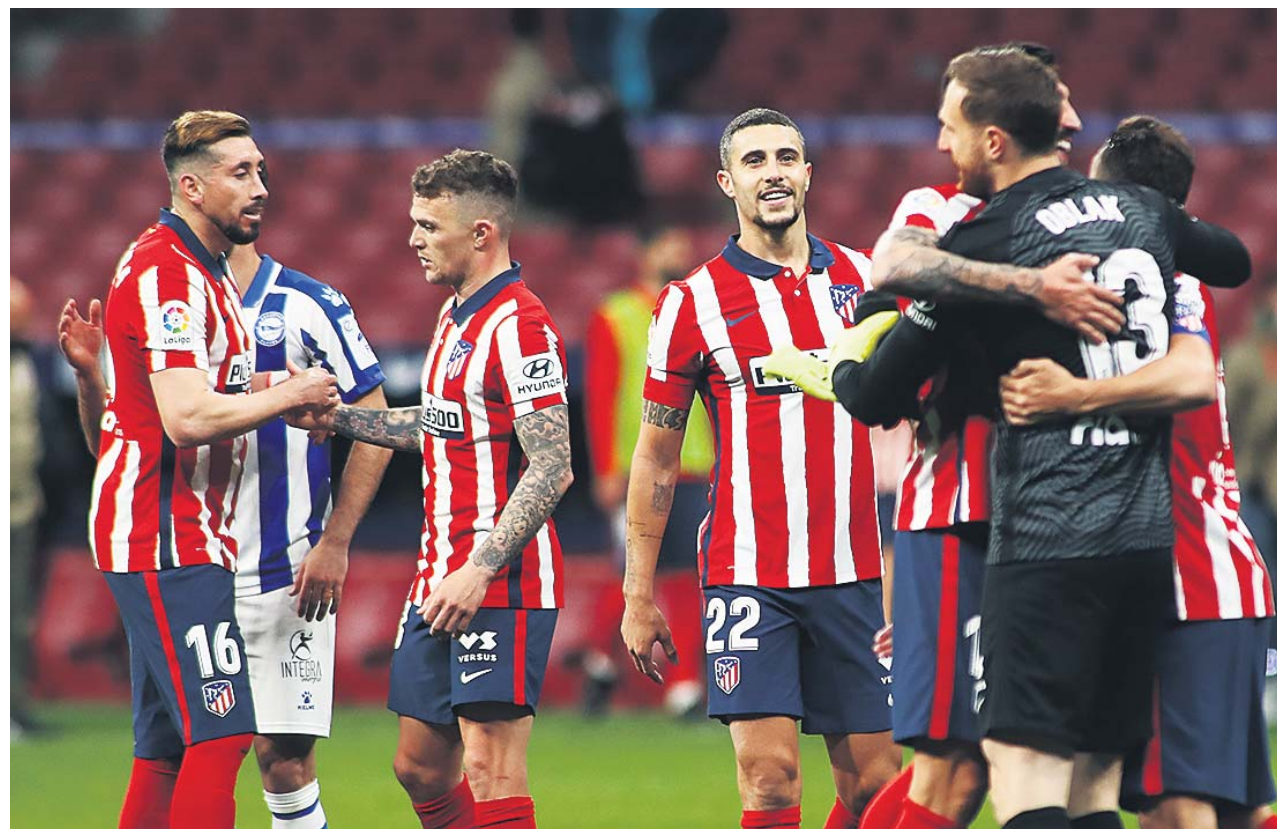
Jan Oblak y Luis Suárez se abrazan tras el partido. Fueron los protagonistas de la victoria colchonera.