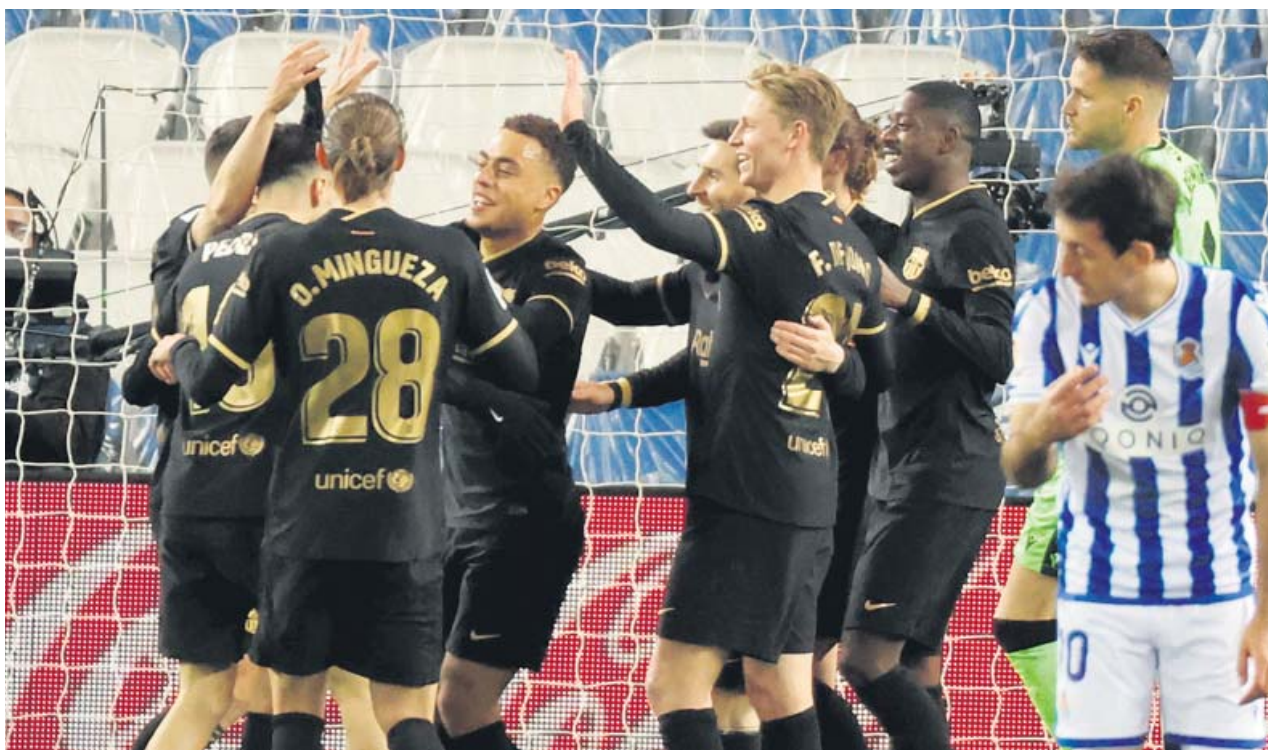
Los jugadores del FC Barcelona celebran uno de los goles ante la Real Sociedad.