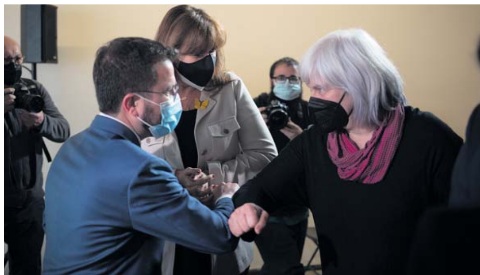
Pere Aragonès (ERC) saluda a Dolors Sabater (CUP) ante la mirada de Laura Borràs (JxCat).

Esquerra Republicana (ERC) y la CUP anunciaron ayer un preacuerdo para investir a Pere Aragonès como presidente de la Generalitat. Después de semanas de negociaciones entre JxCat, la CUP y ERC, este es el primer paso para poder llegar a un acuerdo entre todos los partidos independentistas que haga viable una investidura antes de que el próximo viernes 26 de marzo expire el plazo para convocar el pleno que lo haga posible. Las negociaciones, no obstante, continúan, y está previsto que las conversaciones continúen esta próxima semana, dado que las tres formaciones se han comprometido a intentar hacer un pacto de investidura y, si puede ser, de legislatura. Después del acuerdo por la presidencia del Parlament, adjudicada a Laura Borràs (JxCat), este preacuerdo añade presión a Junts para que se sume.