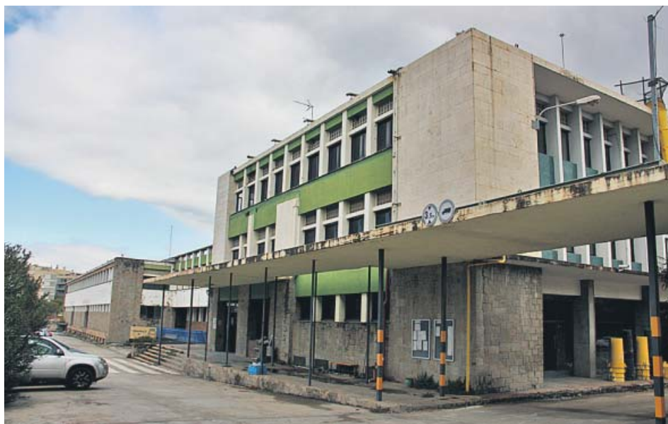
La fachada de la fábrica, que permanece sin actividad desde 2007.

El proyecto prevé conservar los edificios industriales del re-