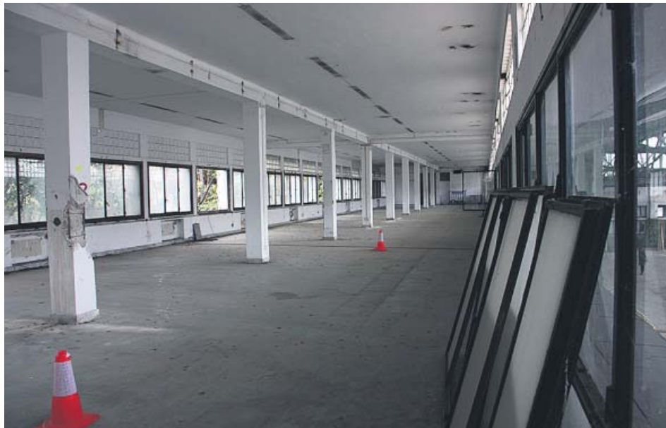
Los edificios del recinto fabril, como el de la imagen, se conservarán.

cinto fabril, que tiene una superficie de 90.641 metros cuadrados y se sitúa a caballo entre Bon Pastor y Sant Andreu del Palomar, en una finca delimitada por las calles de Sant Adrià y Ciutat d'Asunción y el paseo de L'Havana. La nave central será una plaza y las de alrededor albergarán empresas vinculadas a la creatividad, el diseño y las nuevas tecnologías –de los 5.000 empleos que se prevé generar, 3.000 estarán relacionados con las industrias creativas y la industria 4.0–.