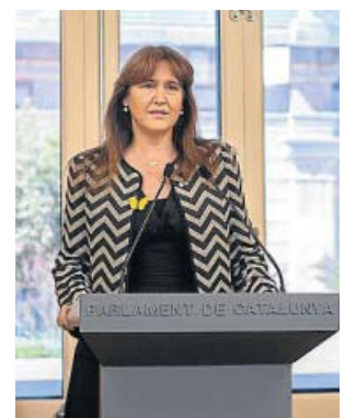
La presidenta del Parlament, Laura Borràs.

Basándose en ello, el tribunal acuerda remitir testimonio de las actuaciones al TSJC «a los efectos que sean procedentes». A la espera de lo que decida el instructor que asuma el caso en el TSJC, fuentes jurídicas consultadas consideran que la causa está ya muy avanzada porque se han practicado la mayoría de diligencias solicitadas por las partes, algunas de ellas encargadas a los Mossos d'Esquadra y otras a la Guardia Civil.