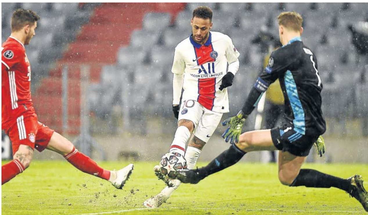
Neymar ante Neuer durante el partido de ida entre Bayern y PSG en el Allianz Arena. EFE