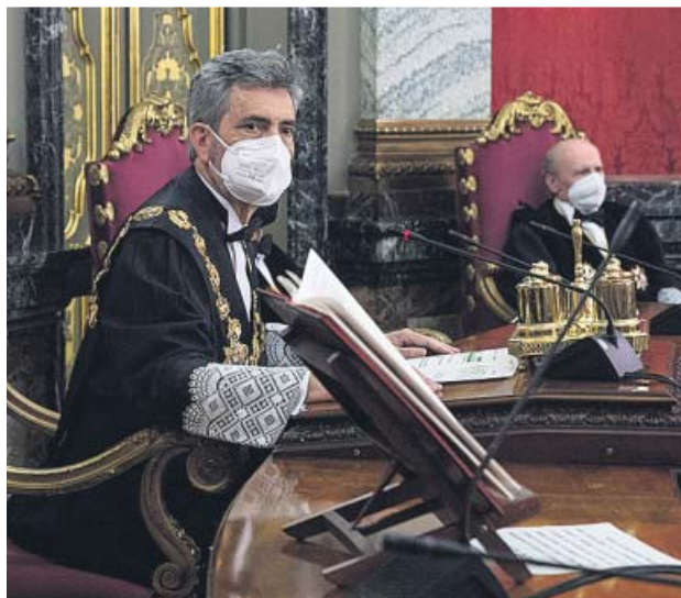
Carlos Lesmes, presidente del CGPJ.

«Esa reforma deja al CGPJ sin funciones de designación de cargos judiciales», señala el escrito, dirigido a la vicepresidenta de la Unión Europea para Valores y Transparencia, Vera Jourová, y al comisario europeo de Justicia, Didier Reynders.