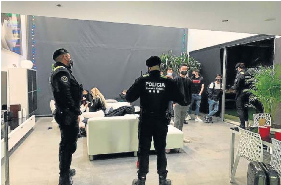
Fiesta ilegal desmantelada el pasado 29 de marzo en Badalona.

LOS ENFERMOS CRÍTICOS de Covid ya son 515 en las UCI y al Govern le preocupa rebasar los 700 en pocos días