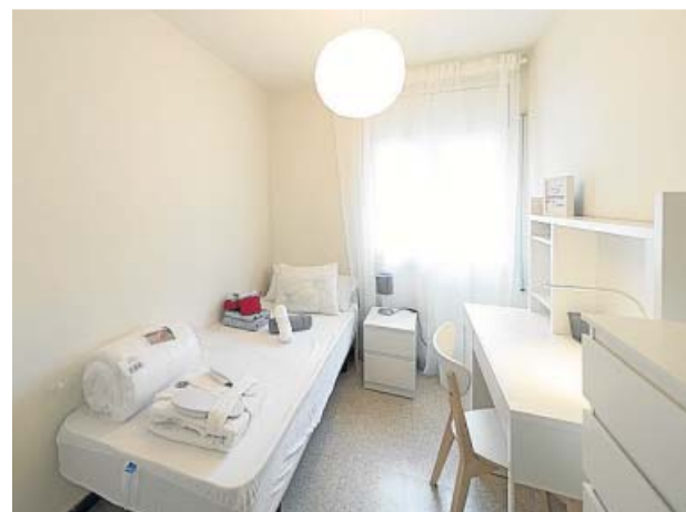
Habitación del Centro La Violeta de Barcelona. MIQUEL TAVERNA

El equipamiento cuenta con un comedor, sala de estar, cocina, lavandería y terraza comunes, pensadas para que las residentes se relacionen y compartan experiencias. Aparte, cada una tendrá su propia habitación con cama, escritorio y baño privado. El centro