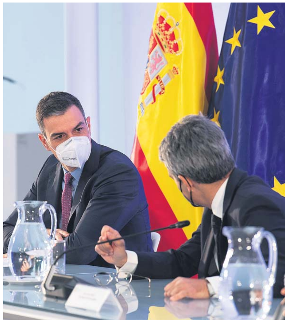
Sánchez, ayer en un acto con el presidente de la Cámara de Comercio de USA en España.

PENSIONES Escrivá plantea pagar hasta 12.000 euros a las personas que acepten retrasar su jubilación