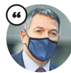
MIQUEL SÀMPER Conseller de Interior en funciones

«La pandemia ha demostrado que los Mossos y las policías locales han avanzado hacia una mejor colaboración»