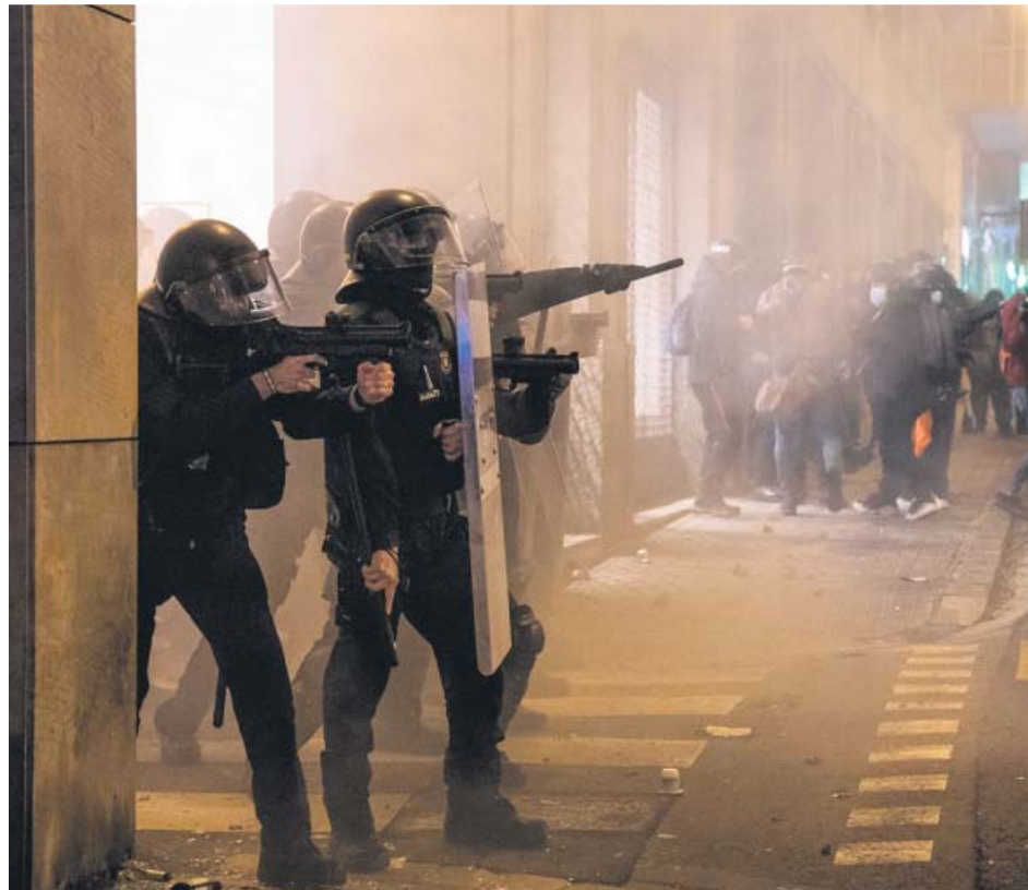
Mossos d'Esquadra con lanzaderas de foam durante las protestas por Hasel. HUGO FERNÁNDEZ

Eso sí, antes de usar las lanzadoras de foam, «será necesario haber agotado las vías de diálogo y mediación» y hacer un aviso de que se va a hacer uso de esta munición de precisión. Sin embargo, no será obligatoria la comunicación previa de su uso en las manifestaciones «cuando se pro-