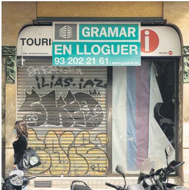
Una mujer, ayer, frente a un local vacío en Barcelona.

Son el 7,5% de los 5.323 que están vacíos. El Ajuntament destinará 16 millones de euros a crear bajos de protección oficial