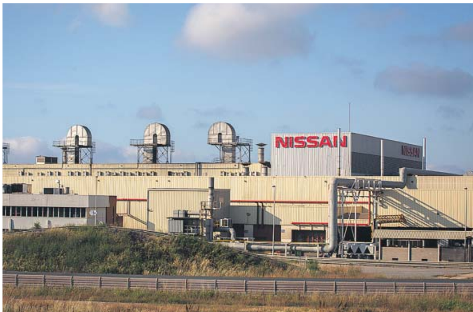
Exterior de la fábrica de Nissan en la Zona Franca de Barcelona.

LAS PLANTAS de la multinacional japonesa en Barcelona cerrarán en diciembre de este año