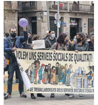
Protesta de les treballadores socials a Barcelona. H. F.

«Existeix un excés de burocràcia i, a més, atenen encàrrecs que provenen d'altres sistemes que no donen resposta i que no corresponen a Serveis Socials Bàsics, com la gestió de l'Ingrés Mínim Vital o la Renda Garantida», va explicar el col·legi a través d'un comunicat. Considera que és «evident» que amb l'actual crisi econòmica ha aug-