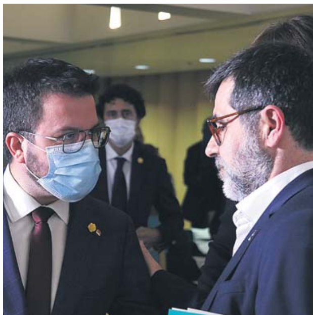
El vicepresidente, Pere Aragonès, con Jordi Sànchez (JxCat).

Mientras que desde Junts pedían una mayor implicación de Aragonès en las negociaciones para poder llegar a puntos de encuentro sobre cuestiones que se resisten, como la de consensuar el papel que ha de tener el Consell per la República (CxR) en el nuevo ejecutivo, ERC mantiene que no hay motivos de peso para demostrar más el pacto y que, en to-