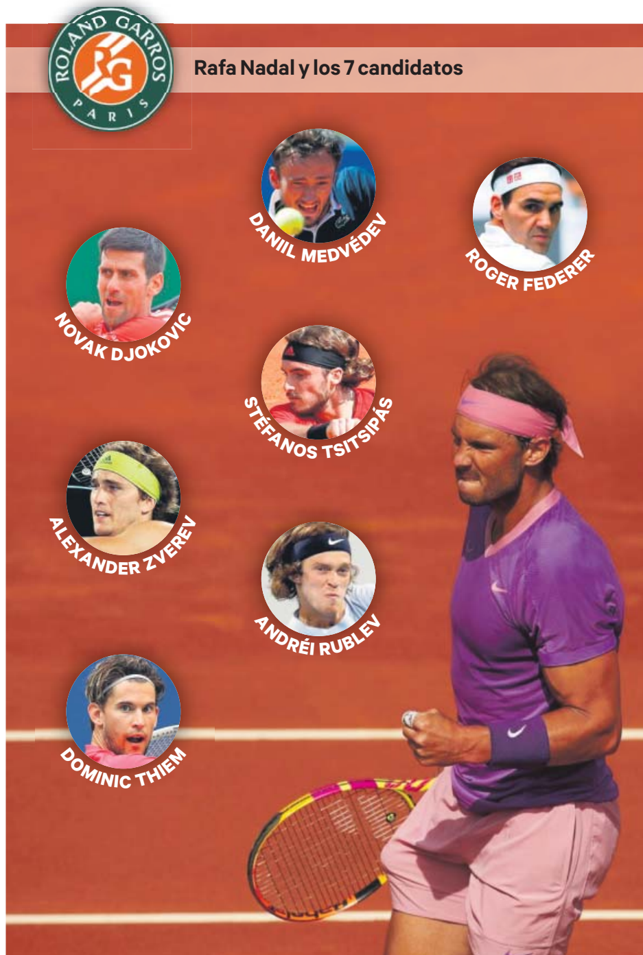
Rafa Nadal y los 7 candidatos

En esos Grandes Premios, el fin de semana se desarrollará con una sesión de entrenamientos libres el viernes (1 hora), seguida de una primera sesión de clasificación, similar a la actual, que determinará la parrilla de salida del sábado. Ese día, tras una segunda sesión de libres (1 hora), tendrá lugar una clasificación al esprint, que será como una minicarrera de 100 kilómetros y que determinará la parrilla de salida de la carrera del domingo. Además, esa novedosa clasificación al esprint tendrá premio en forma de puntos: 3, 2 y 1 para los tres primeros clasificados. ●