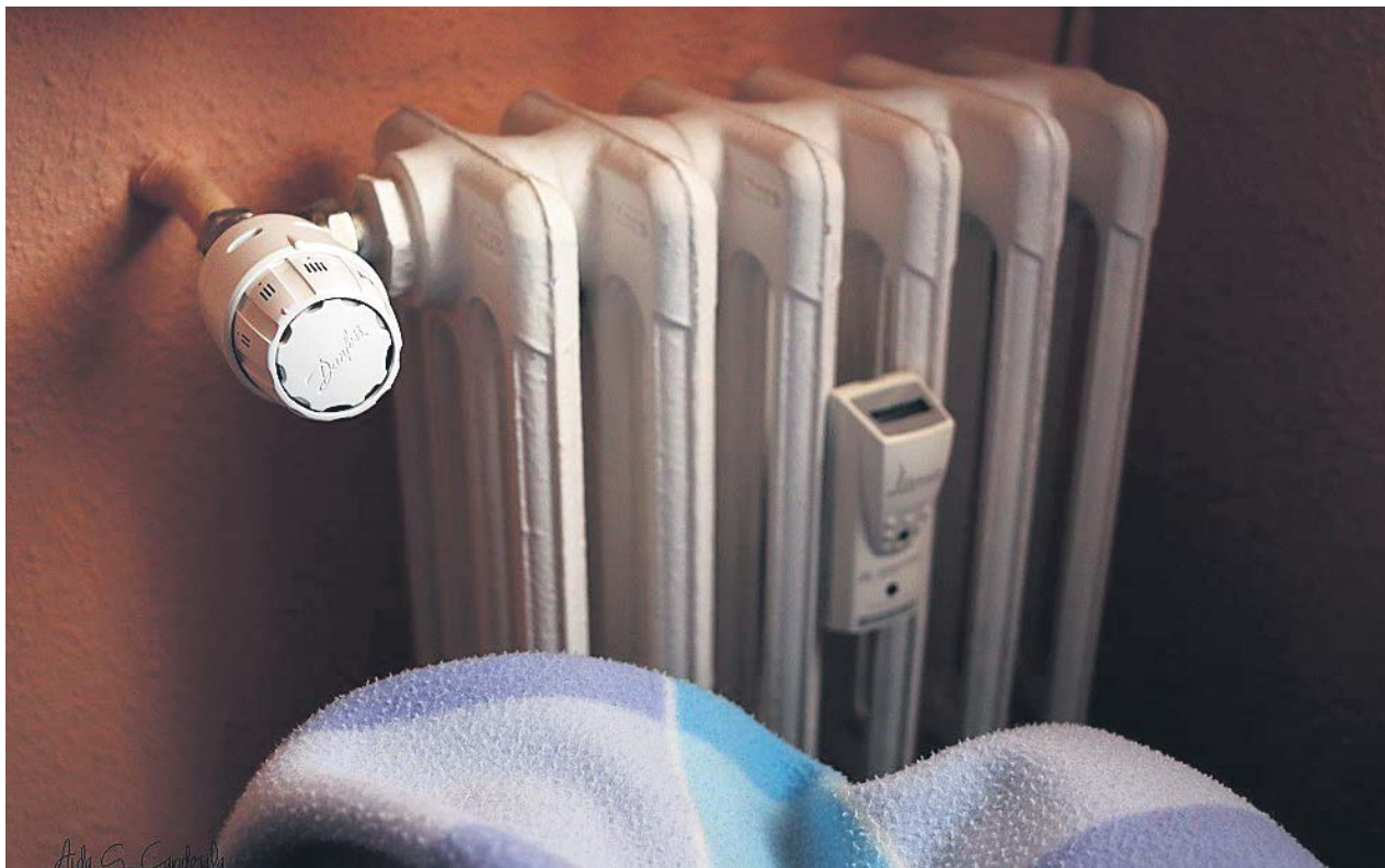
Una persona calentándose con una manta y un radiador. CREU ROJA