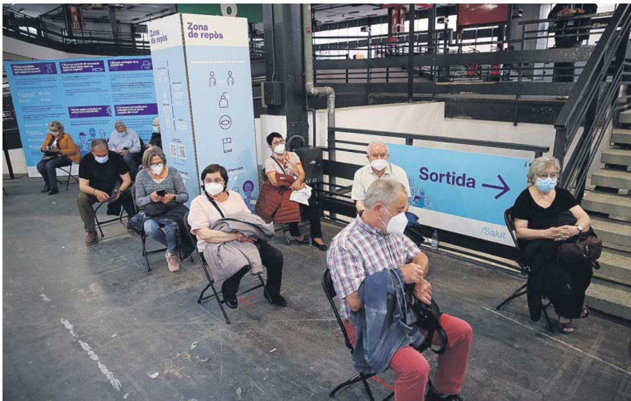
Un grupo de personas esperan a ser vacunados contra la Covid en Fira durante la prueba piloto que se realizó ayer.

La consellera de Salut en funciones, Alba Vergés, anunció ayer que se administrarán hasta 6.000 vacunas de Pfizer contra la Covid-19 a lo largo del próximo fin de semana, del 30 de abril al 2 de mayo, en el recinto de Fira de Barcelona a personas de entre 70 y 79 años. Lo explicó tras visitar ayer una prueba piloto en el recinto en la que se vacunó a más de 1.000 personas con AstraZeneca. «La estrategia de vacunación coge impulso, lo que permite iniciar puntos de vacunación más masivos», destacó Vergés. En Fira se podrían llegar a inocular unas 120.000 dosis a la semana. ● R. B.