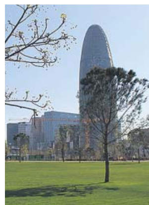
Parque de la Canòpia Urbana de Glòries. AJUNTAMENT

Climática y Transición Ecológica, Eloi Badia, aseguró ayer que la ciudad va con buen ritmo para cumplir con el plan en este mandato, ya que entre 2019 y 2021 ya se han añadido cerca de 20 nuevas hectáreas verdes, y en los dos años que quedan está previsto sumar 19 más. Entre las actuaciones que ya se han efectuado figuran el parque de la Canòpia