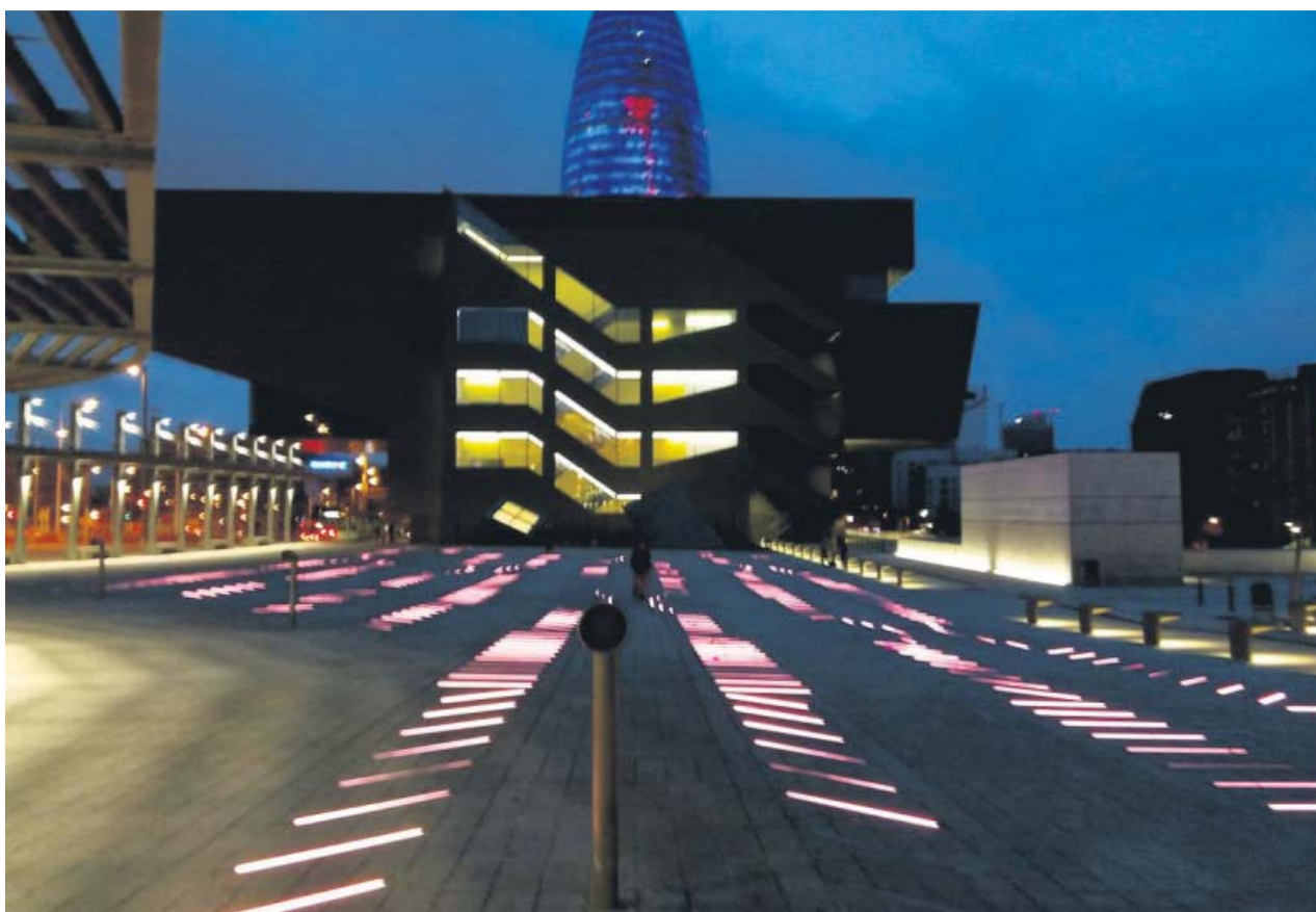
Exterior del edifici del Disseny Hub Barcelona, con la Torre Agbar de fondo.