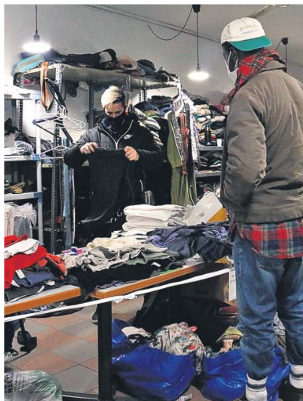
Un usuario del gimnasio de Sant Pau recoge una muda de ropa.