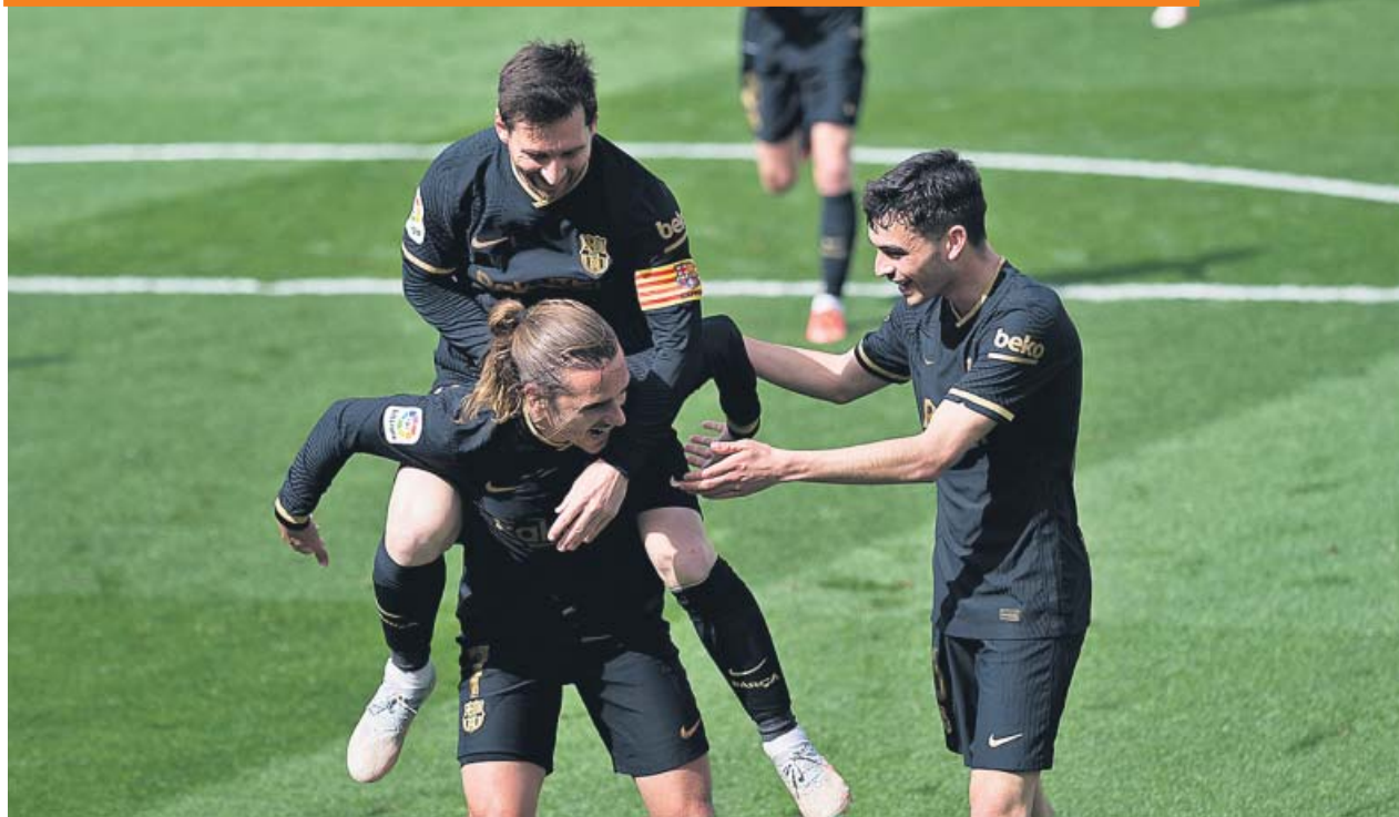
Griezmann y Messi, el dúo atacante del Barcelona, se encuentra en plena forma.