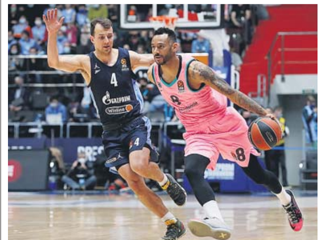
Hanga bota el balón con la defensa de Pangos.

A la salida del vestuario, Davies seguía a la suyo: un rebote ofensivo, un mate y otro triple. El Zenit no podía frenarlo y las dudas locales fueron abriendo el marcador para el Barcelona, que se llevó un botín de oro. ●