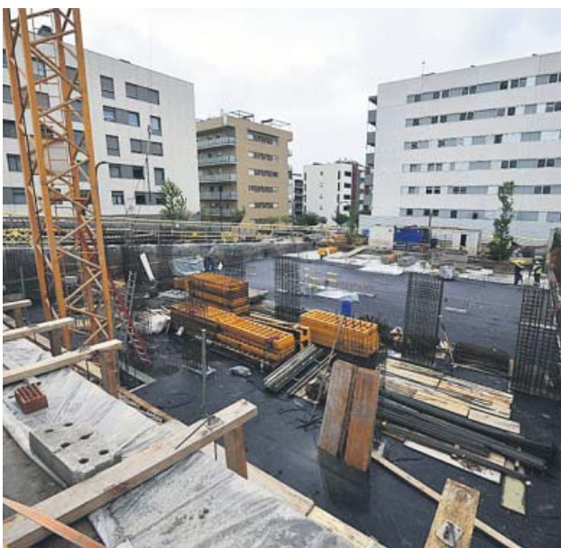
Construcción de vivienda pública en Sant Just Desvern. AMB

●●● El AMB quiere que los fondos europeos den un impulso a la rehabilitación del parque de viviendas metropolitano, con un plan que mejore la eficiencia energética de hasta 12.971 hogares en 35 municipios del entorno de Barcelona para reducir hasta 13.295 toneladas de CO 2 . Este plan prevé diferentes grados de intervención en las viviendas, mediante un modelo de colaboración público-privada entre la Administración y las comunidades de propietarios.