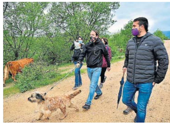
PABLO IGLESIAS (PODEMOS)

«Un día más en la sierra de Madrid, recargando pilas para lo que viene», escribió en su cuenta de Twitter, junto a esta imagen en la que se relajaba en algún rincón de la sierra madrileña. También paseó por el parque del Retiro con miembros de su candidatura.