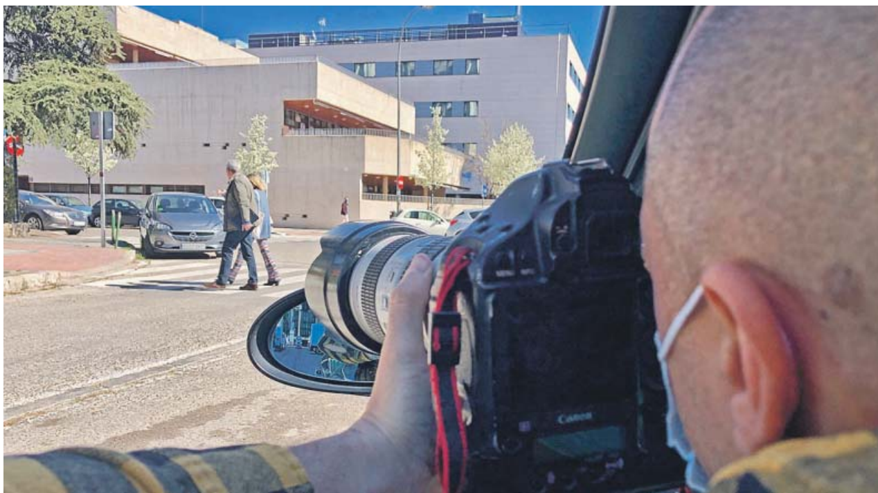
Los detectives privados también persiguen el fraude con el teletrabajo. JORGE PARIS