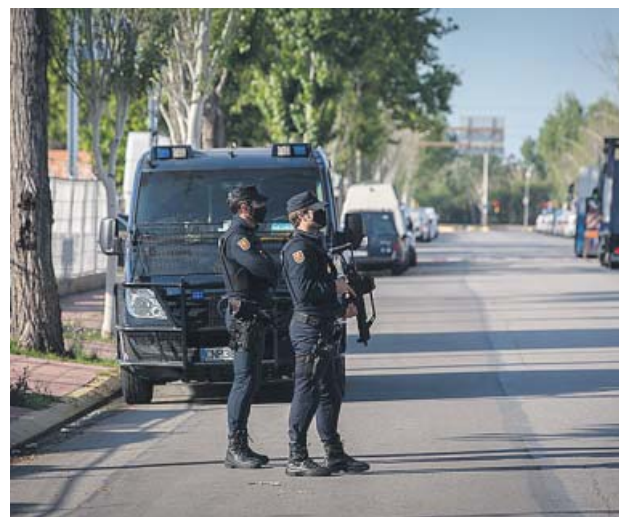
Agentes de la policía custodian el centro de vacunación. EP

El Departamento de Salud reserva la vacuna de Moderna para uso hospitalario, principalmente para inmunizar al personal sanitario (el 79,5% ya tiene la pauta completa) y