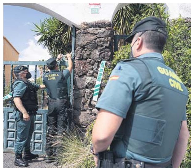
Los agentes, ayer, en la vivienda de Gimeno.

Con estos indicios sobre la mesa, y la orden de búsqueda internacional dictada el sábado por el Juzgado de Instrucción número 3 de Güímar, efectivos de la Guardia Civil registraron también ayer por segunda vez la vivienda que Gimeno tiene en