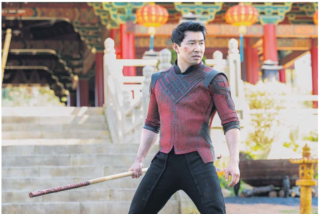
Shang-Chi y la leyenda de los Diez Anillos llegará a las salas en septiembre de este año.

Marvel Studios avanzó ayer imágenes y fechas de estreno de una decena de títulos. Tras sucesivos aplazamientos, Marvel reactiva su calendario con la esperada Viuda Negra de Scarlett Johansson, que se estrenará