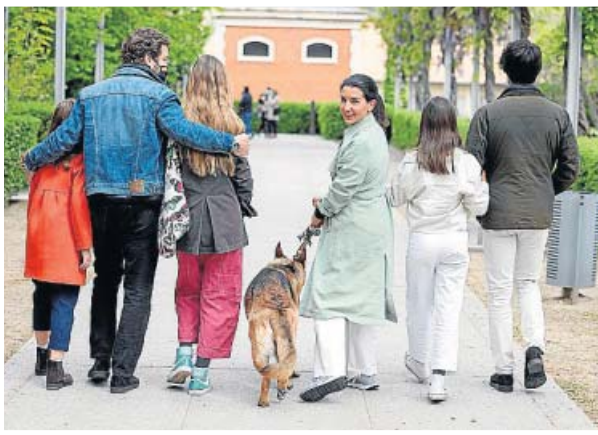
ROCÍO MONASTERIO (VOX)

Disfrutó de una terraza en la madrileña plaza Santa Ana junto a la presidenta del partido, Inés Arrimadas (d), y la vicealcaldesa de Madrid, Begoña Villacís. También aprovechó el día para «hacer deporte», algo que ha echado de menos en campaña.