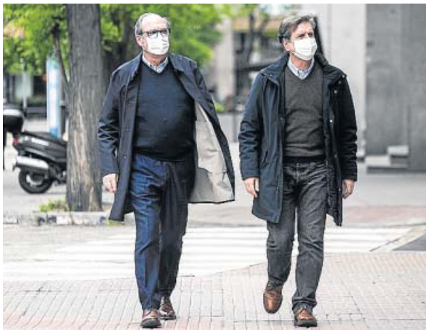
ÁNGEL GABILONDO (PSOE)

El candidato socialista dedicó la jornada de reflexión a «leer libros pendientes» y a ver a sus hijos y a su nieto Mauro, de tan solo tres meses. Por la mañana se acercó al hotel Princesa (en la foto, a su llegada), desde donde seguirá hoy el escrutinio.