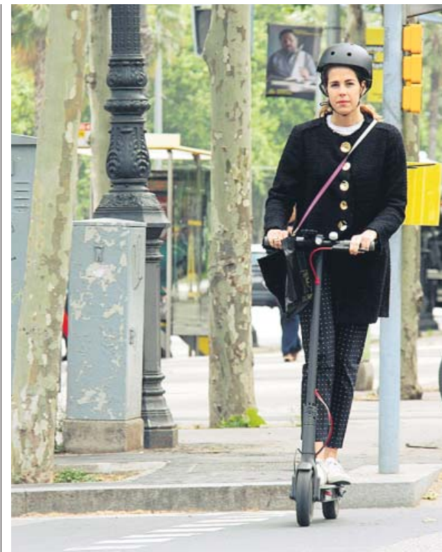
Una usuaria de patinete circula por la Diagonal.