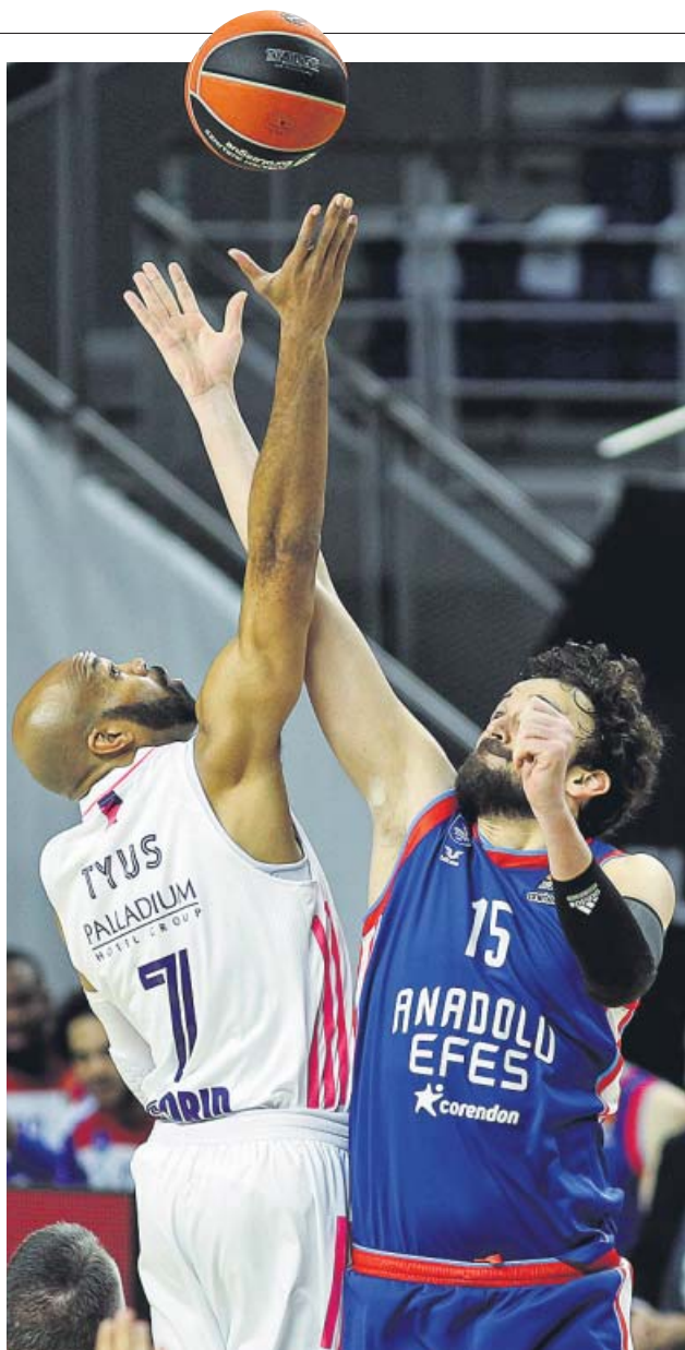
Real Madrid y Barcelona llegan a uno de los partidos más importantes de la temporada.