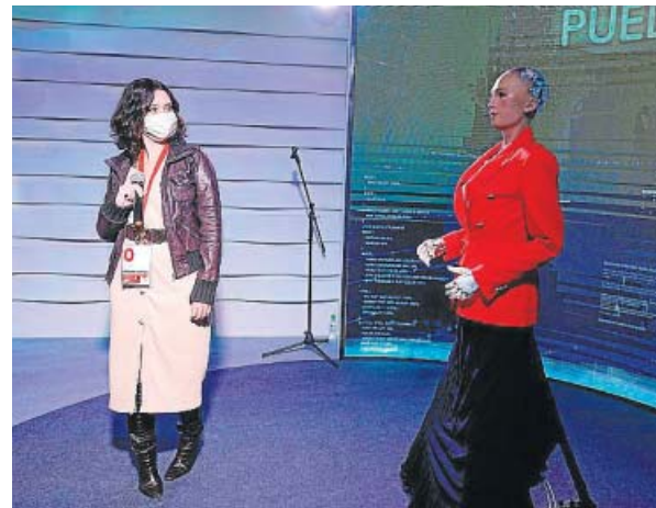
ISABEL DÍAZ AYUSO (PP)

El candidato socialista dedicó la jornada de reflexión a «leer libros pendientes» y a ver a sus hijos y a su nieto Mauro, de tan solo tres meses. Por la mañana se acercó al hotel Princesa (en la foto, a su llegada), desde donde seguirá hoy el escrutinio.