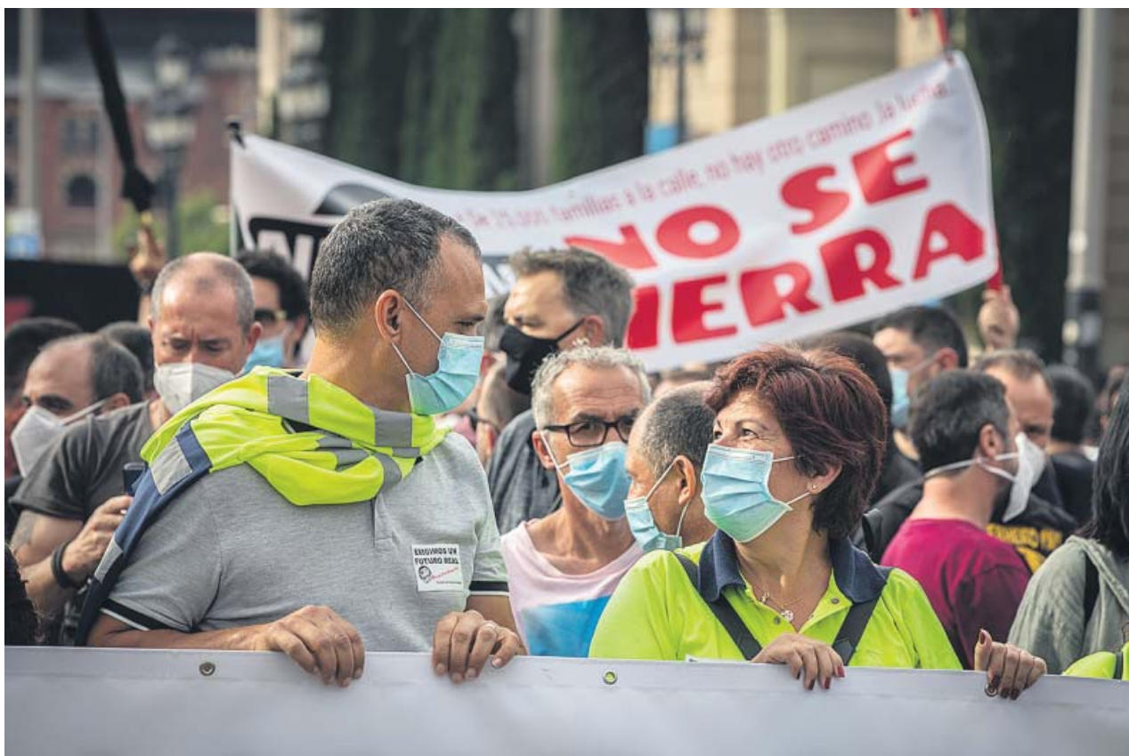
Trabajadores de Nissan durante una manifestación contra el cierre que tuvo lugar en Barcelona el pasado 11 de junio.

poc vol que «ningú» les pagui per ell, tampoc la Caixa de Solidaritat, a qui va agrair que li ho oferissin. Per a Torra, són multes imposades per la desatenció d'instruccions «completament irregulars i il·legítimes», que va recórrer i que s'emmarquen en un plet legal que la seva defensa portarà al Tribunal Europeu de Drets Humans d'Estrasburg. ● R.B.