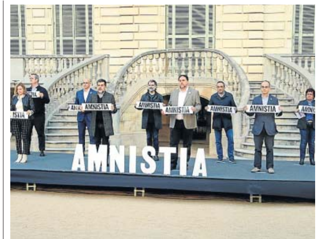
Imatge d'arxiu dels nou presos del procés l'1 de febrer.

Esta noticia y otras sobre Catalunya están disponibles en la web de 20minutos.es