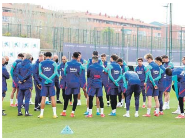
Entrenamiento ayer del Barça en su Ciudad Deportiva.

Tras el entrenamiento del pasado lunes, los jugadores blaugranas celebraron, junto a sus parejas, un asado en casa del astro argentino. Una reunión que generó un gran revuelo mediático al no respetarse los protocolos sanitarios para prevenir el contagio del coronavirus y que provocó que tanto la Generalitat como LaLiga estén estudiando lo sucedido.