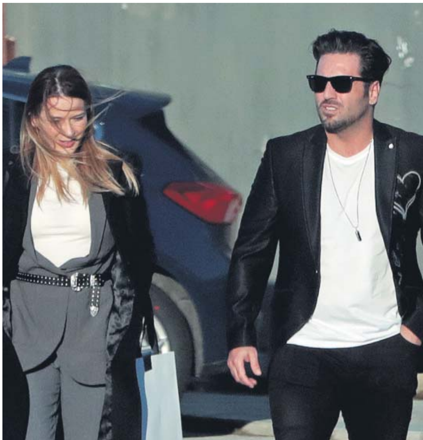
La bailarina Yana Olina y el cantante David Bustamante.