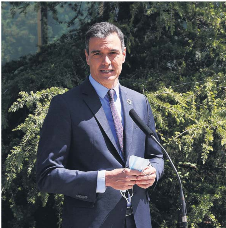
El presidente del Gobierno, Pedro Sánchez.

El apabullante triunfo de Isabel Díaz Ayuso en las elecciones madrileñas ha insuflado ánimos a la dirección nacional del PP, que ayer recrudesció su ofensiva contra el Gobierno central y retó al presidente Pedro Sánchez a convocar un debate sobre el estado de la nación, que no se celebra desde 2015. Menos de 24 horas después de que Ayuso otorgara a los populares un triunfo rotundo en la Comunidad de Madrid, dejando fuera de juego a un PSOE sorpassado por Más Madrid y provocando el abandono de la política de Pablo Iglesias, Pablo Casado celebró la reunificación del «centro y la derecha» y anticipó que la «ola» madrileña se convertirá en una «marea» estatal. Sánchez, por su parte, ale-