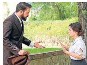
El secreto de Puente Viejo ANTENA 3. 17.30 H

La serie continúa con un Manuel Márquez desorientado; no acepta su nueva situación ni entiende las apariciones y consejos del 'enlace'. Además, el policía vive una difícil situación cuando acepta la invitación de Laura, su viuda, a cenar.