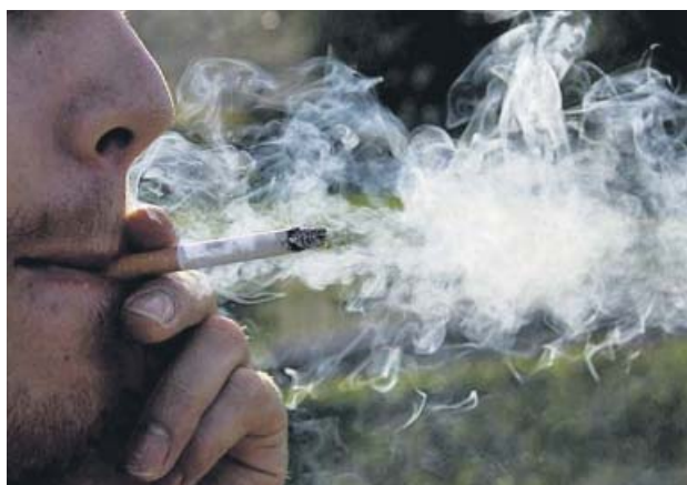
Un fumador consumiendo un cigarrillo.

El país recibe su segunda peor nota en consumo de tabaco —de lograr un 47 cae a un 25— y la tercera, en sobrepeso infantil. En este último aspecto se atisba cierta mejoría, ya que la califica-