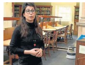
REPORTAJES Españoles en el mundo LA 1. 00.00 H

España - Eslovenia. Son las dos únicas selecciones que han ganado todos los partidos del campeonato y se verán las caras en semifinales. España busca su cuarto título, pero antes tendrá que ganar a Eslovenia.