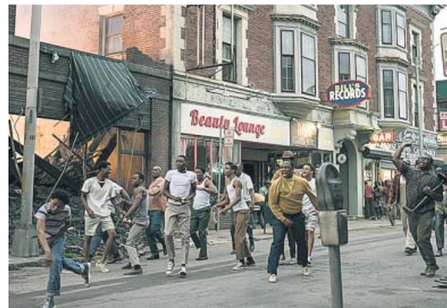
Una escena de la película Detroit .

Uno de sus compañeros de profesión, Antoine Fuqua, otro cineasta especializado en el terreno de la acción ( Día de entrenamiento , The Equalizer o el reciente remake de Los siete magníficos ), no ha tenido reparos en elegir La noche más oscura (2012) como una de sus películas preferidas de los últimos años: «Es un importante retrato de los hechos que condujeron a la muerte de Bin Laden en una narración que se sustenta en