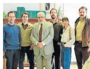
Grupo 2: Homicidios CUATRO. 22.30 H

Serie de ficción documental, un thriller policiaco con la realidad como guion. Crímenes pasionales, búsqueda de fugitivos, muertes violentas... Historias reales contadas por sus protagonistas reales: los inspectores del Grupo 2: Homicidios.