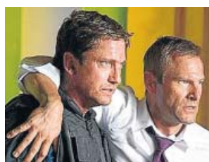
'Objetivo la Casa Blanca' TELECINCO. 22.30 H

Tras un accidente en el que solo consigue salvar la vida del presidente Asher (Aaron Eckhart), el agente Mike Banning (Gerard Butler) decide dejar su puesto. Pero un comando norcoreano ataca la Casa Blanca y Banning vuelve a la acción.