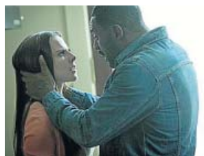
'Sin escrúpulos' NOVA. 22.40 H

En Barcelona, una de las ciudades portuarias de Europa más apreciadas por el tráfico de drogas y la prostitución, Gumer, una chica de 25 años, sale de la cárcel con la idea de formar junto a unas amigas una banda y montar negocios por su cuenta.