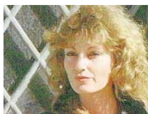
'Barcelona sur' LA 2. 22.00 H

Tras un accidente en el que solo consigue salvar la vida del presidente Asher (Aaron Eckhart), el agente Mike Banning (Gerard Butler) decide dejar su puesto. Pero un comando norcoreano ataca la Casa Blanca y Banning vuelve a la acción.