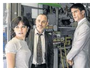
Estoy vivo LA 1. 22.45 H

Serie de ficción documental, un thriller policiaco con la realidad como guion. Crímenes pasionales, búsqueda de fugitivos, muertes violentas... Historias reales contadas por sus protagonistas reales: los inspectores del Grupo 2: Homicidios.