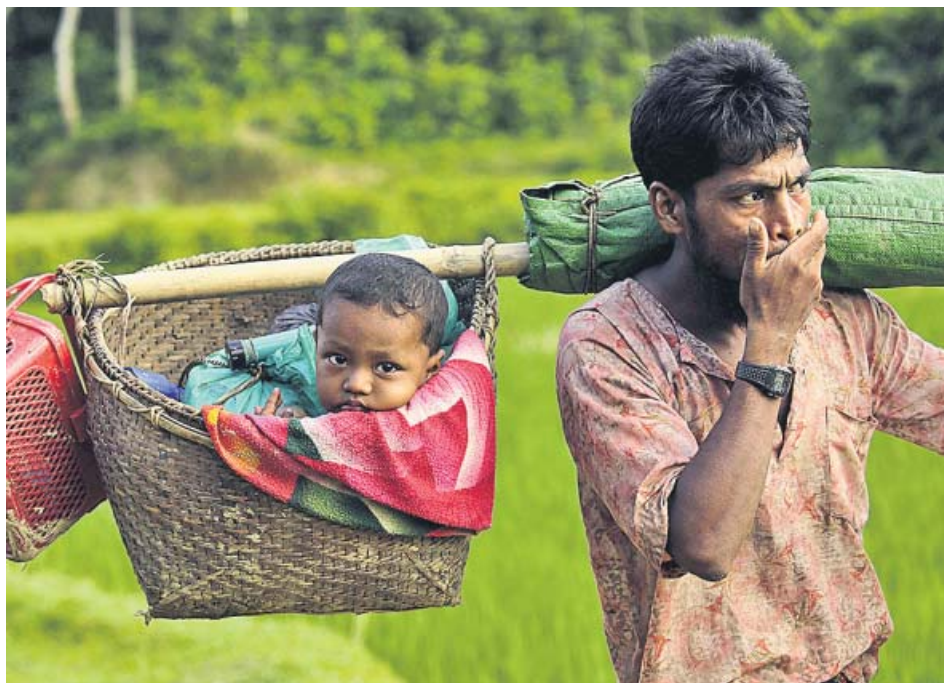
Un refugiado rohinyá porta a su hijo en un cesto a su llegada a Bangladés.

El bebé de la imagen es uno de los 379.000 rohinyás que en las últimas tres semanas han llegado a Bangladés huyendo de un «caso de limpieza étnica de libro», según denunció el Alto Comisionado de la ONU para los Derechos Humanos. El 23% de estos refugiados son menores de 5 años y huyen de Birmania para evitar ser masacrados. A pesar de ello, el Gobierno de Bangladés ya ha anunciado su intención de devolverse al país vecino. ● R.A.