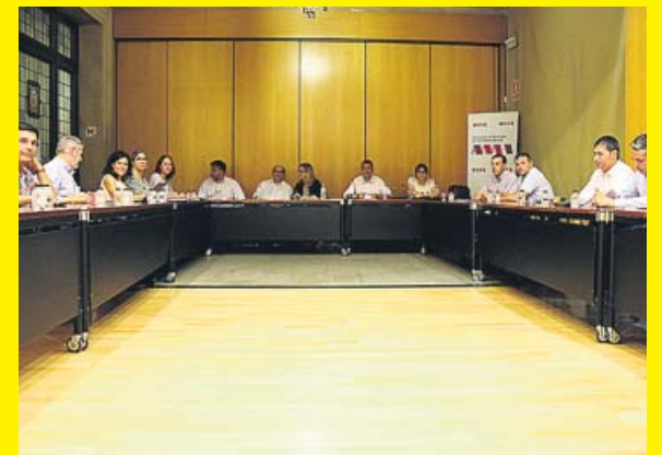
Una reunión de la ejecutiva de la AMI. ARCHIVO

FUENTE: ASSOCIACIÓ DE MUNICIPI PER LA INDEPENDÈNCIA / INSTITUT D'ESTADÍSTICA DE CATALUNYA