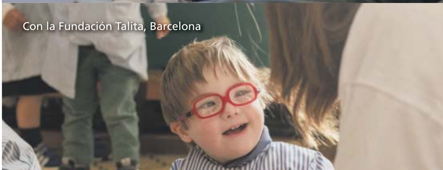
Con la Fundación Talita, Barcelona