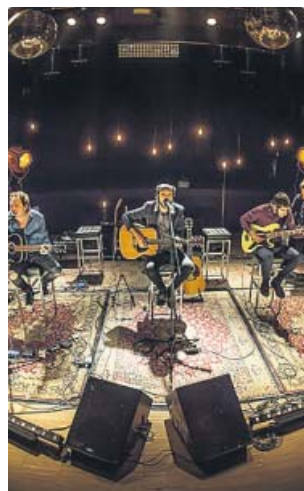
Una de las actuaciones del grupo madrileño Sidecars.