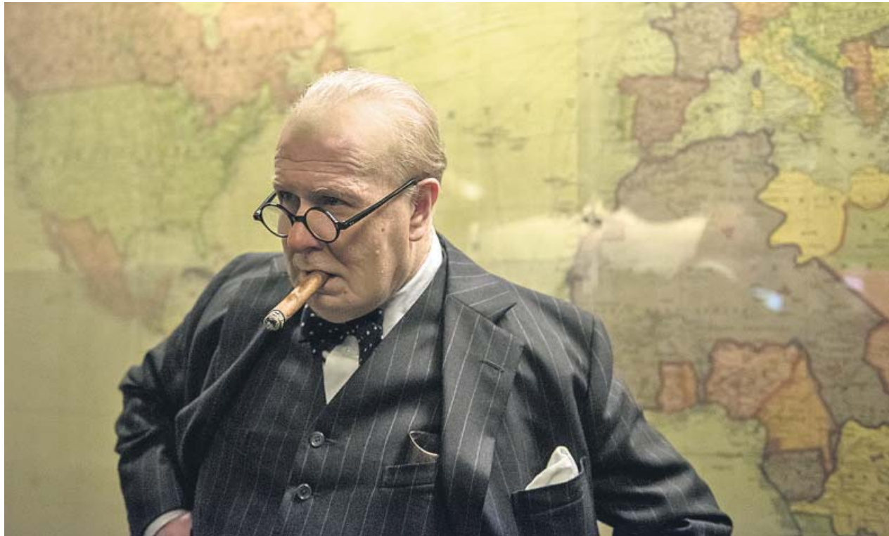
Gary Oldman, irreconocible en la piel de Winston Churchill.

ción —especialmente en una de las escenas finales, patriótica y conmovedora—, pero hay que tener en cuenta que esto no es un documental, ni siquiera una biopic y, ni mucho menos, otra película más sobre Winston Churchill, uno de los personajes más sobreexplotados en la ficción.