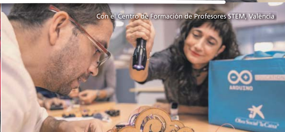
Con el Centro de Formación de Profesores STEM, València