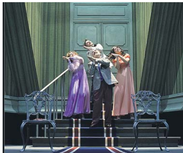
Uno de los momentos de la representación.

●●● El Lope de Vega continúa la próxima semana con su ciclo de jazz, esta vez de la mano del pianista y compositor francés Michel Legrand, compositor de la música de más de 200 películas y tres veces ganador del Óscar de la Academia de Hollywood (martes 16, a las 20.30 horas, entrada general 25 euros).