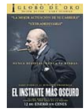
2017. Director: Joe Wright Reperto: Gary Oldman, Lily James, Ben Mendelsohn

La composición de algunos planos tiene una carga artís-