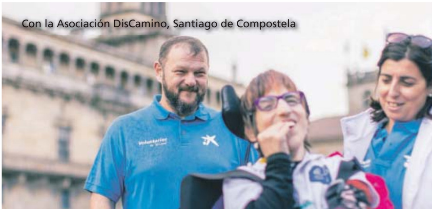
Con la Asociación DisCamino, Santiago de Compostela