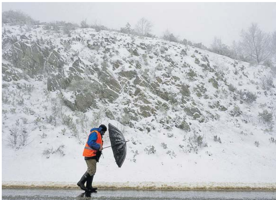
Un hombre intentaba cubrirse frente a la nieve, ayer, en O Cebreiro (Lugo).

Un varón de 22 años fue hallado muerto ayer, sobre las 8.11 horas de la mañana, en un autobús de Guadalajara. Al cierre de esta edición (23.00h) aún se desconocían las causas que pudieron desencadenar su muerte.