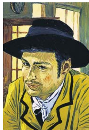
Uno de los 65.000 fotogramas de Loving Vincent , al óleo.

dros de Van Gogh, en una producción inicialmente rodada con actores, y descubre la enigmática figura del pintor holandés a través de las cartas que es-