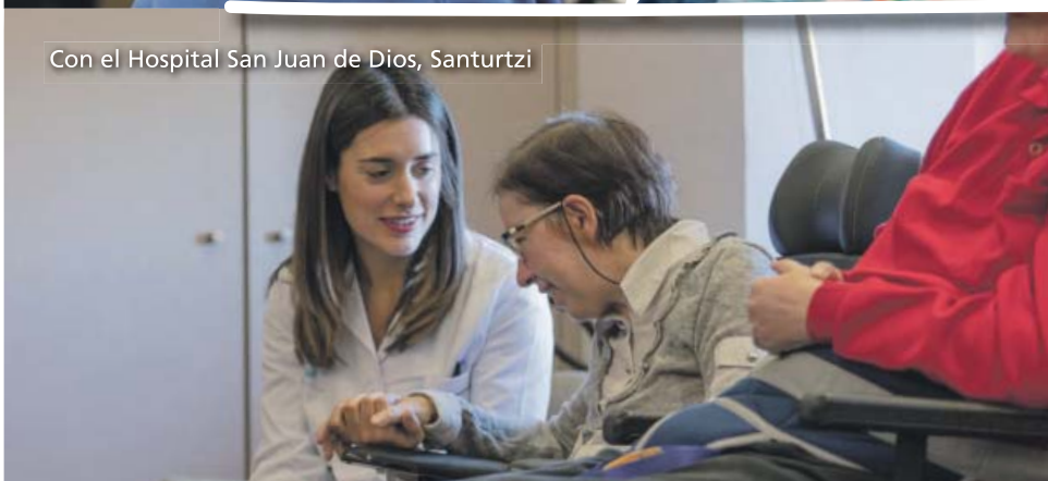
Con el Hospital San Juan de Dios, Santurtzi