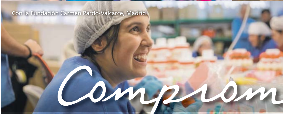
Con la Fundación Carmen Pardo-Valcarce, Madrid