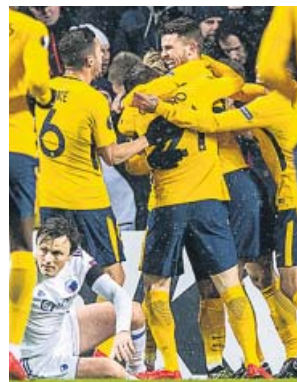
Los jugadores del Atlético celebran un gol.