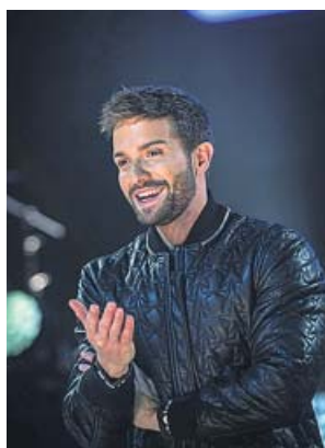
Alborán, ayer, presentando su gira Prometo.