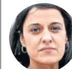
ANNA GABRIEL Dirigente de la CUP

«Sé que ya no podré volver y es un gran giro en mi vida. Pero al haber partido contribuyo a la acción democrática»