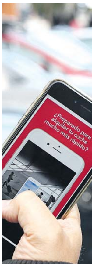
Muchas alternativas funcionan mediante 'apps'.