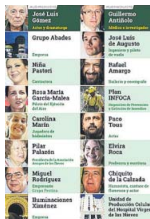
Todos los condecorados con las Medallas de este año.