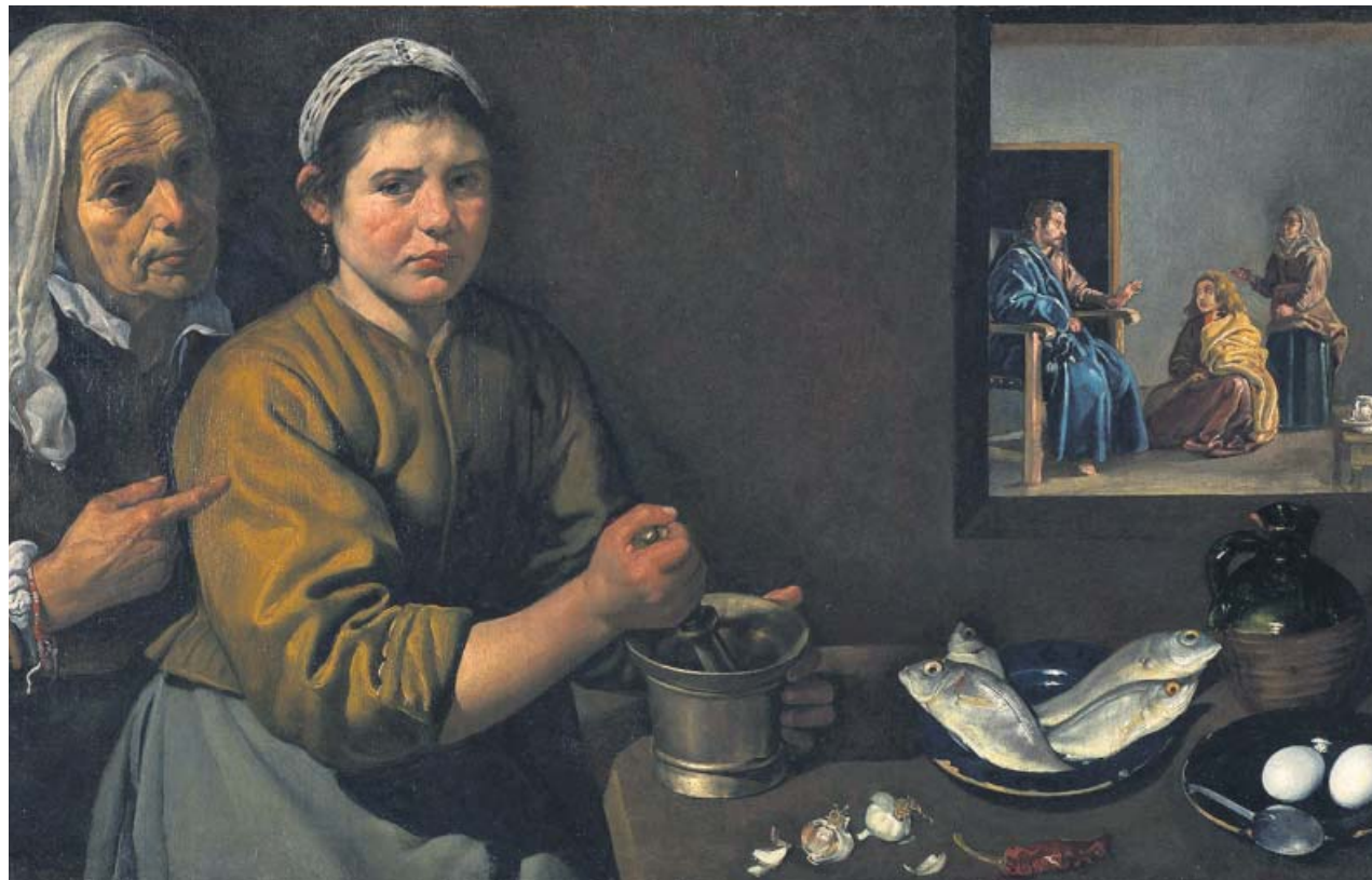
La obra de Velázquez Cristo en casa de Marta y María (1618) forma parte de la exposición Spanish still life.

¿Quién se ha quedado con el muñeco que hace de bebé? Creo que era alquilado. Era un muñeco hiperrealista y un poco creepy [horripilante]. ●