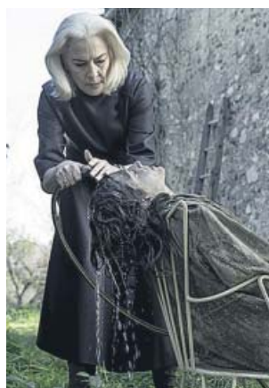
Madre e hija se reencuentran tras años alejadas.

Anabel es una mujer que abandonó a su hija cuando era una niña de 8 años. Treinta y cinco después, Chiara busca a su madre para presentarle una extraña petición: que pasen diez días juntas. Anabel se embarca en ese viaje con la esperanza de tener una oportunidad para recuperar el tiempo perdido, pero no sabe que Chiara tiene un propósito oculto y que, en cuanto lo descubra, tendrá que enfrentarse a la decisión más importante de su vida, tras la que nunca volverá a ser la misma persona. La crítica ya califica este drama escrito y dirigido por Ramón