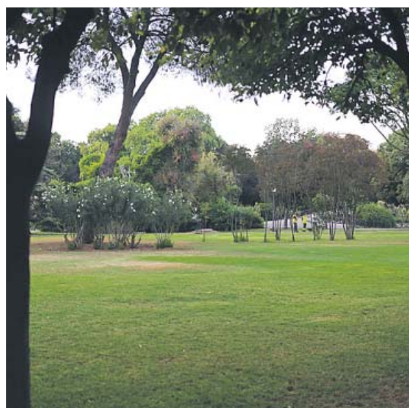
Parque de los Príncipes, en Los Remedios. AYTO. SEVILLA

Esta nueva fase contempla la reforma del interior del antiguo edificio de aseos, de forma que se habilite uno para hombres, otro para mujeres, otro para personas con movilidad reducida y otro para los trabajadores del parque, a los que se dotará también de un espacio de comedor. Asimismo, se llevarán a cabo tres caminos de albero para un correcto tránsito, que evite la utilización de las praderas.