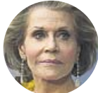
JANE FONDA Actriz

«Creo que ‘Cincuenta sombras de Grey’ no es un libro muy bueno, pero en EE UU estimuló a muchas mujeres. Eso es bueno»