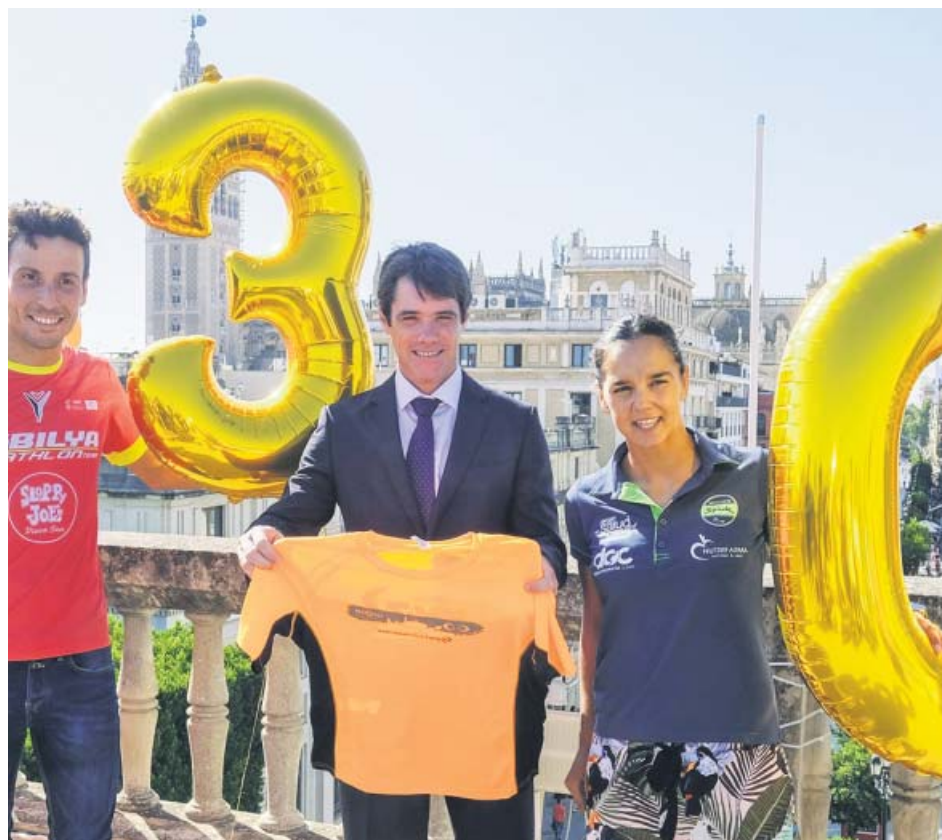
Presentación de la Carrera Nocturna del Guadalquivir, ayer en Sevilla.

El Consejo de Gobierno dio ayer luz verde a la elaboración del III Plan de Acción Integral para las Personas con Discapacidad, así como otro específico dirigido a las mujeres. El colectivo está integrado actualmente por unas 700.000 personas en la comunidad (el 10% de la población total). De ellos, el 61% son mujeres.