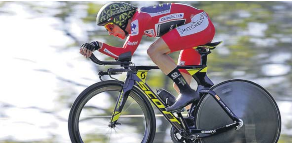
El británico Simon Yates durante la contrarreloj en tierras cántabras.