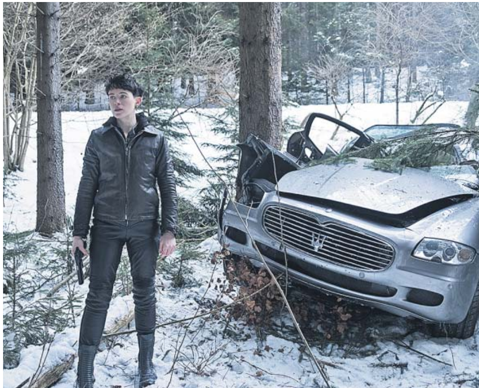
La actriz Claire Foy pasa de ser Elizabeth ( The Crown) a Lisbeth Salander.

Primero, porque quería hacer una película a escala más grande, y segundo, por la propia Lisbeth Salander, la antiheroína de los libros. Su Mi-