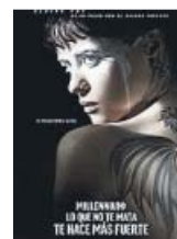
2018. Director Fede Álvarez Reperto Claire Foy, Sverrir Gudnason, Vicky Krieps

Pionera del #MeToo antes de que el movimiento existiera, heroína punk y mujer hacker —¡el no va más!—, este personaje creado por Larsson en 2005 se había ido merendando a su coprotagonista Mikael Blomkvist en las sucesivas adaptaciones de las novelas. Hay que alabarle por