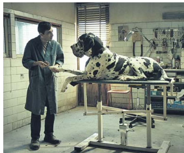
Marcello (M. Fonte) en su peluquería canina. KARMA

Además de recordar a otros trabajos de Garrone como El taxidermista , la insana relación entre los protagonistas trae ecos de La strada : durante la mayor parte del metraje vemos cómo un agente de la brutalidad más ciega somete a un individuo más débil que él. Pese a ello, a Garrone le falta la indulgencia felliniana para con las víctimas. Sin esconder los rasgos redentores del peluquero, la cinta señala cómo este es culpable de avivar los vicios de su torturador.