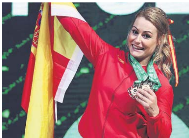
Lydia Valentín con sus medallas mundialistas.