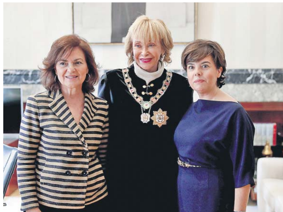
Carmen Calvo, María Teresa Fernández de la Vega y Soraya Sáenz de Santamaría.

La actual vicepresidenta del Gobierno, Carmen Calvo, coincidió ayer con sus dos antecesoras –María Teresa Fernández de la Vega y Soraya Sáenz de Santamaría– en la toma de posesión de los nuevos miembros del Consejo de Estado, órgano que preside precisamente De la Vega y al que ayer se incorporó Santamaría. La número dos del Ejecutivo de Rajoy apeló a cuidar con «pasión» las instituciones como cimientos de la democracia. Además, fue elogiada por De la Vega por su «excepcional» bagaje profesional. ●