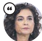
MARÍA JESÚS MONTERO Ministra de Hacienda

«Si quieren quitar el impuesto tienen que dar alternativas o podemos creer que quieren limitar el Estado del bienestar»