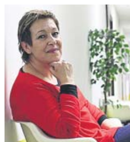
Helena Superviviente de cáncer de mama

«Ahora estoy estupenda, igual que antes. Durante el tratamiento, la gente desde fuera lo veía peor. Me trataban de otra manera y yo no quería dramas. No es tan terrible. Lo único que eché de menos fue tener a otras personas que estuvieran pasando por lo mismo».