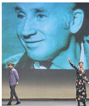
Un momento en el Teatro Caja Granada.

Enamórate de Lope y Una noche blanca con los clásicos se interpretaron ayer en la sede del Teatro Caja Granada, dentro del programa de teatro social educativo que la Compañía de Blanca Marsillach lleva desarrollando desde hace más de diez años como homenaje a su padre, Adolfo Marsillach. Su objetivo: acercar el Siglo de Oro a estudiantes de secundaria y bachillerato de una forma diferente: dándoles la oportunidad de subir ellos mismos al escenario. ●