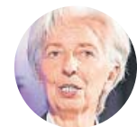
CHRISTINE LAGARDE Directora gerente del FMI

«Este año, prevemos que el 70% de la economía mundial experimente una desaceleración»