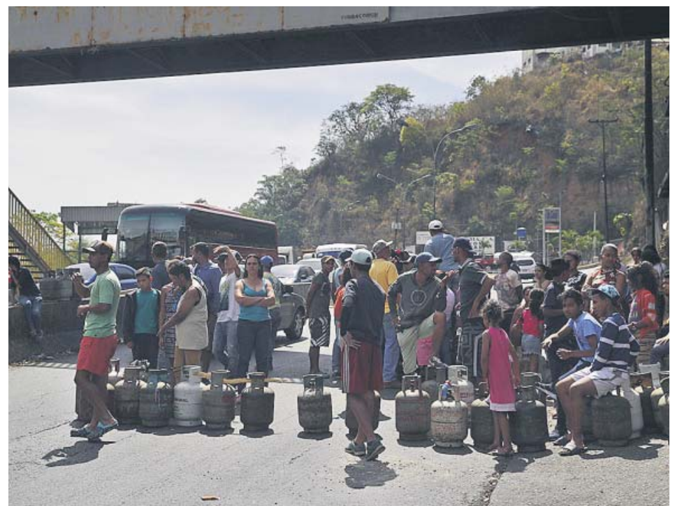
Varios caraqueños protestan contra la falta de gas con sus bombonas vacías

Se puede realizar mediante adeudo o cargo en cuenta o mediante domiciliación bancaria, en cualquiera de las entidades colaboradoras autorizadas (bancos, cajas de ahorro o cooperativas de crédito) situadas en territorio español, aunque se efectúe fuera de plazo. ●