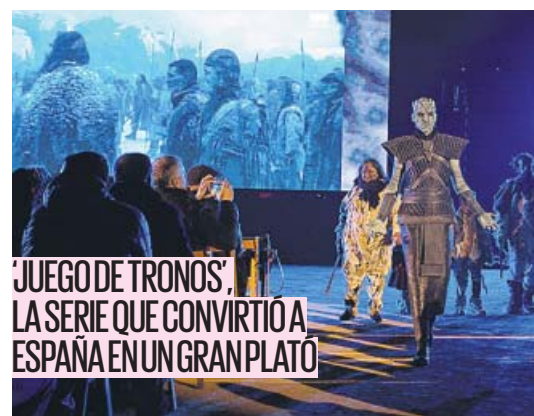
'JUEGO DE TRONOS', LA SERIE QUE CONVIRTIÓ A ESPAÑA EN UN GRAN PLATO

A menos de dos semanas para el inicio de su última temporada, localidades españolas escenario de la serie, como Osuna (Sevilla), recrean alguna de sus escenas más inolvidables. PÁGINA 14