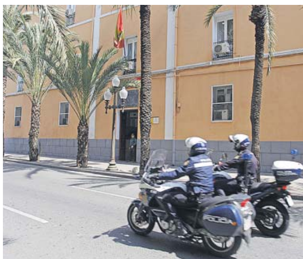
Agentes de la Guardia Civil en la Comandancia de Alicante.

ella como su compañero sentimental, ambos de origen húngaro, aterrizaran en la ciudad alicantina, tal y como indicaban los billetes de avión que se encontraron en el domicilio y que los sitúan sobre las 18.00 en el aeropuerto. Más tarde, se dirigieron a un apartamento en la urbanización Pueblo Bravo del término municipal de Ro-