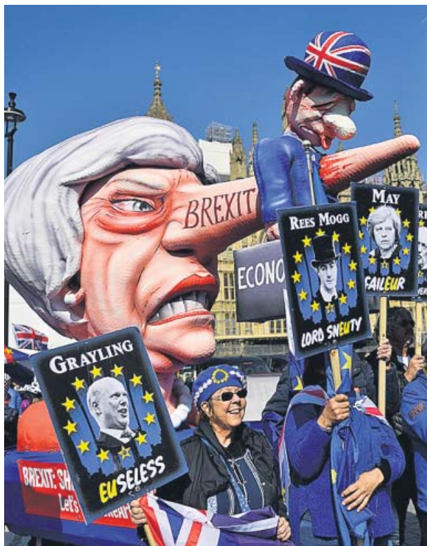
Manifestantes proeuropeos caricaturizan a May.