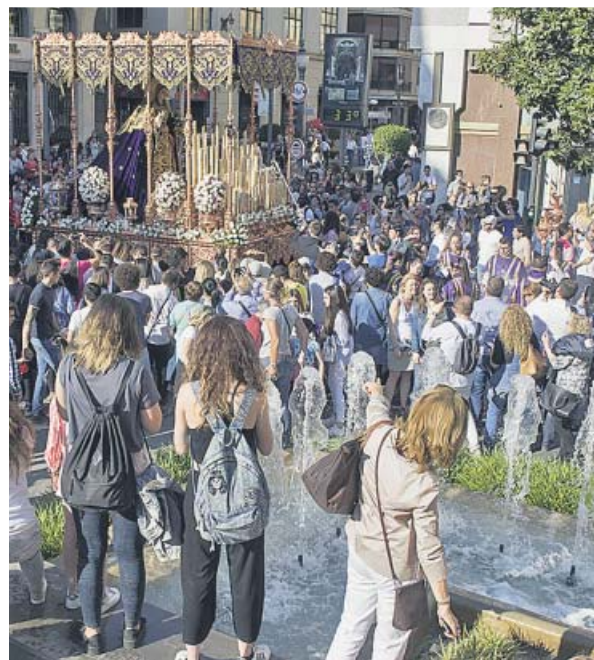
Gente viendo una cofradía en Granada.