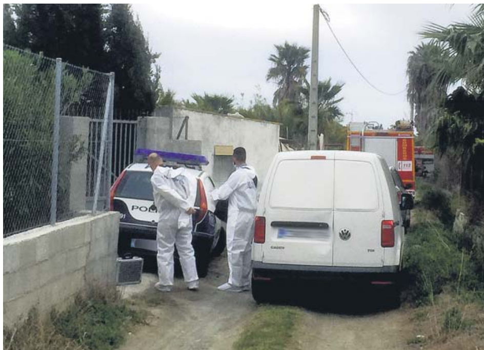
Personal del equipo de investigación examina la zona donde se encontró el cuerpo.

La Policía Nacional investiga la aparición ayer del cuerpo sin vida de un hombre en avanzado estado de descomposición en un cortijo situado en la zona sur de Motril (Granada). El fuerte olor que despertó el cadáver llamó la atención de un agricultor que alertó a la Policía, según indicaron fuentes policiales. Habrá que esperar al dictamen del Instituto Anatómico forense para conocer las causas de la muerte. ● R.A.