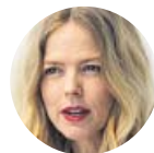
CHRISTINA ROSENVINGE Premio Nacional de Música, sobre sus memorias Debut

«Muchas mujeres llegamos a la plenitud artística a los 50, que es cuando los niños han crecido»