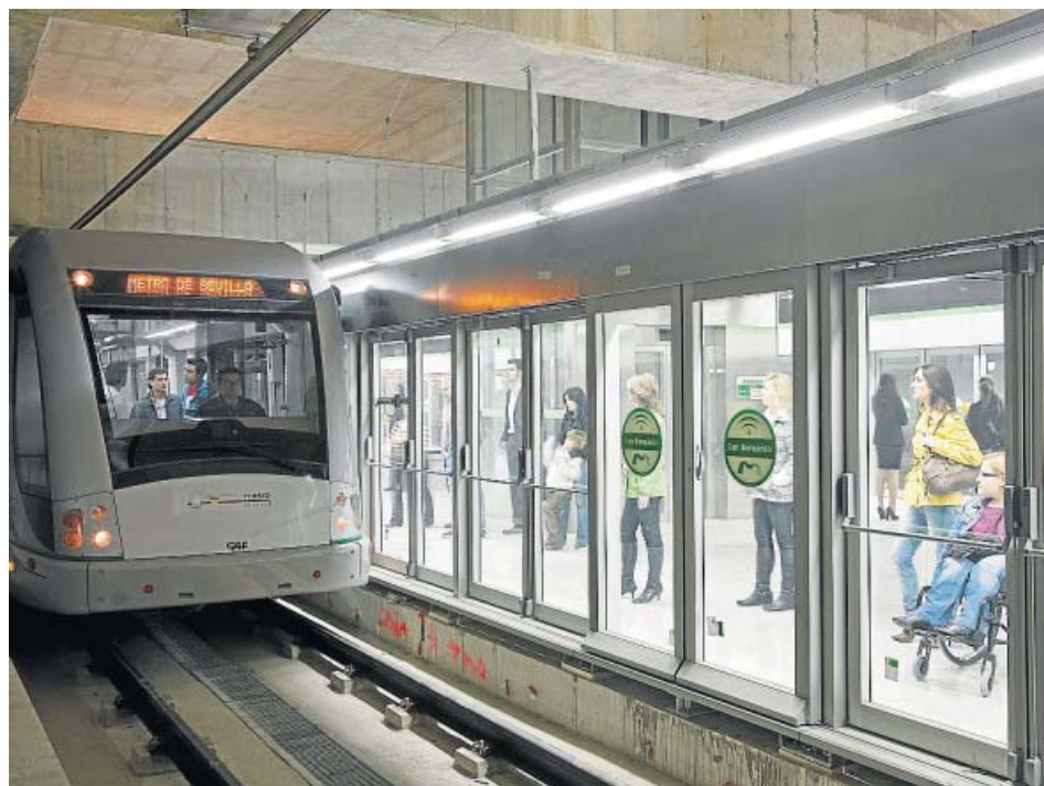
Un tren llega a la estación de San Bernardo del metro de Sevilla.

El metro de Sevilla cumplió ayer su décimo aniversario con más de 145,7 millones de viajeros transportados. La fecha se vio empañada por la convocatoria de huelga indefinida promovida por la plantilla a partir del 13 de abril, Sábado de Pasión y que por el momento sigue adelante, después de que la reunión de ayer finalizara «sin acuerdo». Mañana se celebrará otra reunión para intentar alcanzar un acuerdo respecto a los servicios mínimos. ● R. A.