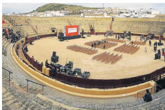
El coso de Osuna, preparado para la proyección. I. A.