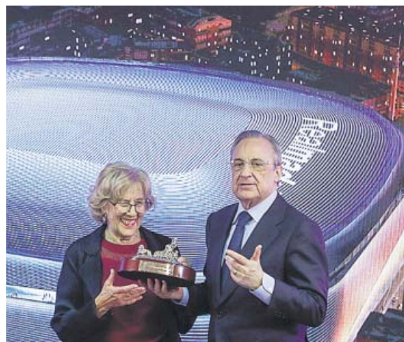
Florentino Pérez y Carmena con el nuevo Bernabéu detrás.

espectadores podrá albergar el nuevo estadio. Los doce metros de altura añadidos harán que quepan 3.000 más.