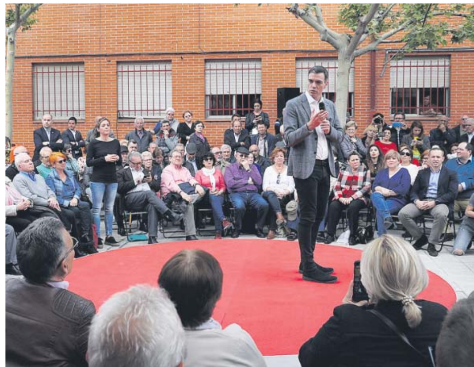
Sánchez prometió ayer blindar las pensiones en la Constitución en un acto con mayores en Leganés.

Sigue en nuestra web la información de todos los actos de campaña de los diferentes partidos políticos