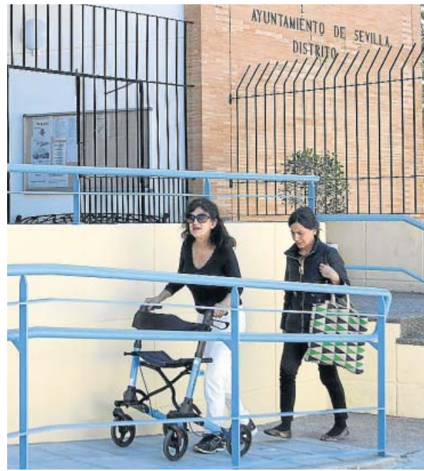
Rampa adaptada en la sede del Distrito San Pablo.

Fuera de la sede del Distrito San Pablo-Santa Justa, en la calle Jerusalén, se ha acometido la reforma de los accesos, incluido el porche, eliminando los desniveles que dificultaban el tránsito de las personas con movilidad reducida. Así, se ha generado un único nivel, instalado una estructura fija de sombra y plantado árboles de sombra, al tiempo que se han redistribuido los apar-