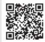
EMBUTIDOS CASTRO Y GONZÁLEZ