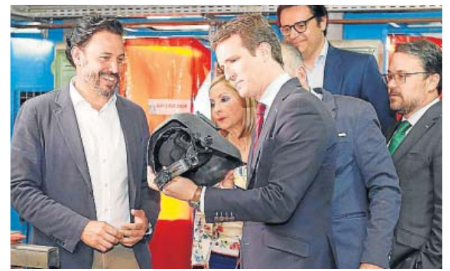
Casado, durante su visita de ayer a Gran Canaria.

sición socialista. El presidente del Partido Popular considera que Sánchez tiene que «conten- tar a sus socios» y por eso «calle ante los escraches a los constitucionales». «Como mucho ponen un tuit», terminó. ●