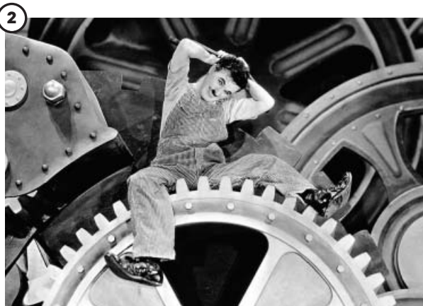
2 'Tiempos modernos' (1936)

El primer largometraje completamente hablado de Chaplin fue esta sátira del fascismo. Él mismo interpretó a un barbero judío que es confundido con un líder de un parecido, nada casual, con Hitler. Memorable aún es su discurso final. Tuvo numerosos problemas con la censura. En España no se estrenaría en cines hasta más de tres décadas después, en 1976.