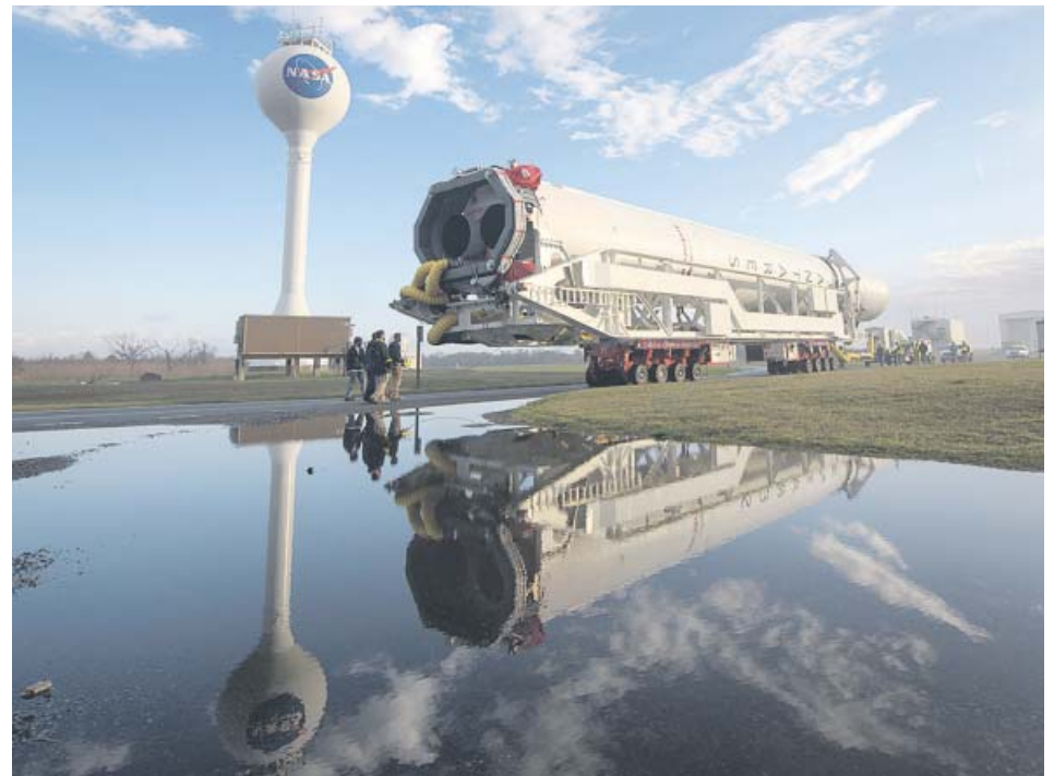
El cohete Northrop Grumman Antares mientras es desplegado.

Y, en realidad, podría participar, porque el formato tiene una versión VIP, Ven a cenar conmigo, gourmet edition , en la que los comensales y anfitriones son famosos. Próximamente se emitirán las cenas que compartieron Miriam Saavedra, Carmen Lomana, Pocholo Martínez Bordiú y José Antonio Canales Rivera por un lado, y Lucía Bosé, Pablo Carbonell, Cósima Ramírez y Antonio David por otro. ●