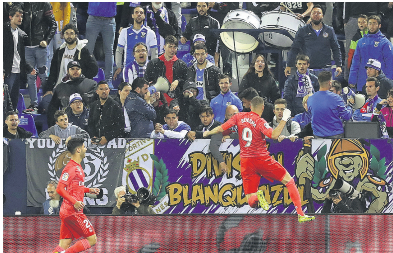
Karim Benzema celebra, delante de Marco Asensio, su tanto en Butarque.