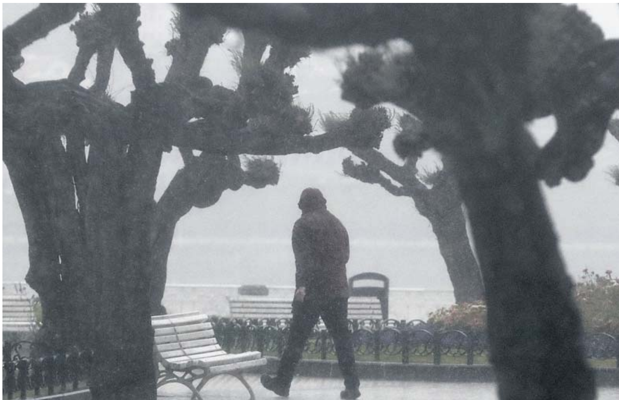
El brusco cambio de tiempo pilló desprevenidos ayer a quienes eligieron San Sebastián, en la imagen, para sus vacaciones.

Cuando la defensa de Serrano presentó el informe que involucraba a la piqueta, el fiscal del caso remitió al Instituto Médico Forense el escrito para que investigase si el uso de la misma pudo influir en la muerte del pequeño. Ahora, después de casi tres meses desde que un furgón funerario se llevase la madrugada del 26 de enero el cuerpo de Julen de Totalán, se sabe que no tuvo nada que ver. ●