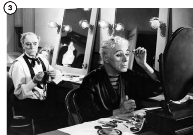
3 'Candilejas' (1952)

En esta crítica al capitalismo usó efectos de sonido y se pudo escuchar por primera vez su voz cantando. En la escena más famosa le engullen los engranajes de una cadena de montaje.