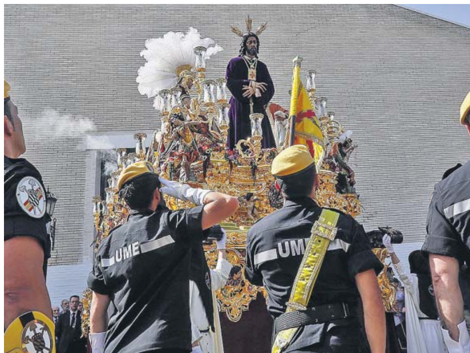
Militares de la UME a la salida de la hermandad del Polígono de San Pablo.

El servicio de emergencias 112 Andalucía registró durante el primer fin de semana de la Semana Santa —desde las 15.00 h del Viernes de Dolores hasta las 00.00 h del Lunes Santo— un total de 4.872 incidencias, un 12,5% más que en el mismo periodo del pasado año. La mayor parte de ellas fueron asistencia sanitarias (2.294) y temas relacionados con la seguridad (974). Por provincias, Sevilla, Málaga, Cádiz y Granada coparon la mayoría de los casos. ● R. A.