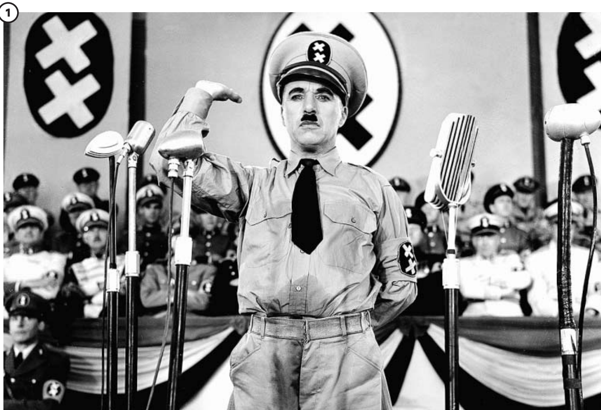
1 'El gran dictador' (1940)

El primer largometraje completamente hablado de Chaplin fue esta sátira del fascismo. Él mismo interpretó a un barbero judío que es confundido con un líder de un parecido, nada casual, con Hitler. Memorable aún es su discurso final. Tuvo numerosos problemas con la censura. En España no se estrenaría en cines hasta más de tres décadas después, en 1976.