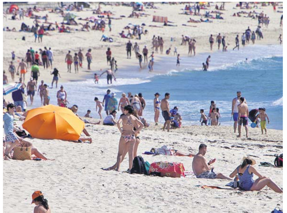
La playa de Samil (Vigo), ayer, repleta de gente por las buenas temperaturas.

Y es que la Administración ya intervino anteriormente con esta mujer, a la que le quitaron la custodia de sus otros dos hijos por considerar que estos se encontraban en situación de desamparo. Al parecer, fue examinada por el médico forense y constataron que tiene una Inteligencia Límite, es decir, que tiene ciertas limitaciones en su funcionamiento mental y en el uso de habilidades tales como la comunicación, el cuidado personal, y las destrezas sociales. ●