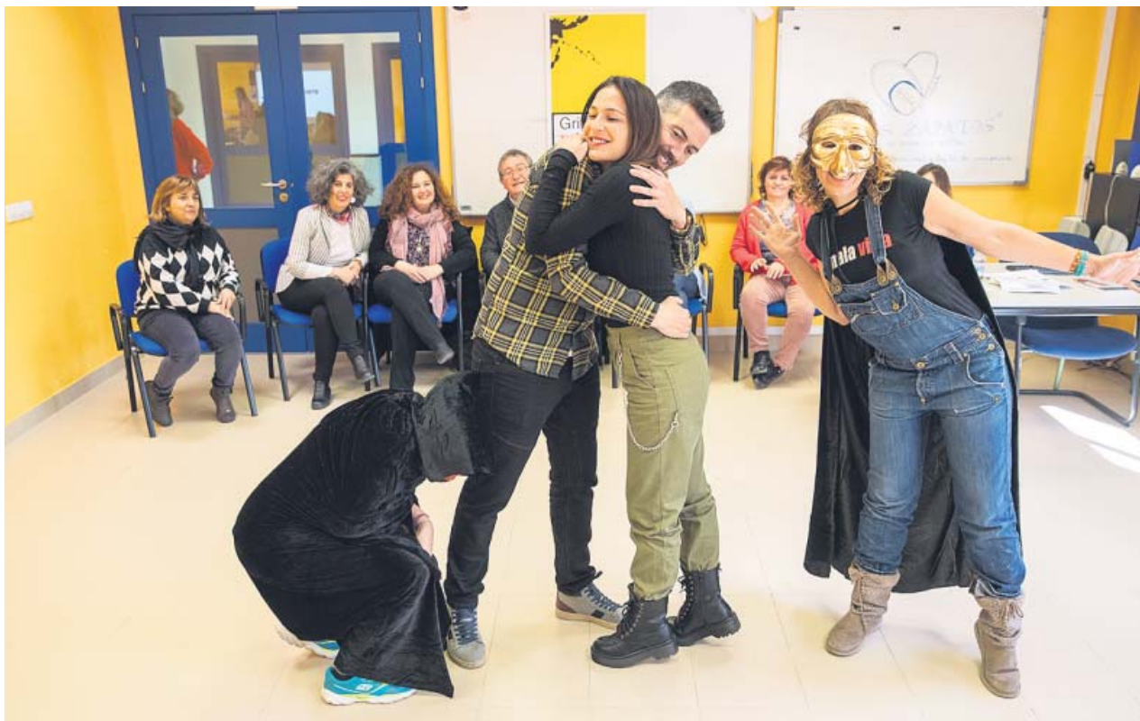
Varios maestros representando, con capas y máscaras, las emociones que pueden llegar a «secuestrarnos». ELENA BUENAVISTA

El programa pionero 'En sus zapatos' quiere luchar contra el 'bullying' utilizando técnicas teatrales para que los alumnos se pongan en el lugar de sus compañeros