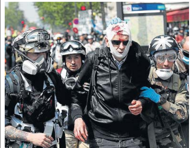
Un ciudadano, herido durante la manifestación de París.

Consulta todo lo que sucede en España y el resto del mundo en nuestra web 20minutos.es