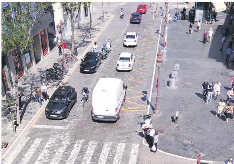
Los andaluces podrán acreditar hasta 19 categorías profesionales.

La Consejería de Educación y Deporte ha convocado para este año un total de 7.900 plazas a través de Acredita Andalucía, procedimiento que lleva a cabo el Instituto Andaluz de Cualificaciones Profesionales. La primera fase de esta convocatoria incluye 4.600 plazas para un total de 19 categorías profesionales, de sectores tan variados como el de energía y aguas, informática o industrias alimentarias. La segunda fase, aún sin fechas específicas, contemplará las 3.300 plazas restantes.