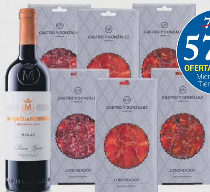
SELECCIÓN CASTRO Y GONZÁLEZ

72'18€ 57'81€ I.V.A. INCL. OFERTA EXCLUSIVA Miembros Club Tienda Gastro