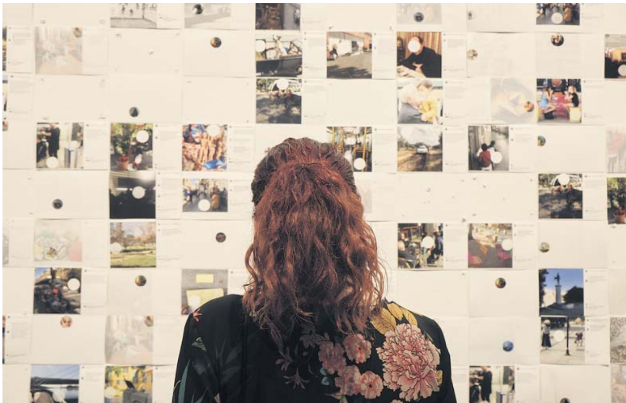
Parte del mural de fotografías que forma parte de la exposición 'Miradas sobre Sevilla'.

experiencia laboral mínima de dos años con al menos 1.200 horas trabajadas (tres años y 2.000 horas en categorías superiores) en los diez años anteriores a la convocatoria. Y en los casos en que existe formación no reglada, demostrar que se han cursado 200 o 300 horas como mínimo. La selección de los aspirantes se realizará en función de la puntuación que obtengan según los años de experiencia u horas de formación demostradas. ●