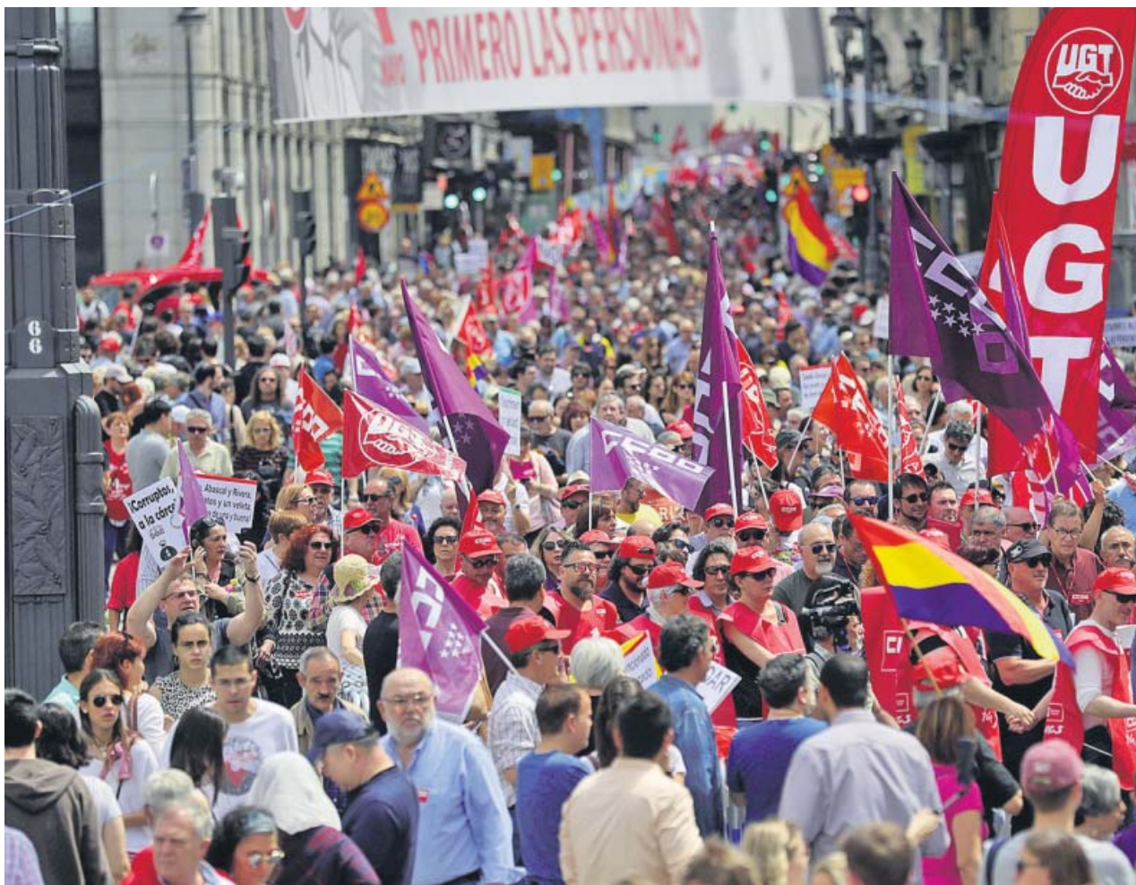
La manifestación en Madrid por el Primero de Mayo tuvo como lema «Primero las personas».