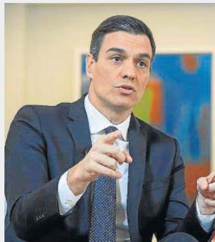
Pedro Sánchez Presidente del Gobierno en funciones

Con 123 escaños y sin una mayoría absoluta de PP, Cs y Vox, su intención es seguir gobernando en solitario. Rechaza el Gobierno de coalición que le exige Podemos y desea una abstención de PP y Cs que dé vía libre a su investidura por mayoría simple.