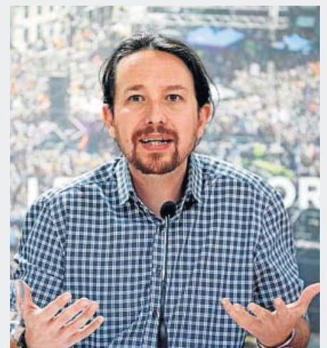
Pablo Iglesias Secretario general de Unidas Podemos

Para el mundo empresarial y financiero, Cs habría sido el socio más adecuado del Gobierno de Sánchez. Pero el PSOE no quiere y tampoco Rivera, que ha visto en los malos resultados del PP, con solo nueve escaños por encima de Cs, la oportunidad de liderar el centroderecha.