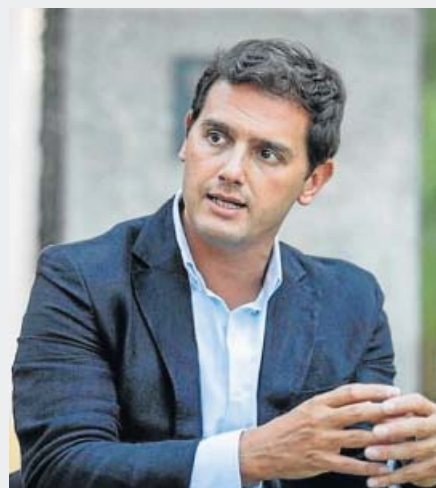
Albert Rivera Presidente de Ciudadanos

El 28-A se saldó para el PP con el peor resultado de su historia. Con 66 escaños, Casado empieza a estar cuestionado en su partido pero no piensa ponérselo fácil a Sánchez. Será oposición y le emplaza a no volver a apoyarse en los independentistas.