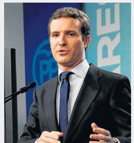
Pablo Casado Presidente del PP

Con 123 escaños y sin una mayoría absoluta de PP, Cs y Vox, su intención es seguir gobernando en solitario. Rechaza el Gobierno de coalición que le exige Podemos y desea una abstención de PP y Cs que dé vía libre a su investidura por mayoría simple.