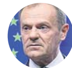
DONALD TUSK Presidente del Consejo Europeo, sobre Polonia

«Entrar en la Unión Europea significó el verdadero final de la Segunda Guerra Mundial»