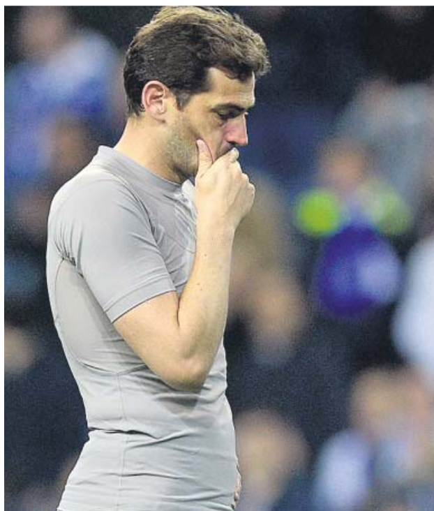
Iker Casillas, tras un partido con el Oporto.

Para el portero del Oporto se ha acabado la temporada, tendrá que estar entre tres o cuatro meses, como mínimo, fuera de los terrenos de juego. Es decir, no volverá hasta el comienzo de la próxima campaña, y eso en el mejor de los casos. «La rehabilitación cardíaca suele empezar aproximadamente a un mes del infarto y dura unas ocho semanas. Luego hay que llevar un tratamiento médico