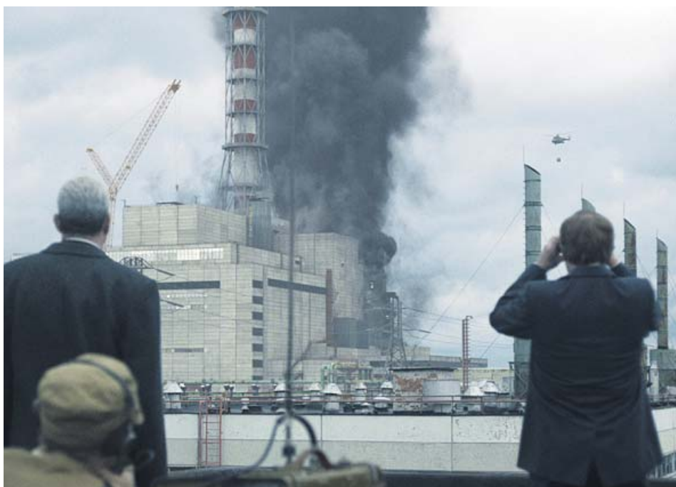
Jared Harris y Emily Watson dan vida a los científicos que contuvieron el desastre. HBO